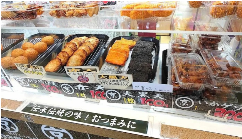
揚げもの茶屋 住京 comentario 1