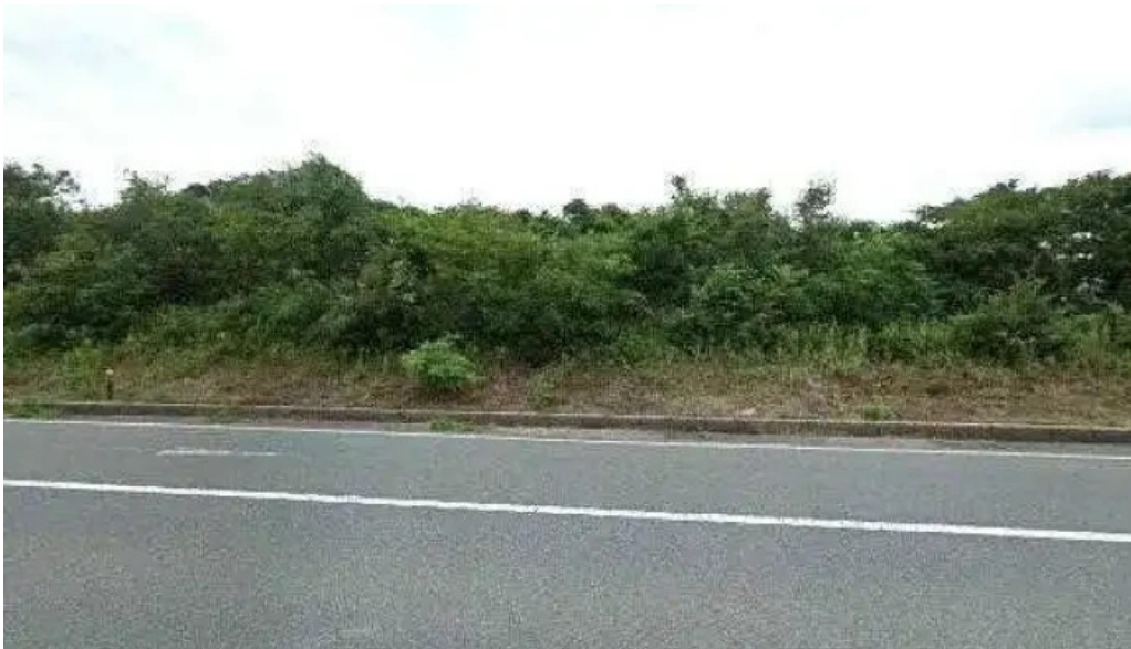
揚げもの茶屋 住京 ストリートビューと 360 ビュー