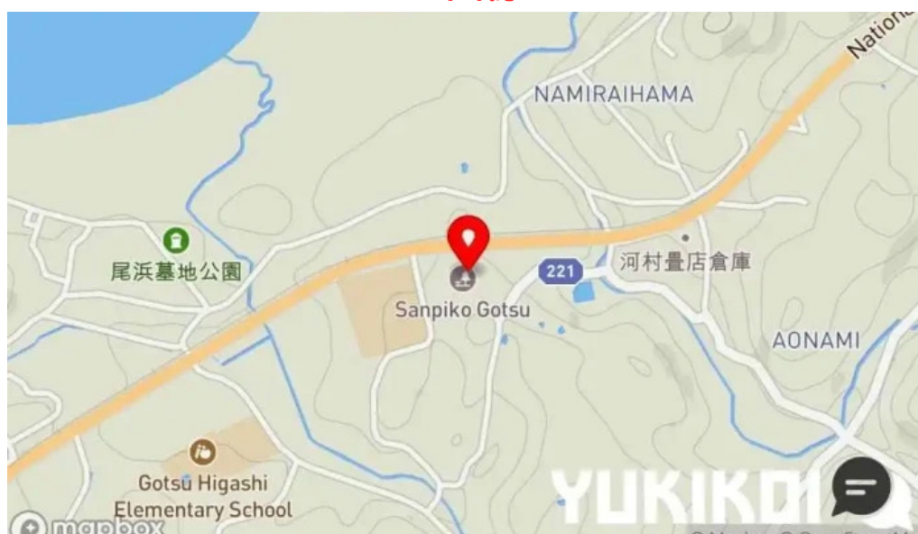
揚げもの茶屋 住京地図