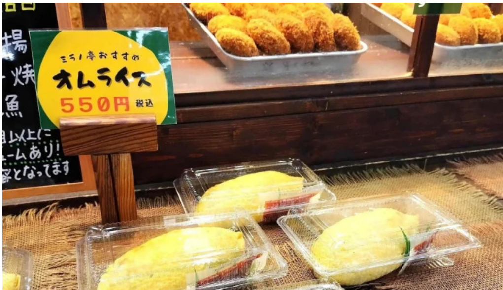
揚げもの茶屋 住京 comentario 3