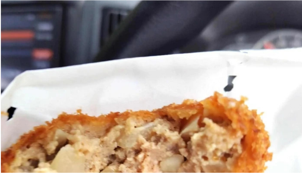
揚げもの茶屋 住京 comentario 2