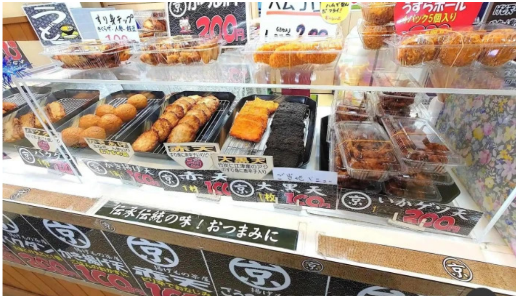
揚げもの茶屋 住京 すべて