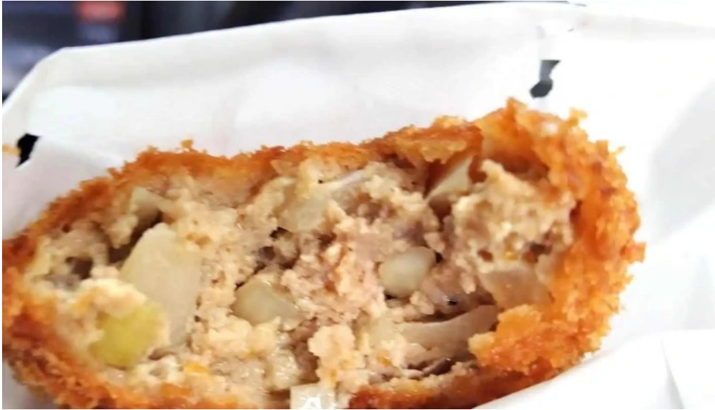
揚げもの茶屋 住京 料理飲み物