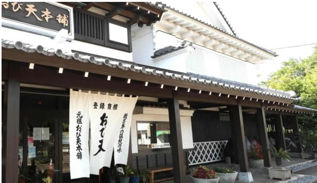
おび天本舗 営業中