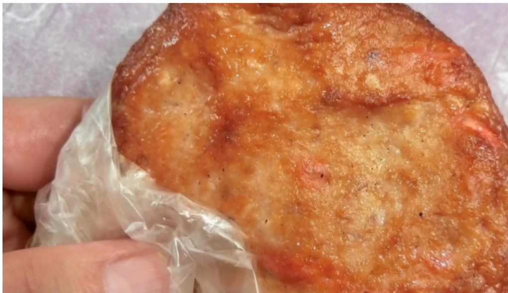
おび天本舗 所在地