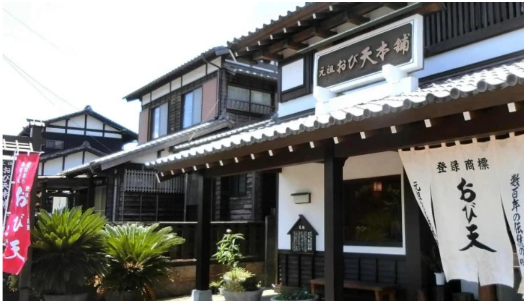
おび天本舗 営業時間