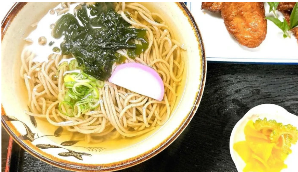
おび天本舗 口コミ