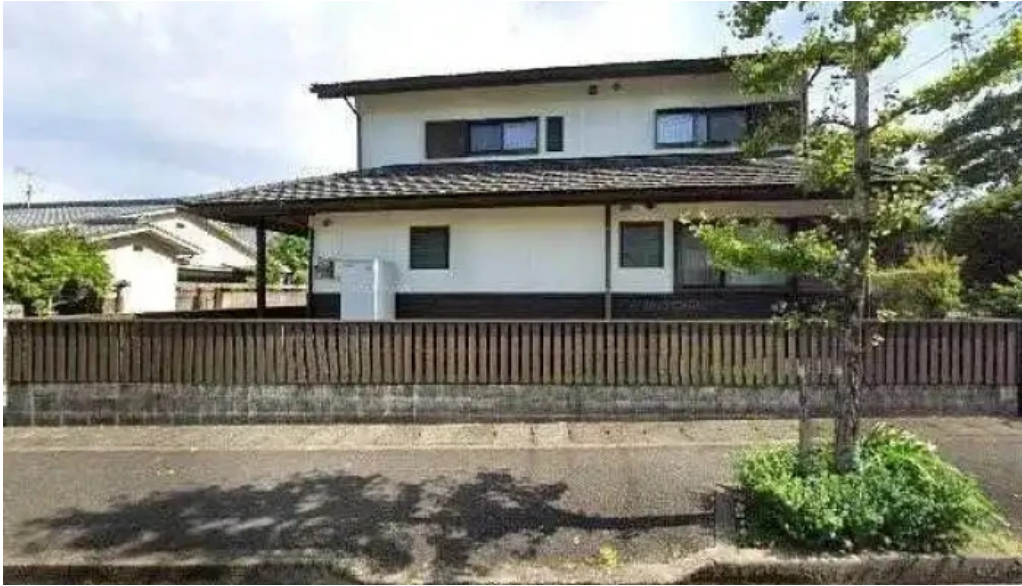
おび天本舗 日南市