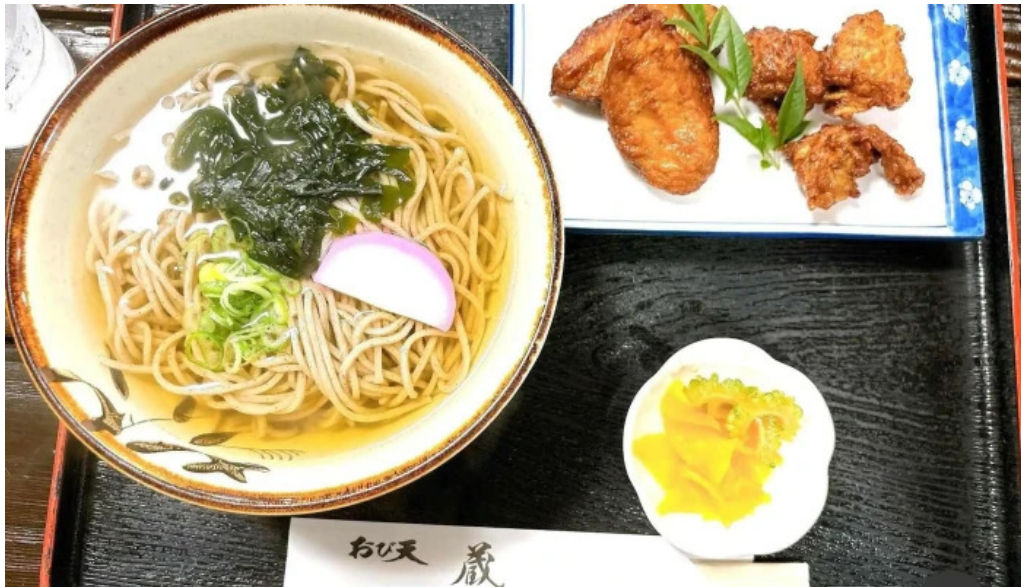
おび天本舗 料理飲み物