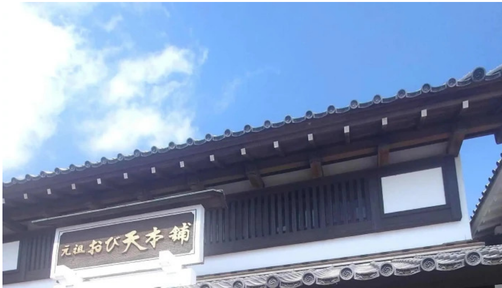
おび天本舗 ウェブサイト