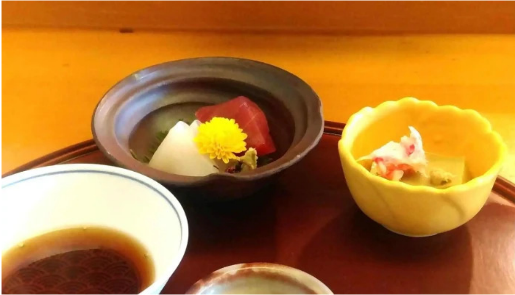
天ぷら 荒川 懐石