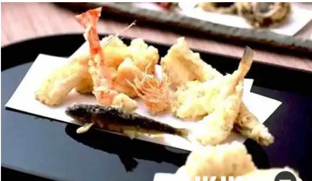
天ぷら 荒川 料理飲み物