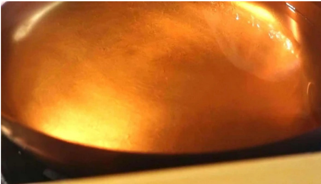
天ぷら 荒川 動画