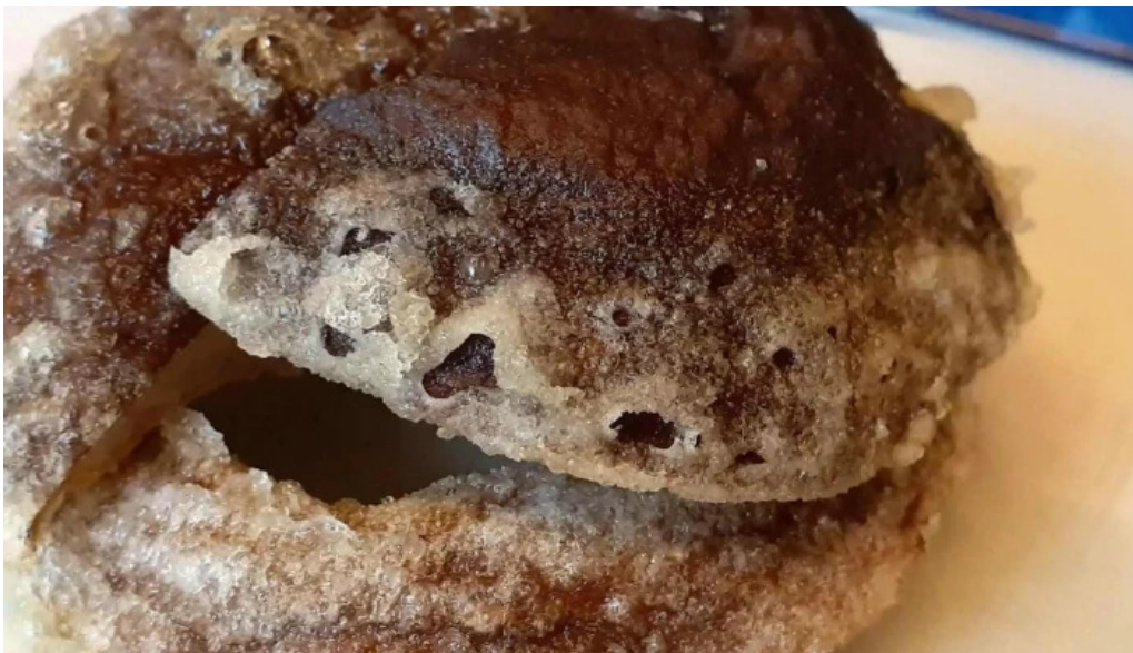
天ぷら 荒川 近く