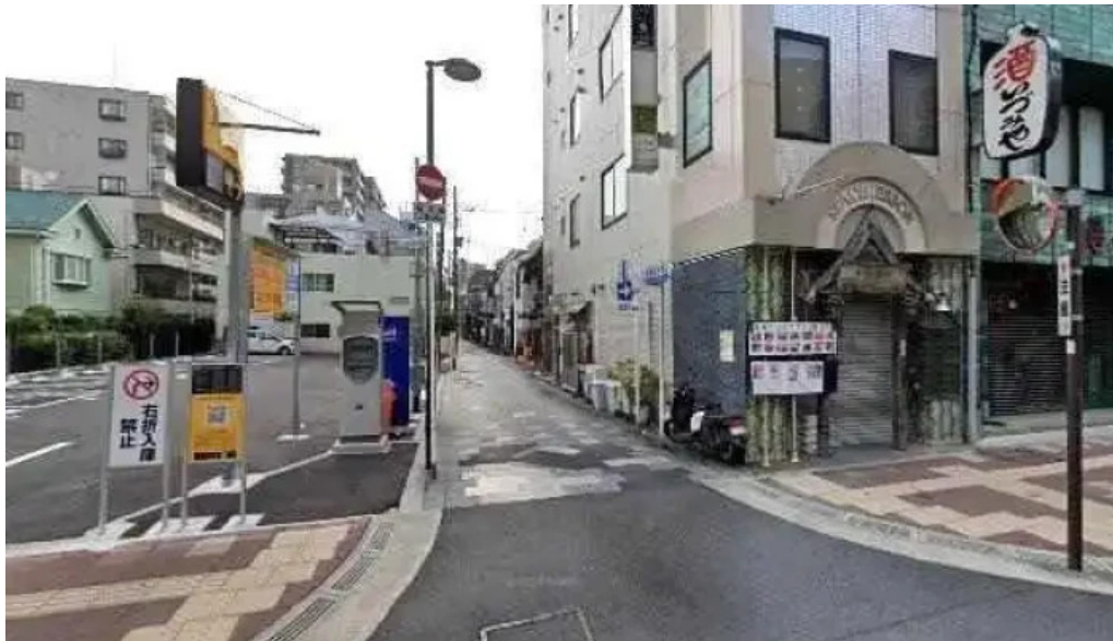
天ぷら 荒川 さいたま市