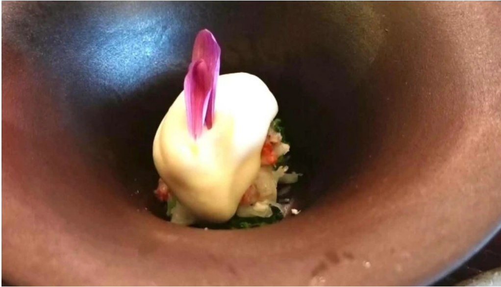
天ぷら 荒川 口コミ