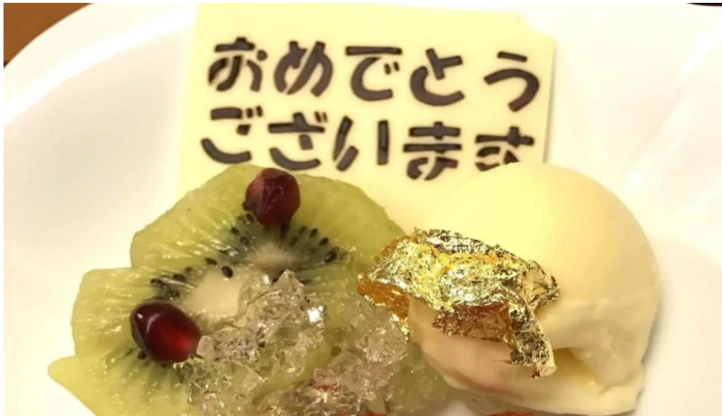
天ぷら 荒川 割引