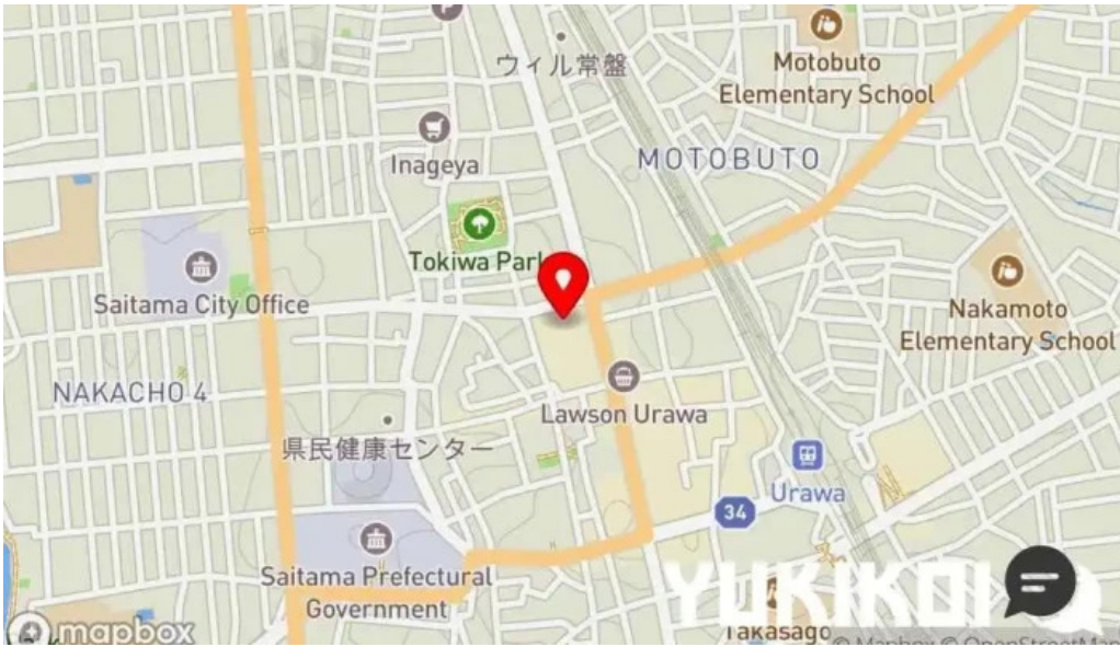
天ぷら 荒川 地図