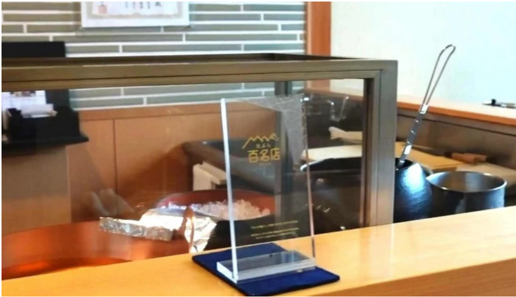
天ぷら 荒川 番号