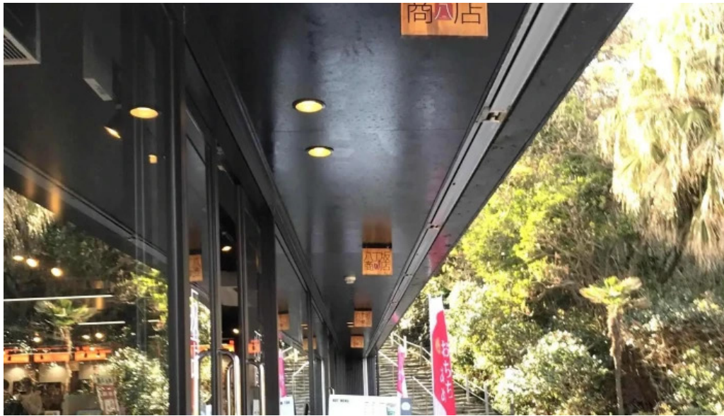
三ツ和荘 コメント