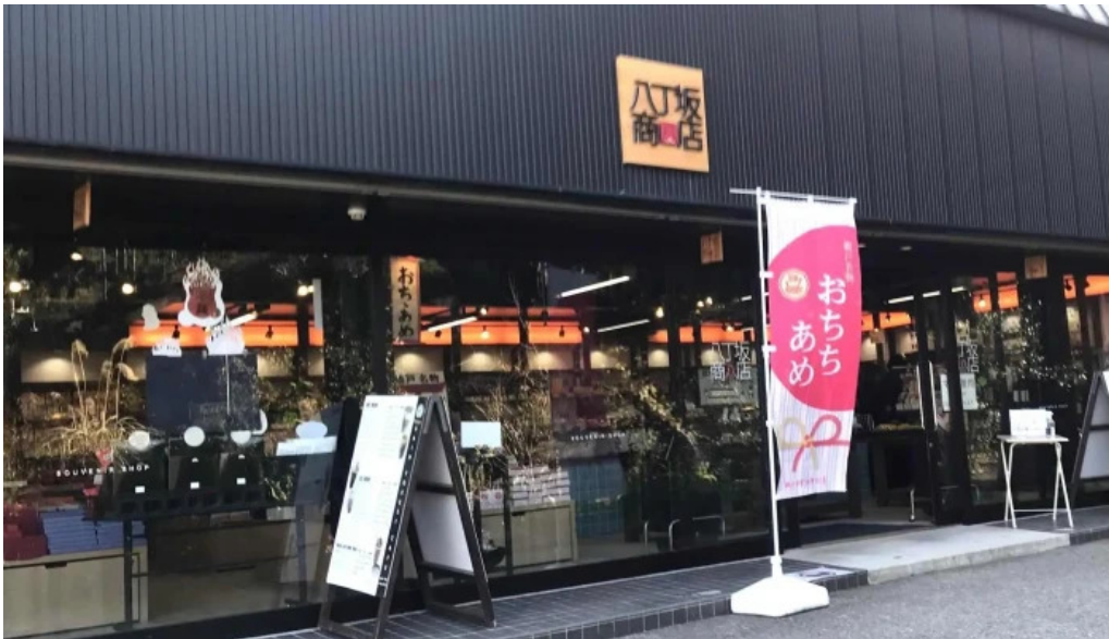
三ツ和荘 プロモーション