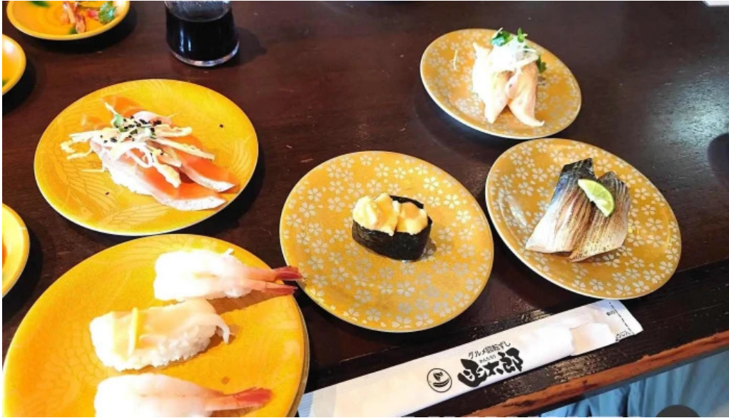
寿司海鮮処函太郎 五稜郭公園店 刺身