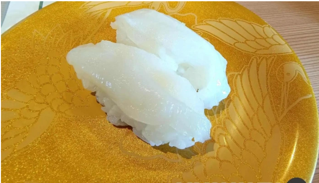
寿司海鮮処函太郎 五稜郭公園店 料理飲み物