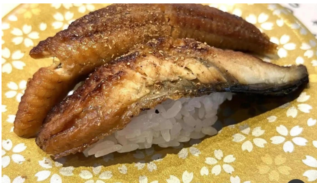
寿司海鮮処函太郎 五稜郭公園店 ウナギ