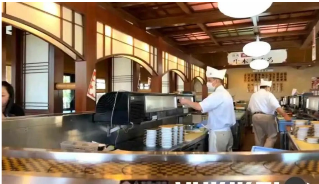
寿司海鮮処函太郎 五稜郭公園店 動画