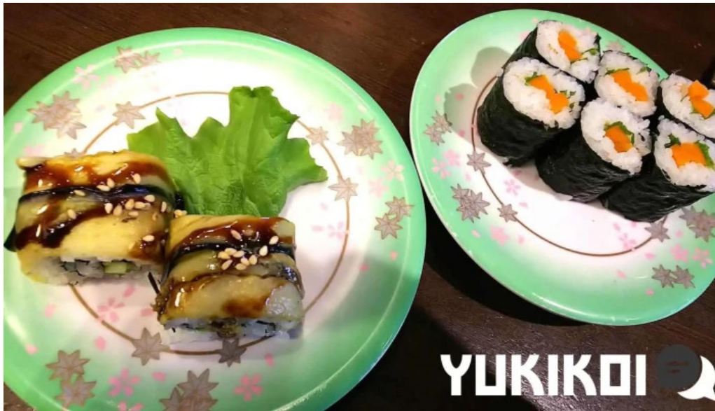
寿司海鮮処函太郎 五稜郭公園店 寿司