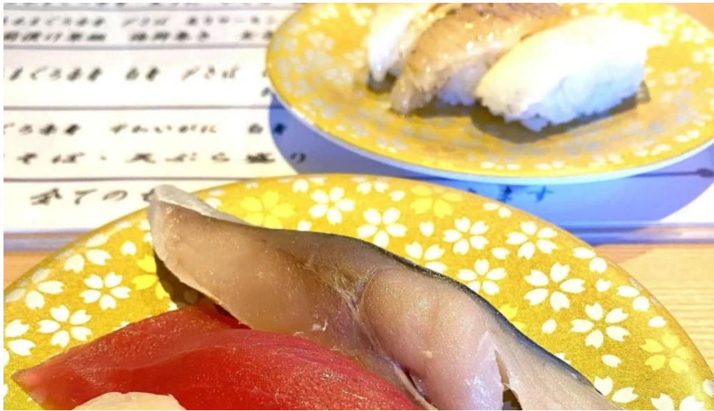
寿司海鮮処函太郎 五稜郭公園店 コメント