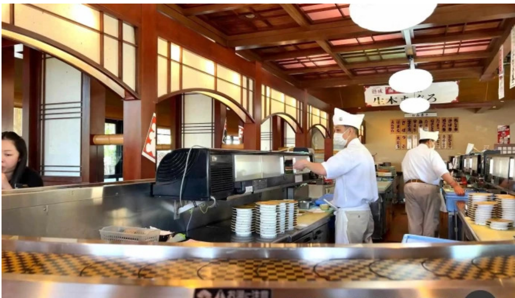
寿司海鮮処函太郎 五稜郭公園店 雰囲気