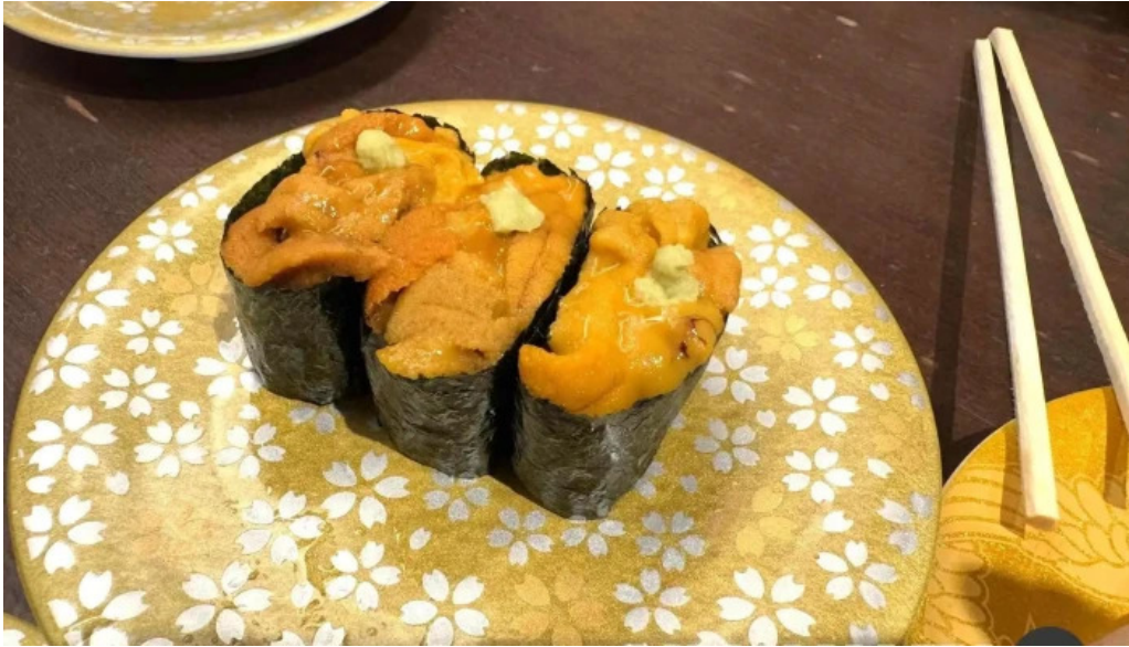
寿司海鮮処函太郎 五稜郭公園店 最新