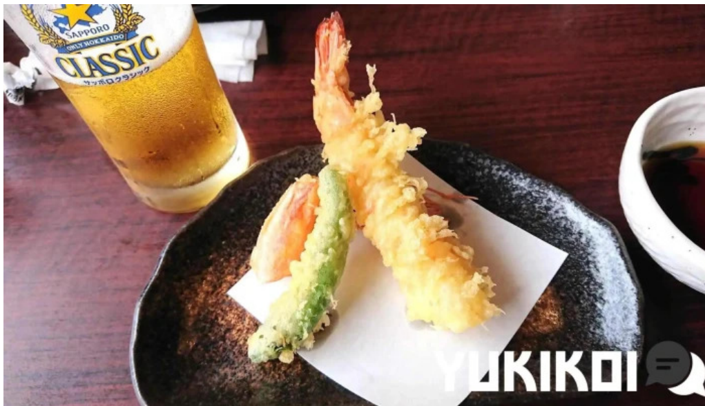
寿司海鮮処函太郎 五稜郭公園店 天ぷら