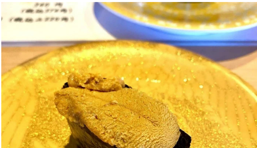
寿司海鮮処函太郎 五稜郭公園店 エリア