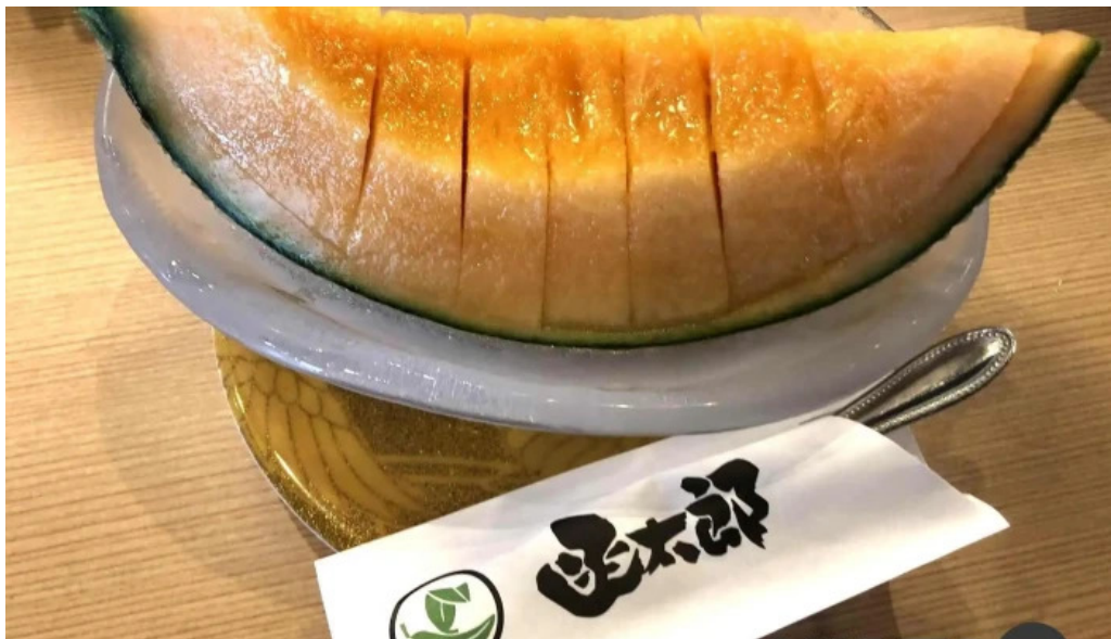
寿司海鮮処函太郎 五稜郭公園店 カンタロープ