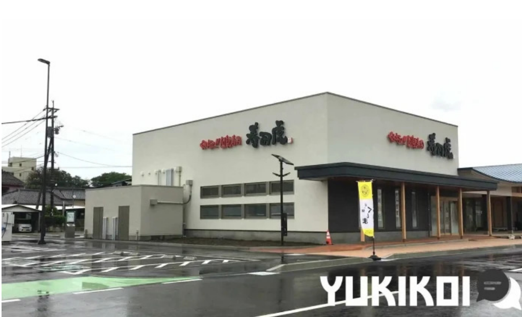
寿司虎 串間本店 動画