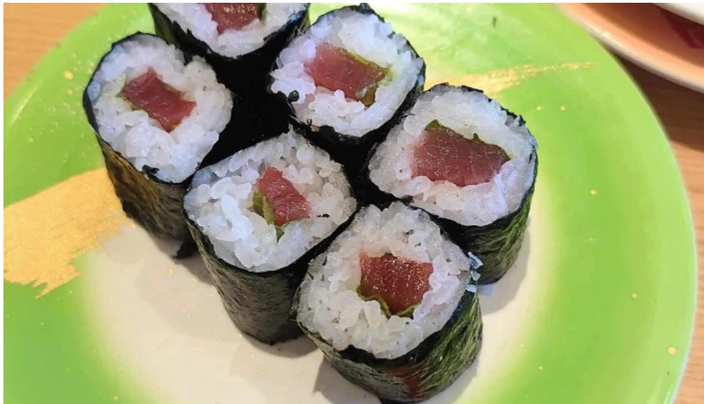
寿司虎 串間本店 寿司