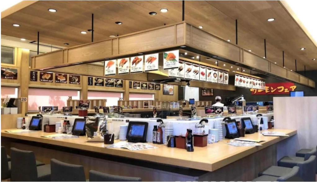
寿司虎 串間本店 雰囲気