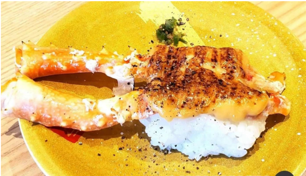
寿司虎 串間本店 最新