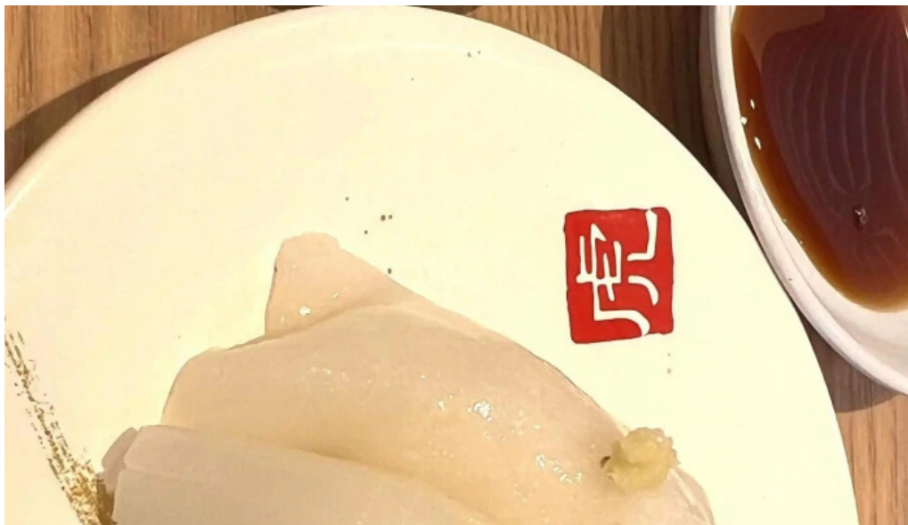
寿司虎 串間本店 営業時間