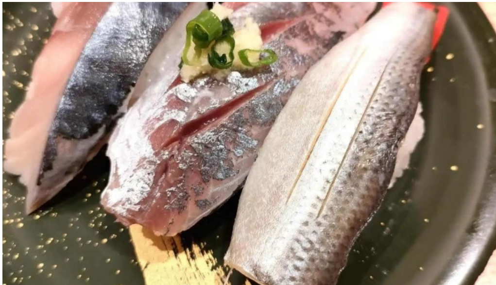
寿司虎 串間本店 シーフード