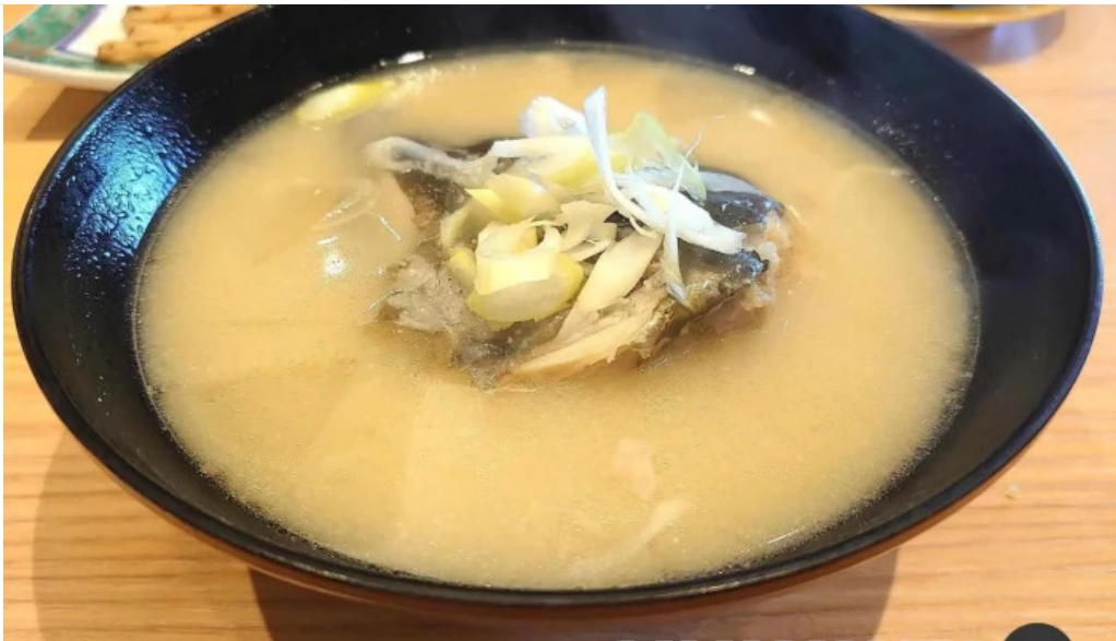
寿司虎 串間本店 味噌汁