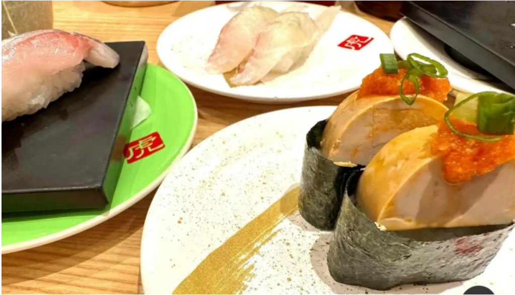
寿司虎 串間本店 刺身