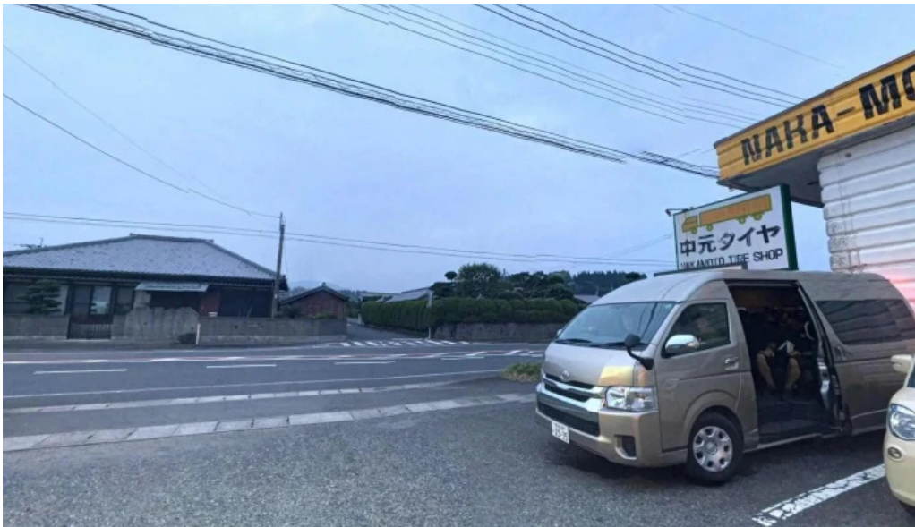
寿司虎 串間本店 串間市