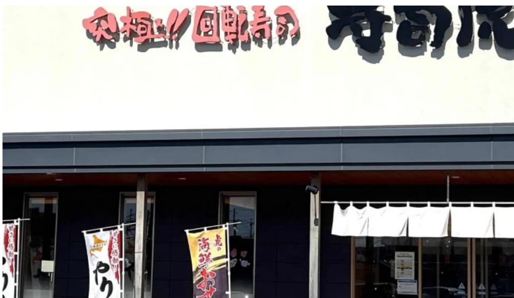
寿司虎 串間本店 instagram