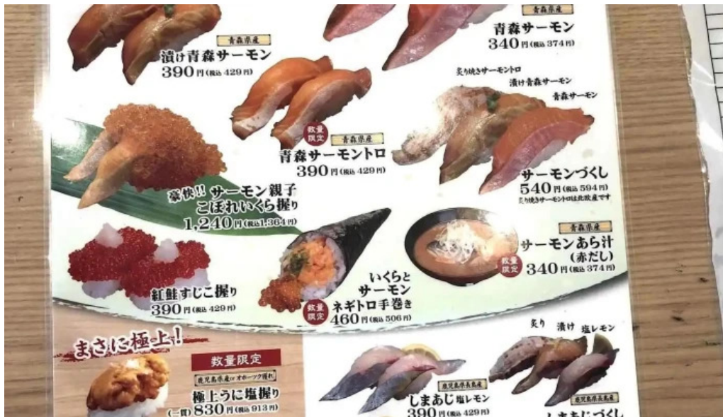
寿司虎 串間本店 メニュー