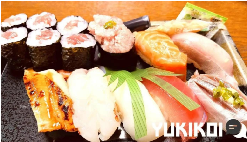
寿司虎 串間本店 料理飲み物