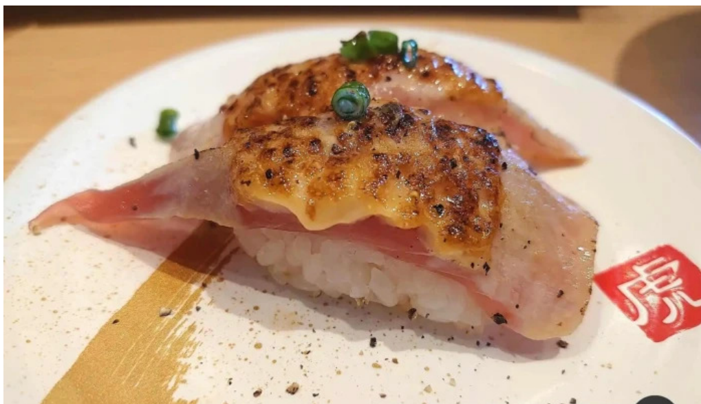
寿司虎 串間本店 サバ