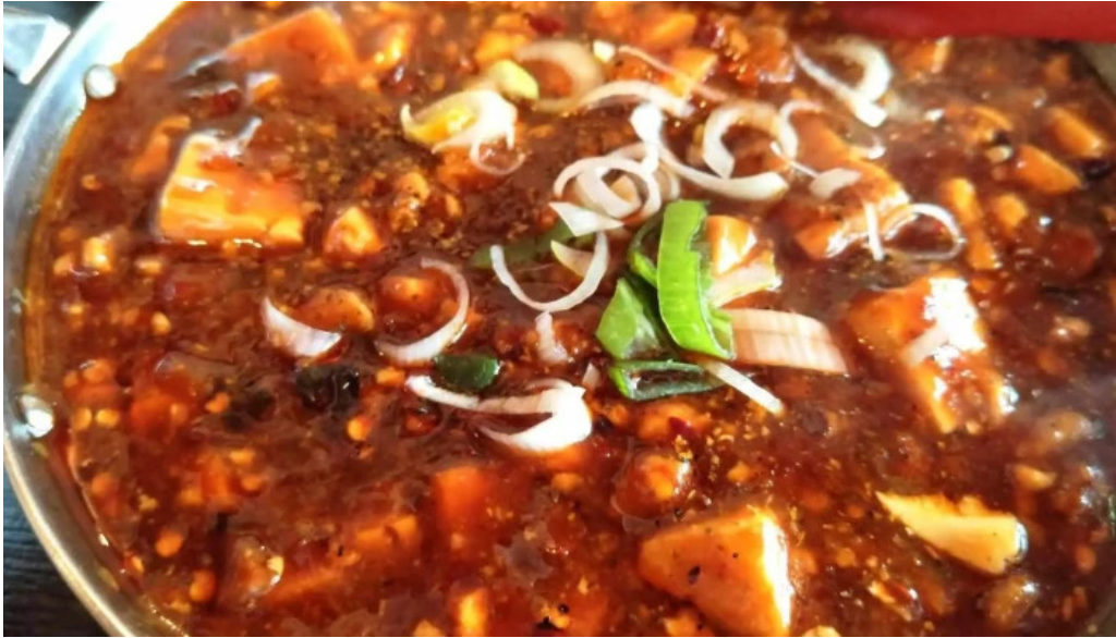
本格四川料理 華洋 2号店 番号