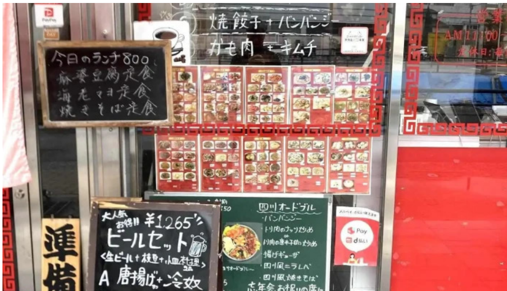
本格四川料理 華洋 2号店 メニュー