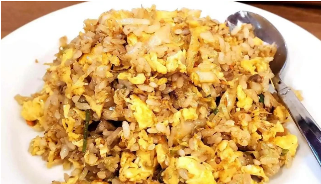
本格四川料理 華洋 2号店 焼き飯