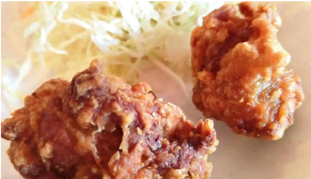
本格四川料理 華洋 2号店 割引