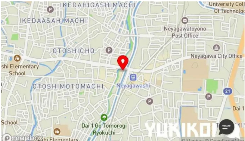
本格四川料理 華洋 2号店 地図