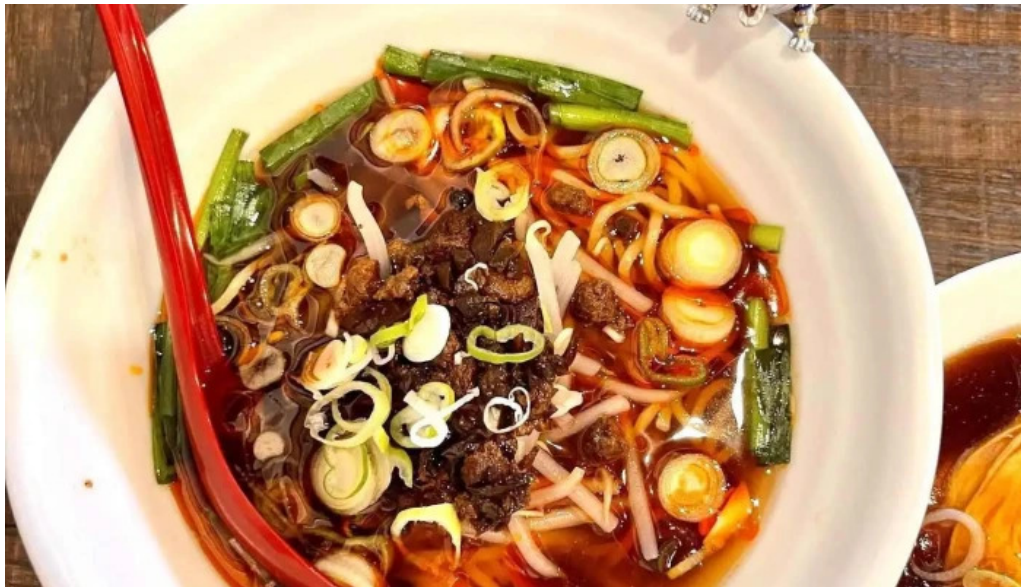
本格四川料理 華洋 2号店 ラーメン