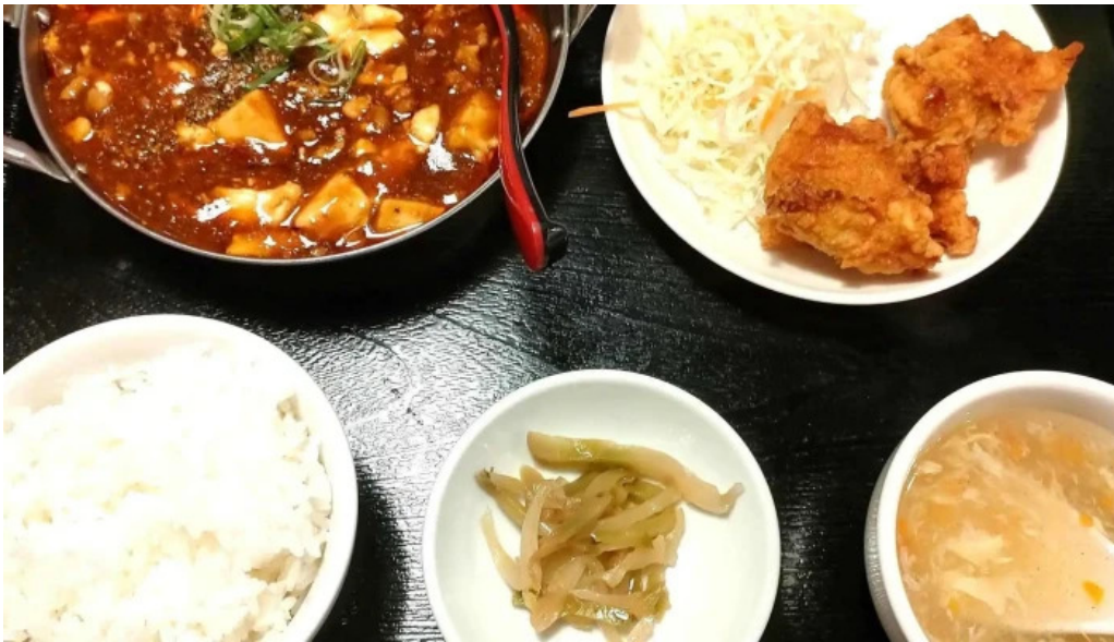
本格四川料理 華洋 2号店 住所