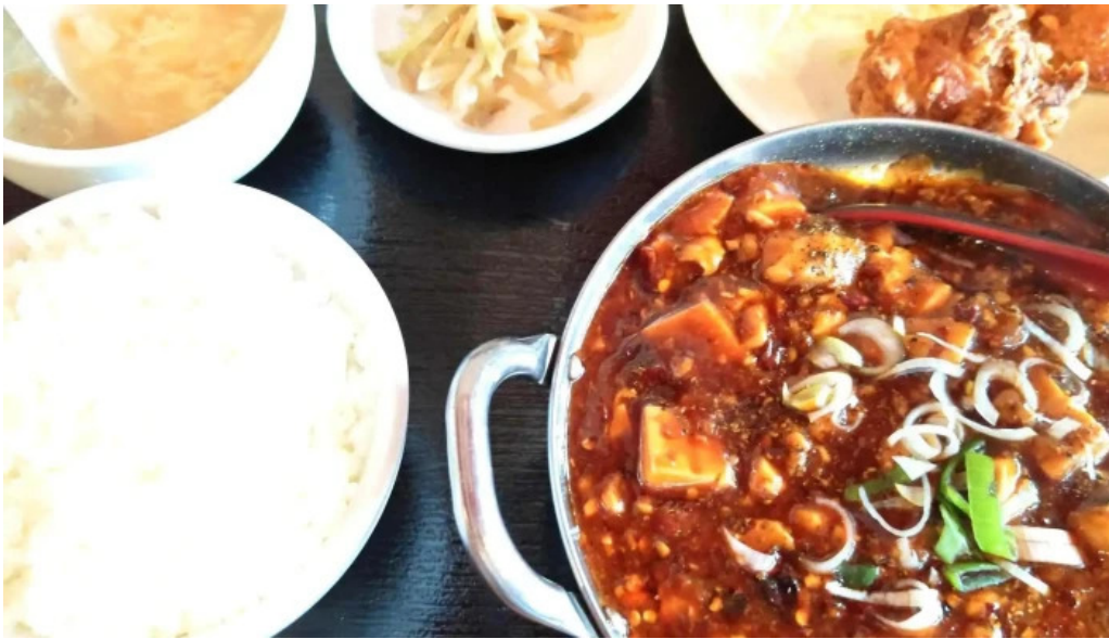
本格四川料理 華洋 2号店 所在地