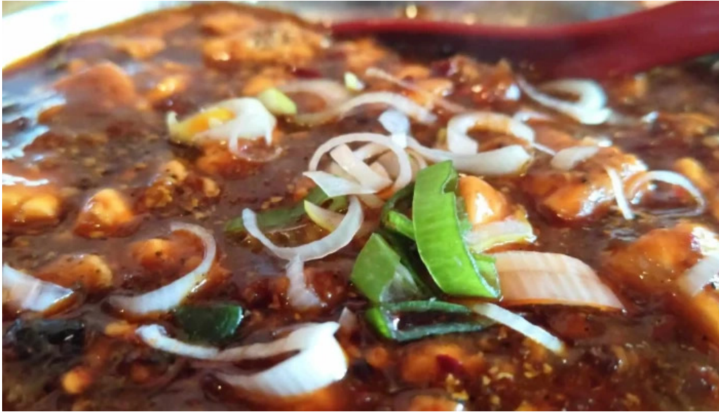
本格四川料理 華洋 2号店 電話