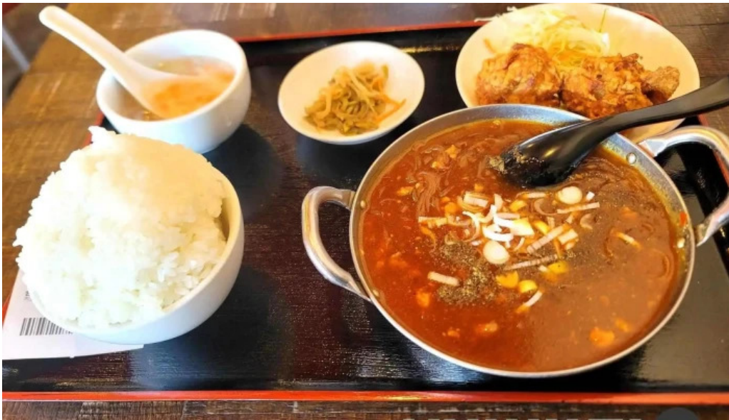
本格四川料理 華洋 2号店 料理飲み物