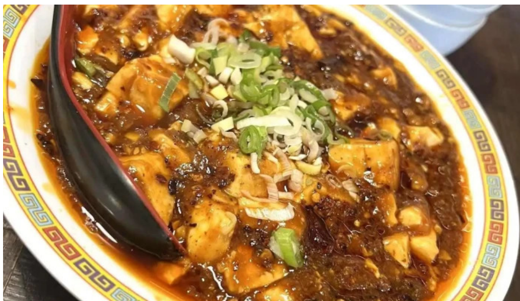
本格四川料理 華洋 2号店 麻婆豆腐