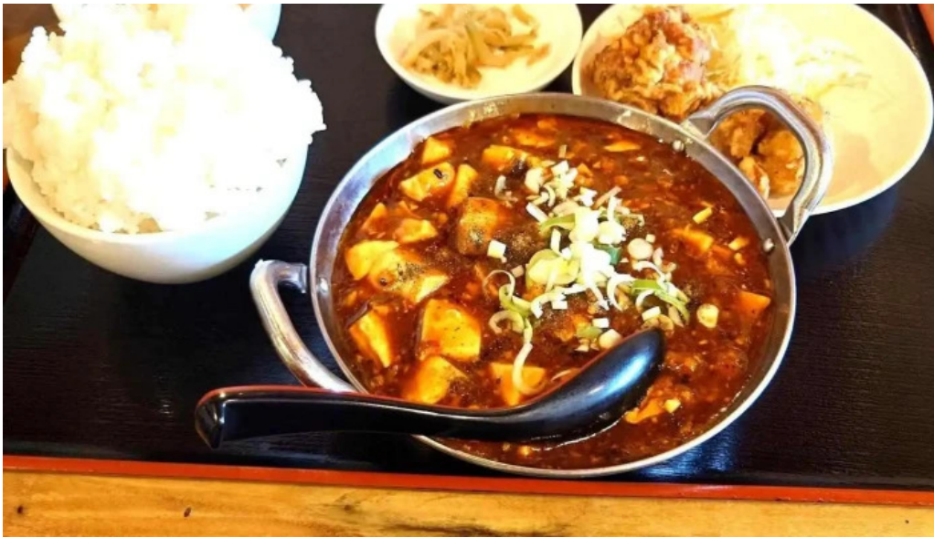
本格四川料理 華洋 2号店 最新