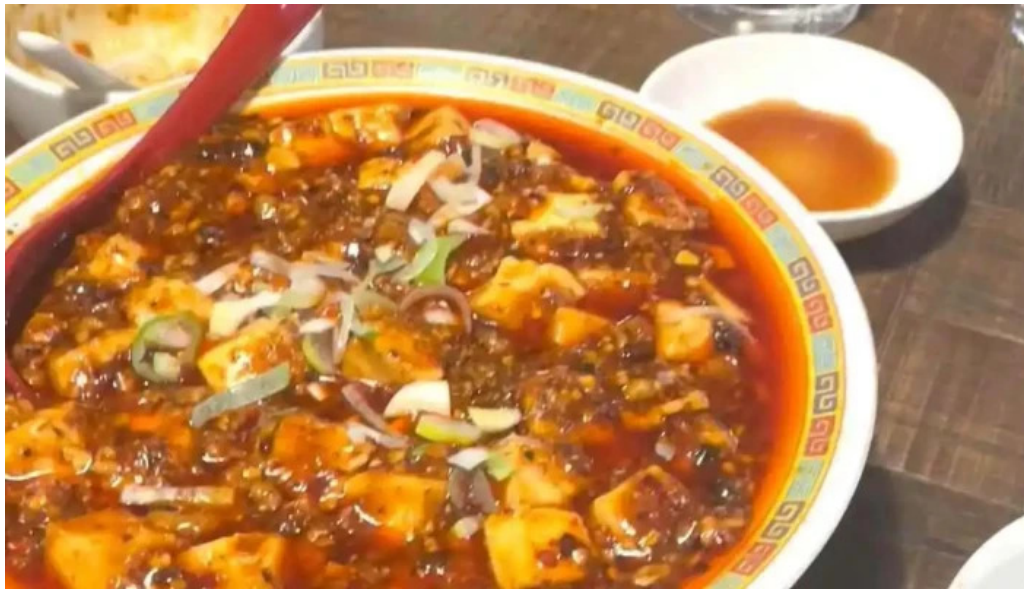
本格四川料理 華洋 2号店 動画