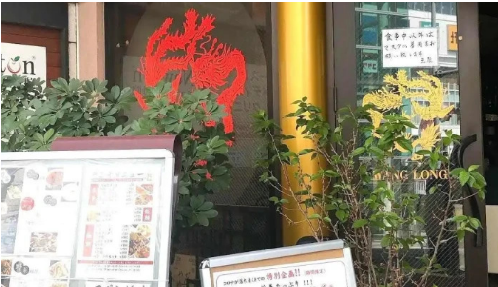
本格 中華料理 王龍 メニュー