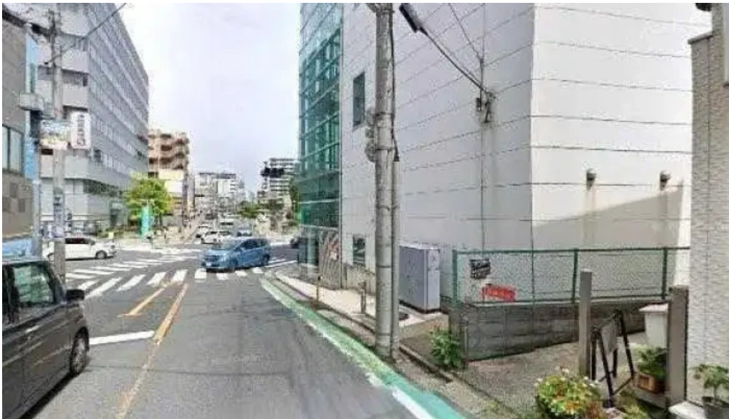
本格 中華料理 王龍 さいたま市