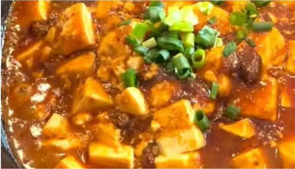
本格 中華料理 王龍 動画