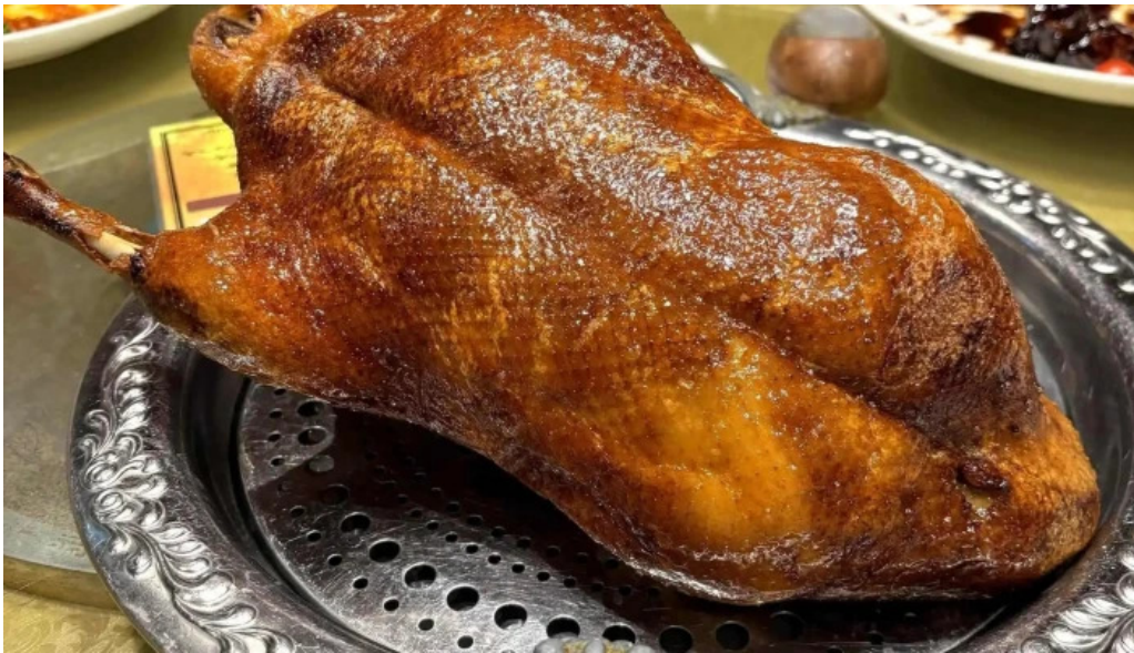
本格 中華料理 王龍 北京ダック