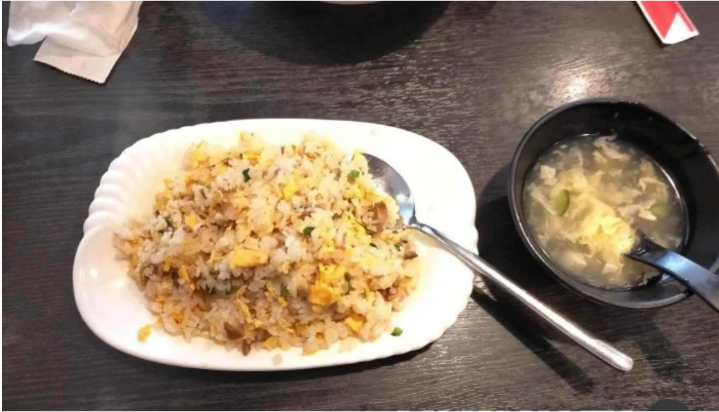
本格 中華料理 王龍 焼き飯