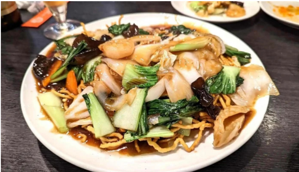
本格 中華料理 王龍 料理飲み物