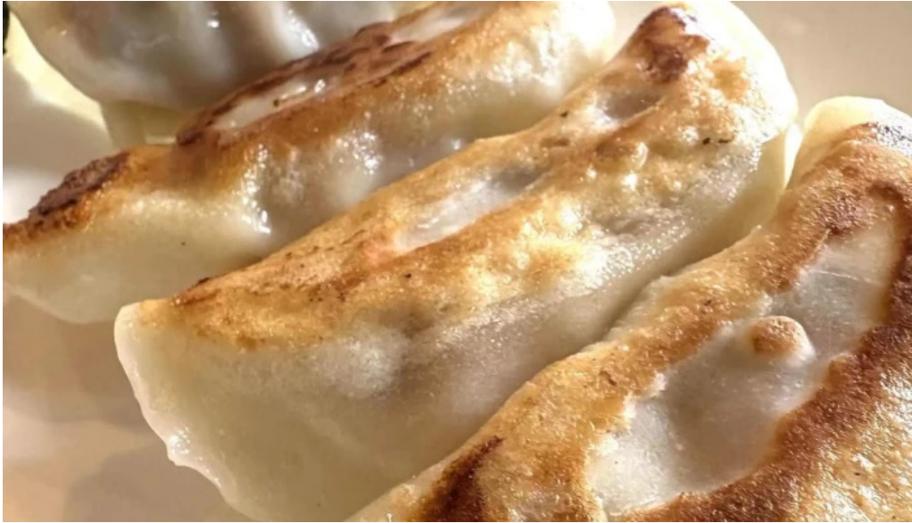
本格 中華料理 王龍 営業中