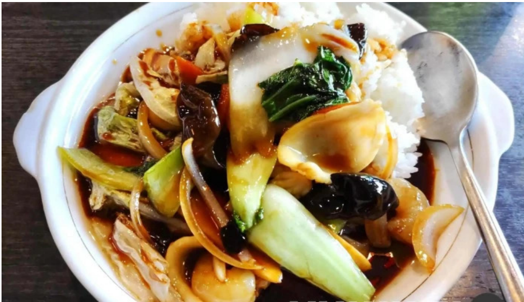
本格 中華料理 王龍 焼きそば