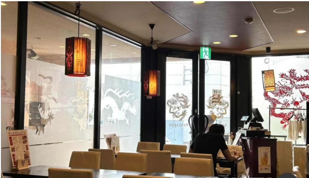
本格 中華料理 王龍 雰囲気