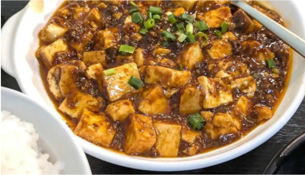
本格 中華料理 王龍 最新