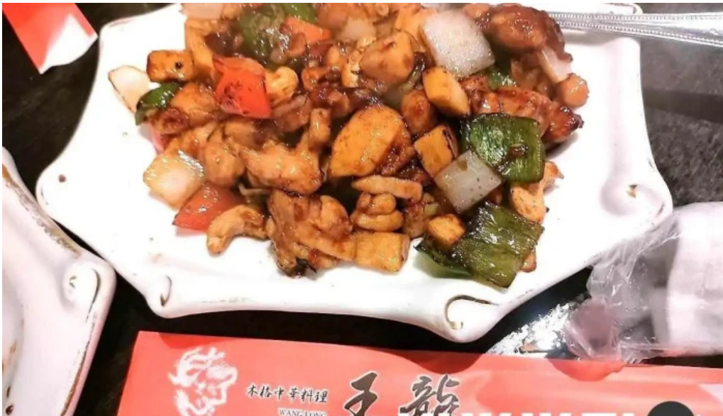
本格 中華料理 王龍 宮保雞丁