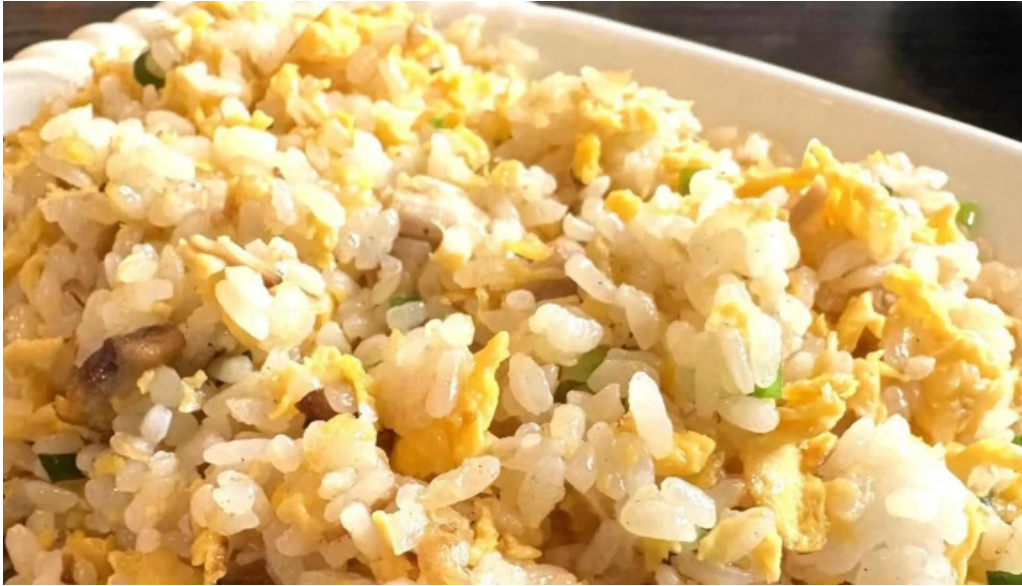
本格 中華料理 王龍 ウェブサイト