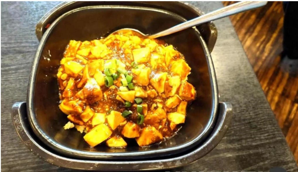
本格 中華料理 王龍 麻婆豆腐