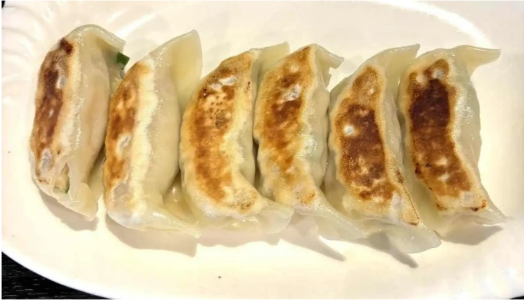
本格 中華料理 王龍 餃子