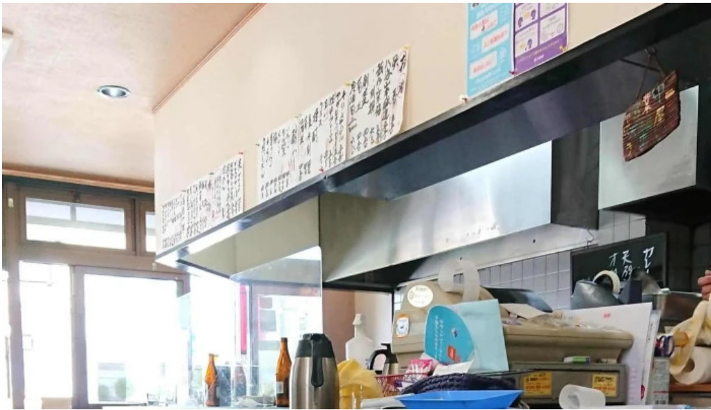
天輪屋 プロモーション