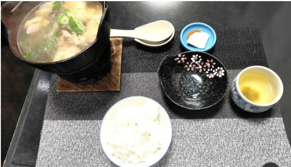
天輪屋 料理飲み物