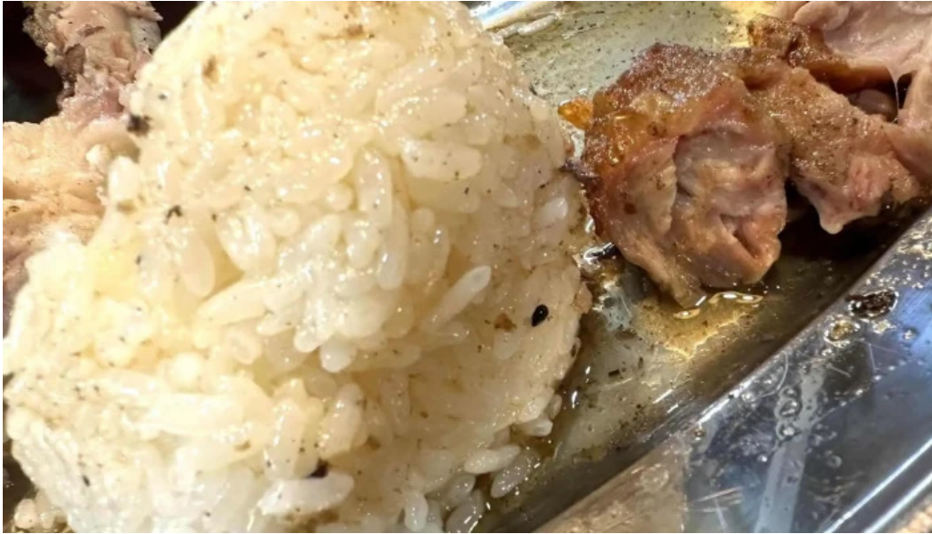
骨付き鳥 味鶴 近く