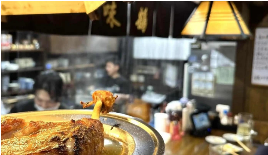
骨付き鳥 味鶴 動画