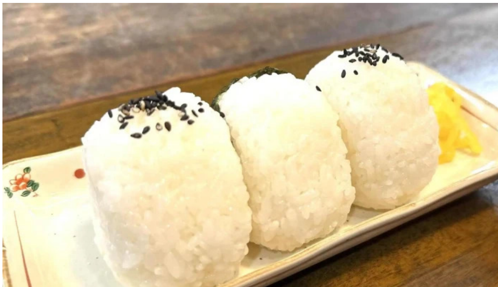
骨付き鳥 味鶴 カタログ