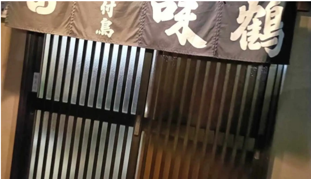
骨付き鳥 味鶴 最新