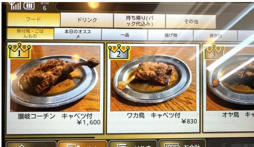
骨付き鳥 味鶴 メニュー