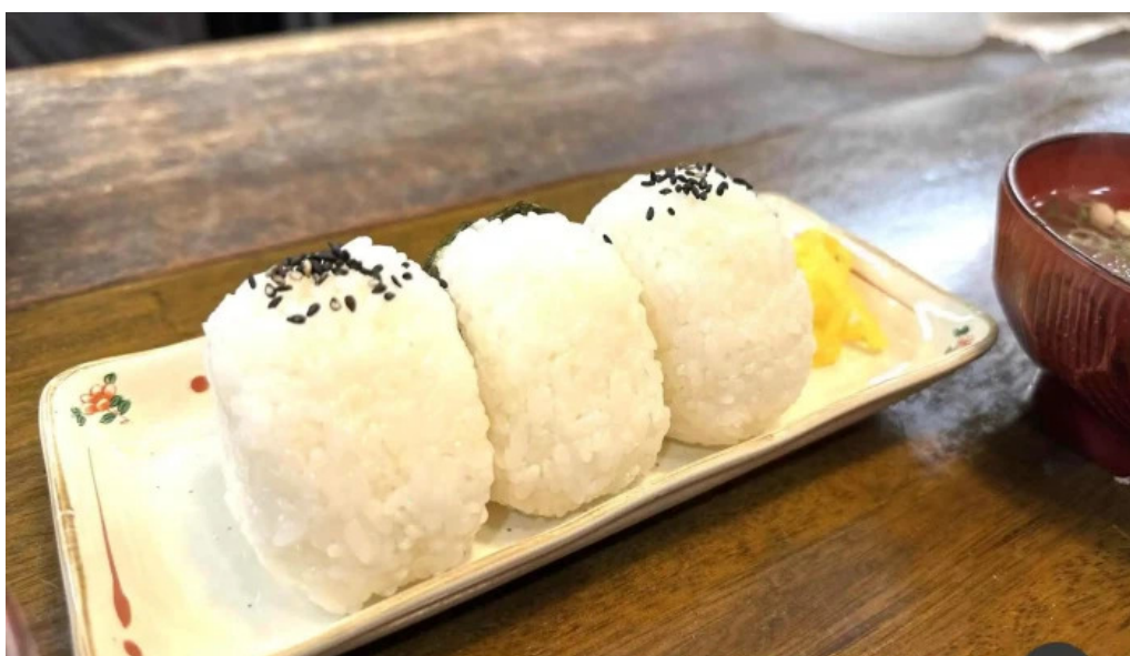
骨付き鳥 味鶴 おにぎり