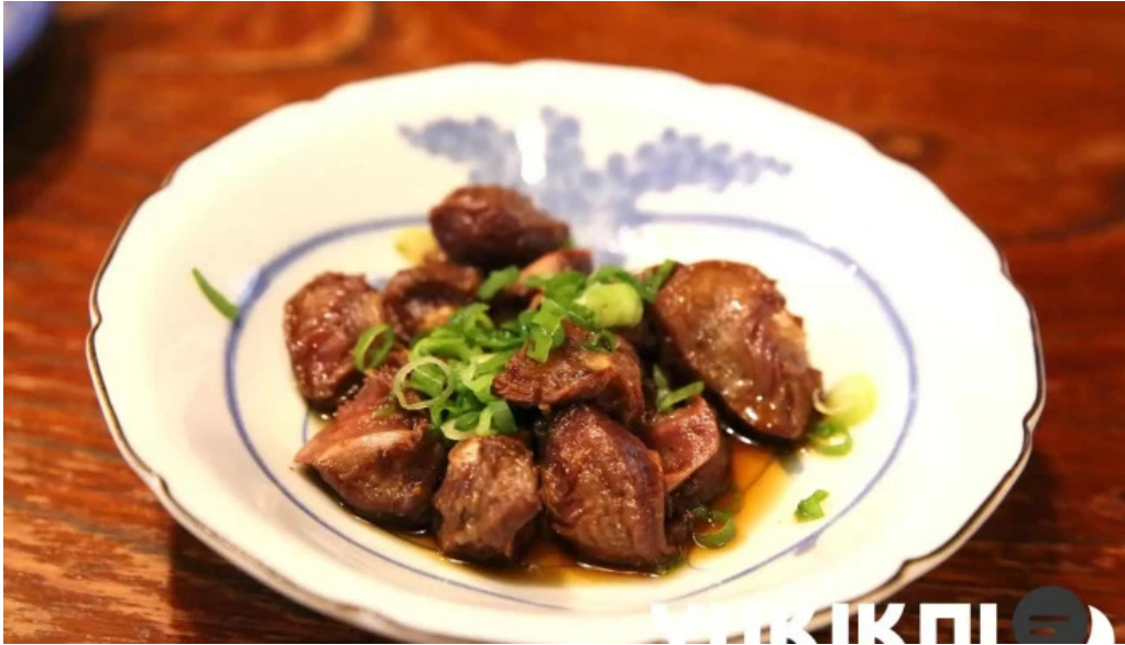
骨付き鳥 味鶴 料理飲み物