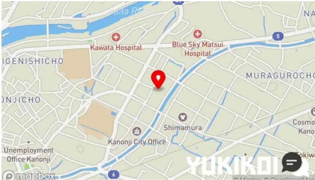
骨付き鳥 味鶴 地図