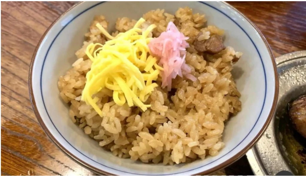
骨付き鳥 味鶴 焼き飯