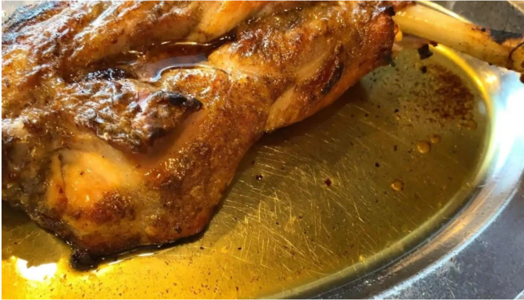
骨付き鳥 味鶴 電話