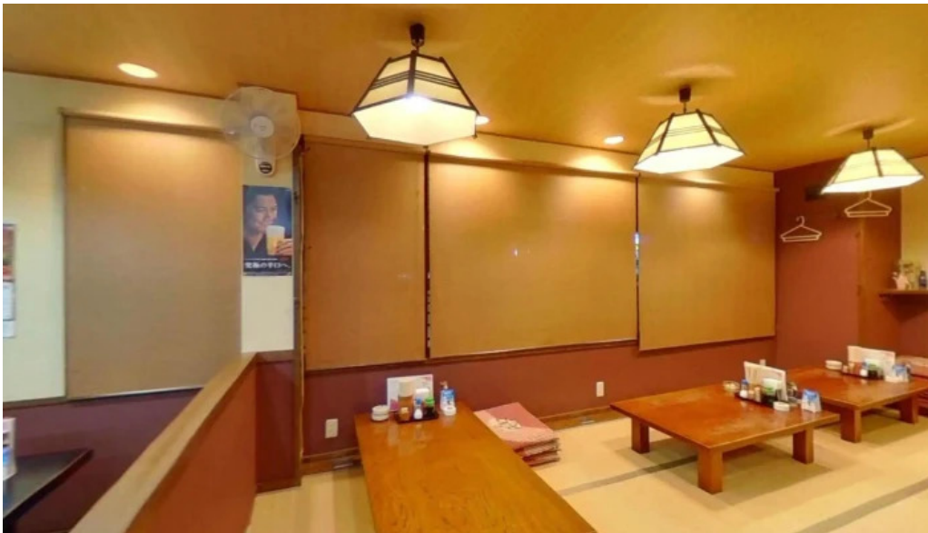
骨付き鳥 味鶴 観音寺市