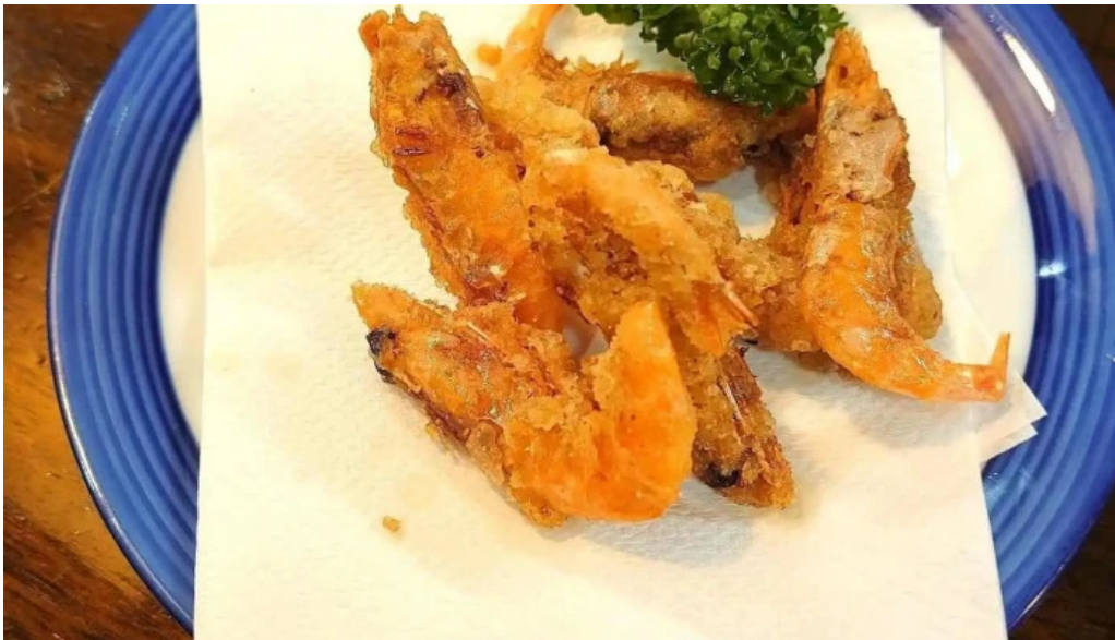
骨付き鳥 味鶴 天ぷら