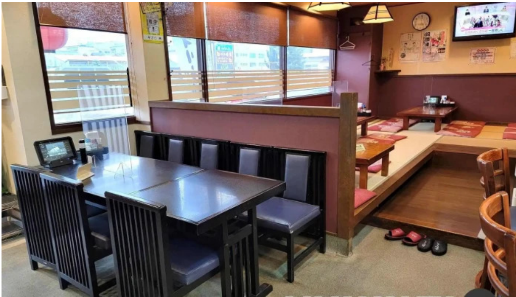
骨付き鳥 味鶴 雰囲気