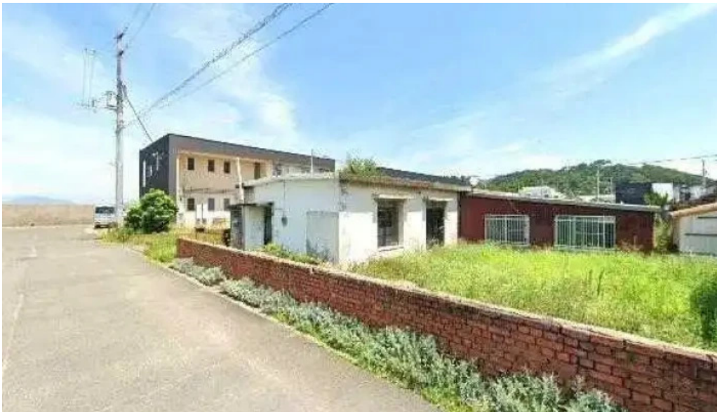
琴弾廻廊 お食事所 暈亭 かさてい 観音寺市