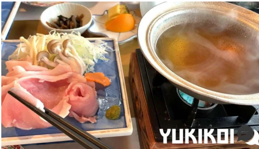
琴弾廻廊 お食事所 暈亭 かさてい 動画