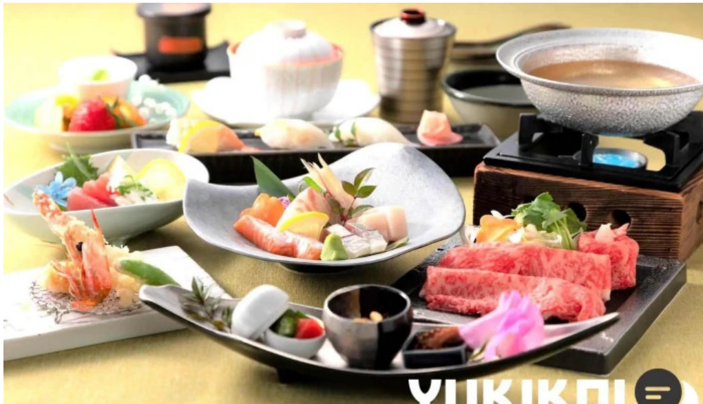
琴弾廻廊 お食事所 暈亭 かさてい 料理飲み物