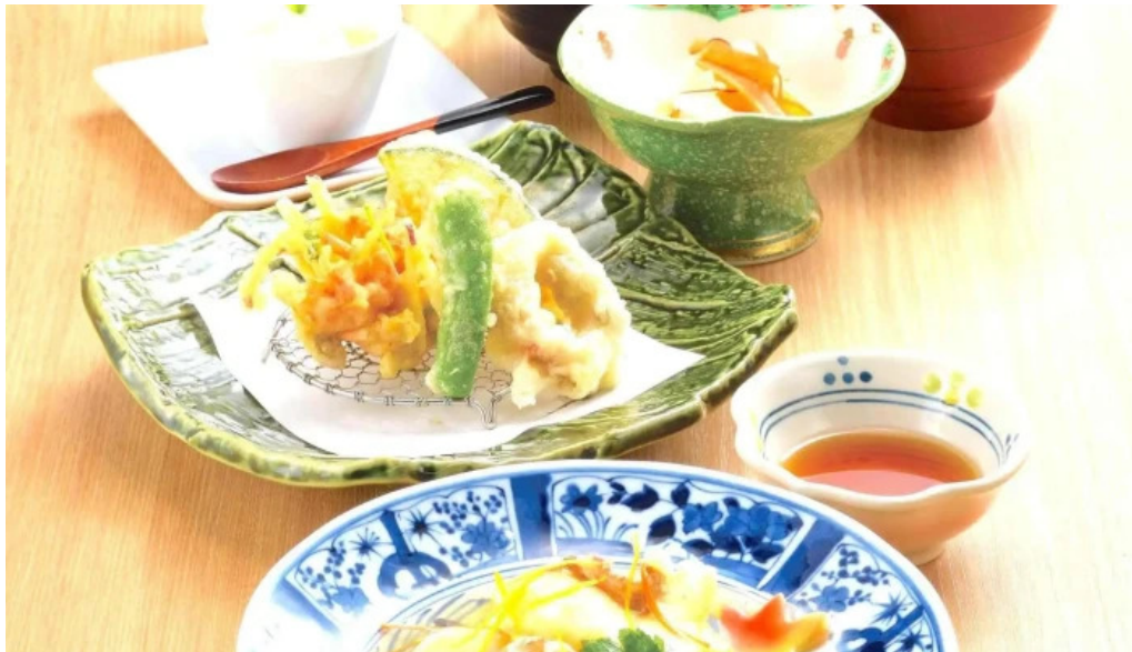
琴弾廻廊 お食事所 暈亭 かさてい スープ