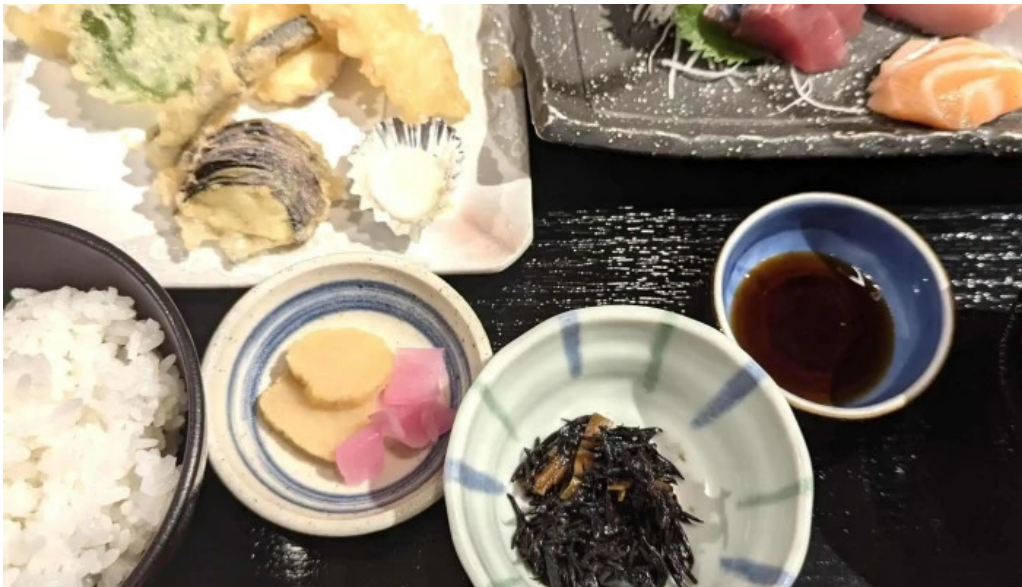
琴弾廻廊 お食事所 暈亭 かさてい 行き方