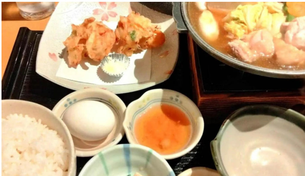
琴弾廻廊 お食事所 暈亭 かさてい instagram