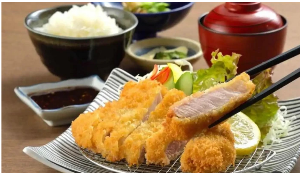
琴弾廻廊 お食事所 暈亭 かさてい オーナー提供