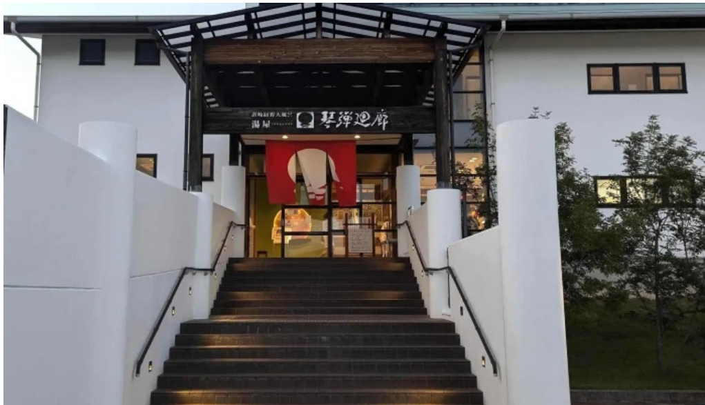
琴弾廻廊 お食事所 暈亭 かさてい 口コミ