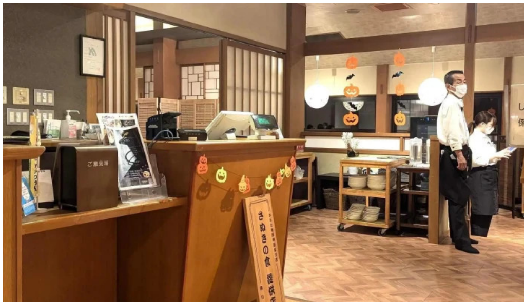
琴弾廻廊 お食事所 量亭 かさてい 住所