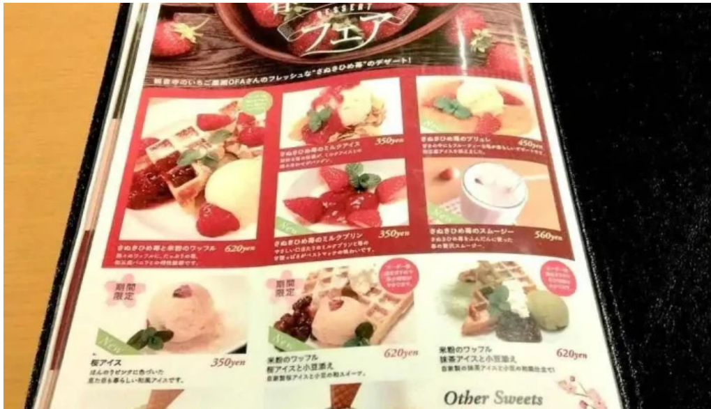
琴弾廻廊 お食事所 暈亭 かさてい メニュー