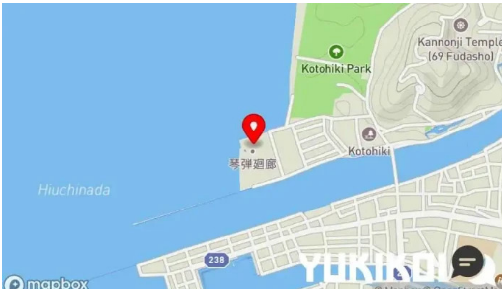
琴弾廻廊 お食事所 暈亭 かさてい 地図