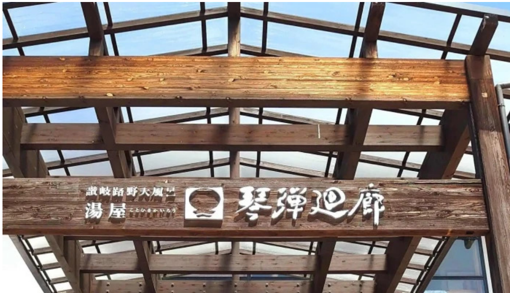
琴弾廻廊 お食事所 暈亭 かさてい エリア