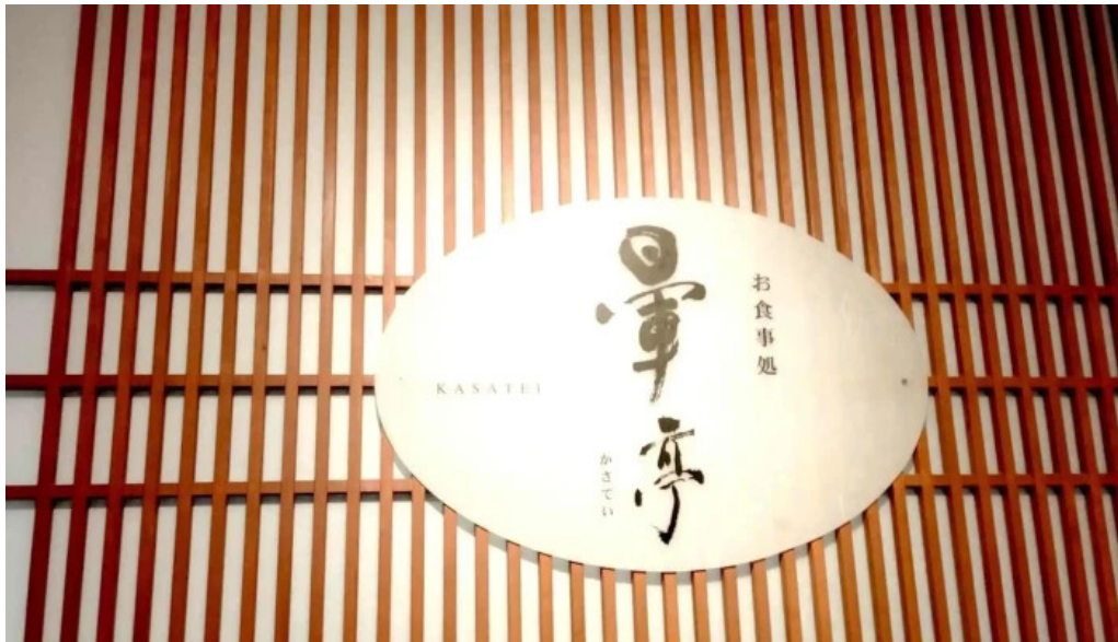
琴弾廻廊 お食事所 量亭 かさてい 写真