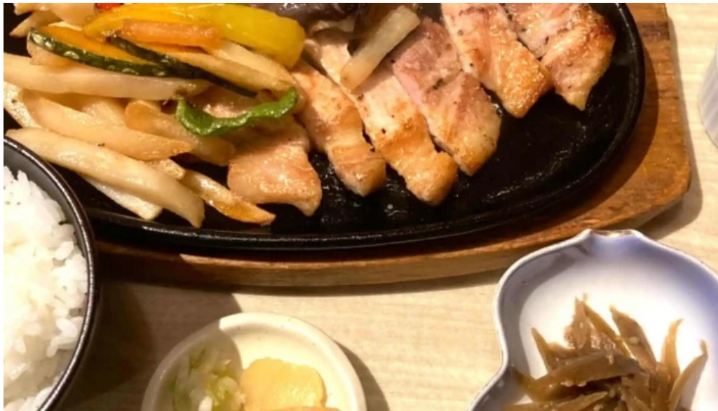
琴弾廻廊 お食事所 暈亭 かさてい カタログ