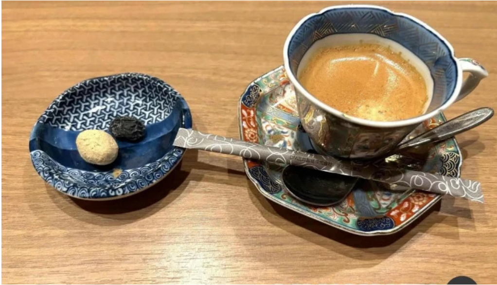
滋味康月 コーヒー