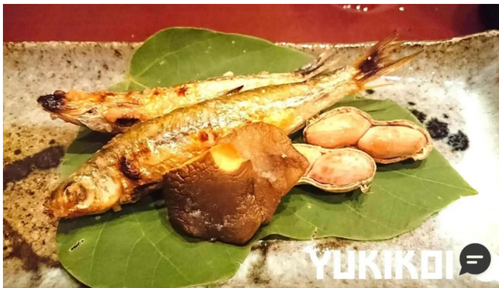
滋味康月 シーフード