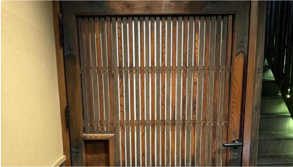
滋味康月 營業時間