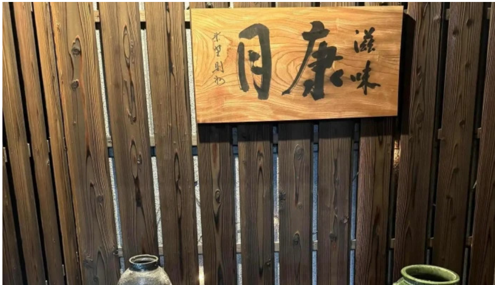
滋味康月 カタログ