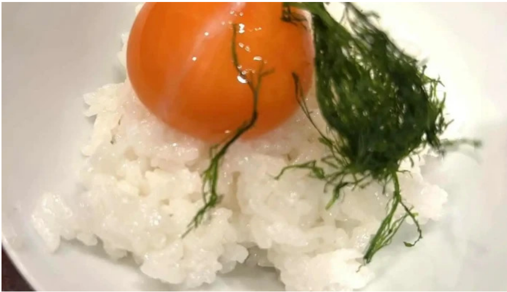
滋味康月 卵かけご飯