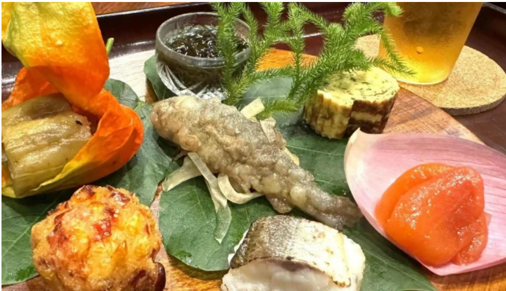
滋味康月 コメント