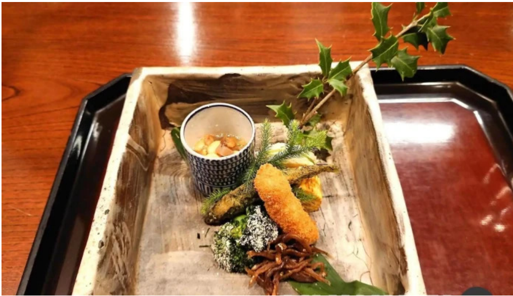
滋味康月 料理飲み物