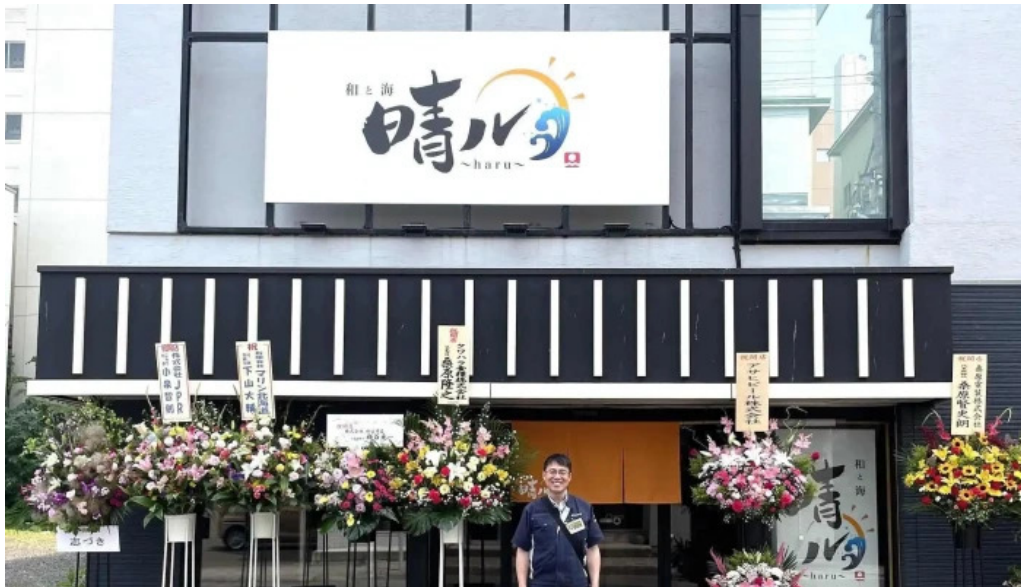
He toHai Qing ru comentario 6