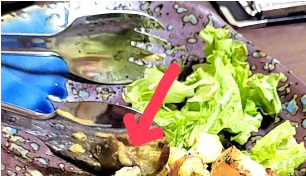
He toHai Qing ru comentario 2