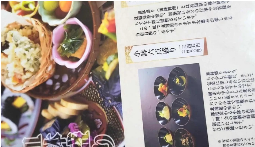
He toHai Qing ru comentario 4