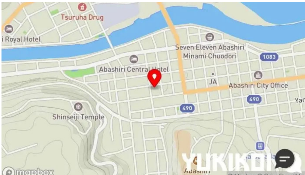
He toHai Qing ru mapa