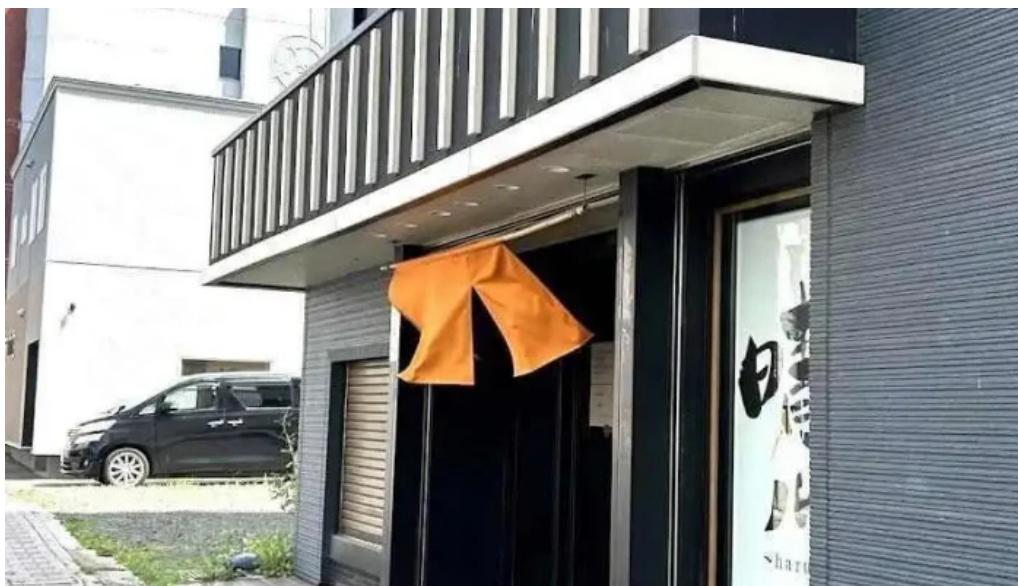
和と海 晴ル 網走市