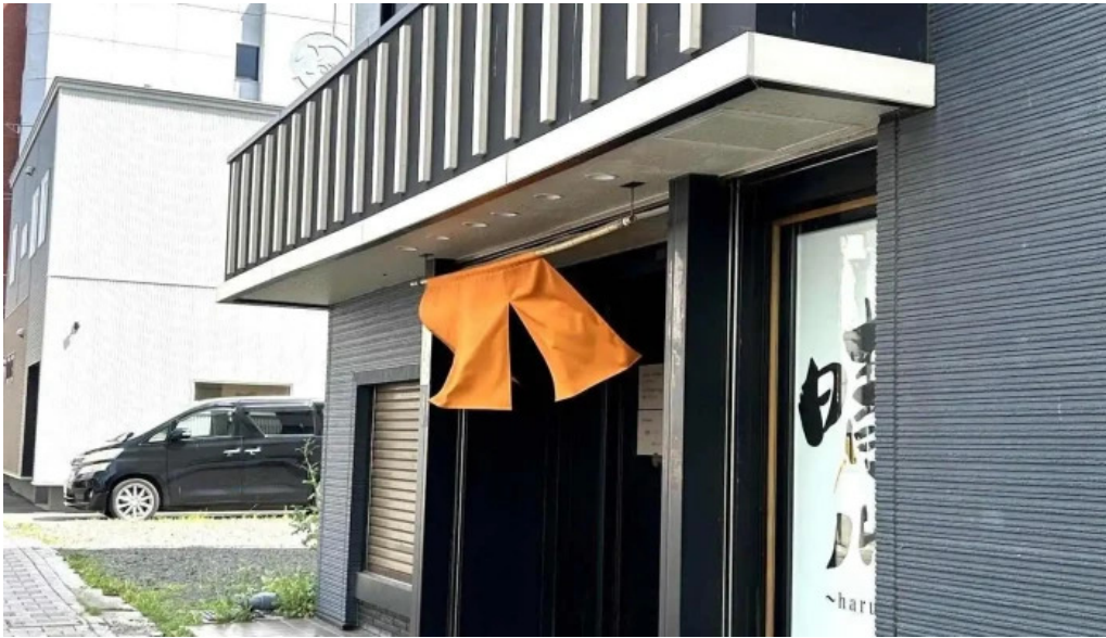
He toHai Qing ru subete

He toHai Qing ru sutori tobiyu to 360 biyu