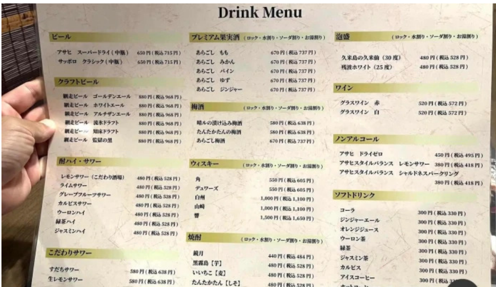
He toHai Qing ru meniyu