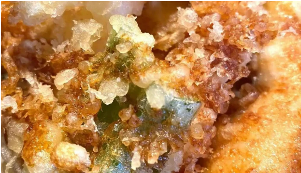
He toHai Qing ru Liao Li Yin miWu