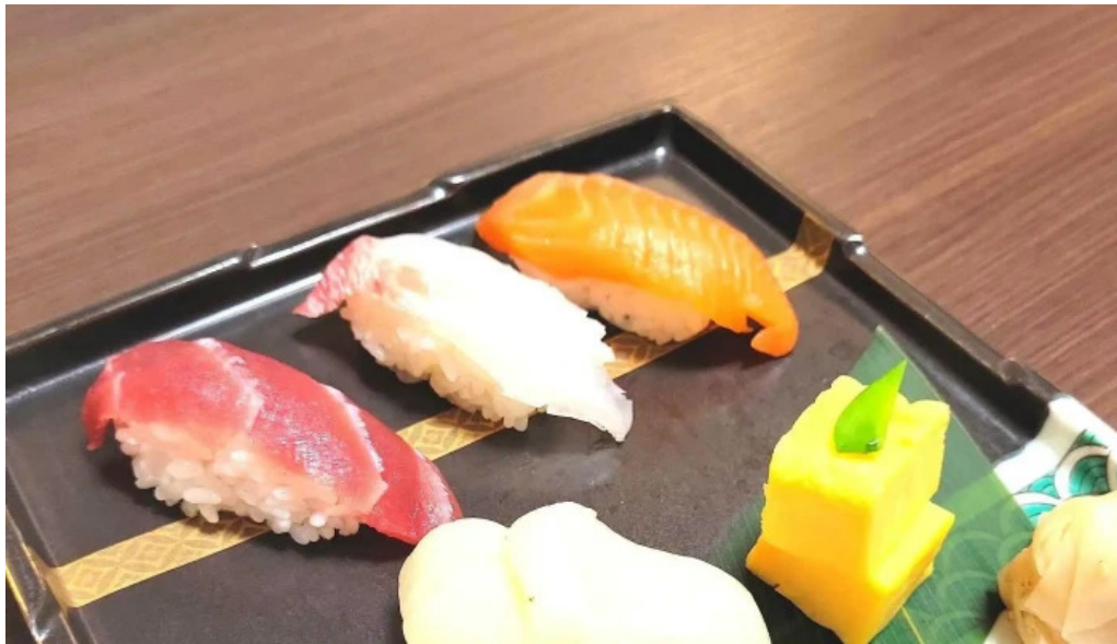
He toHai Qing ru comentario 3