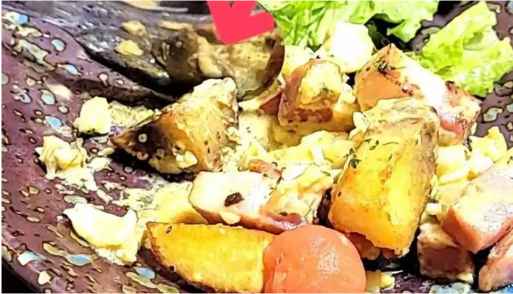
He toHai Qing ru Zui Xin