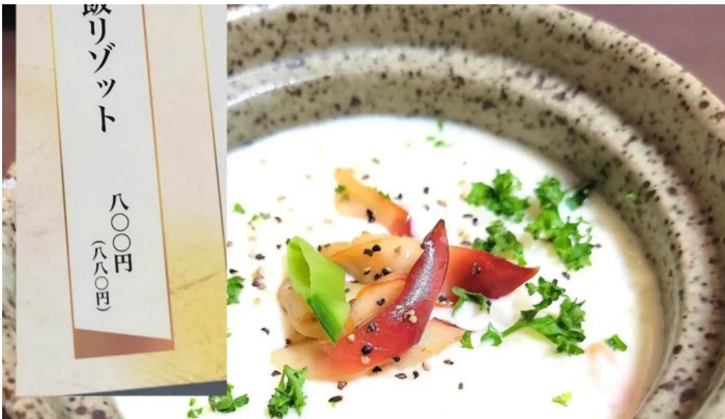
He toHai Qing ru comentario 1