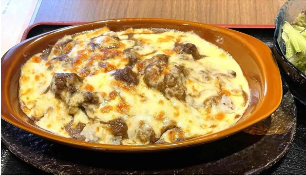
He toHai Qing ru comentario 8