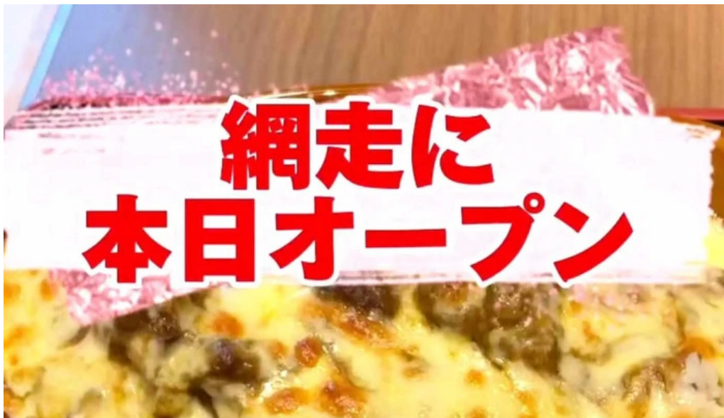
He toHai Qing ru comentario 5