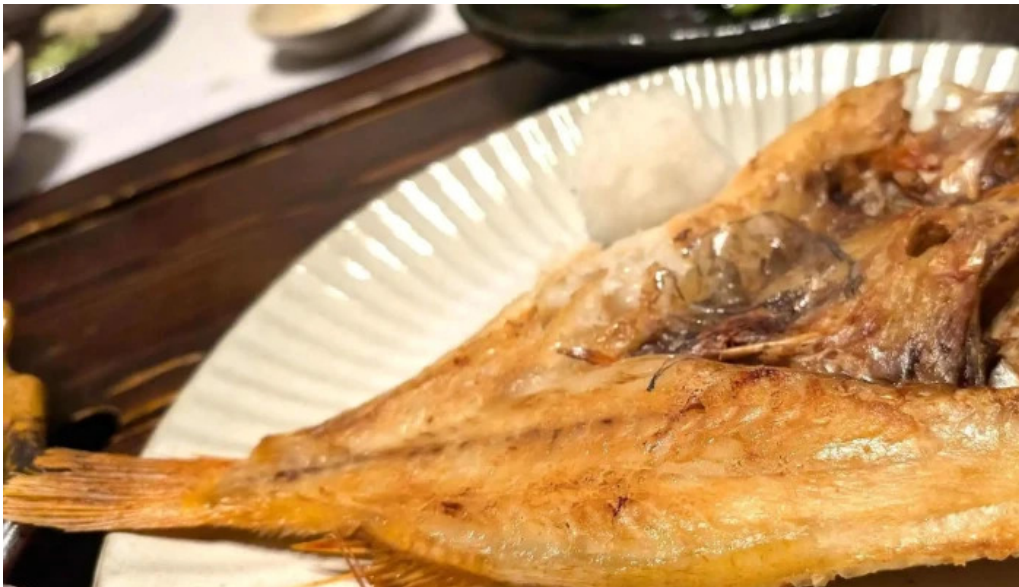
Amisai Wang Cai comentario 5