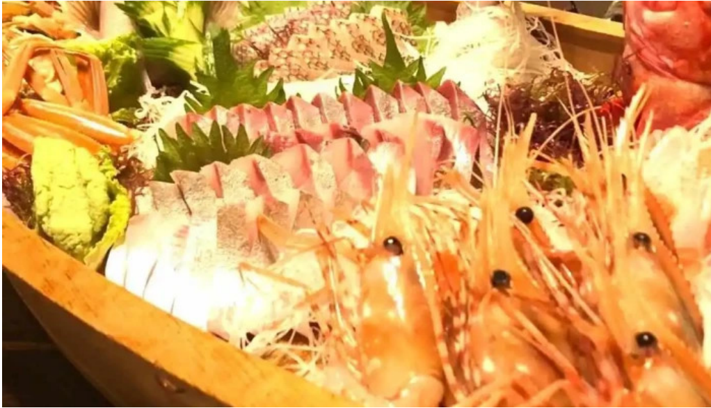
Amisai Wang Cai o na Ti Gong