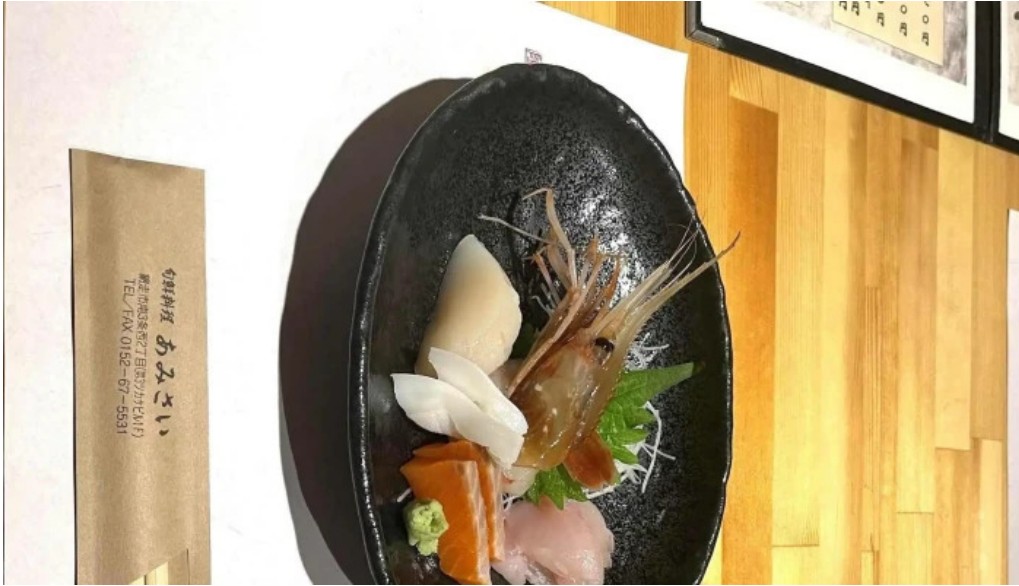
Amisai Wang Cai comentario 2