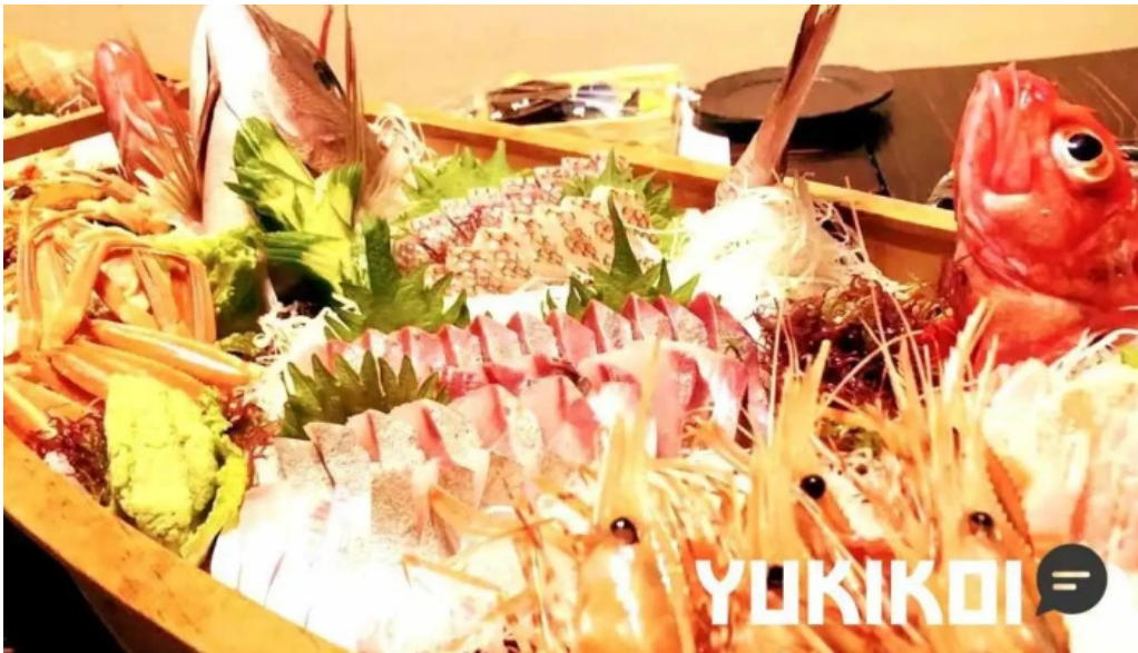
Amisai Wang Cai subete