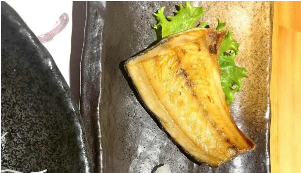
Amisai Wang Cai comentario 3