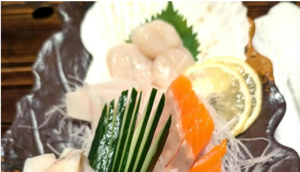
Amisai Wang Cai comentario 7