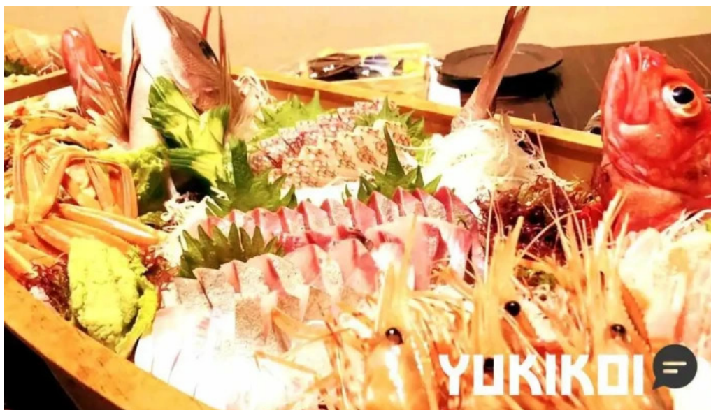
あみさい 網彩 網走市