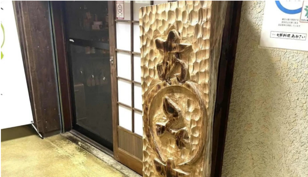
Amisai Wang Cai comentario 1