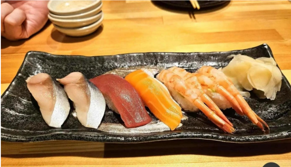
Amisai Wang Cai Liao Li Yin miWu