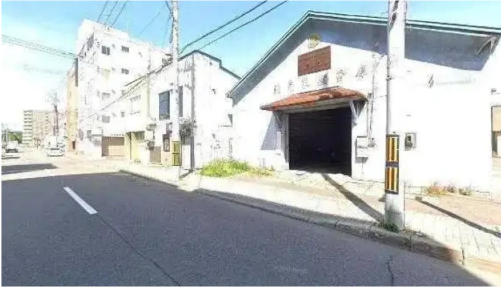
Amisai Wang Cai sutori tobiyu to 360 biyu