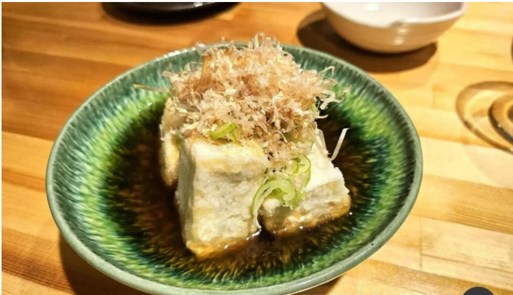
Amisai Wang Cai Yang geChu shiDou Fu