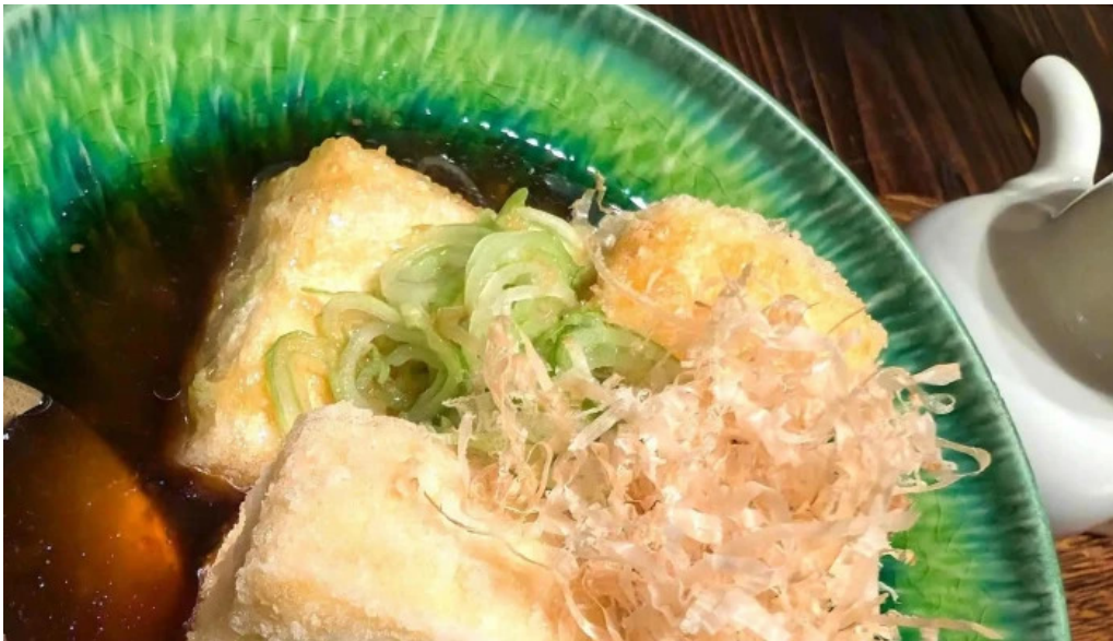
Amisai Wang Cai comentario 6