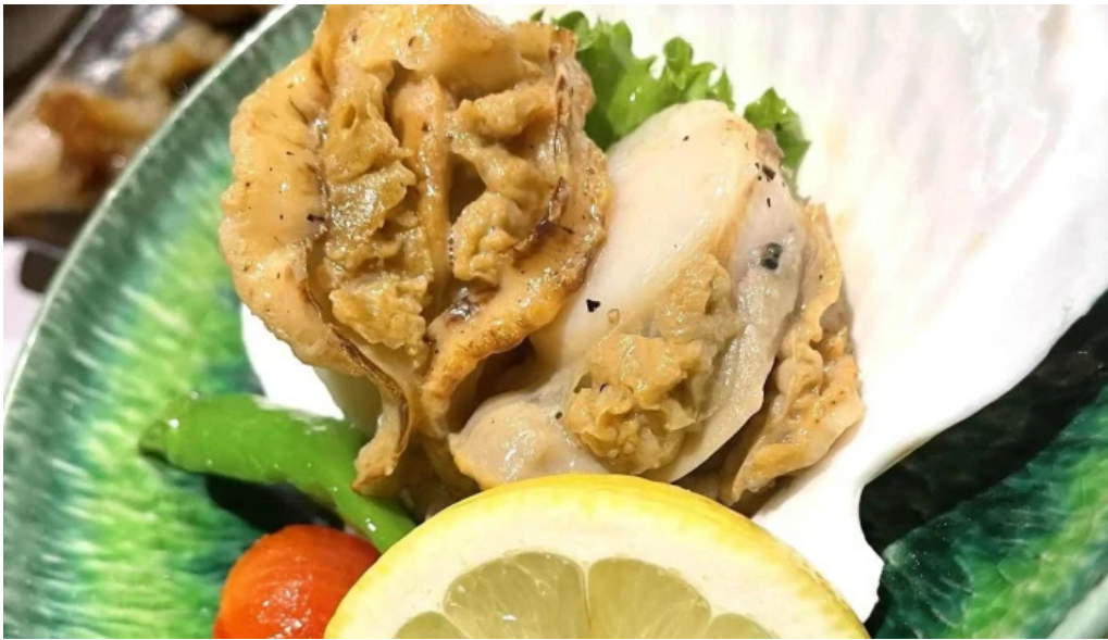
Amisai Wang Cai comentario 4