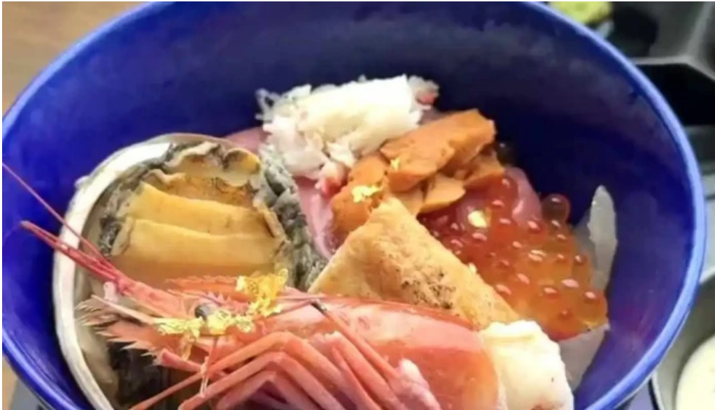
糸島海鮮堂 二見ヶ浦本店 動画