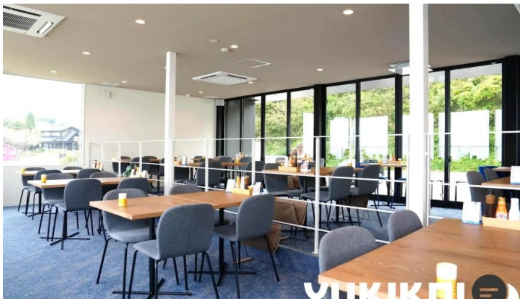
糸島海鮮堂 二見ヶ浦本店 雰囲気