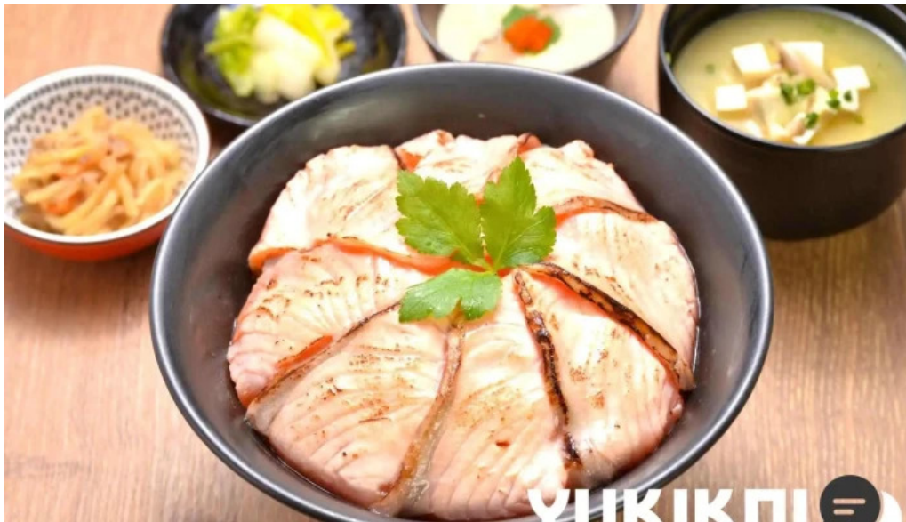
糸島海鮮堂 二見ヶ浦本店 丼物