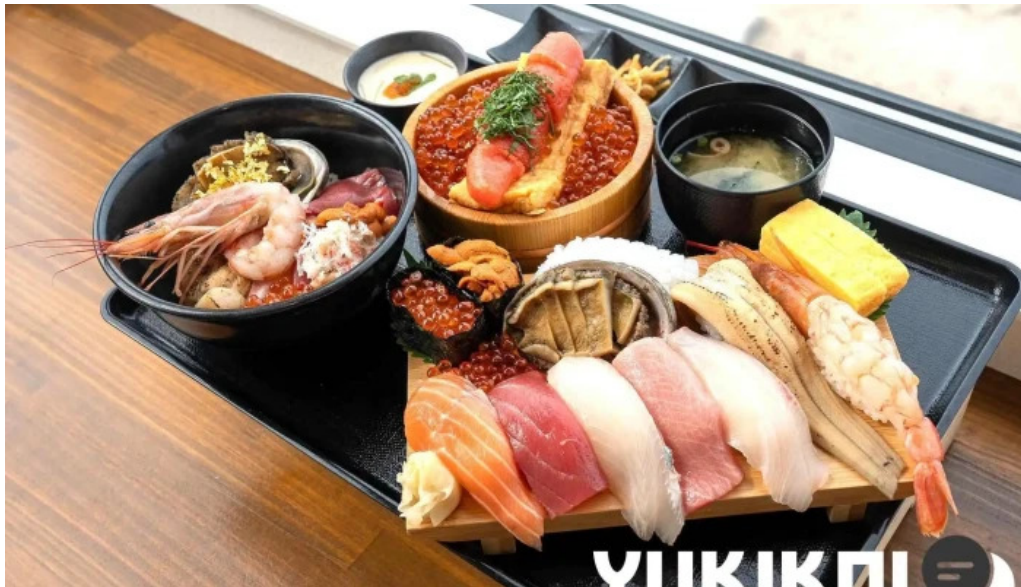
糸島海鮮堂 二見ヶ浦本店 寿司