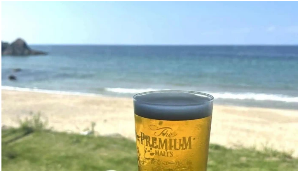
糸島海鮮堂 二見ヶ浦本店 ビール