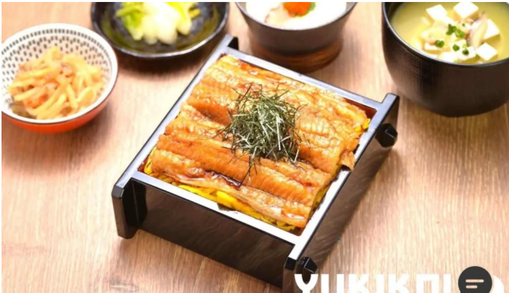
糸島海鮮堂 二見ヶ浦本店 料理飲み物