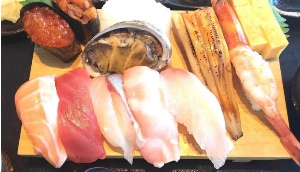
糸島海鮮堂 二見ヶ浦本店 料金