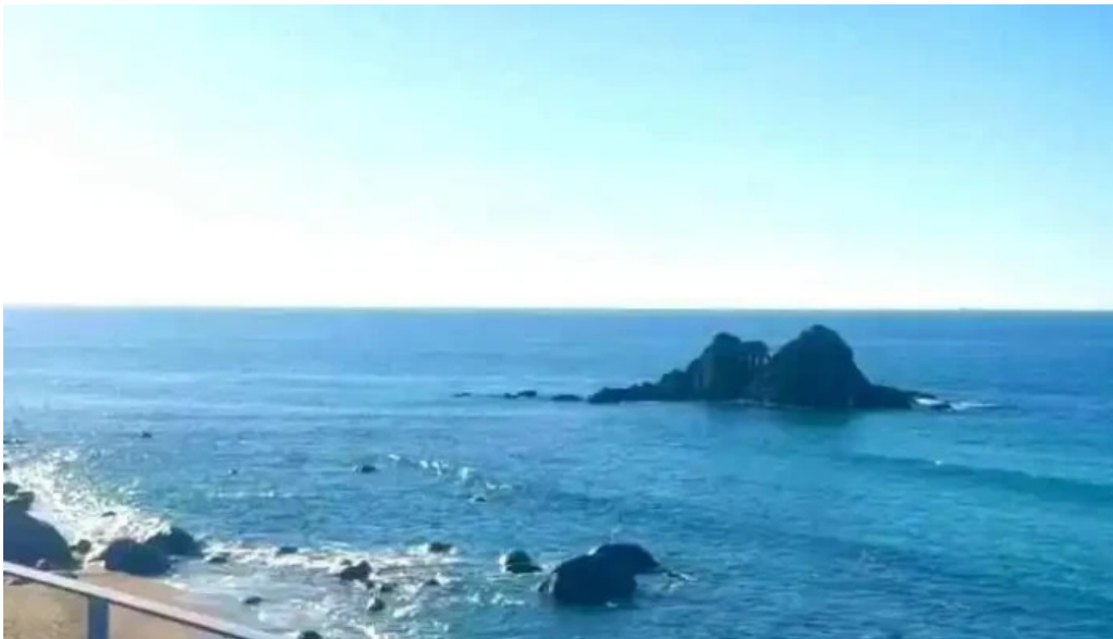
糸島海鮮堂 二見ヶ浦本店 オーナー提供