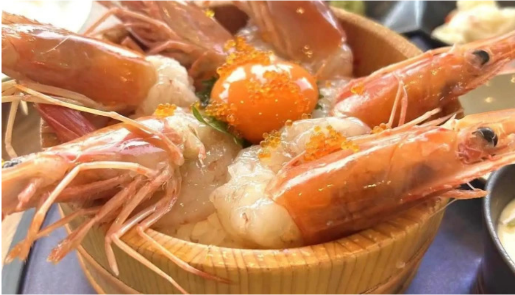
糸島海鮮堂 二見ヶ浦本店 スキャンピ