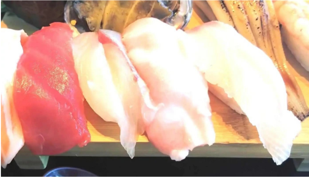
糸島海鮮堂 二見ヶ浦本店 口コミ