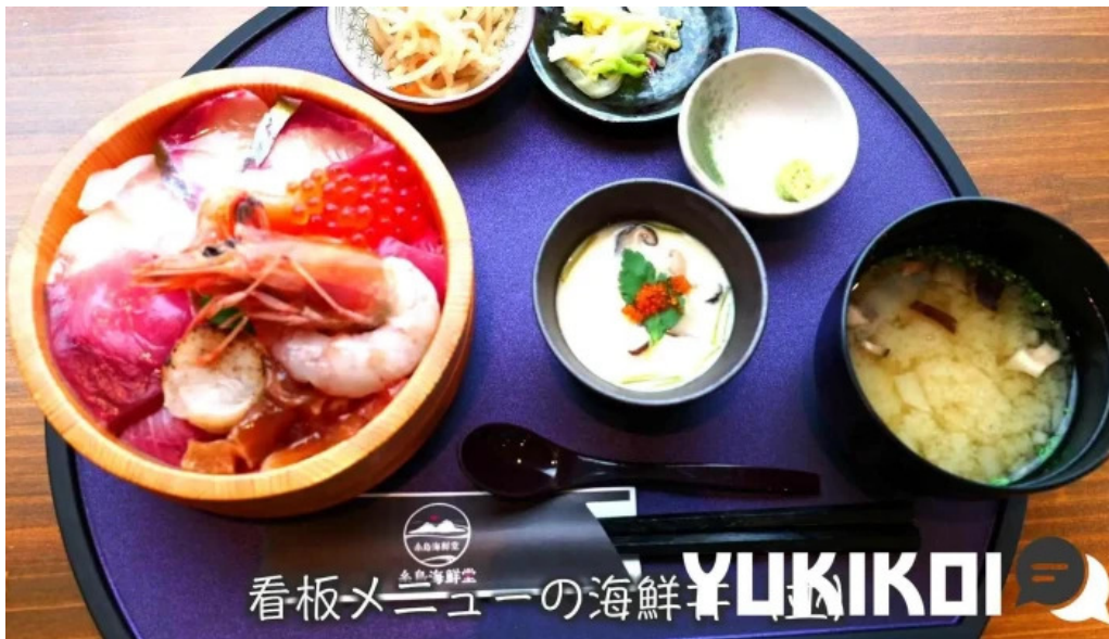
糸島海鮮堂 二見ヶ浦本店 スープ