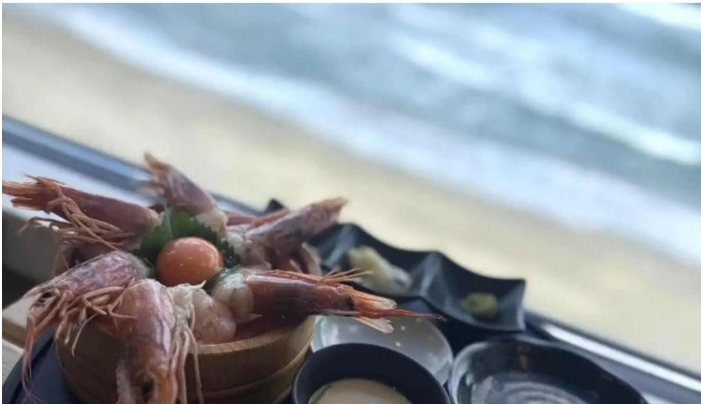
糸島海鮮堂 二見ヶ浦本店 最新