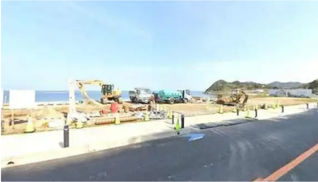
糸島海鮮堂 二見ヶ浦本店 福岡市