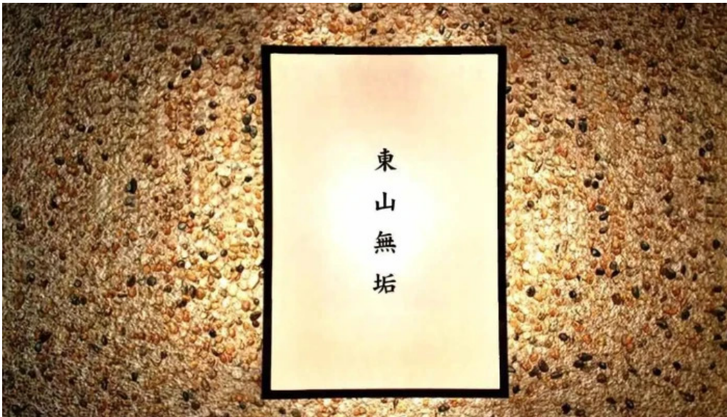
東山無垢