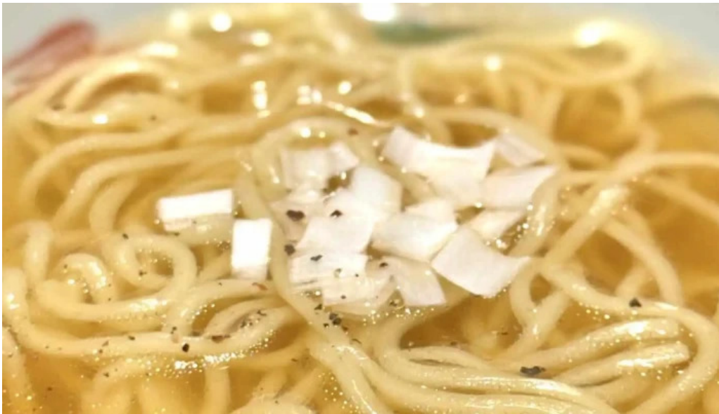
東山無垢 ラーメン