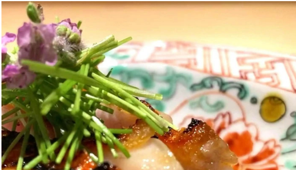
東山無垢 プロモーション