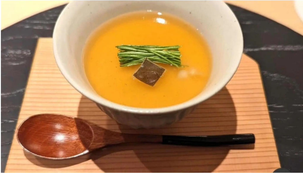
東山無垢 茶碗蒸し