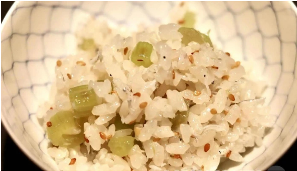
東山無垢 料理飲み物