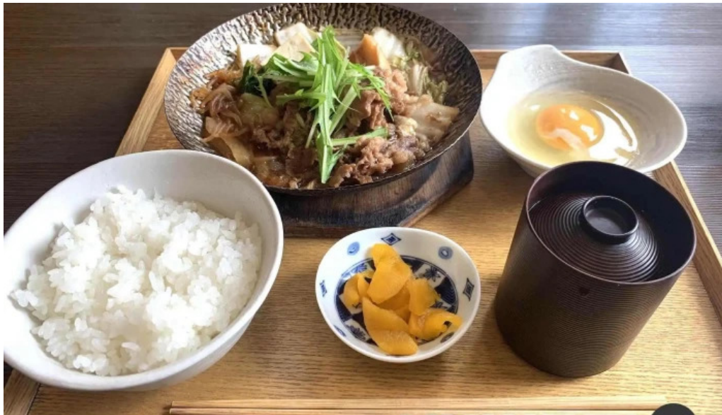
つきはし すき焼き