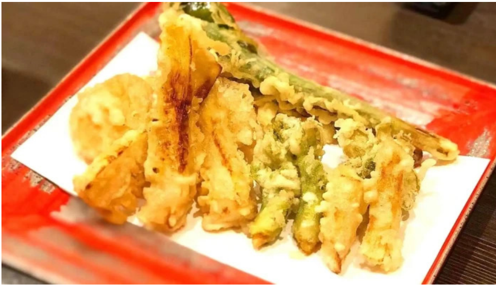
つきはし プロモーション