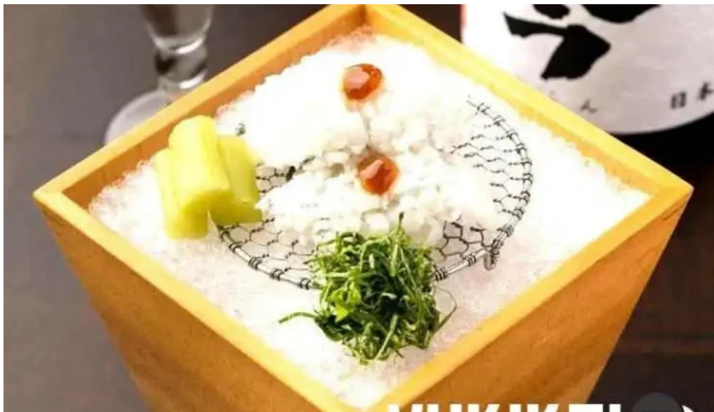
つきはし 料理飲み物