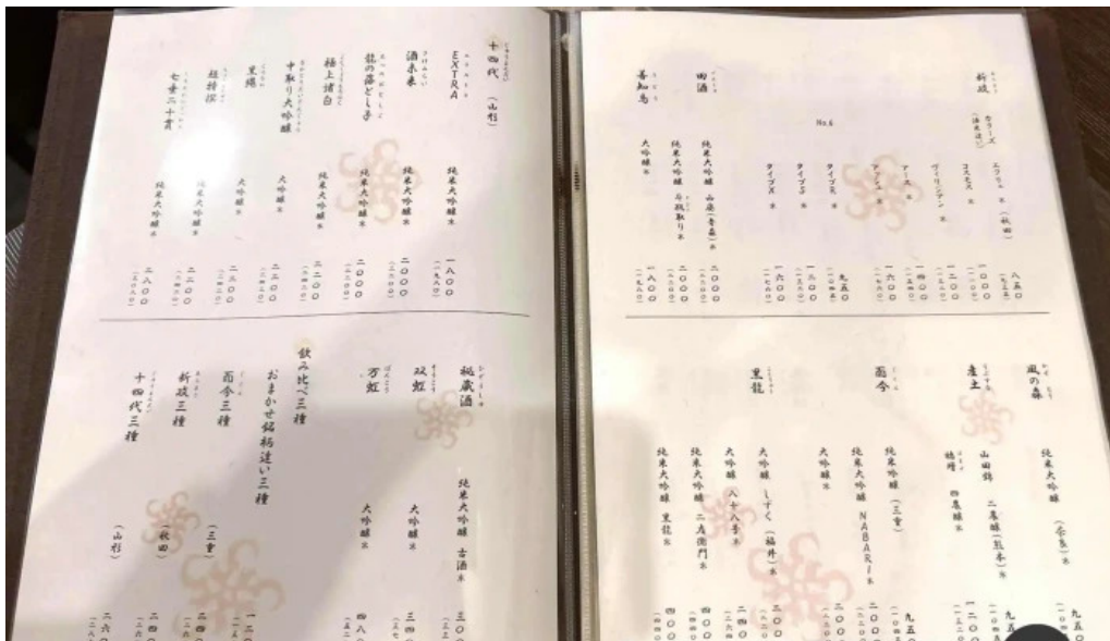
つきはし メニュー