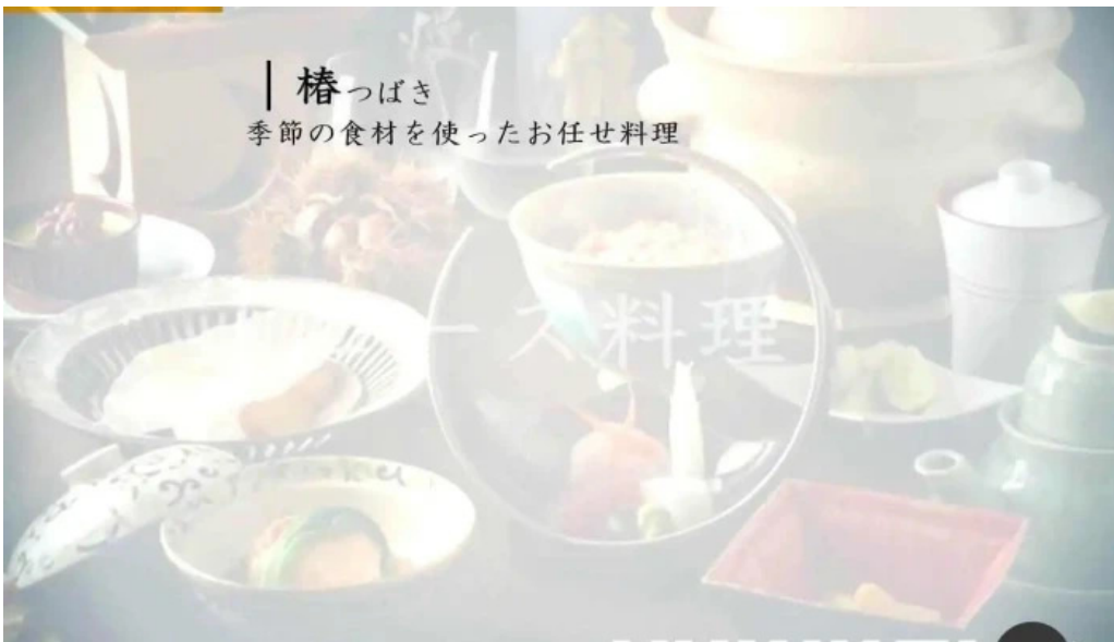
つきはし オーナー提供