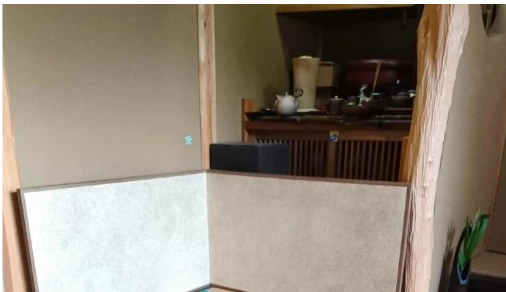
桜庵 ウェブサイト