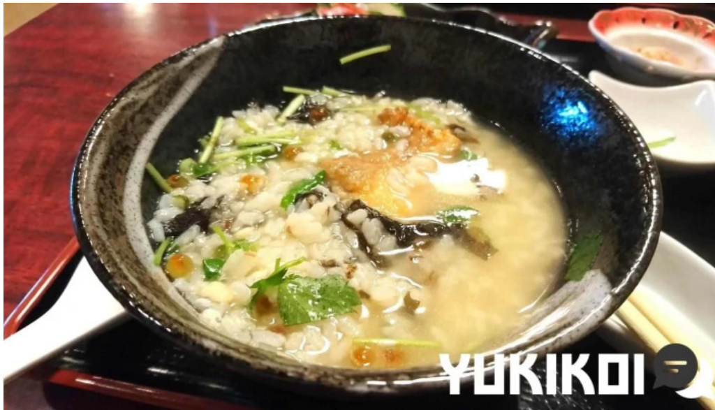
割烹 いなほ スープ