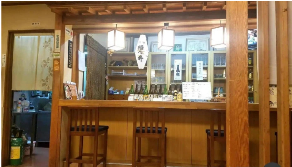
割烹 いなほ 雰囲気