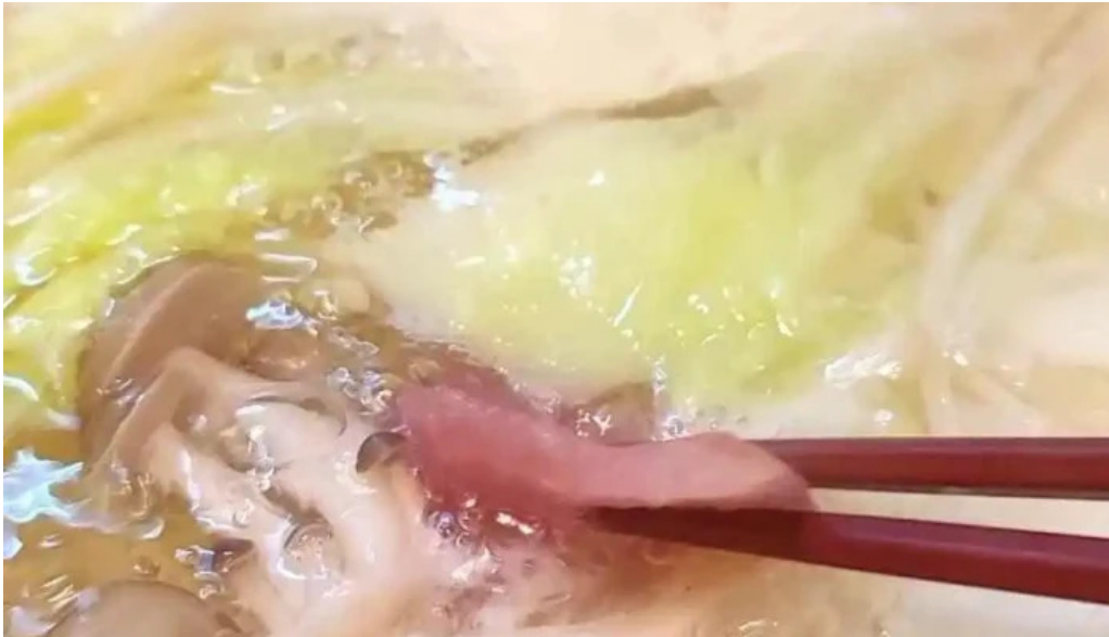
割烹 いなほ 動画