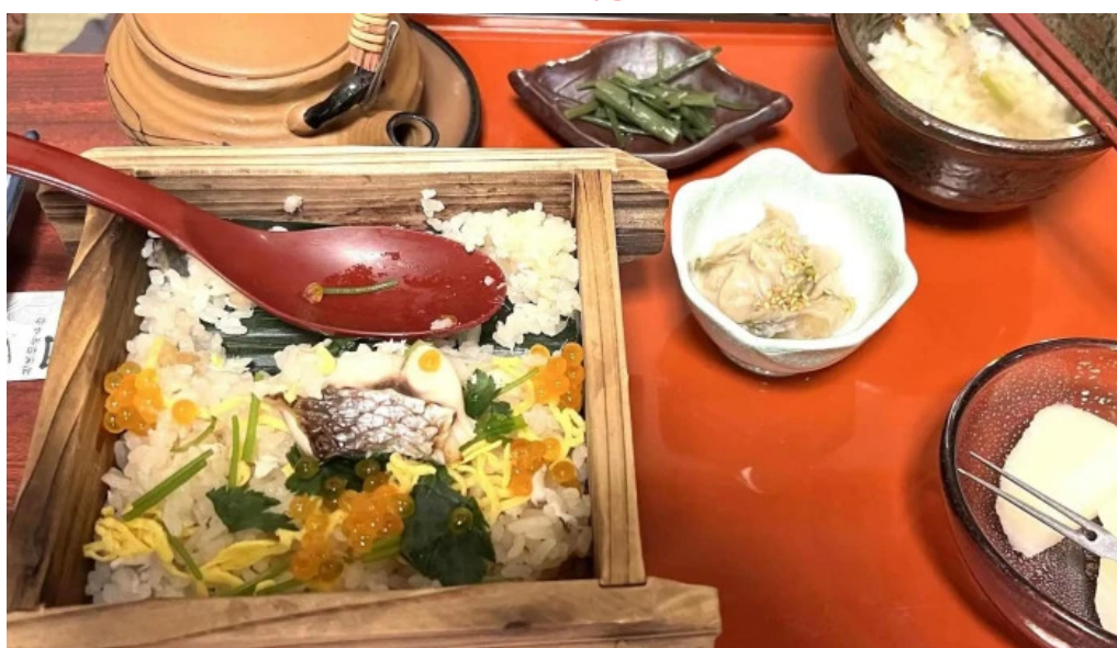
割烹 いなほ 電話