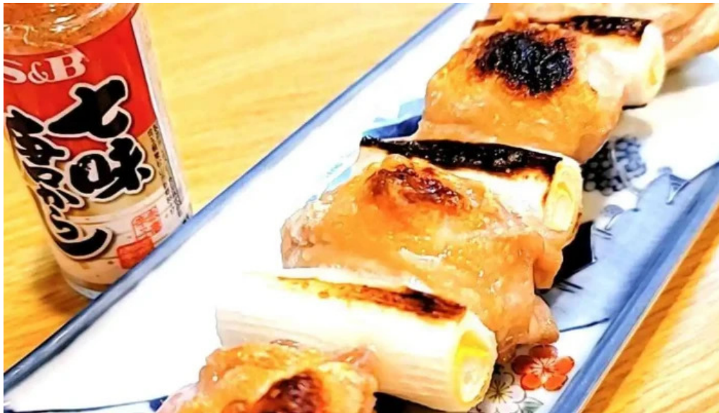
割烹 いなほ 料理飲み物