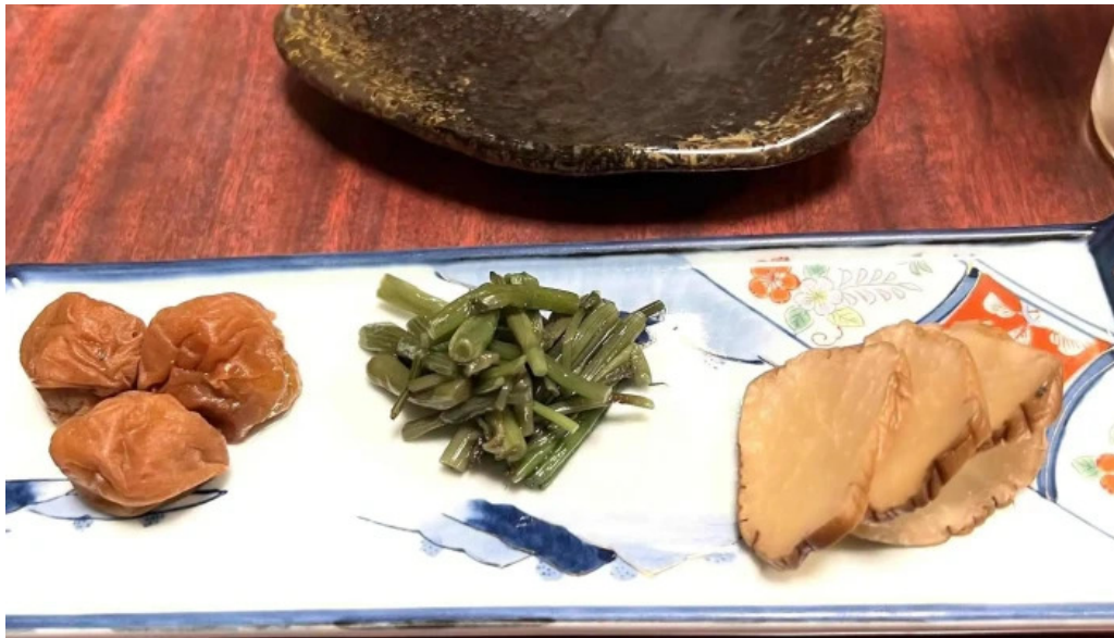
割烹 いなほ エリア