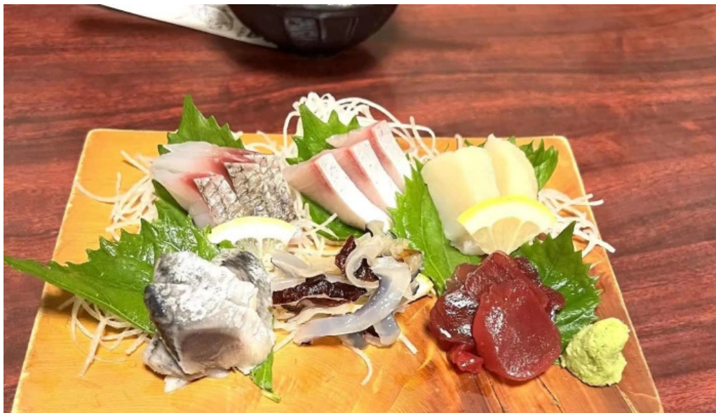
割烹 いなほ どこ