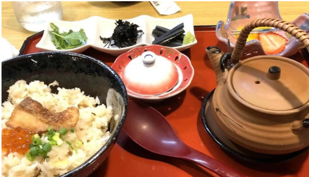
割烹 いなほ ウェブサイト