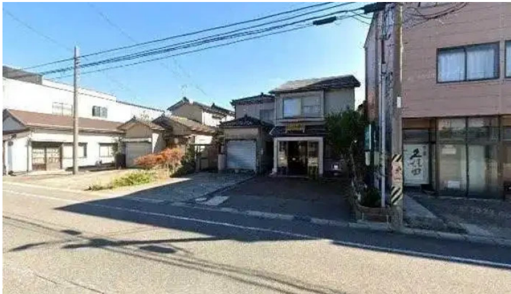
割烹 いなほ 柏崎市