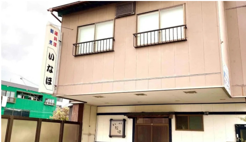
割烹 いなほ 写真