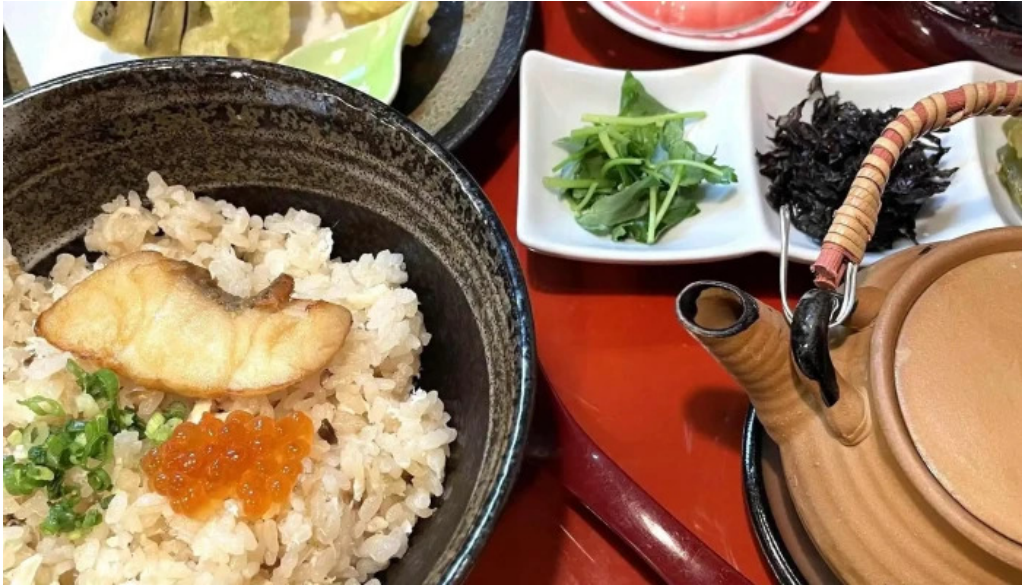
割烹 いなほ 口コミ