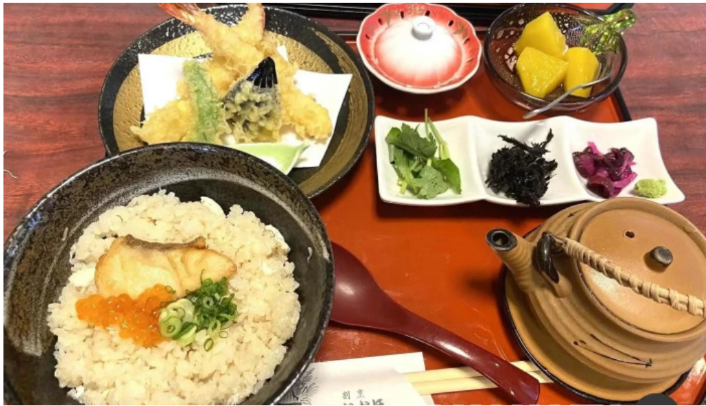
割烹 いなほ 茶漬け