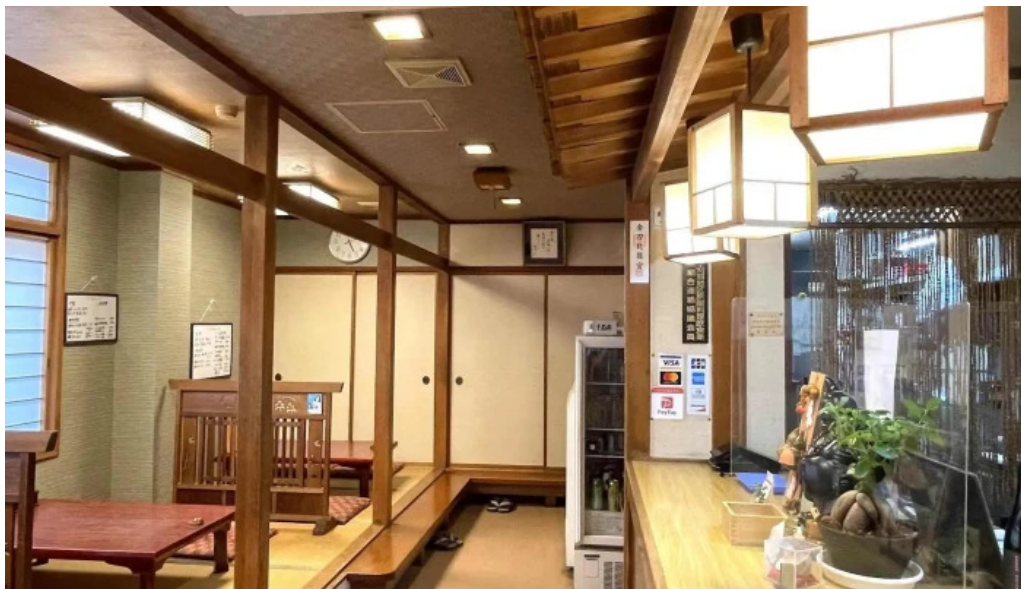
割烹 いなほ 行き方