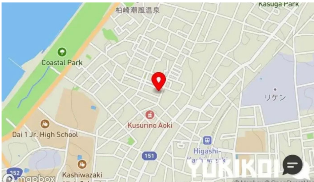
割烹 いなほ 地図