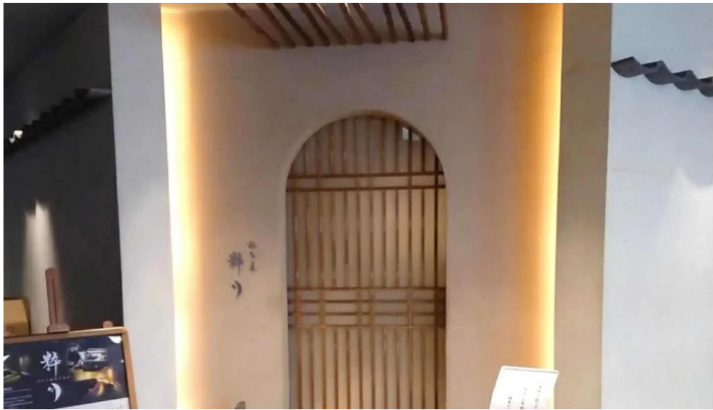
粋月 プロモーション