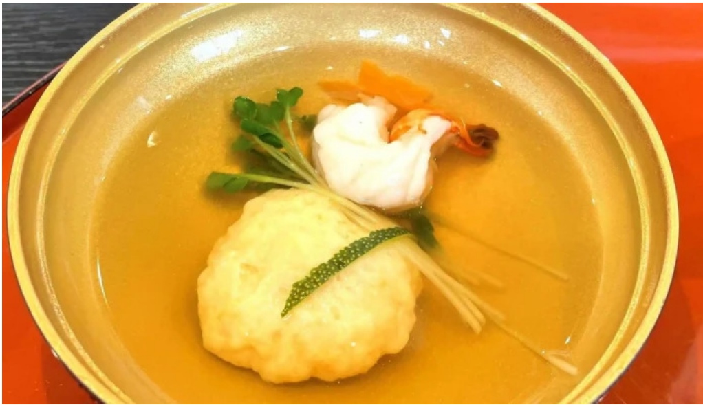
日本料理 割烹 一の谷 プロモーション