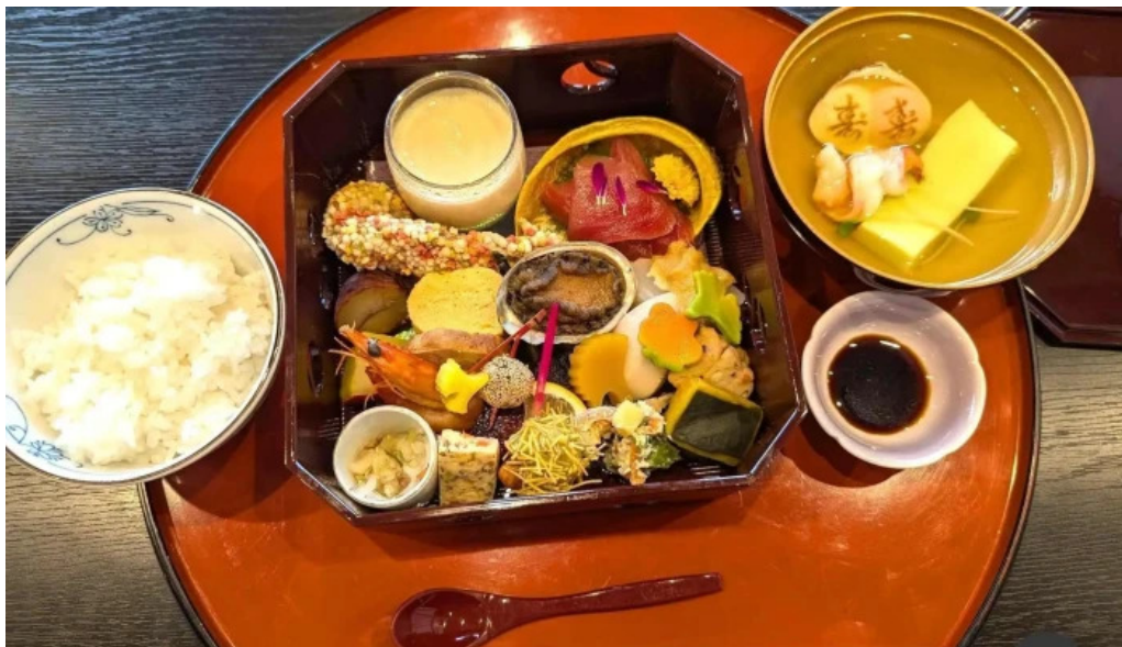
日本料理 割烹 一の谷 懐石