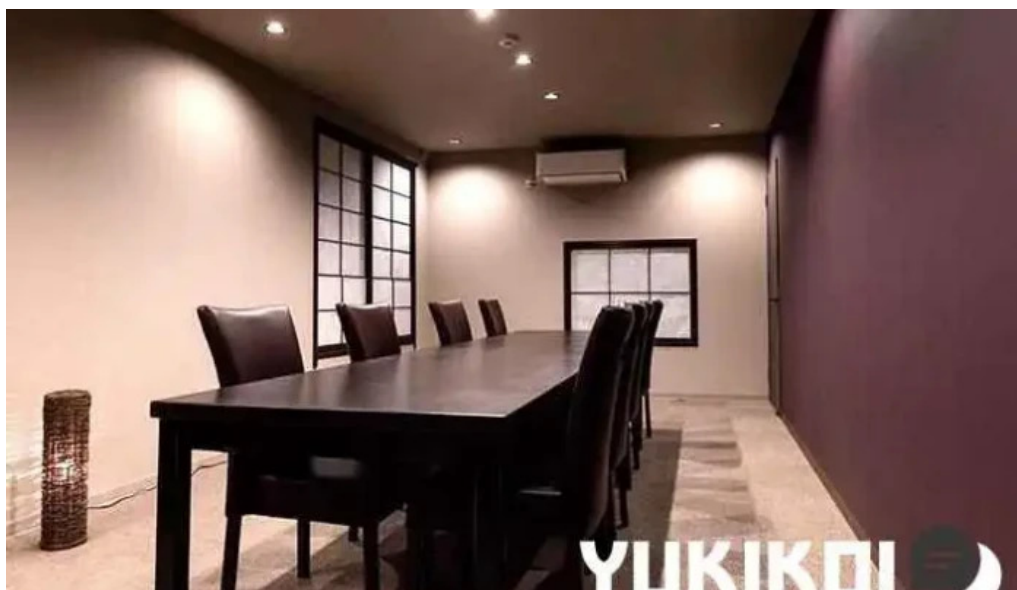
日本料理 割烹 一の谷 雰囲気