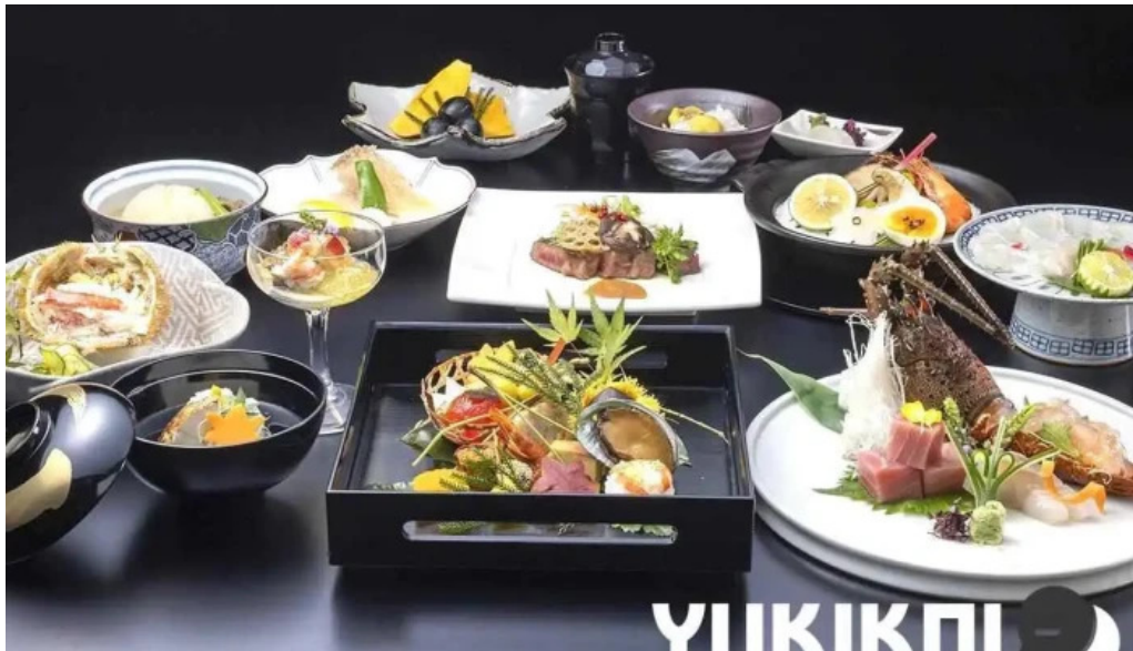
日本料理 割烹 一の谷 料理飲み物