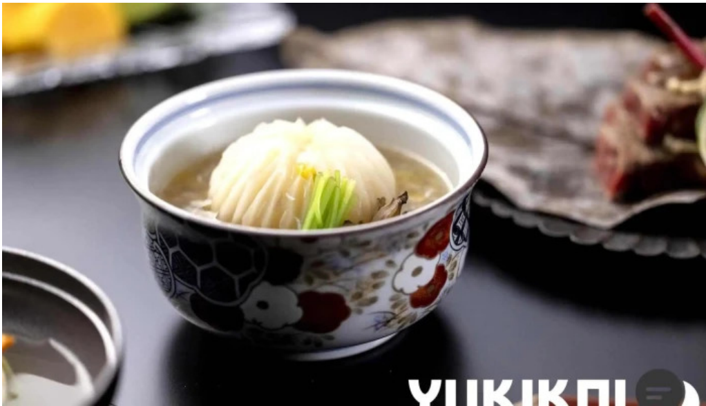
日本料理 割烹 一の谷 スープ