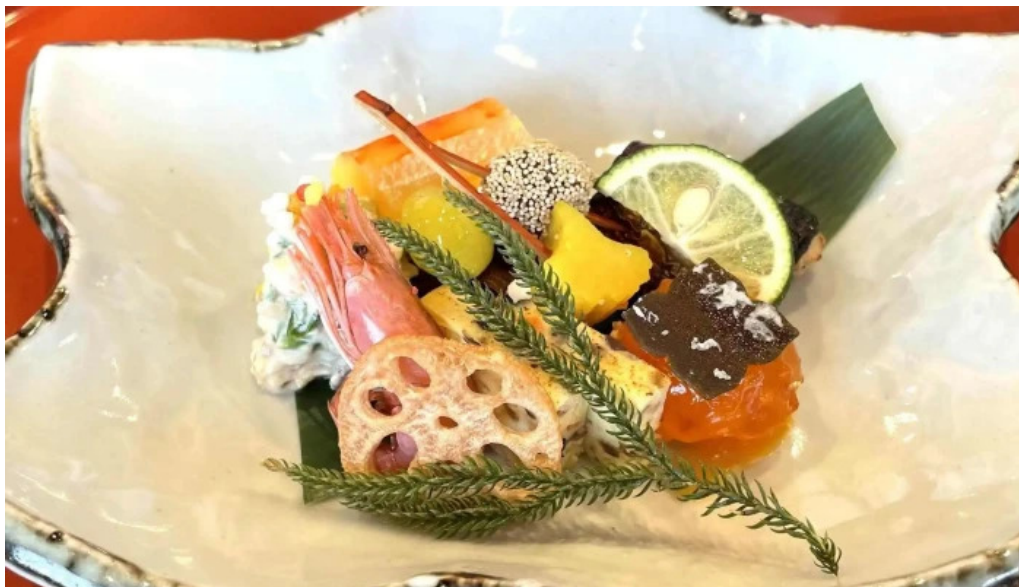
日本料理 割烹 一の谷 住所