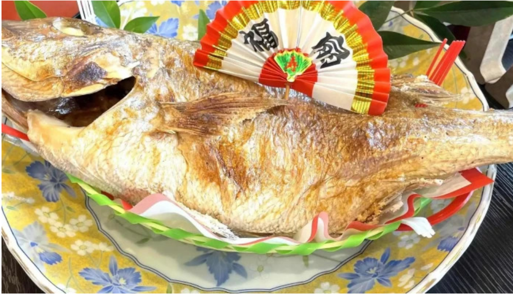
日本料理 割烹 一の谷 行き方