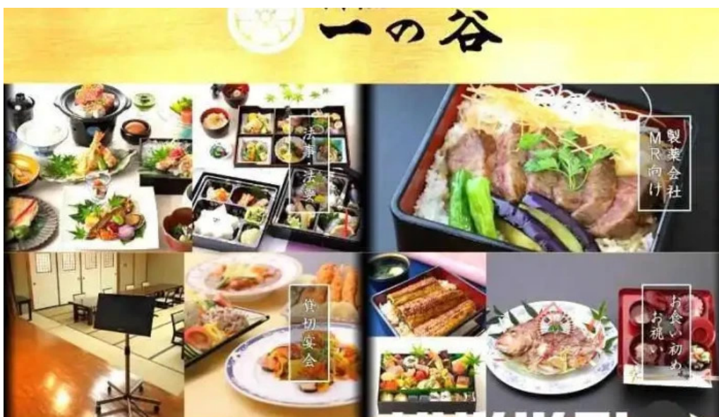
日本料理 割烹 一の谷 メニュー