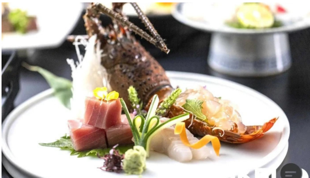
日本料理 割烹 一の谷 シーフード