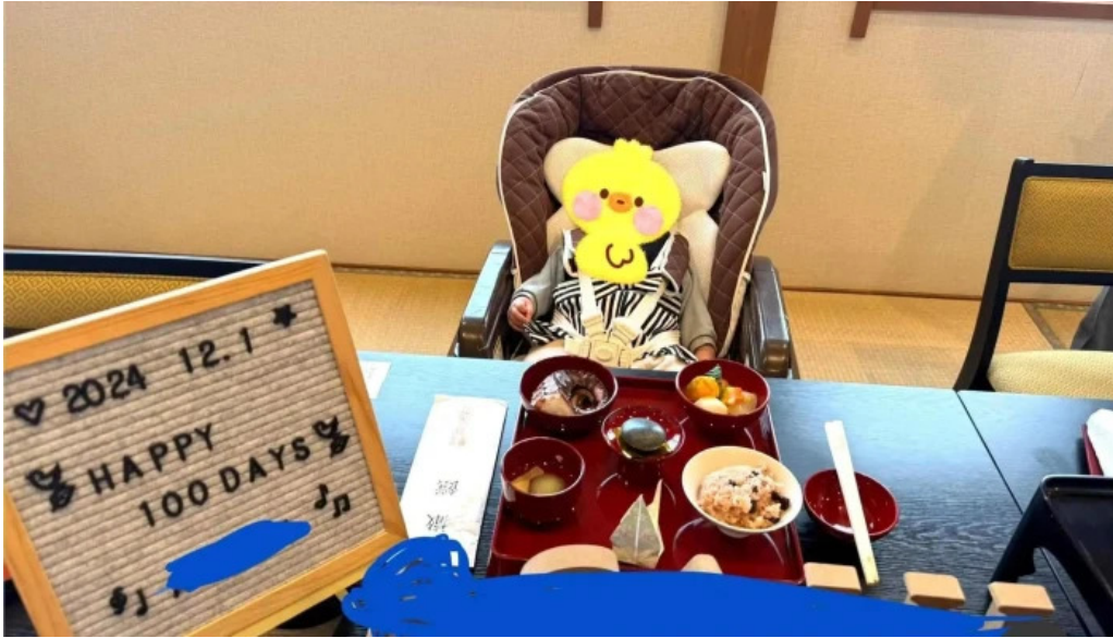
日本料理 割烹 一の谷 最新