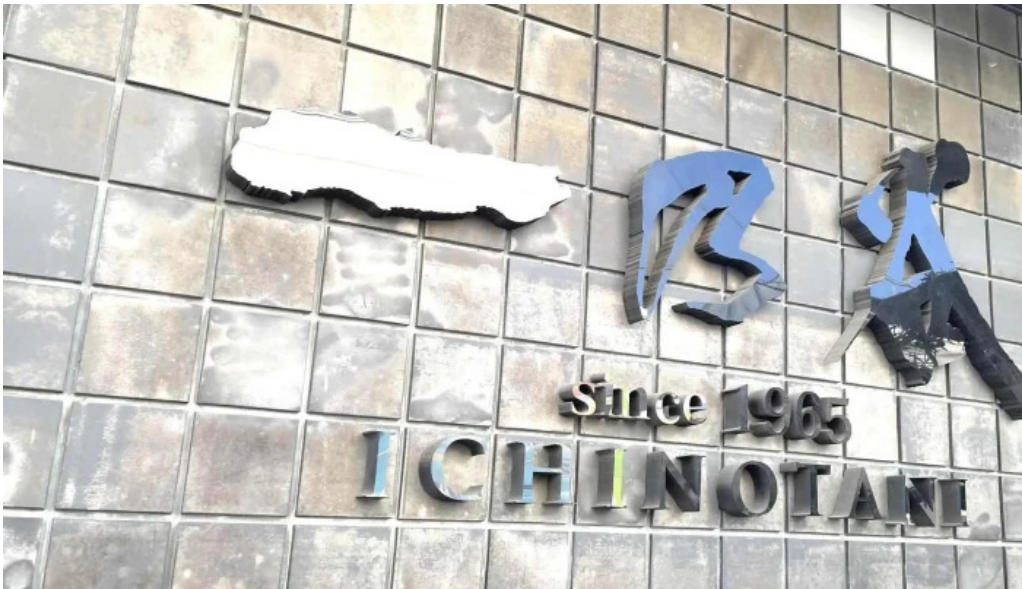
日本料理 割烹 一の谷 料金