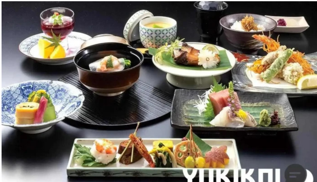
日本料理 割烹 一の谷 寿司