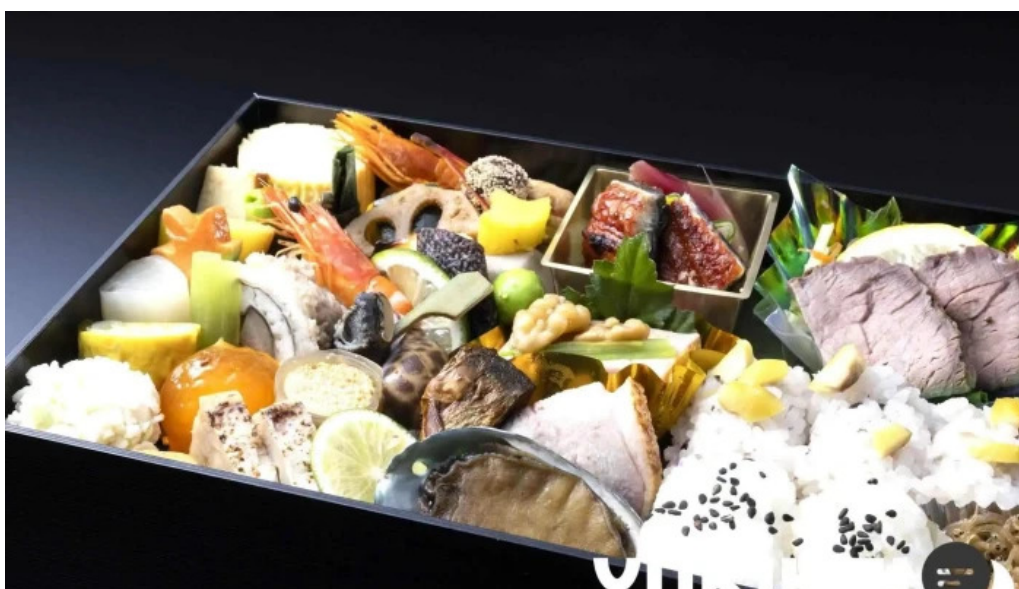
日本料理 割烹 一の谷