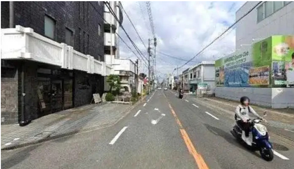
日本料理 割烹 一の谷 枚方市