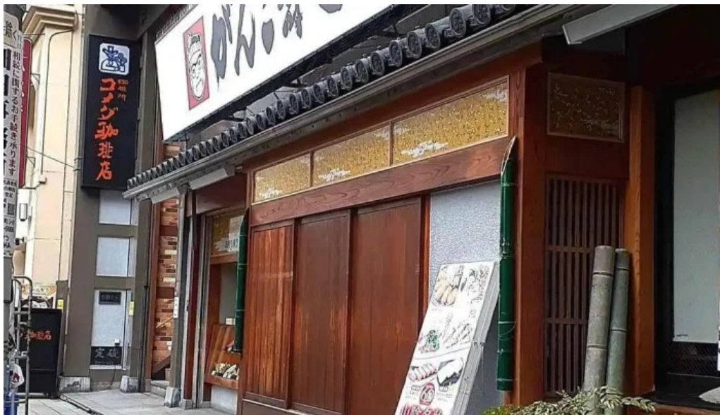
寿司和食 がんこ 枚方店 動画