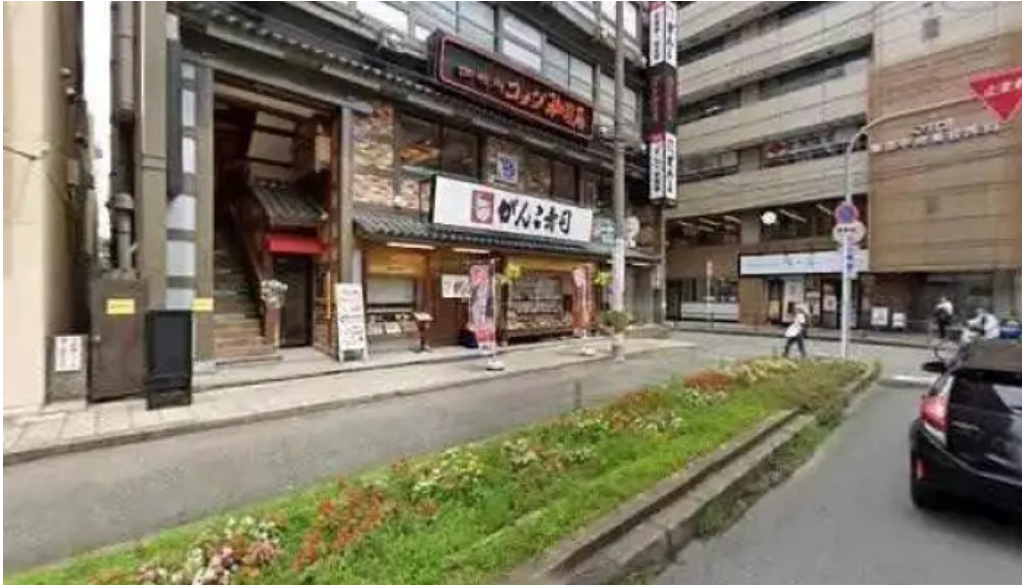
寿司和食 がんこ 枚方店 枚方市