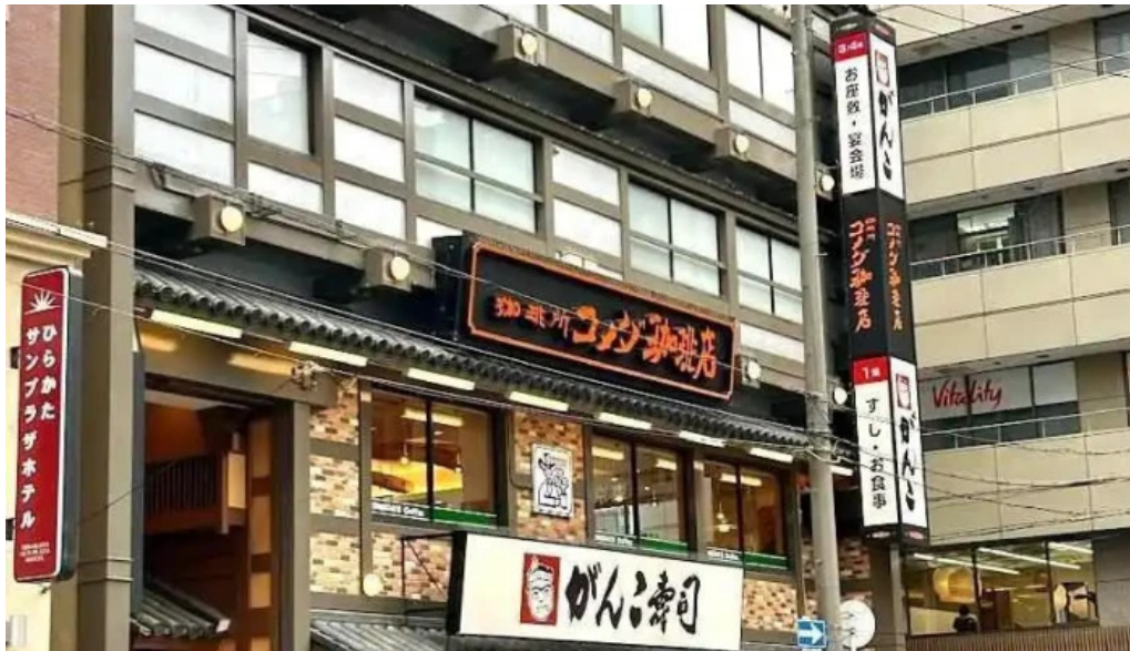
寿司・和食 がんこ 枚方店 枚方市