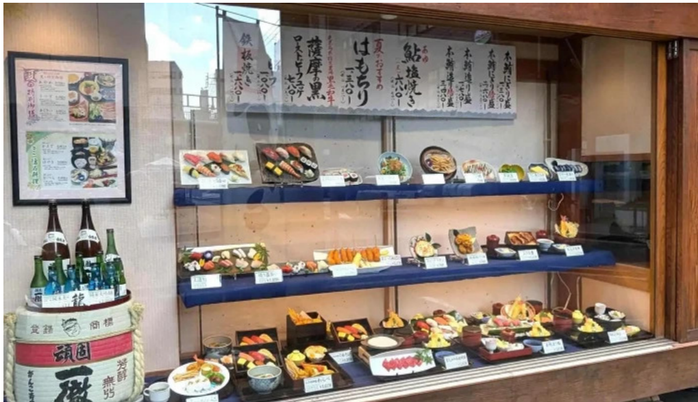
寿司和食 がんこ 枚方店 写真