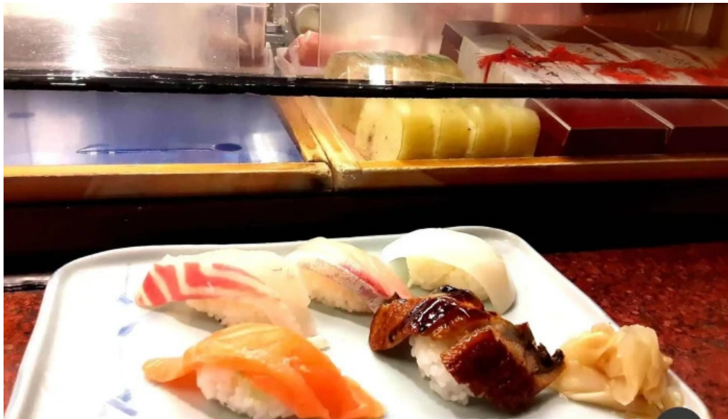
寿司和食 がんこ 枚方店 シーフード