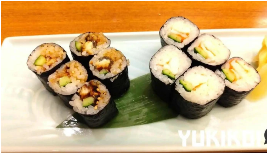
寿司和食 がんこ 枚方店 寿司