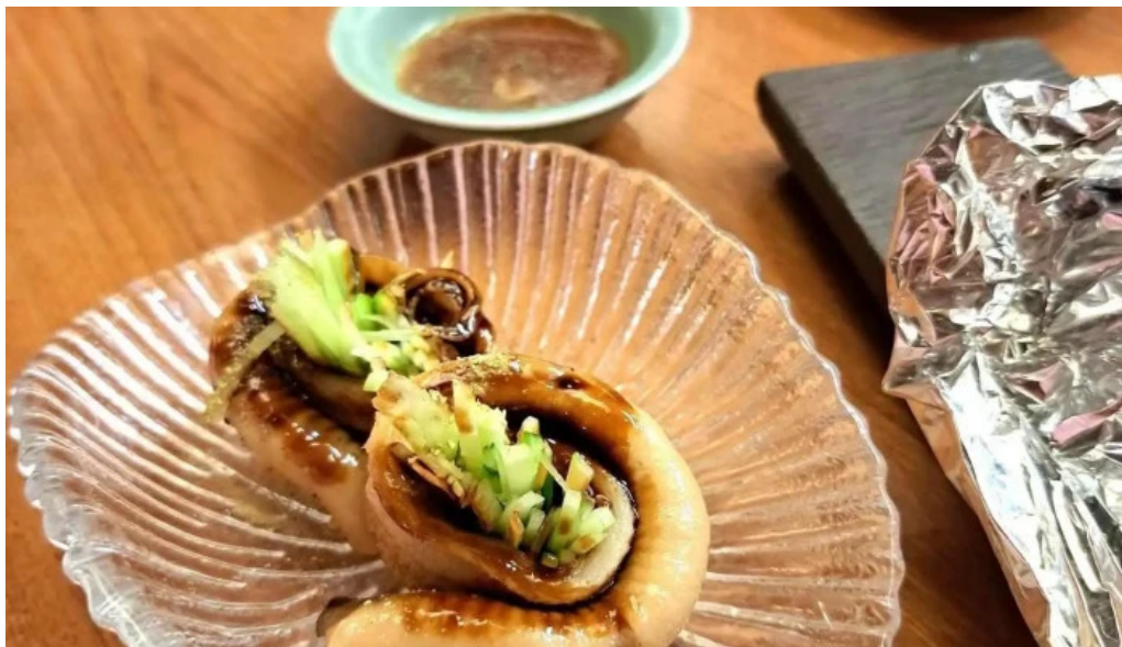
寿司和食 がんこ 枚方店 刺身