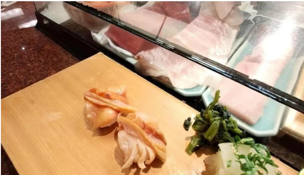
寿司和食 がんこ 枚方店 最新