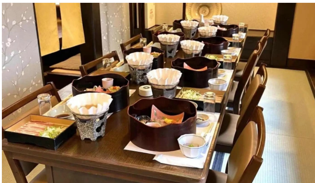
寿司和食 がんこ 枚方店 雰囲気