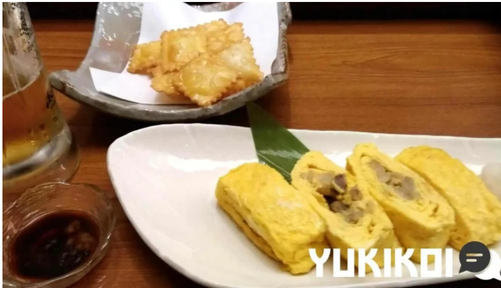
寿司和食 がんこ 枚方店 卵焼き