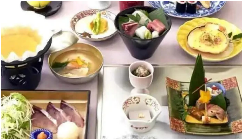
寿司和食 がんこ 枚方店 料理飲み物