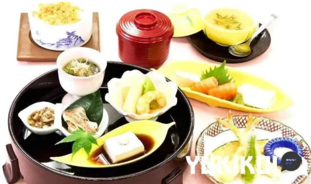
寿司和食 がんこ 枚方店 懐石