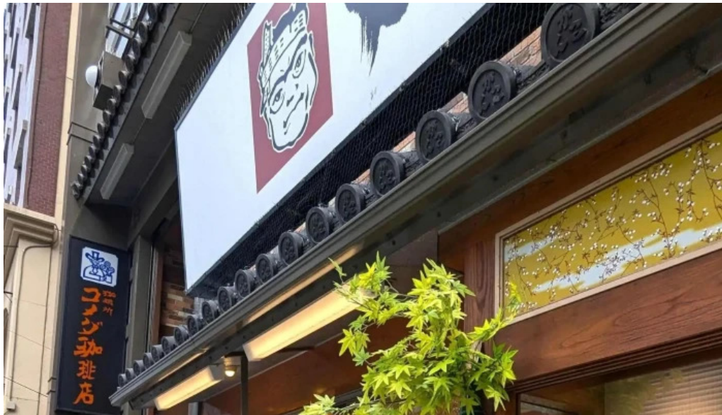
寿司和食 がんこ 枚方店 割引