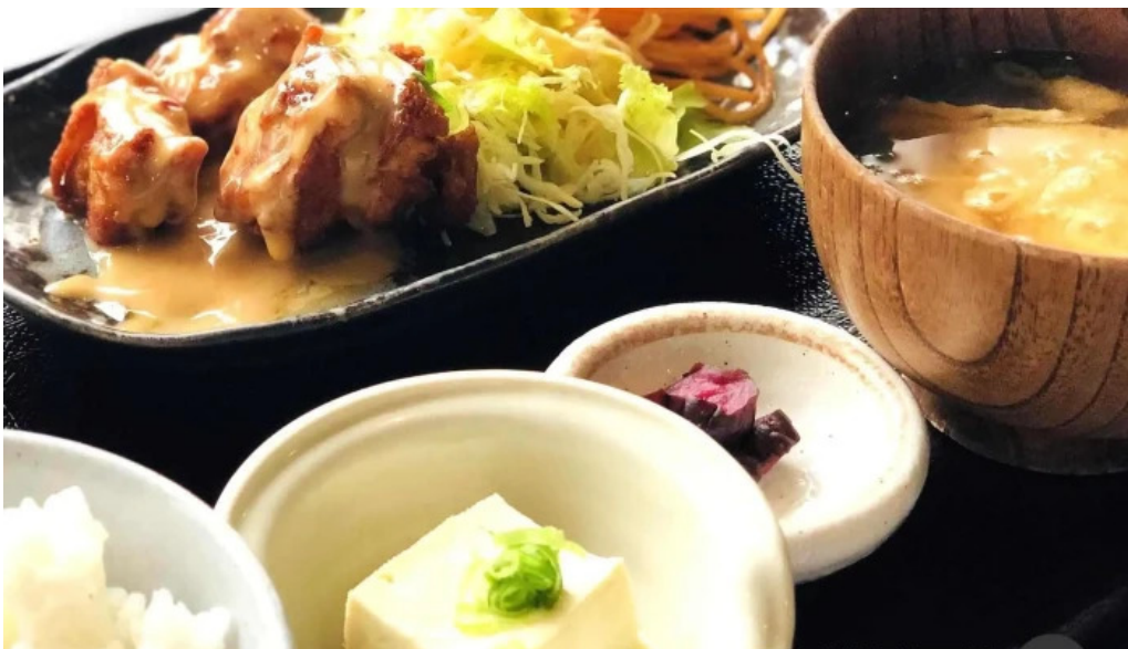
メイズ ダイニング 料理飲み物