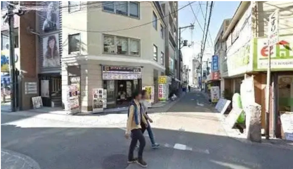
メイズ ダイニング 枚方市