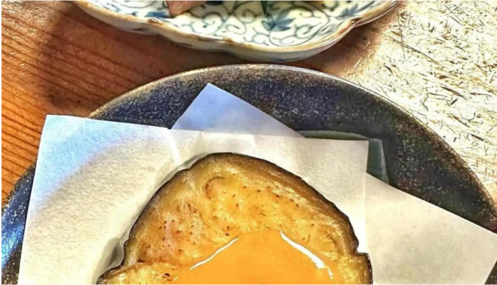
服部亭 カスタード