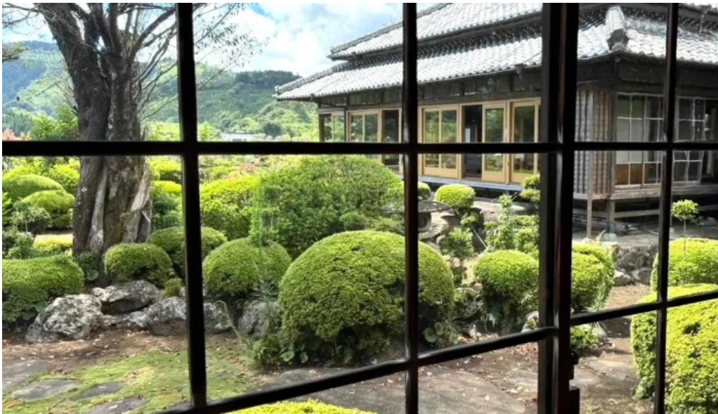
服部亭 ウェブサイト