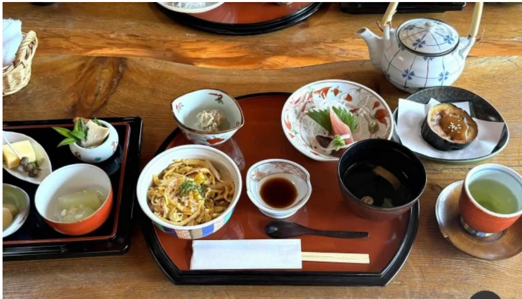
服部亭 料理飲み物