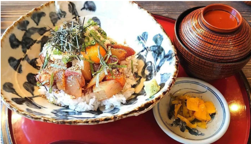
和さび 料理飲み物