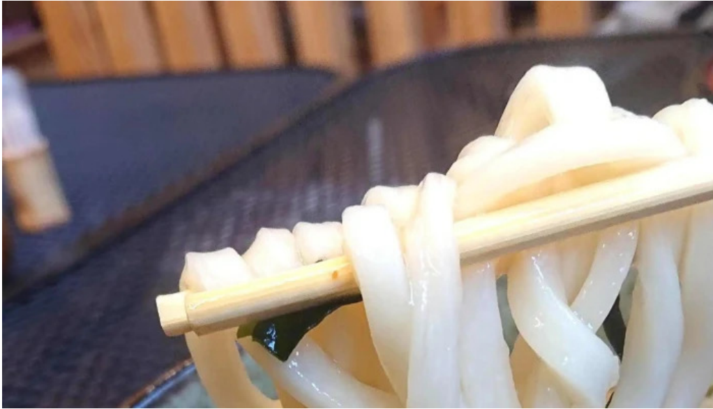
和さび プロモーション