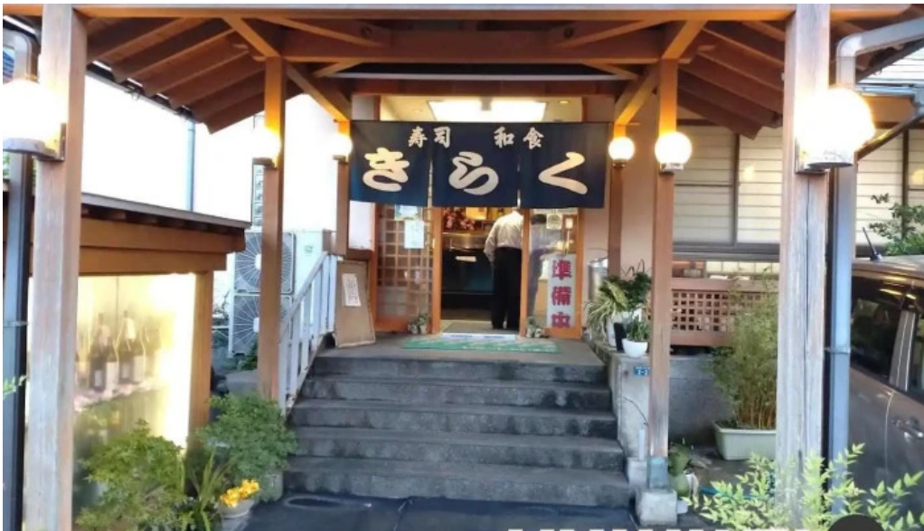
寿司・和食 きらく 志布志市