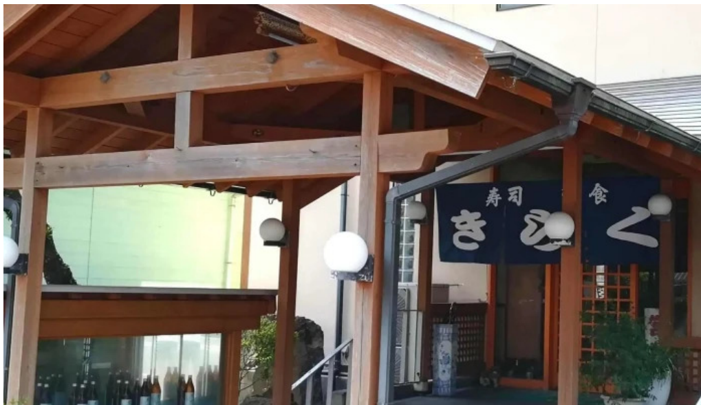
寿司和食 きらく 営業時間