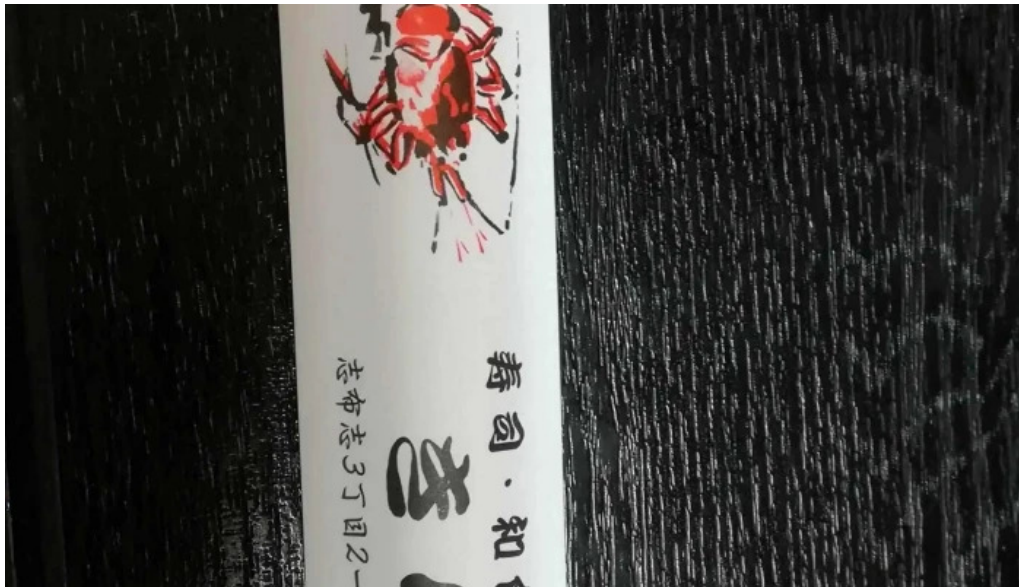
寿司和食 きらく 写真