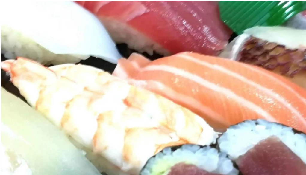
寿司和食 きらく エリア