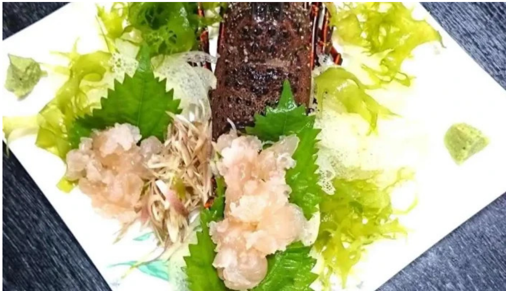
寿司和食 きらく シーフード