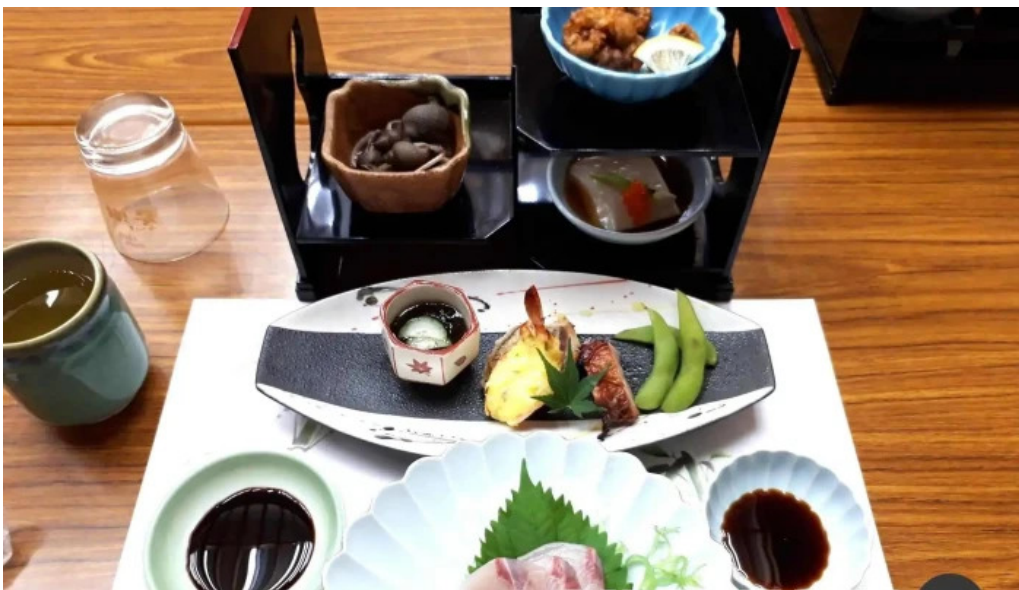
寿司和食 きらく 寿司