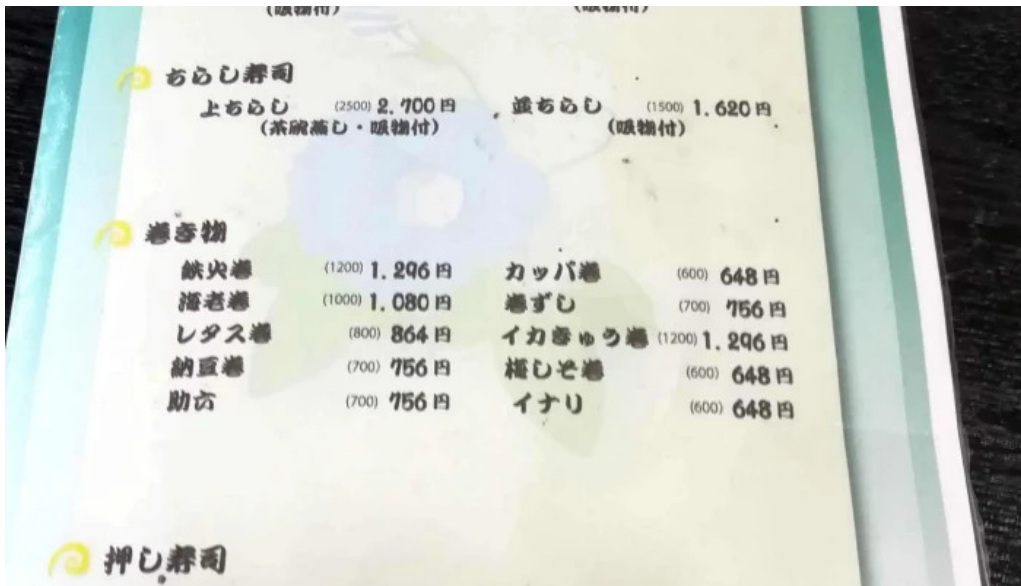
寿司和食 きらく カタログ