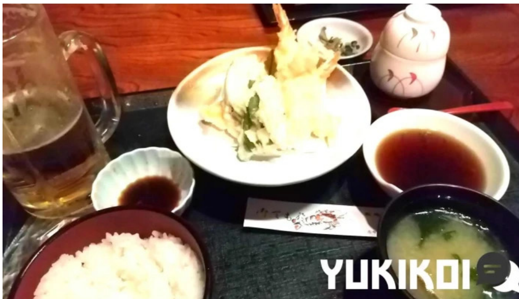
寿司和食 きらく 料理飲み物