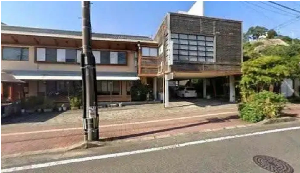
寿司和食 きらく 志布志市