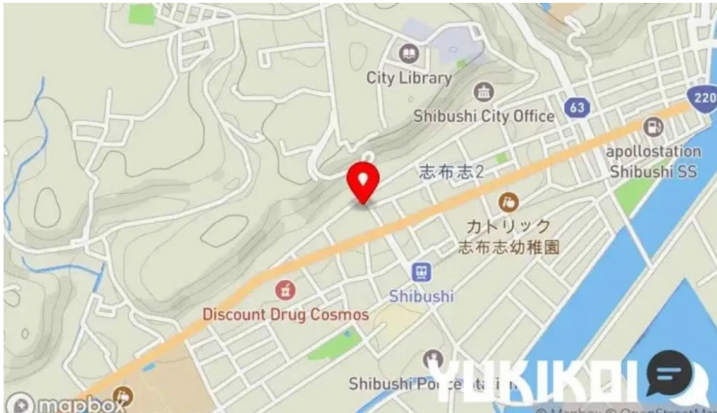
寿司和食 きらく 地図