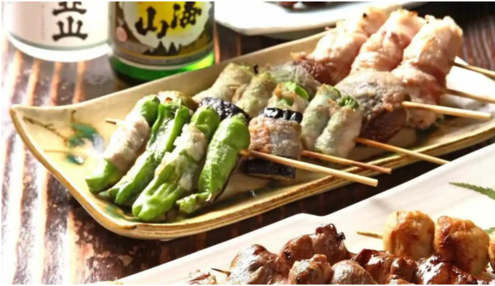
鰻のひろ田 焼き鳥