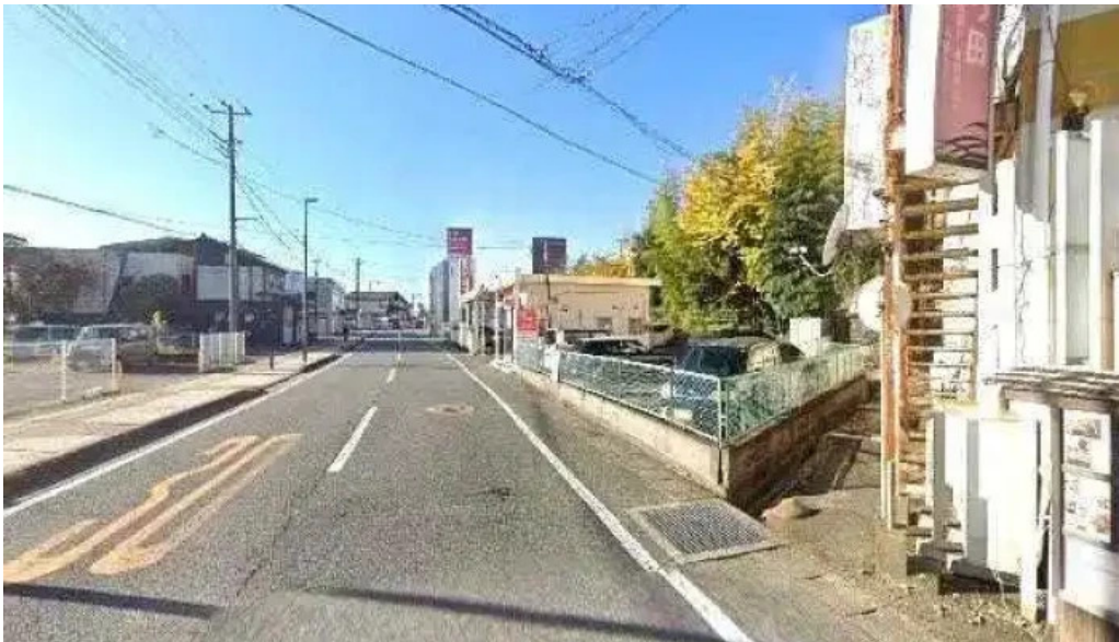
鰻のひろ田 御殿場市