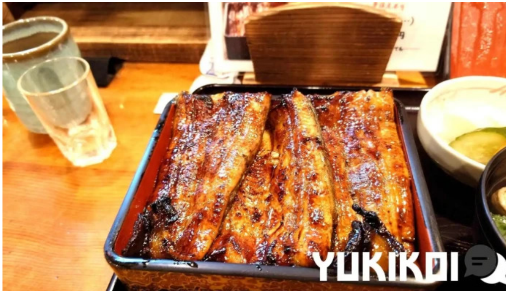
鰻のひろ田 ウナギ