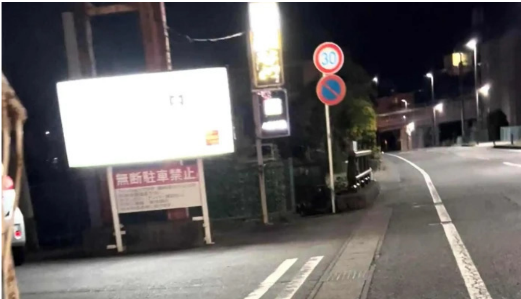
鰻のひろ田 所在地