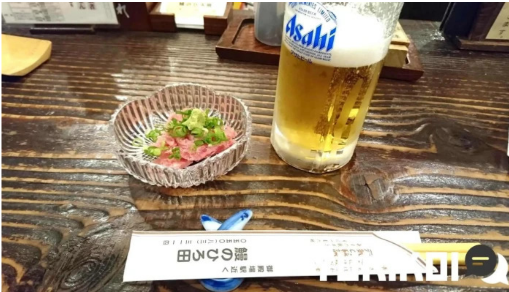
鰻のひろ田ビール