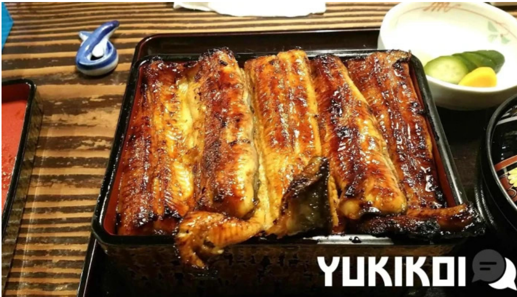
鰻のひろ田シーフード