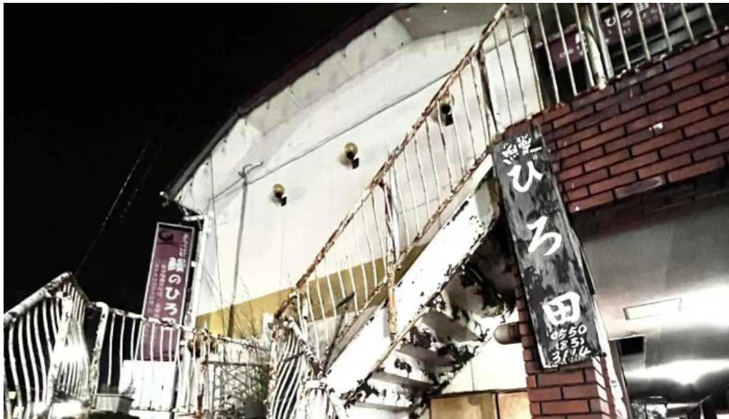
鰻のひろ田 カタログ