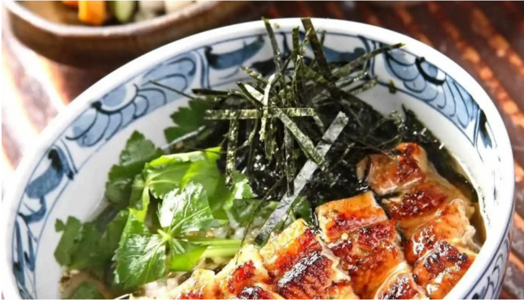
鰻のひろ田 料理飲み物