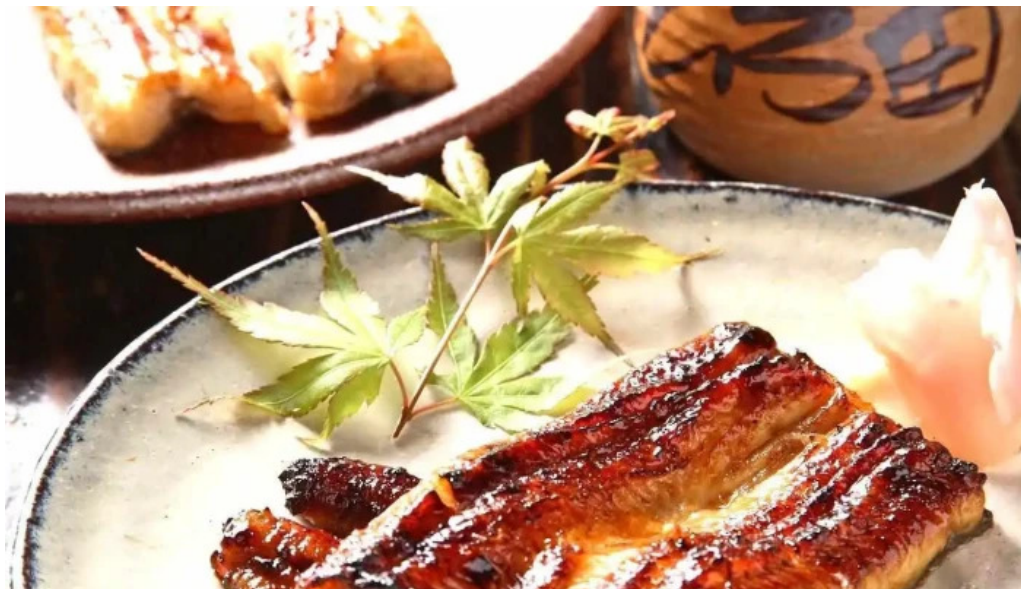
鰻のひろ田 オーナー提供