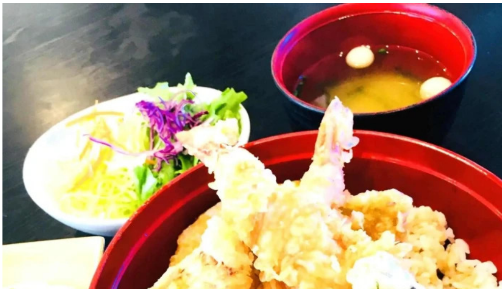
旬菜 やま城 スコア