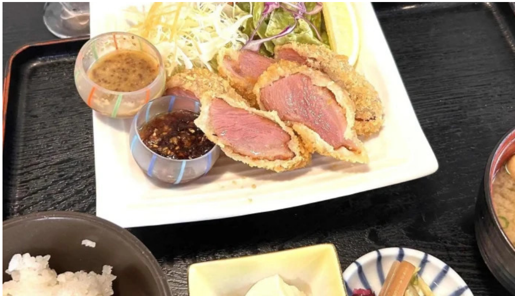
旬菜 やま城 営業中