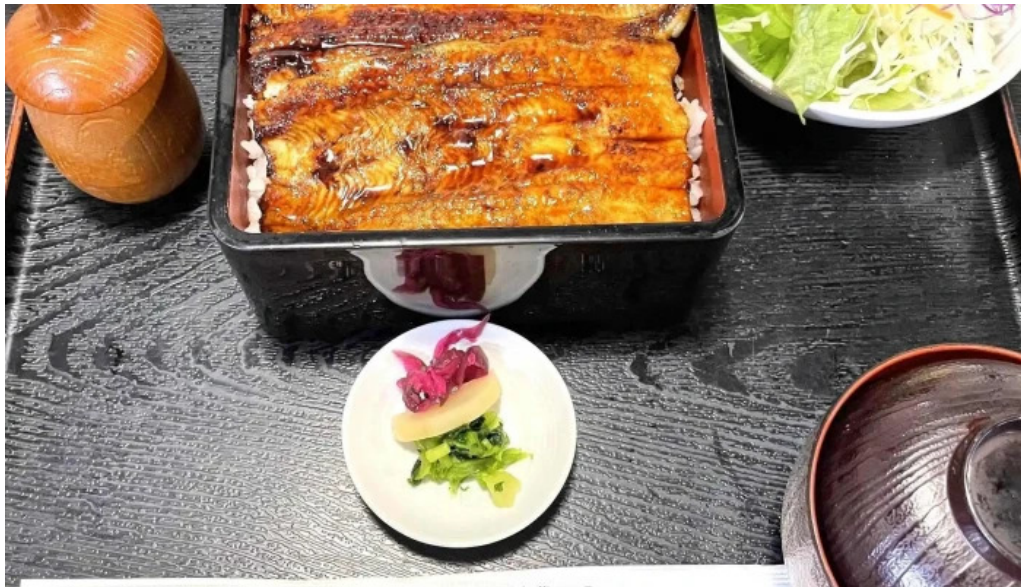
旬菜 やま城 instagram