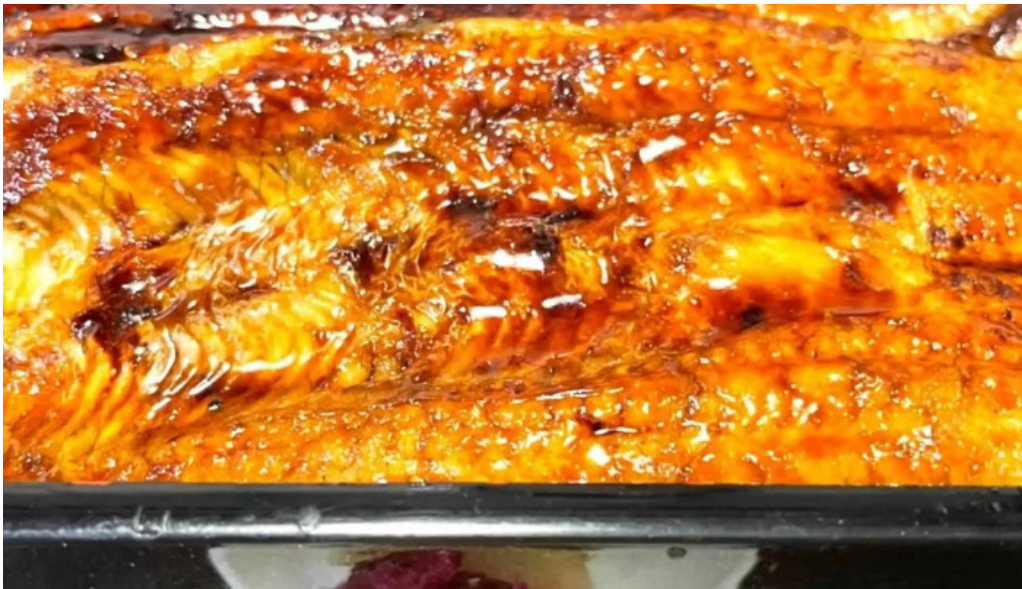
旬菜 やま城 行き方