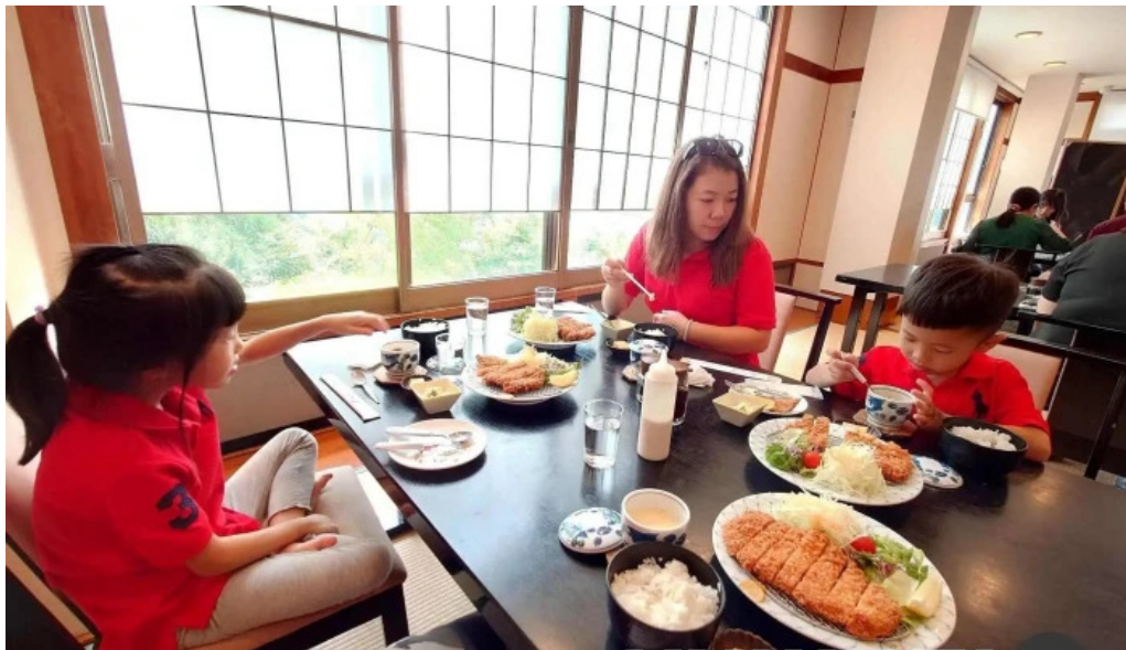
旬菜 やま城 雰囲気