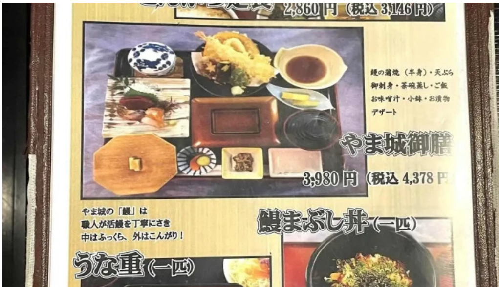
旬菜 やま城 メニュー