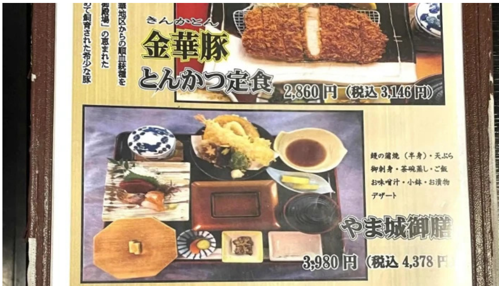
旬菜 やま城 動画