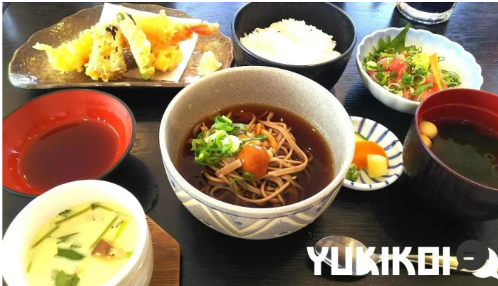
旬菜 やま城 スープ