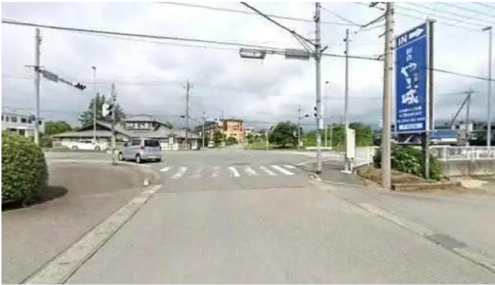
旬菜 やま城 御殿場市