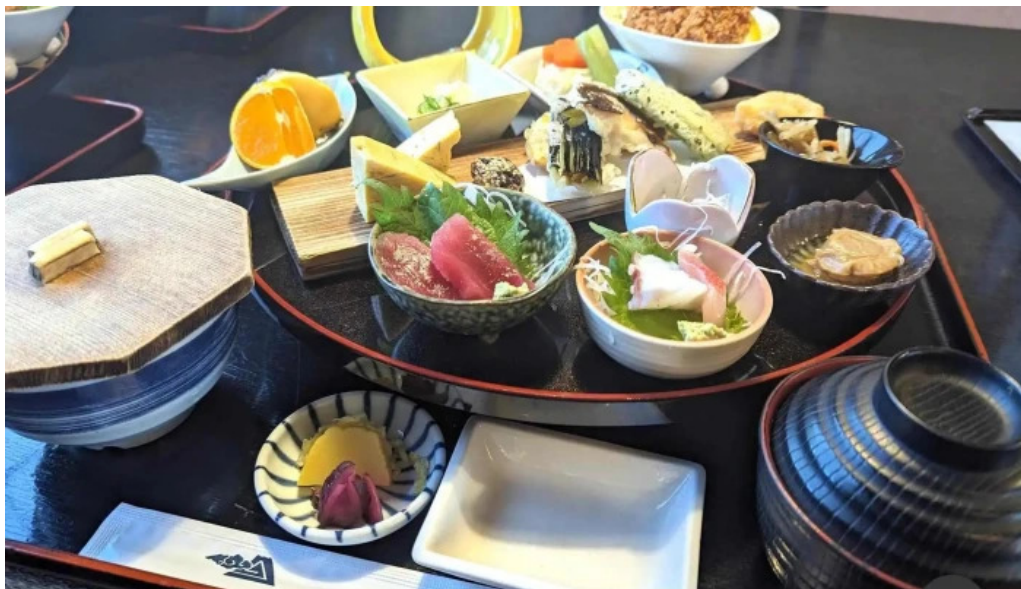
旬菜 やま城 懐石