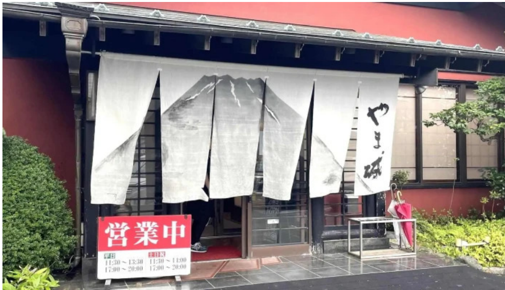
旬菜 やま城 写真