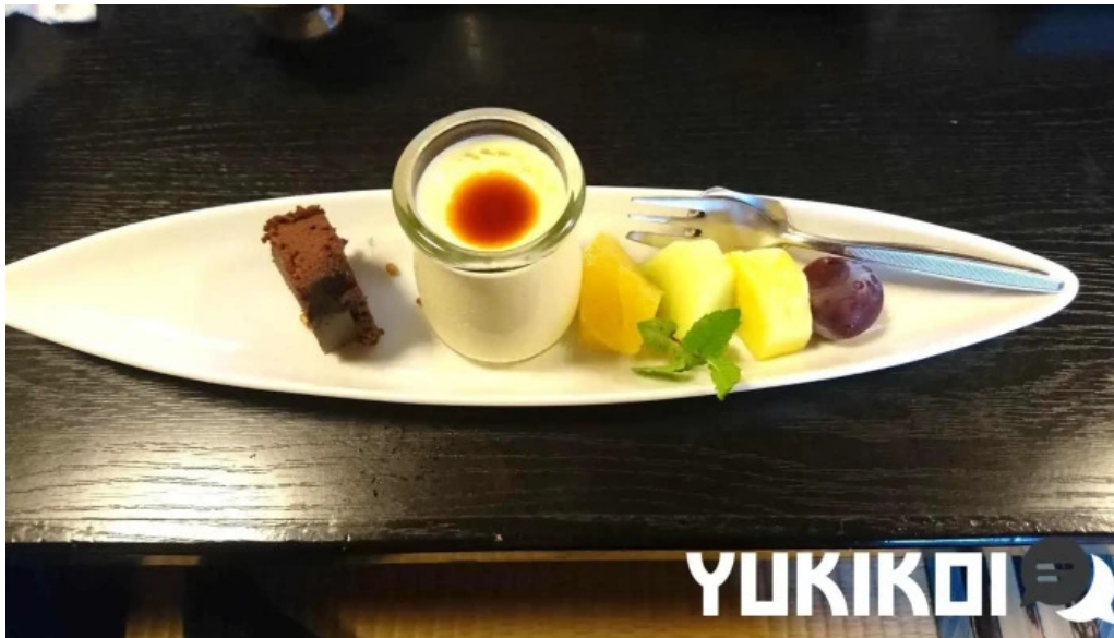
旬菜 やま城 料理飲み物