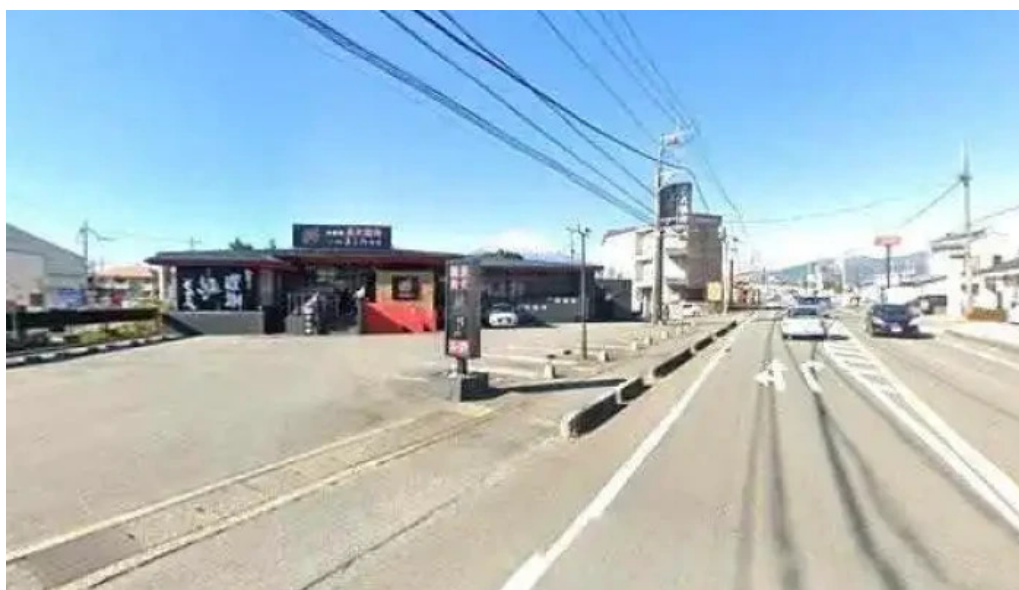
Gotenba 味膳 ajizen 最新