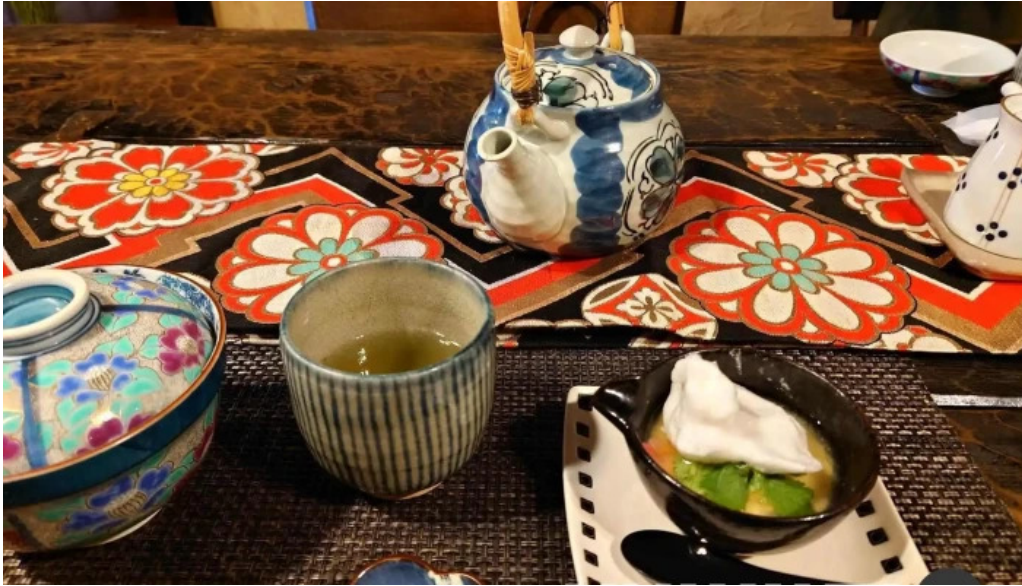
Gotenba 味膳 ajizen 料理飲み物