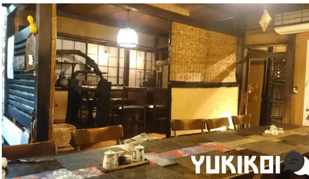
Gotenba 味膳 ajizen 雰囲気