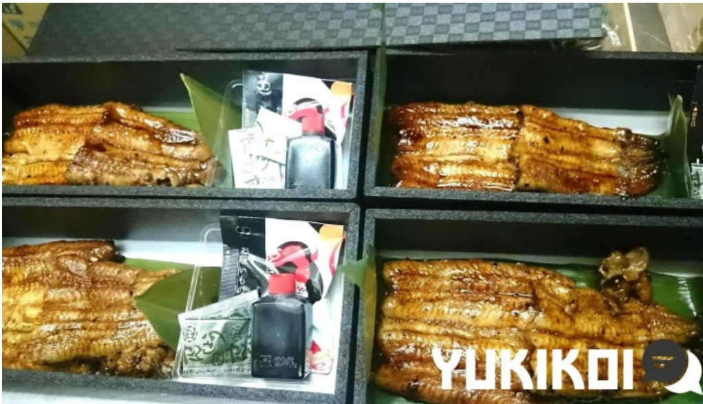
Gotenba 味膳 ajizen シーフード