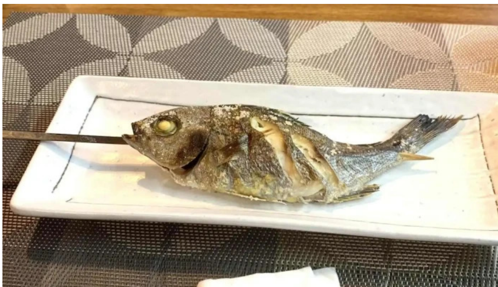
Gotenba 味膳 ajizen サバ