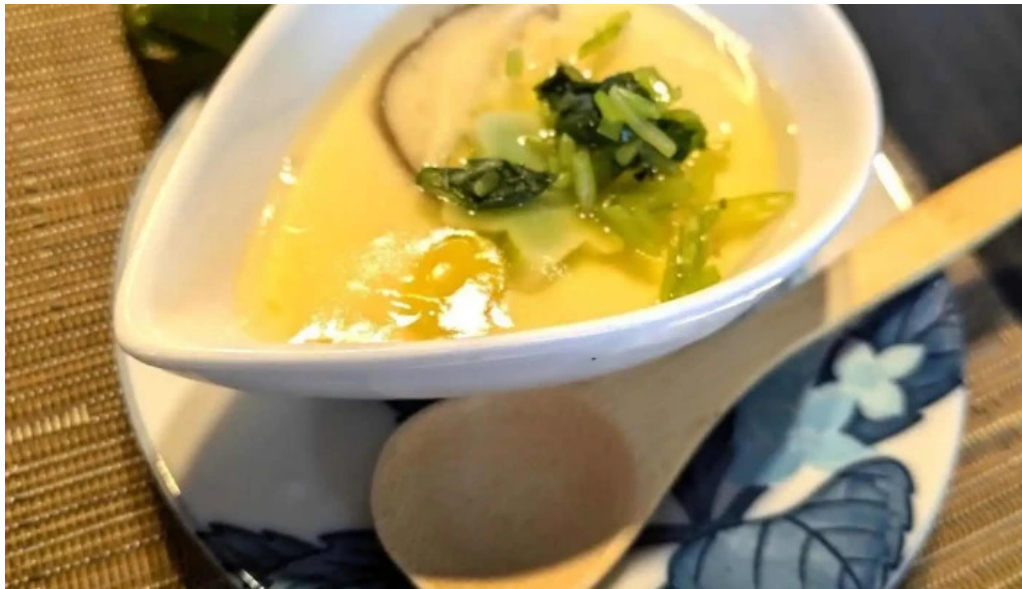
Gotenba 味噌 ajizen 味噌汁