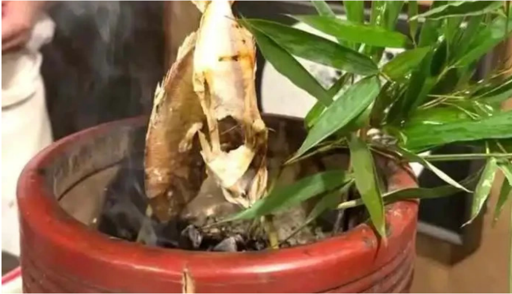
Gotenba 味膳 ajizen 動画