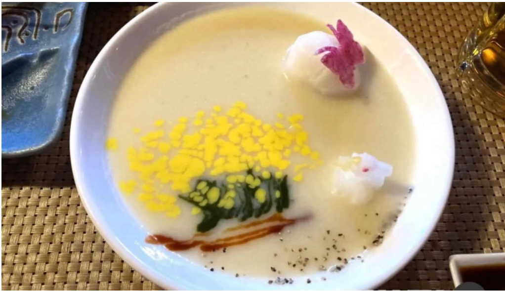
Gotenba 味膳 ajizen スープ