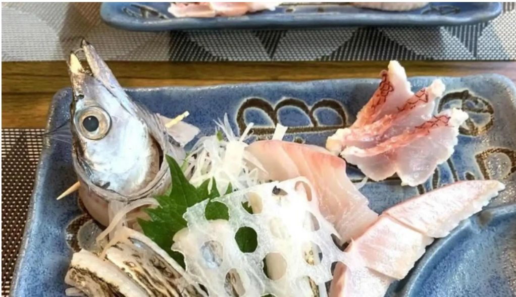
Gotenba 味膳 ajizen 刺身