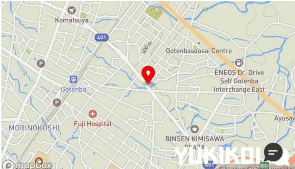
Gotenba 味噌 ajizen 地図