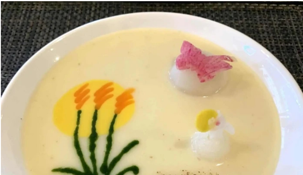
Gotenba 味膳 ajizen 御殿場市