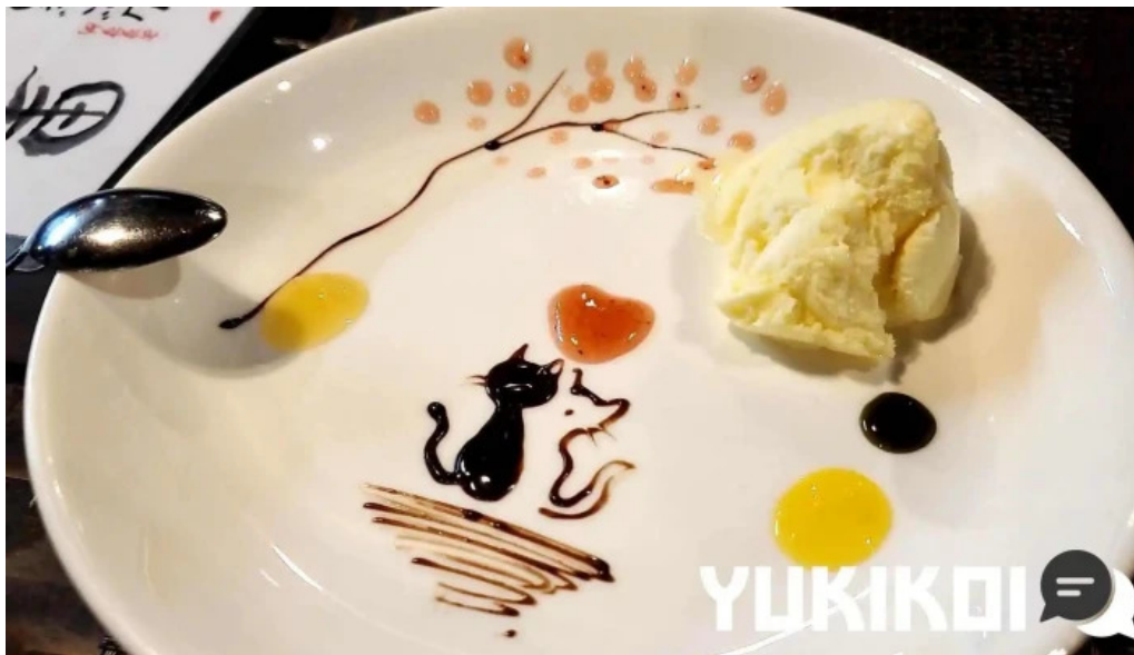
Gotenba 味膳 ajizen パンナコッタ