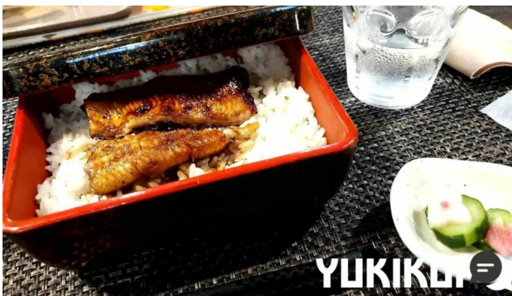
Gotenba 味膳 ajizen ウナギ