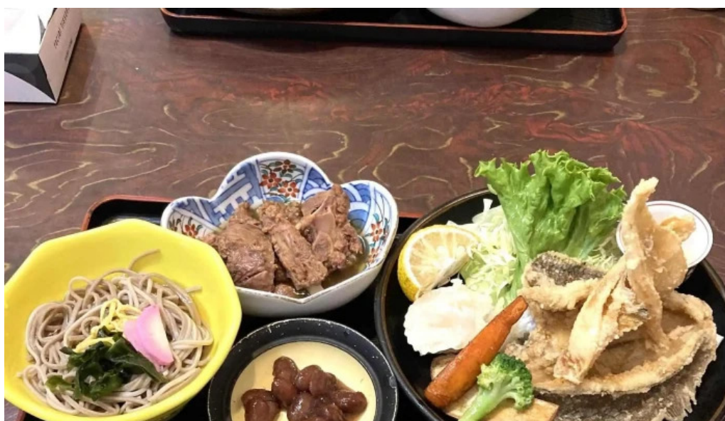
絹川 ウェブサイト