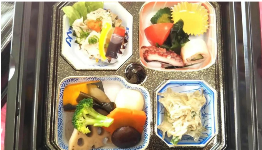
本家ささき カタログ