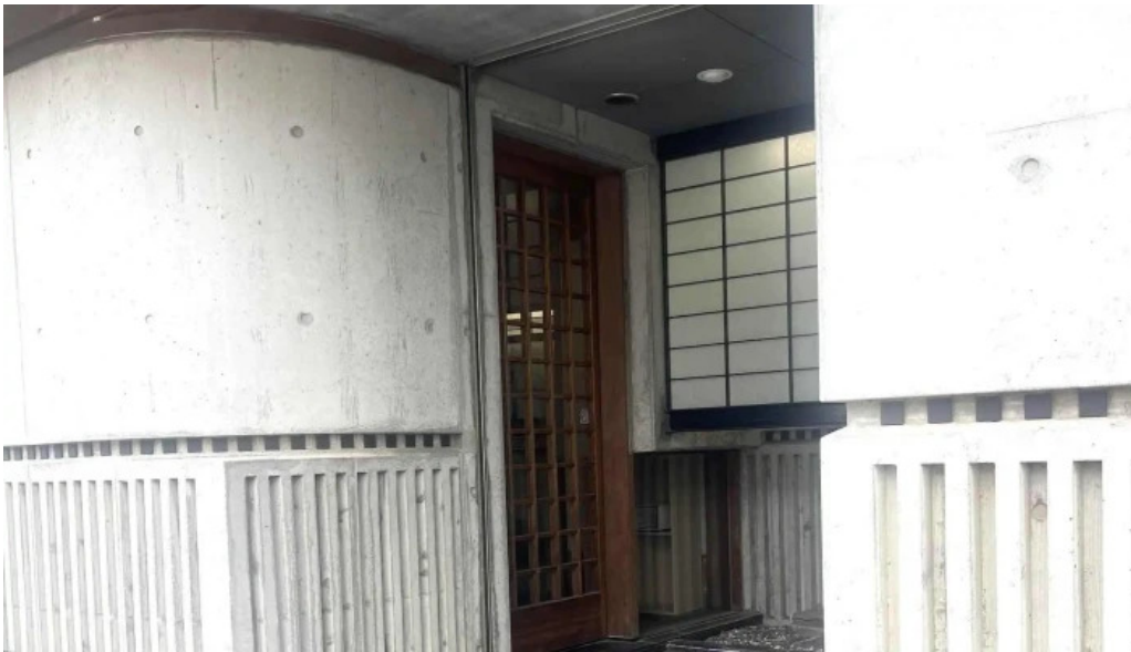
本家ささき スコア