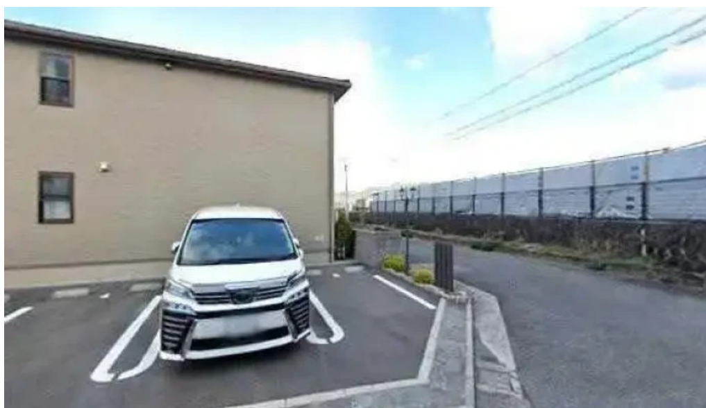
本家ささき 延岡市