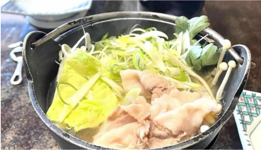
本家ささき スープ