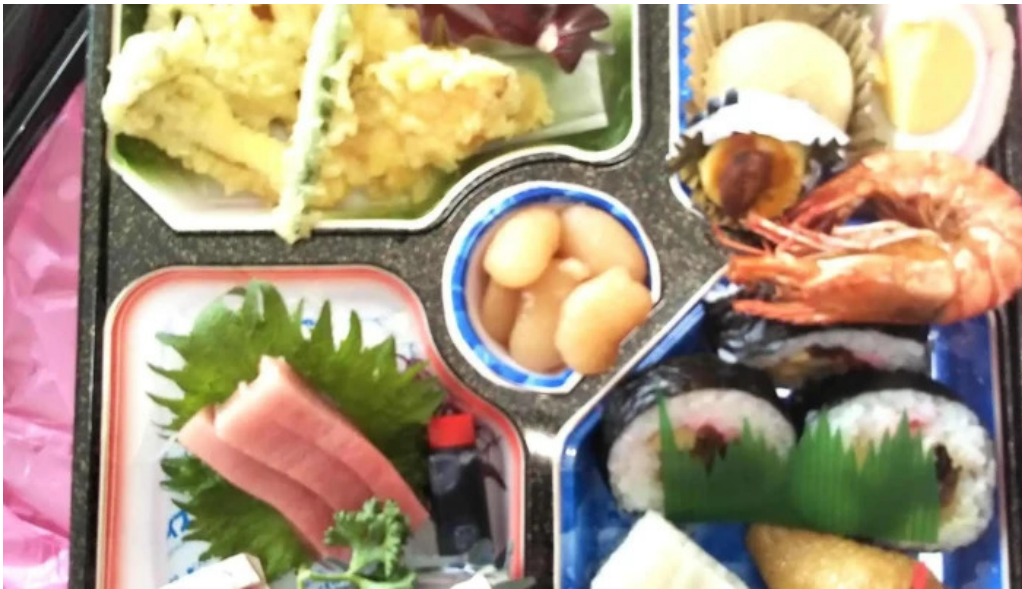
本家ささき 営業中