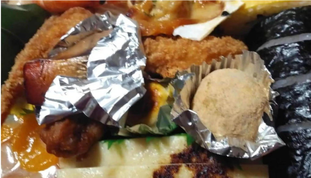
本家ささき エリア