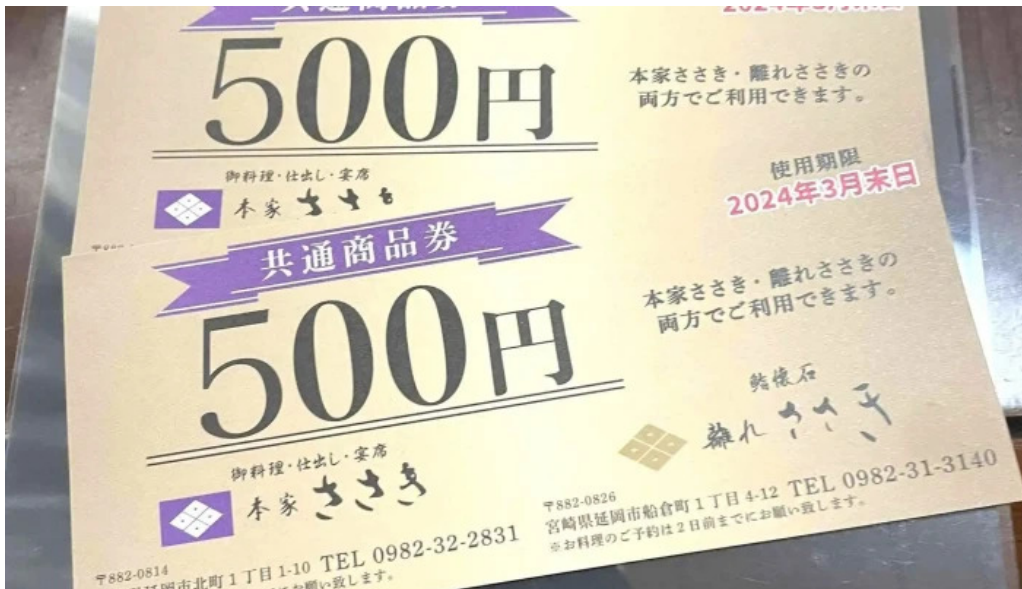
本家ささき メニュー