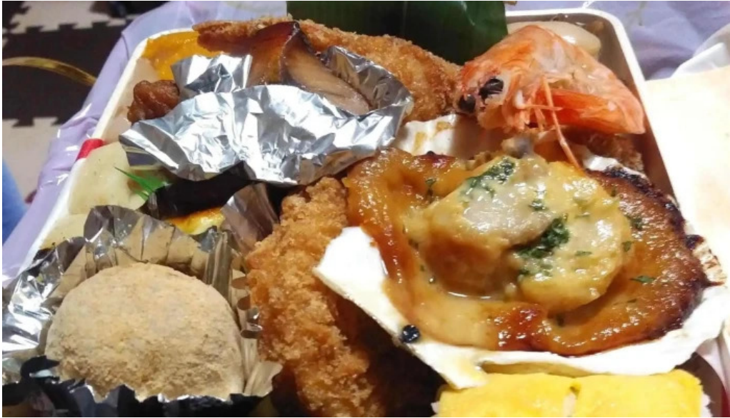
本家ささき 営業時間