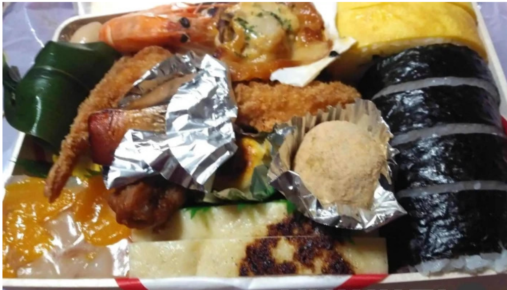
本家ささき シーフード