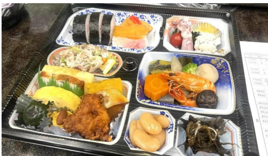
本家ささき 料理飲み物