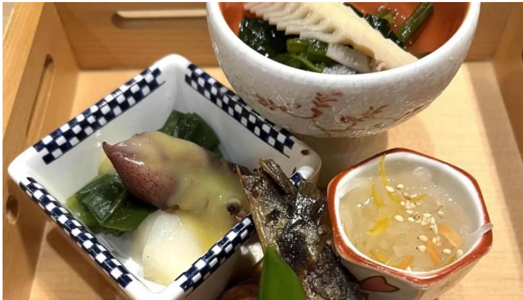
和食 友善 割引