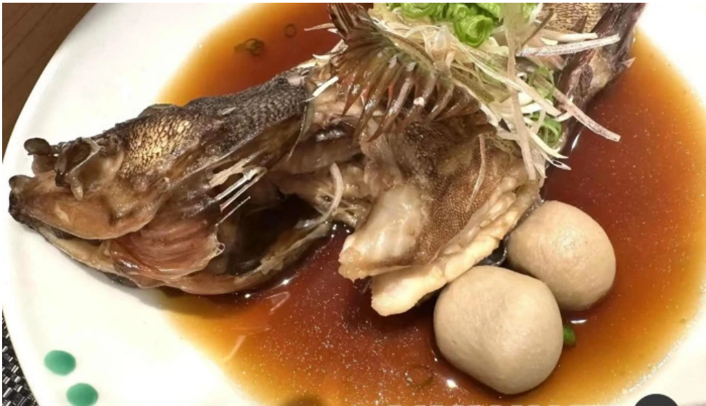
和食 友善 シーフード