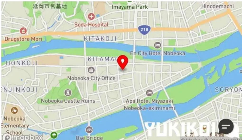
和食 友善 地図