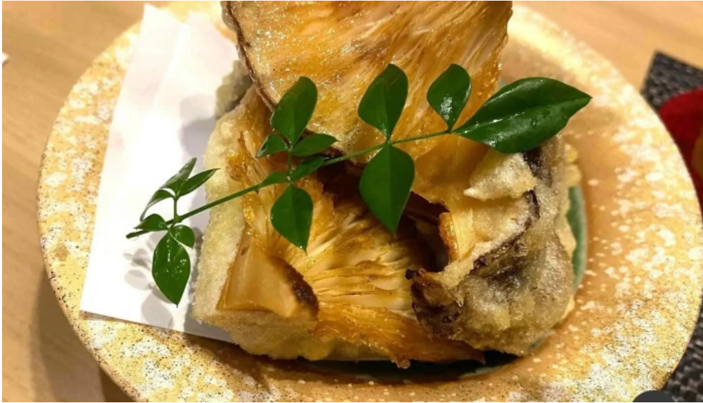
和食 友善 サバ