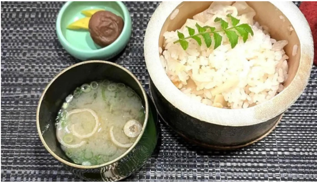
和食 友善 スープ