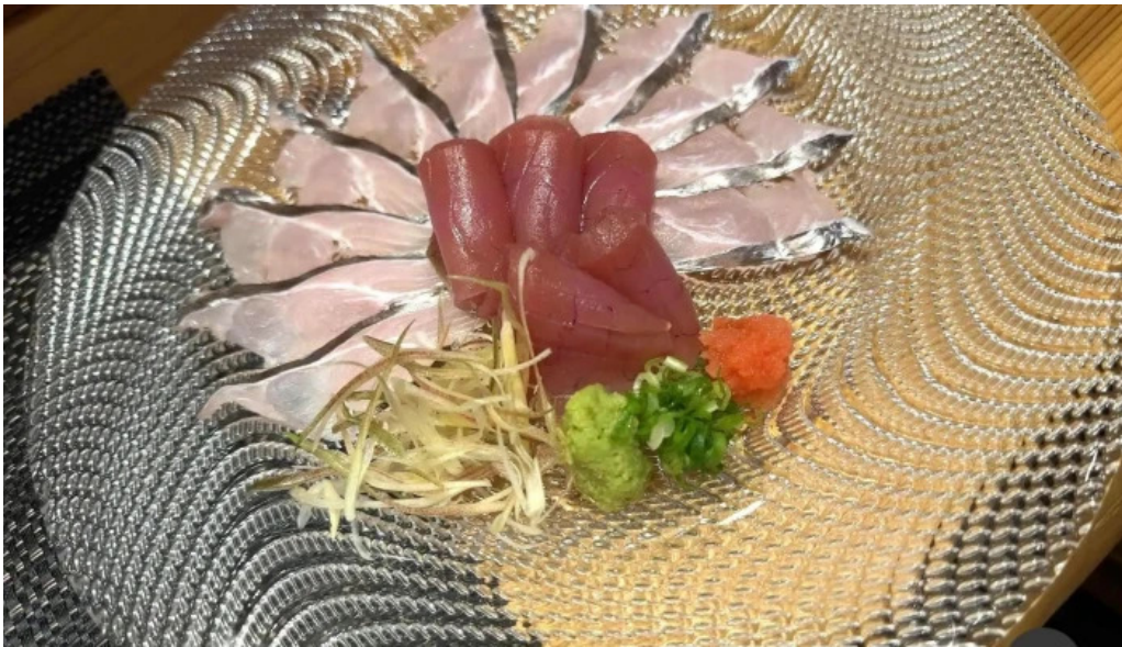
和食 友善