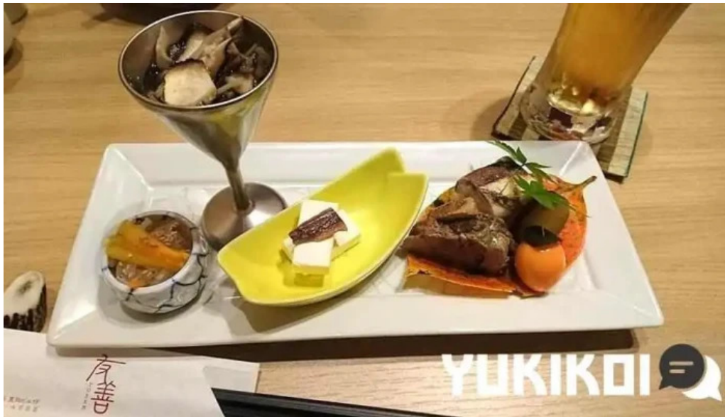
和食 友善 懐石