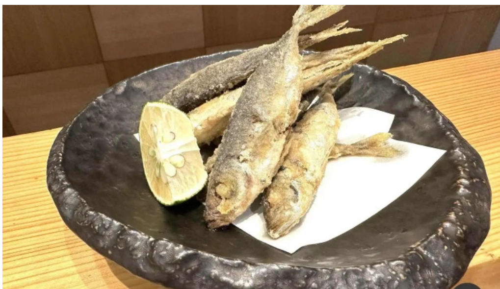
和食 友善 料理飲み物