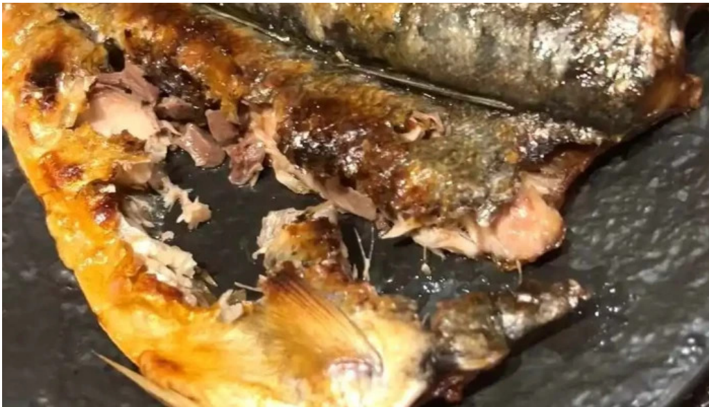
和食 友善 動画