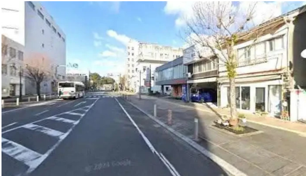
和食 友善 延岡市