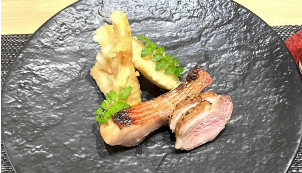
和食 友善 口コミ