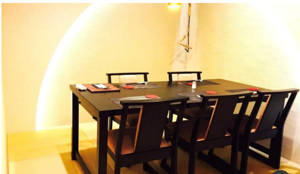
和食 友善 雰囲気