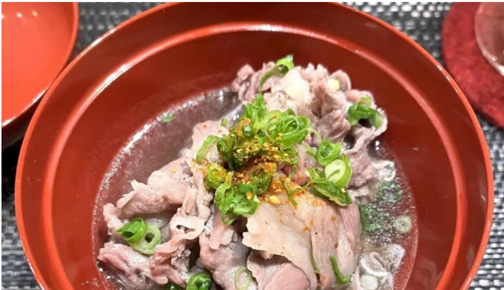
和食 友善 instagram