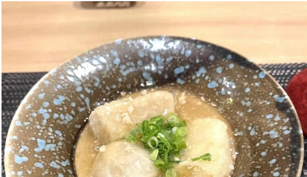
和食 友善 営業中