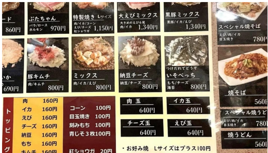
満月のお好み焼 カタログ