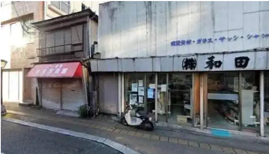
満月のお好み焼 奄美市