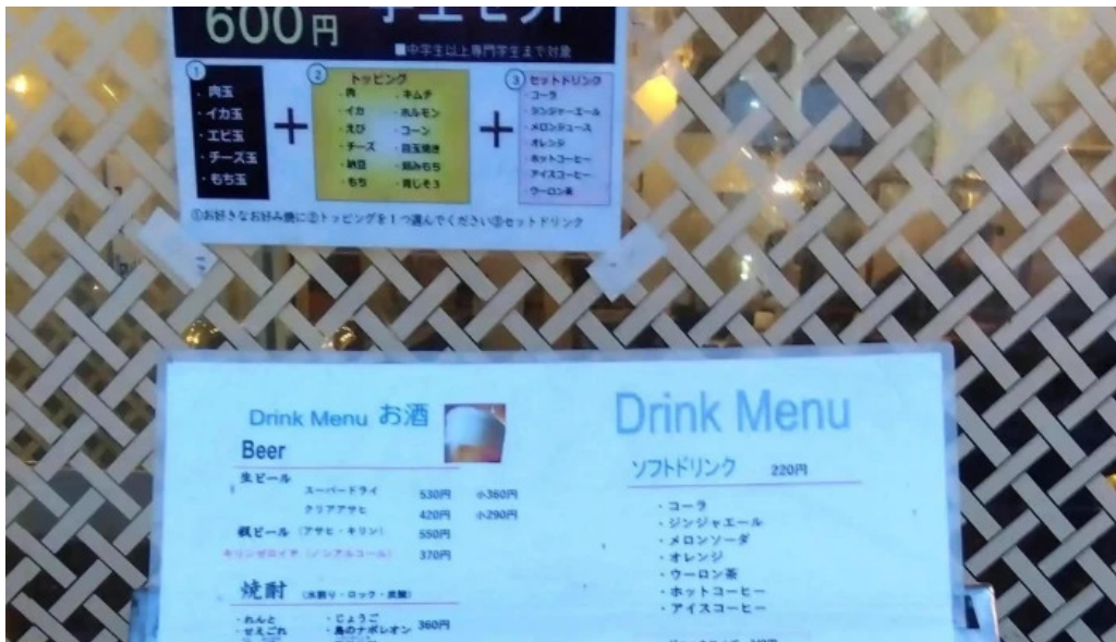
満月のお好み焼 営業時間