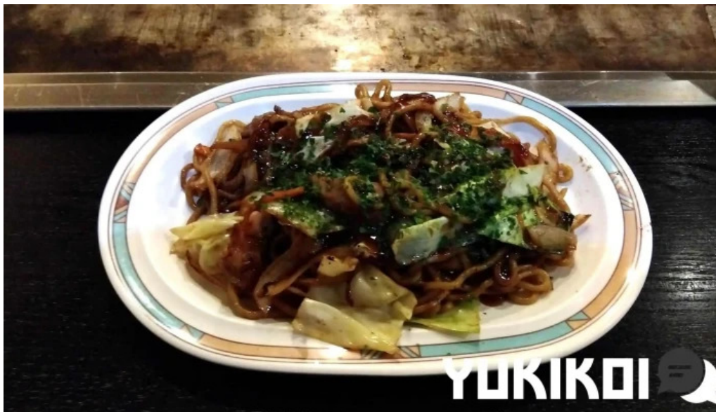
満月のお好み焼 焼きそば