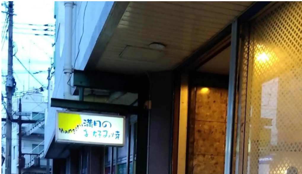
満月のお好み焼 スコア