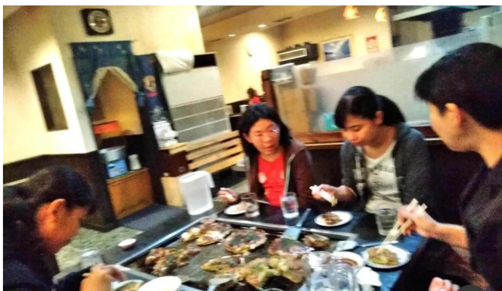
満月のお好み焼 雰囲気