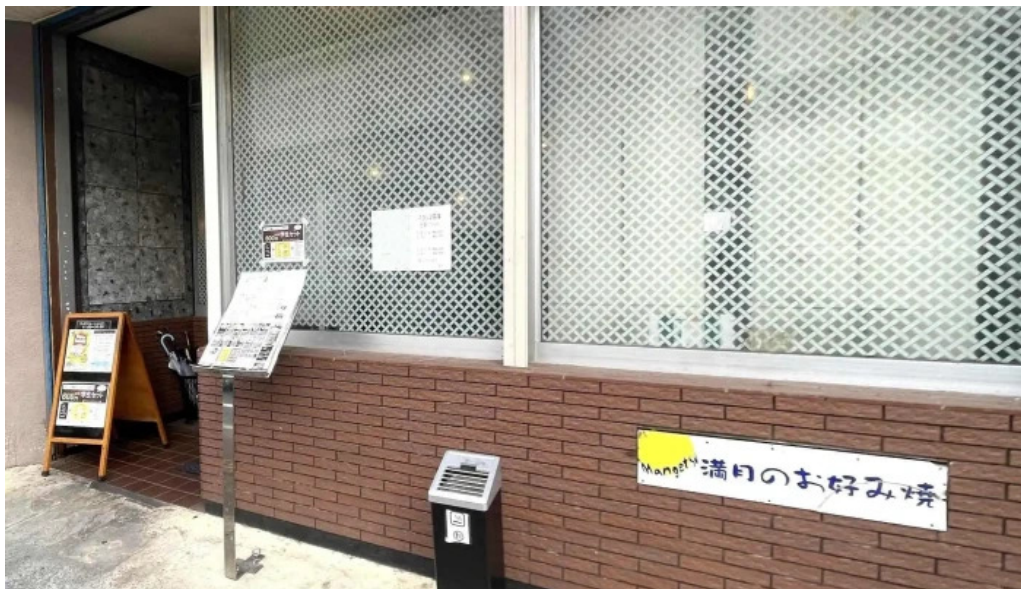
満月のお好み焼 ウェブサイト