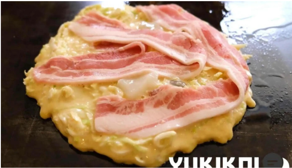
満月のお好み焼 料理飲み物