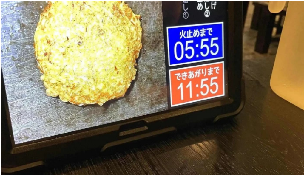
満月のお好み焼 プロモーション