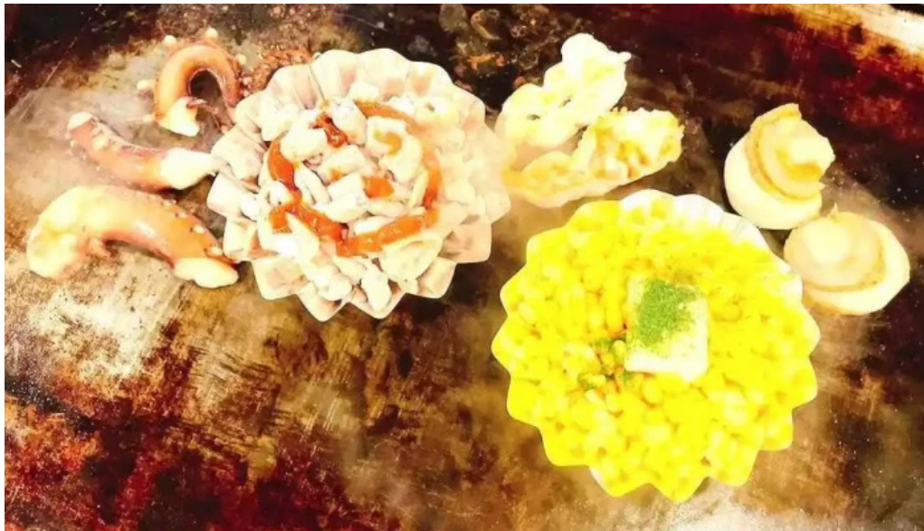
満月のお好み焼 動画