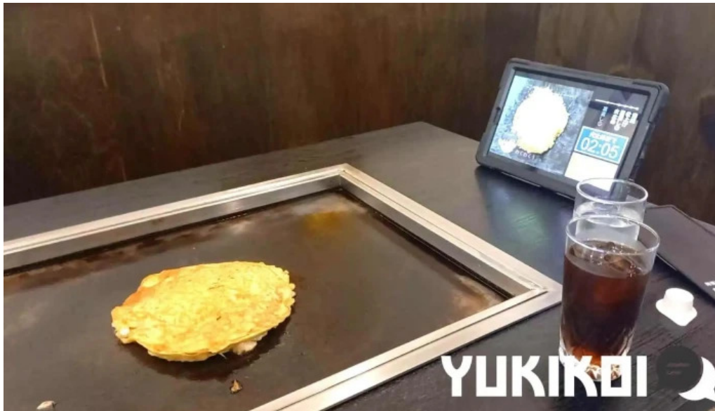
満月のお好み焼 お好み焼き