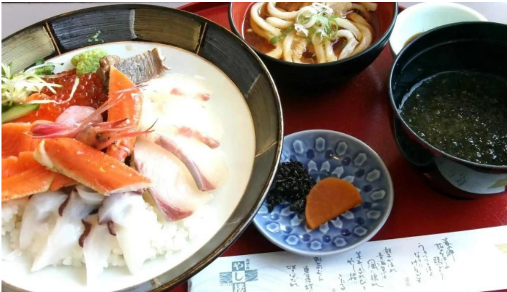
潮騒の館 やし楼 comentario 5