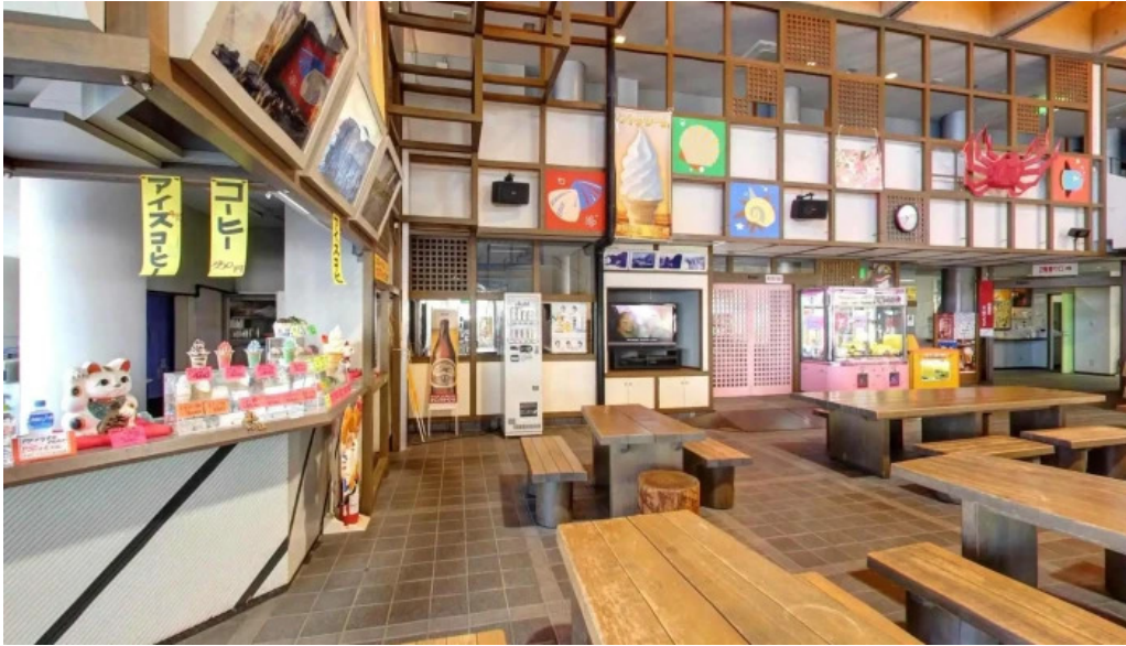
潮騒の館 やし楼 ストリートビューと 360 ビュー