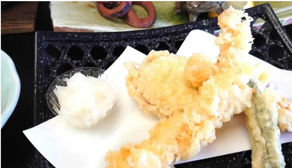
潮騒の館 やし楼 comentario 3