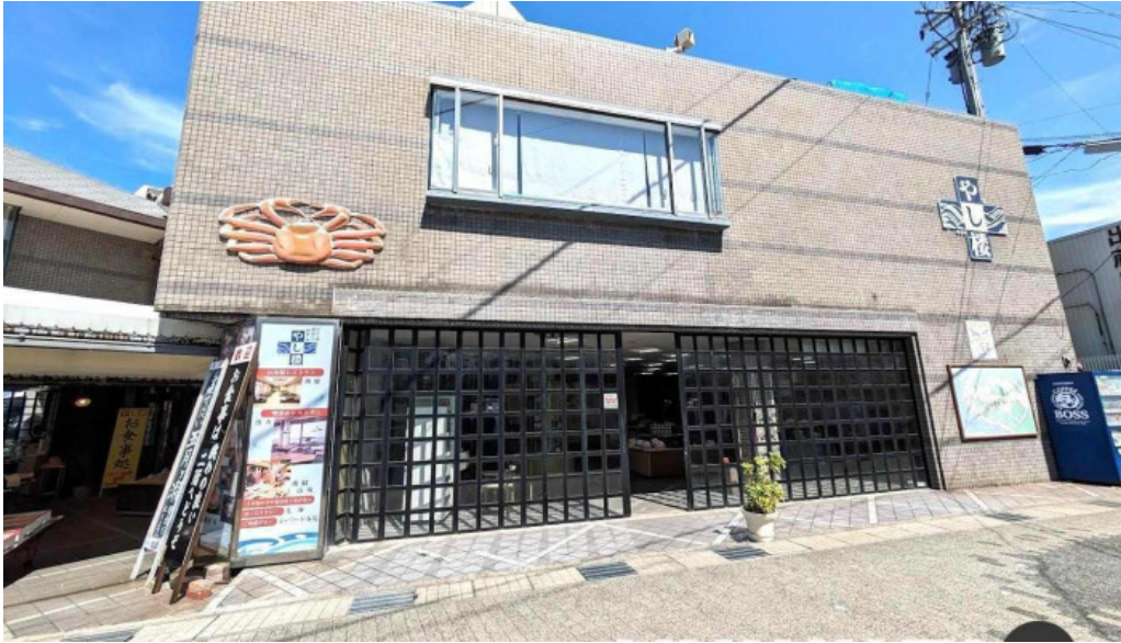
潮騒の館 やし楼 坂井市