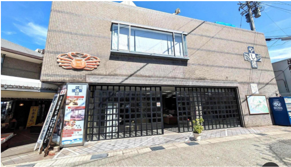
潮騒の館 やし楼 すべて