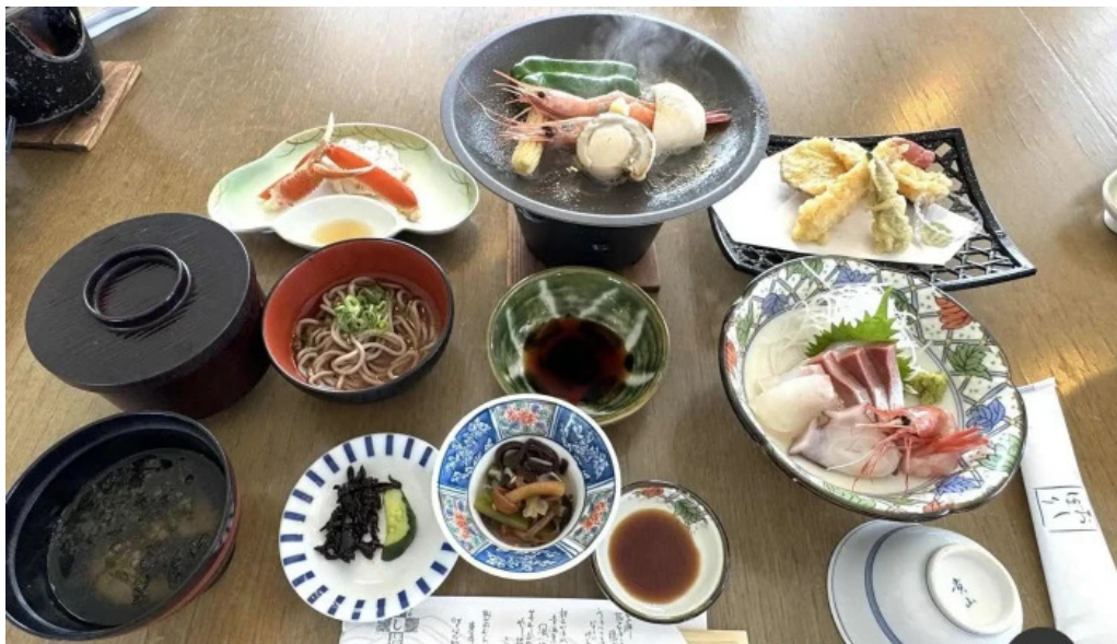
潮騒の館 やし楼 懐石