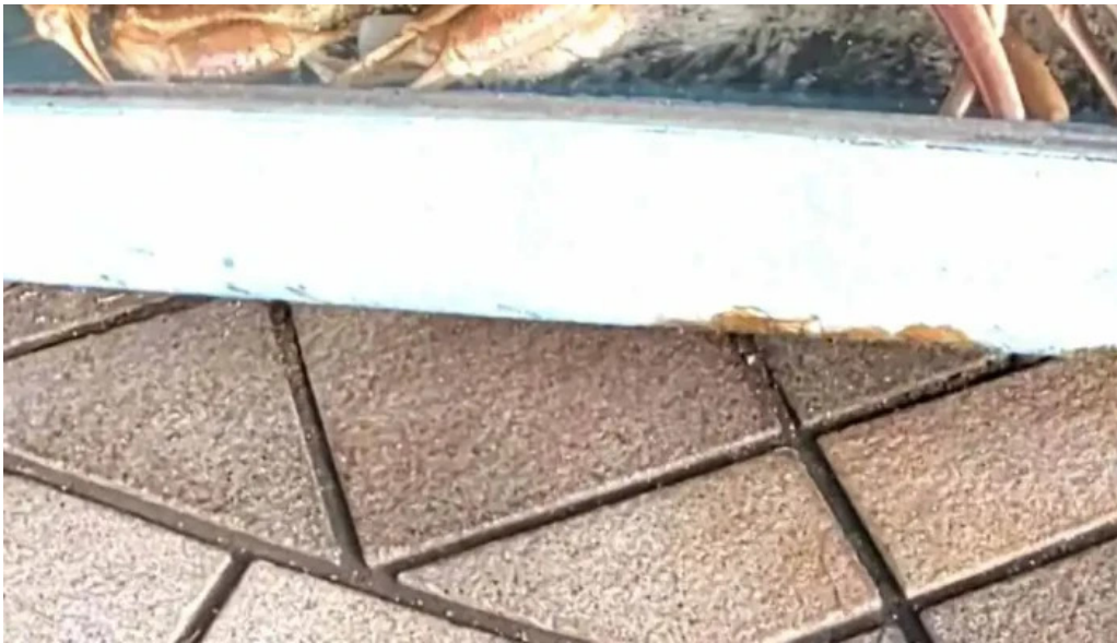
潮騒の館 やし楼 動画