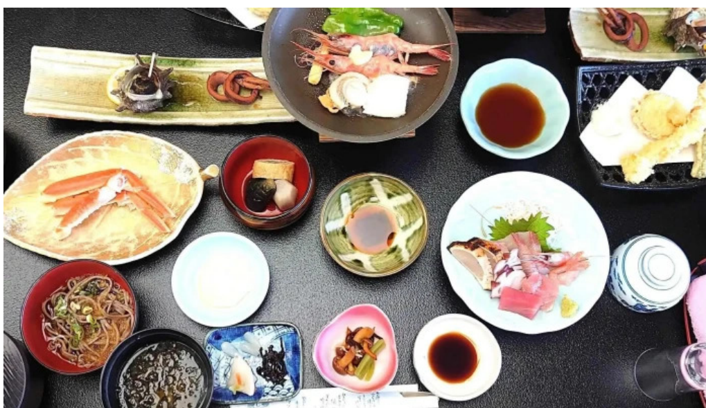
潮騒の館 やし楼 comentario 1