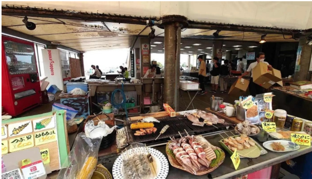
潮騒の館 やし楼 料理飲み物