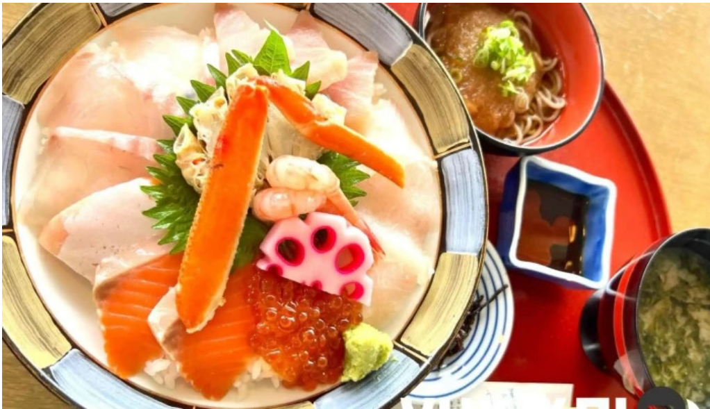
潮騒の館 やし楼 ちらし寿司