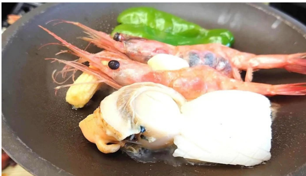
潮騒の館 やし楼 comentario 2