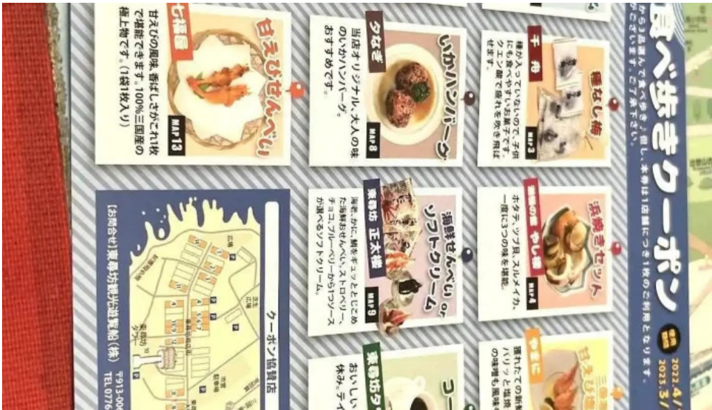
潮騒の館 やし楼 メニュー