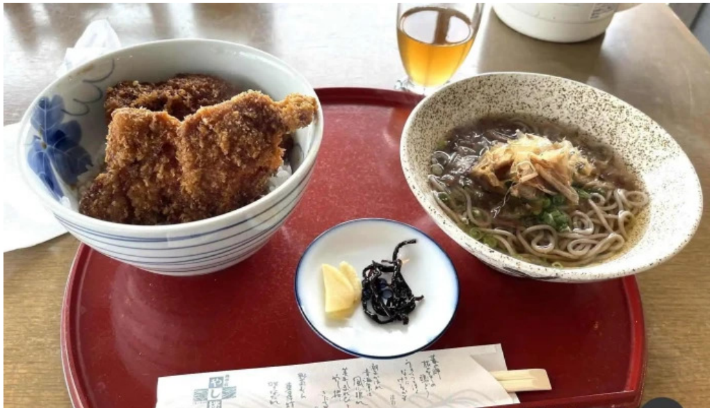
潮騒の館 やし楼 蕎麦