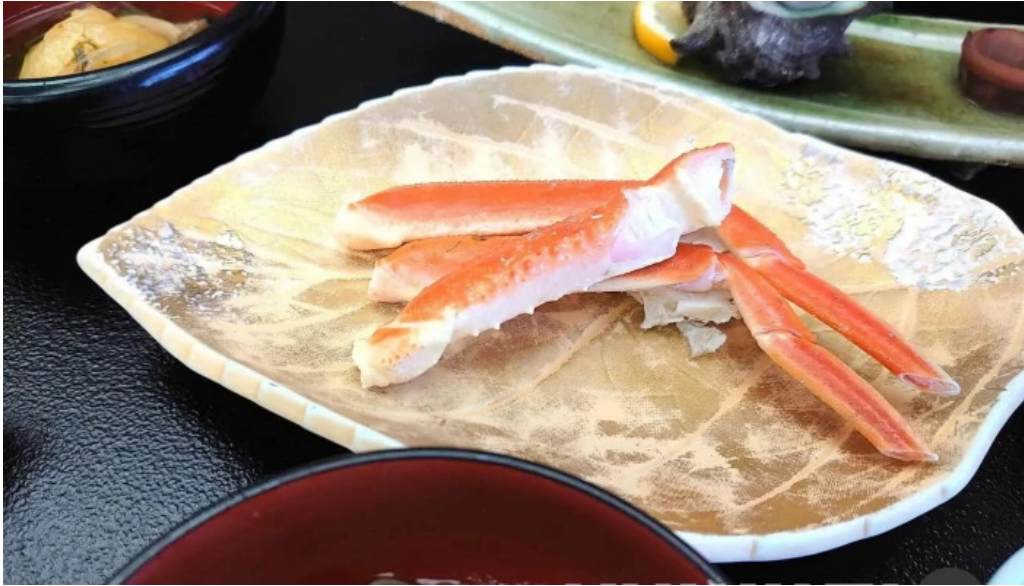
潮騒の館 やし楼 刺身