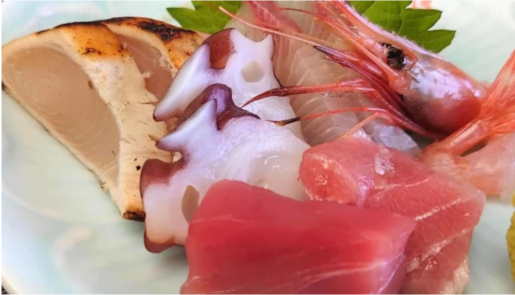
潮騒の館 やし楼 comentario 4