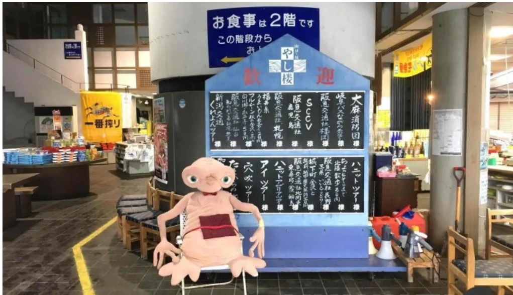
潮騒の館 やし楼 雰囲気