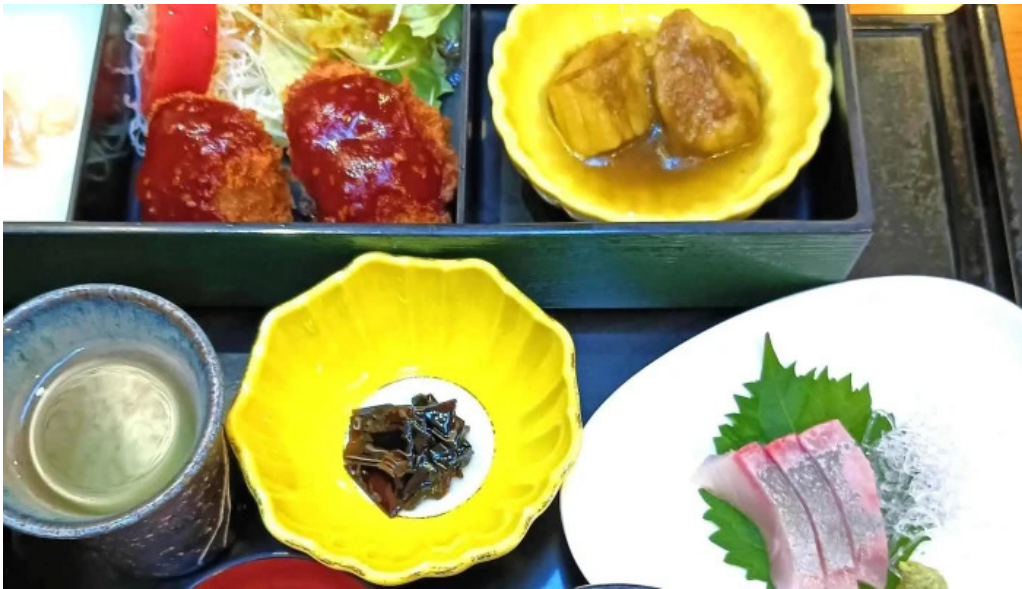
けやき道の駅 さかい comentario 2