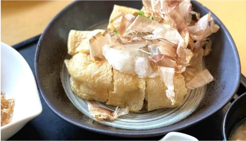
けやき道の駅 さかい comentario 7