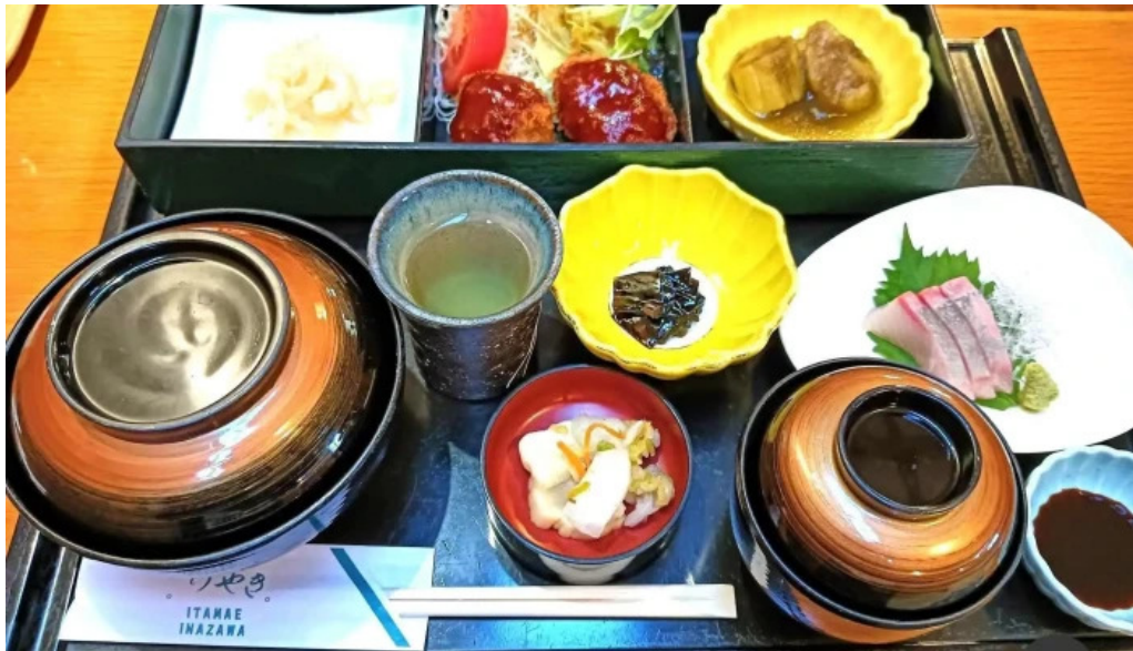
けやき道の駅 さかい 料理飲み物