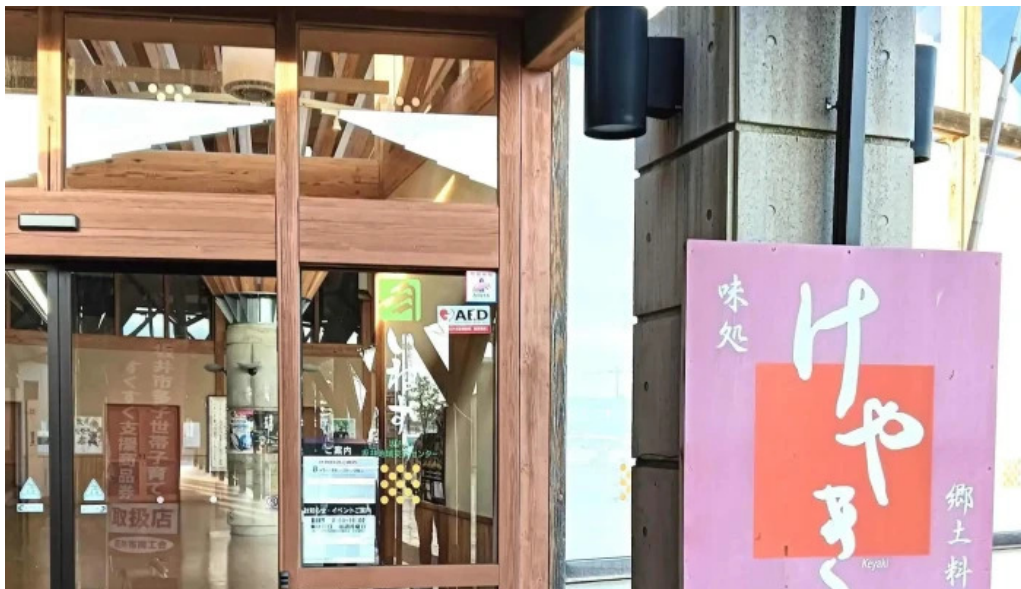
けやき道の駅 さかい comentario 4