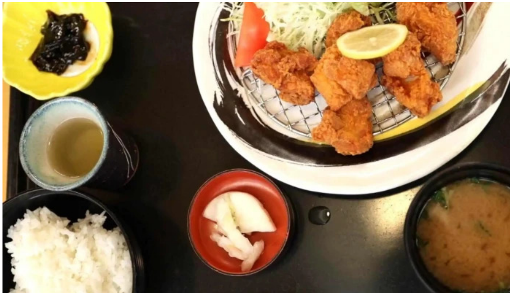
けやき道の駅 さかい comentario 9