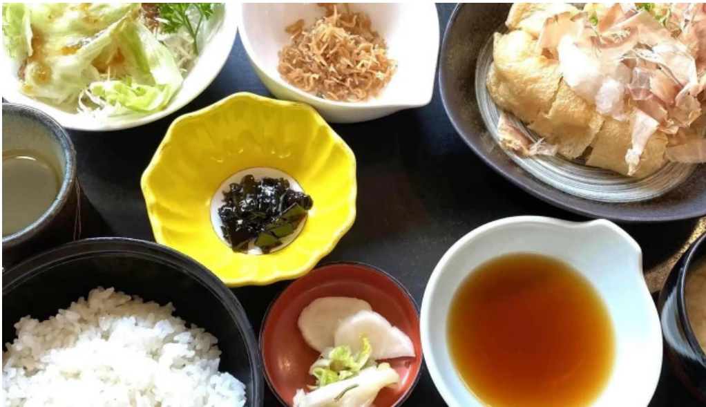
けやき道の駅 さかい comentario 6