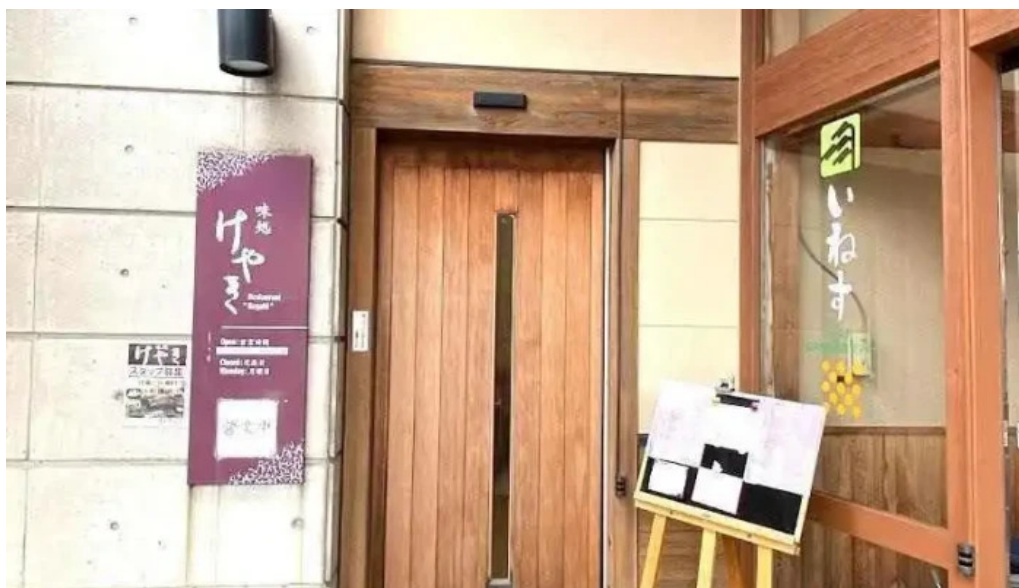
けやき（道の駅 さかい） 坂井市