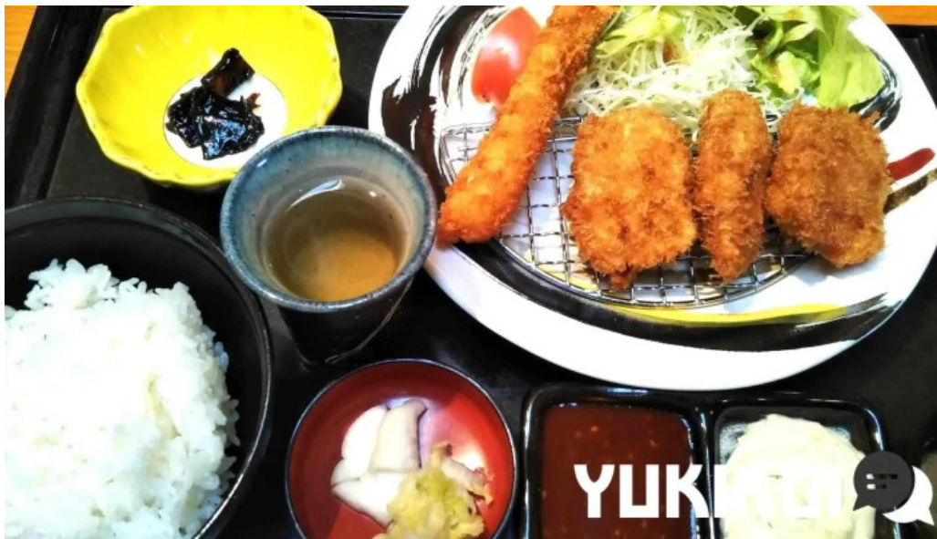
けやき道の駅 さかい 豚カツ