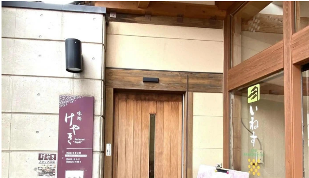
けやき道の駅 さかい comentario 5