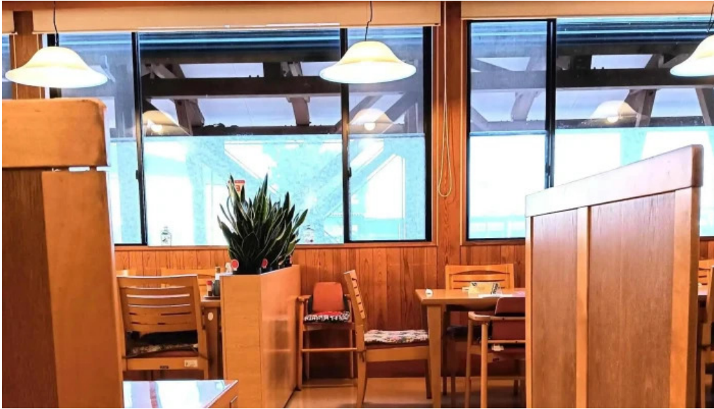
けやき道の駅 さかい comentario 3