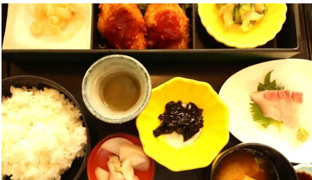
けやき道の駅 さかい comentario 10