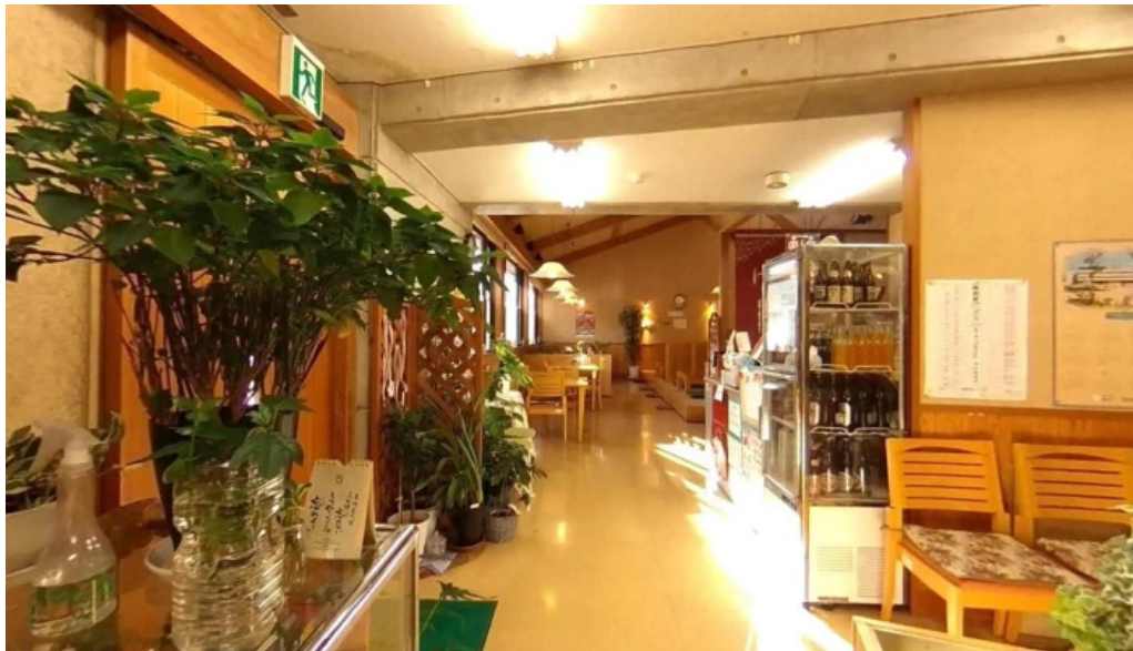
けやき道の駅 さかい ストリートビューと 360 ビュー