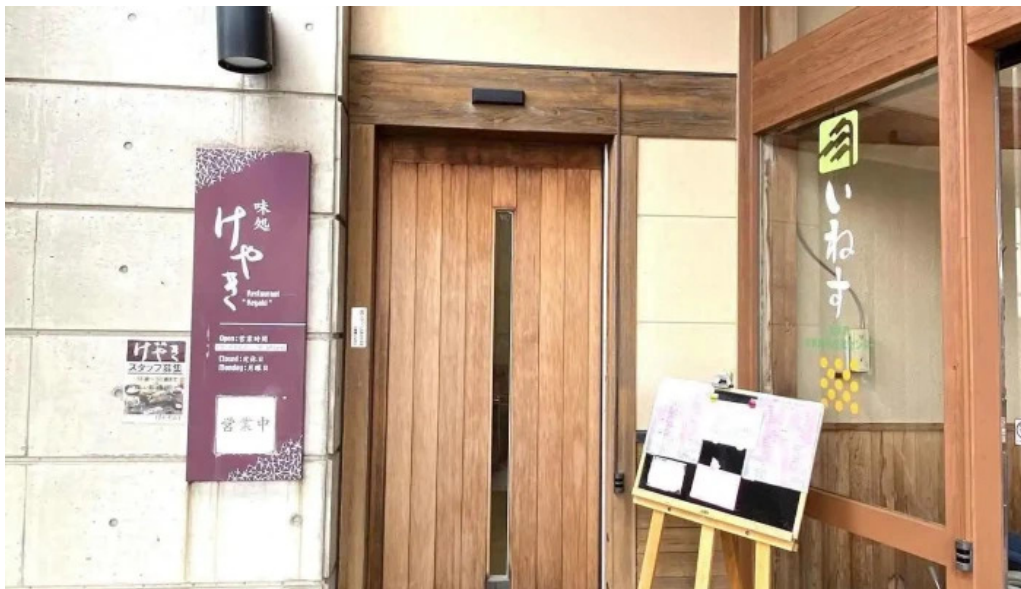
けやき道の駅 さかい すべて