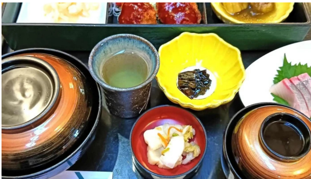
けやき道の駅 さかい comentario 1