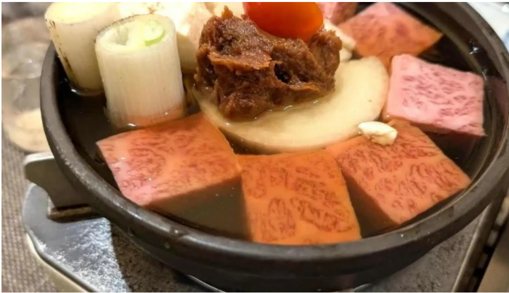
目黒の和食さとう すき焼き