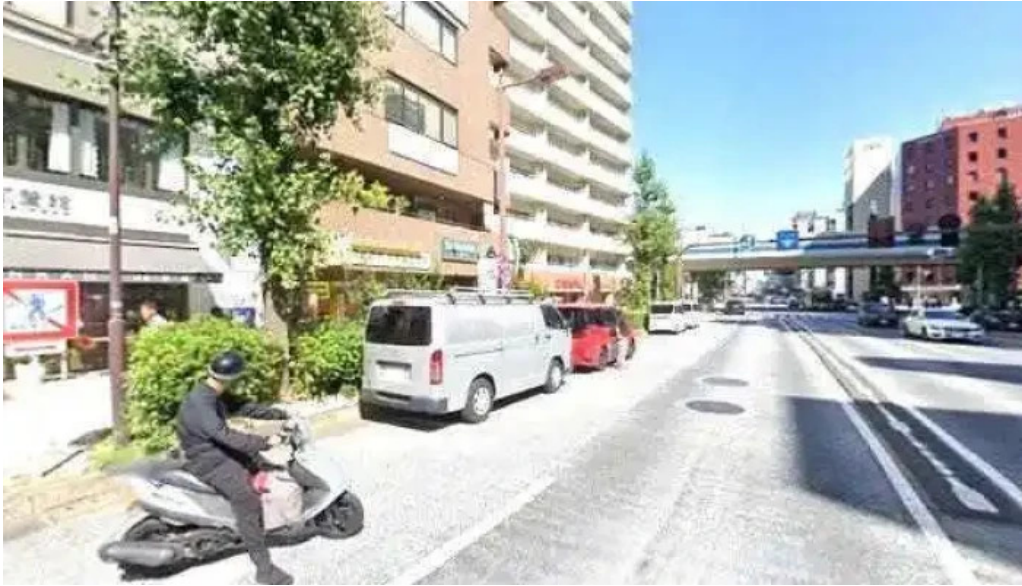
目黒の和食さとう 品川区