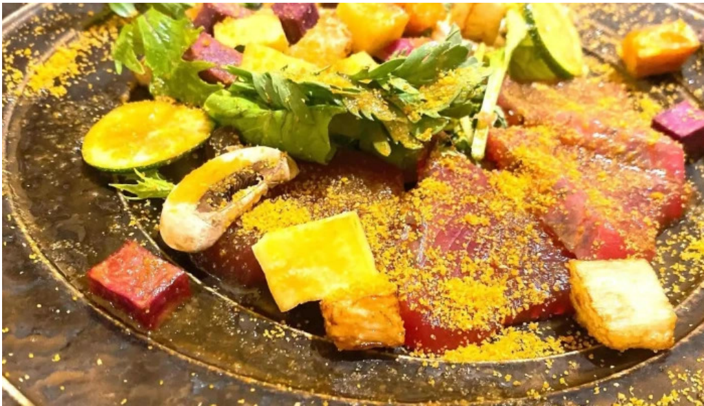
目黒の和食さとう 住所