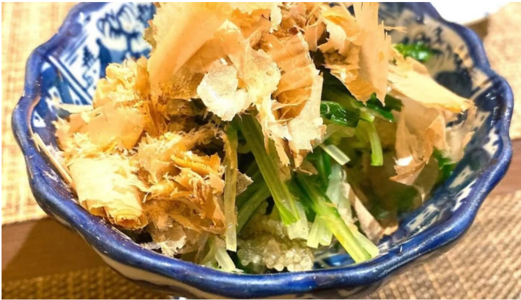
目黒の和食さとう 写真