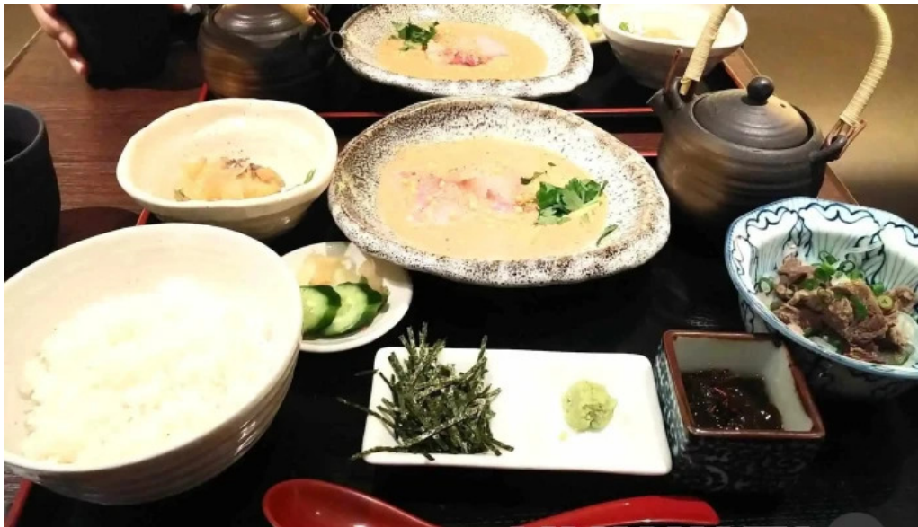
目黒の和食さとう 懐石