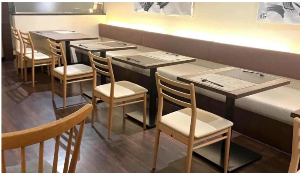
目黒の和食さとう 雰囲気