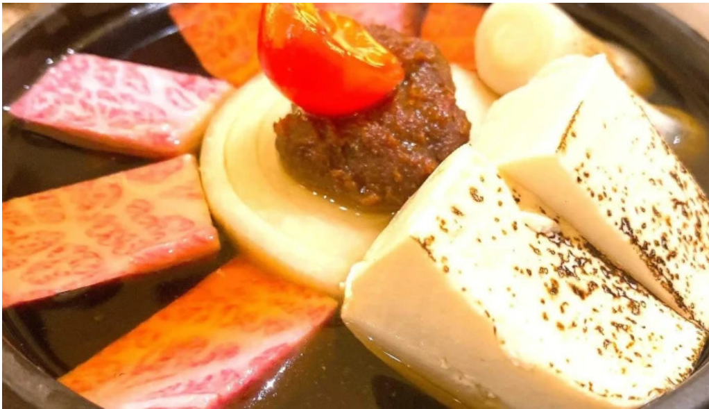
目黒の和食さとう instagram