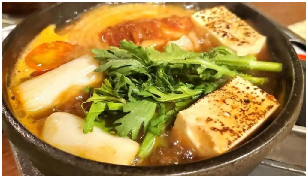
目黒の和食さとう スープ