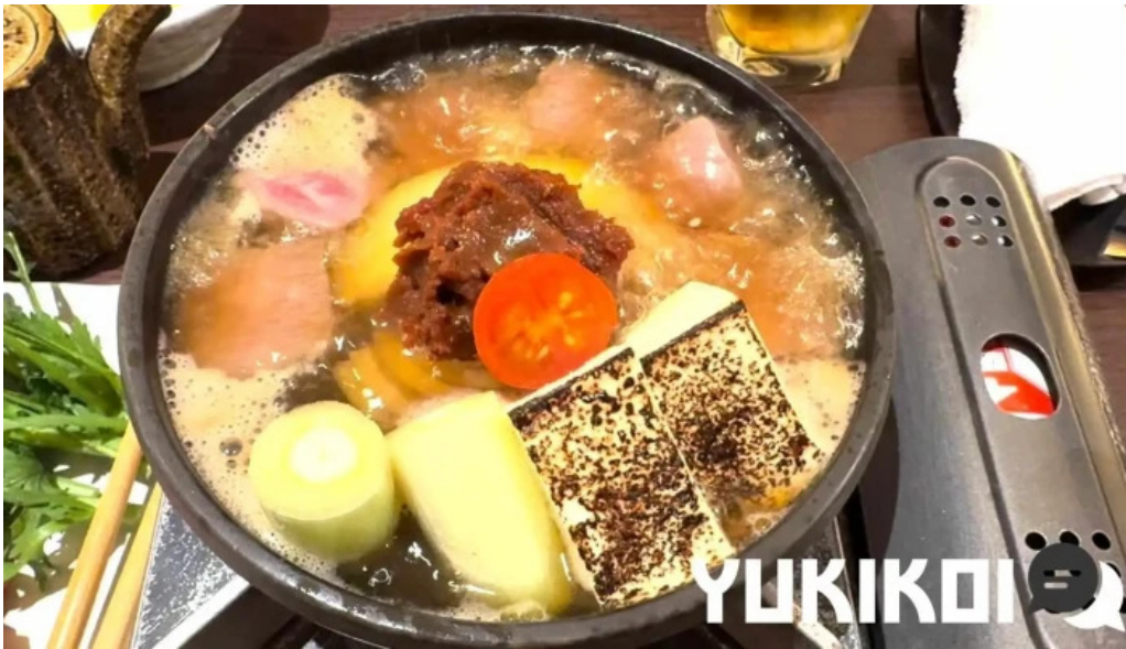
目黒の和食さとう 動画