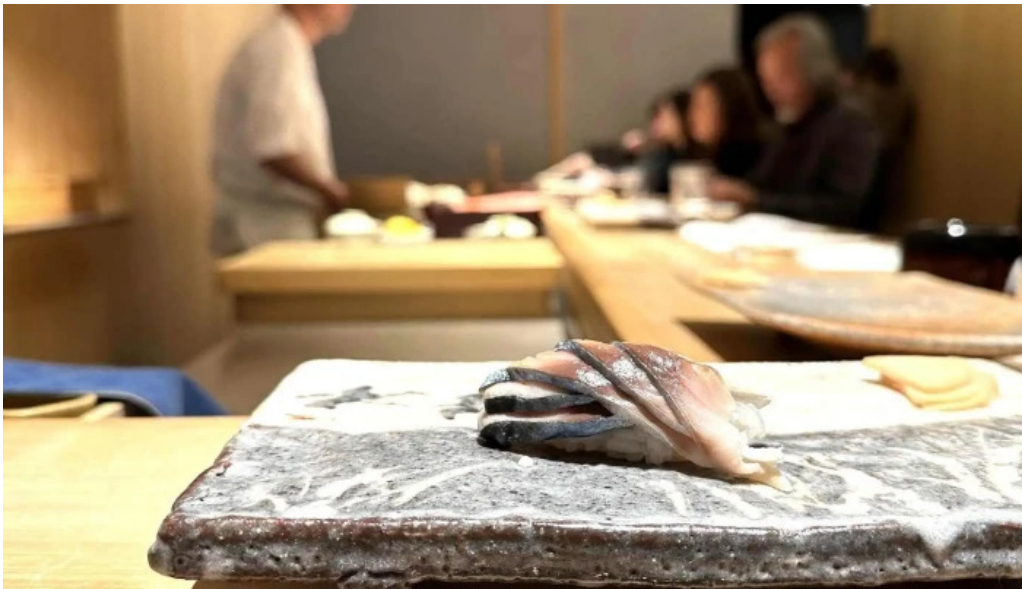
鯔みつ川ニセコ店 住所