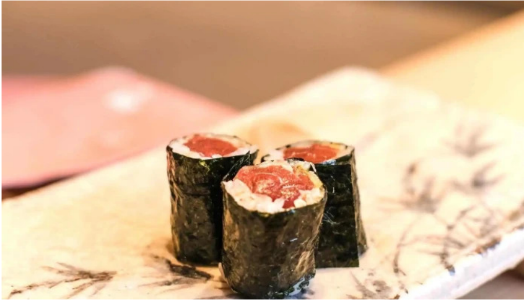
鮭みつ川ニセコ店 寿司