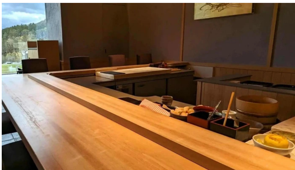
鮭みつ川ニセコ店 電話