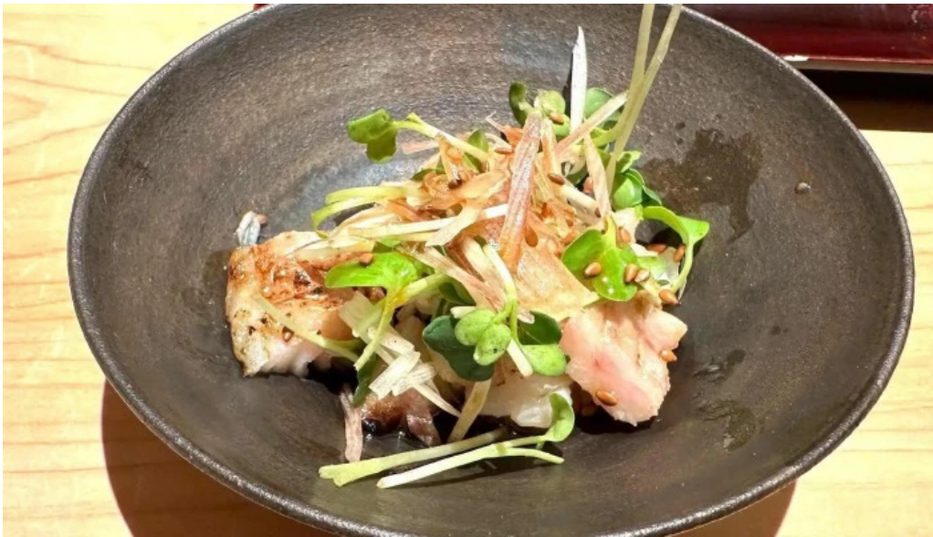
鮭みつ川ニセコ店 カタログ