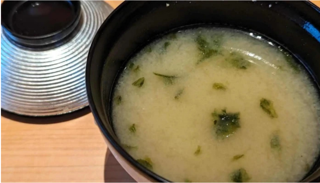
鯨みつ川ニセコ店 動画