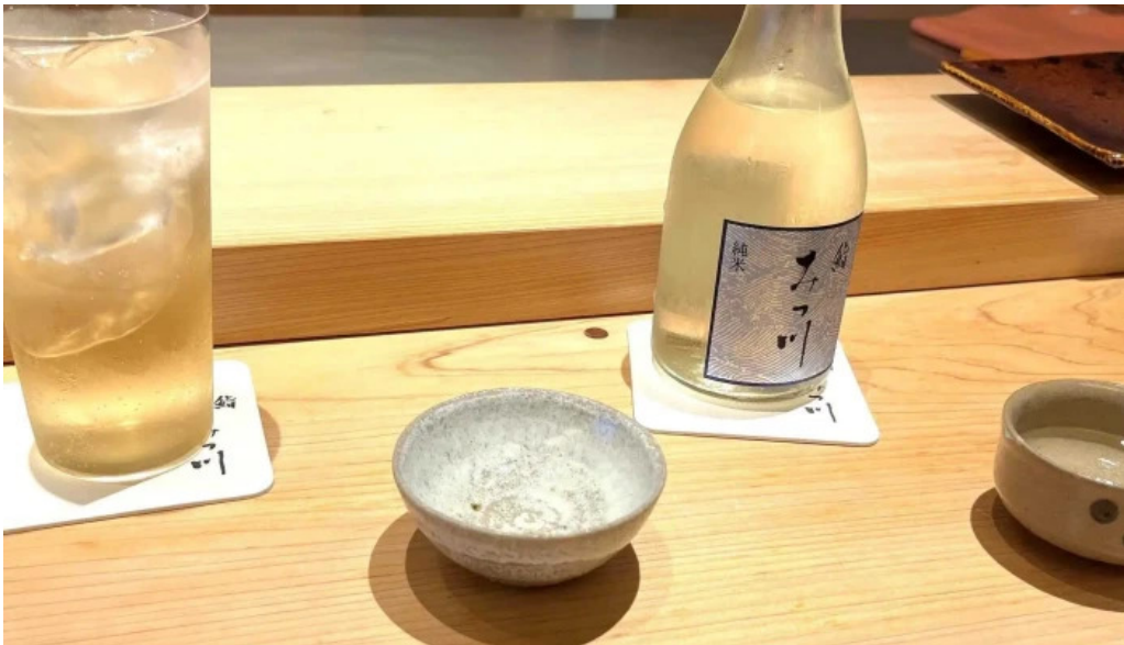
鮨みつ川ニセコ店 営業時間