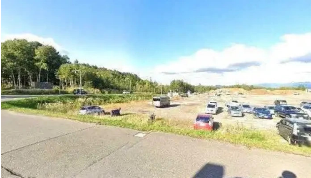
鯔みつ川ニセコ店 倶知安町