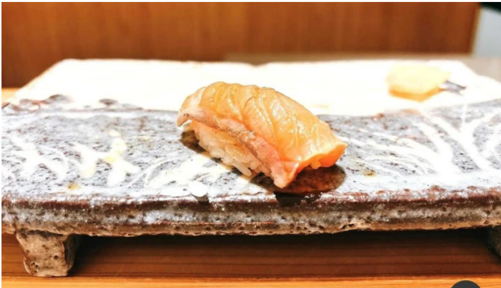
鮭みつ川ニセコ店 料理飲み物