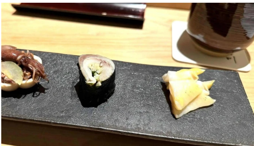
鯨みつ川ニセコ店 どこ