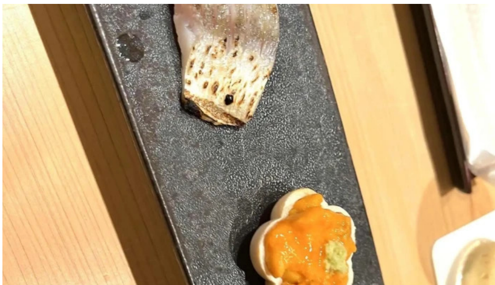
鯨みつ川ニセコ店 ウェブサイト