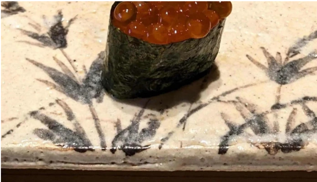
鮨みつ川ニセコ店 営業中