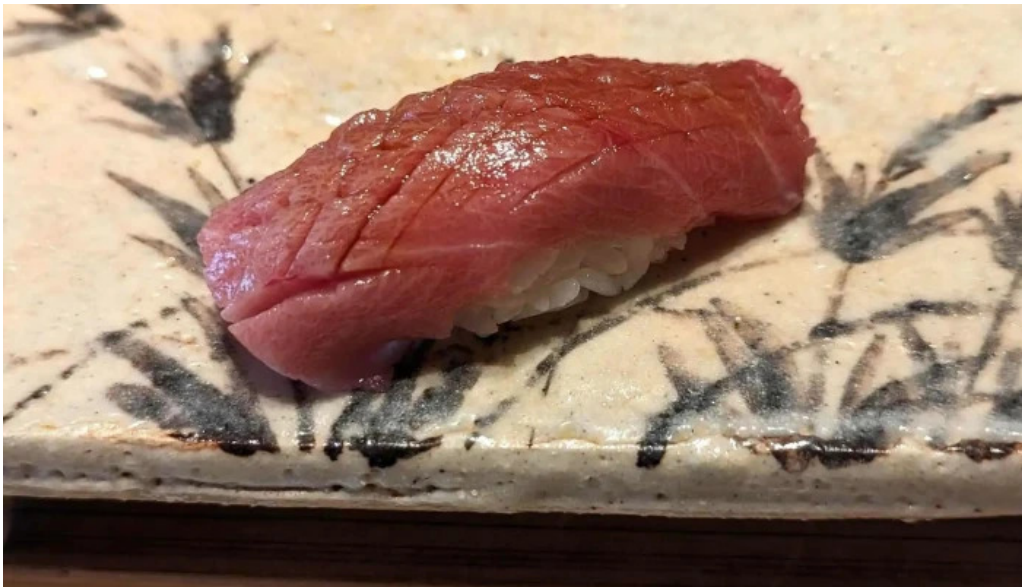
鯨みつ川ニセコ店 写真