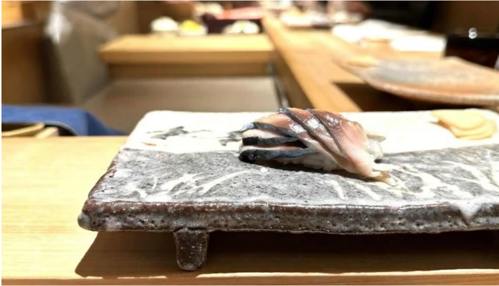
鮭みつ川ニセコ店 番号