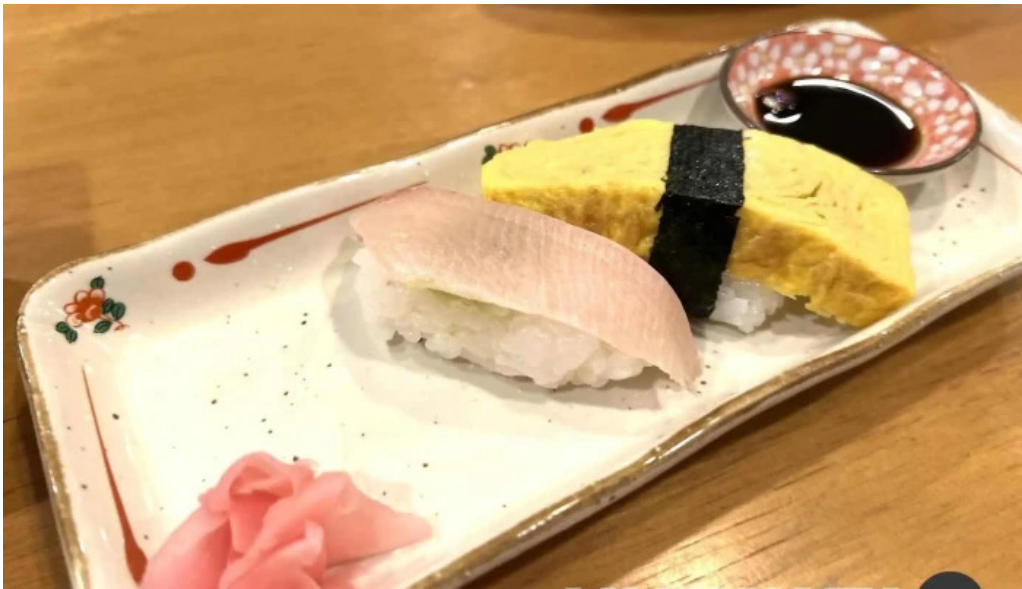
重兵衛 料理飲み物