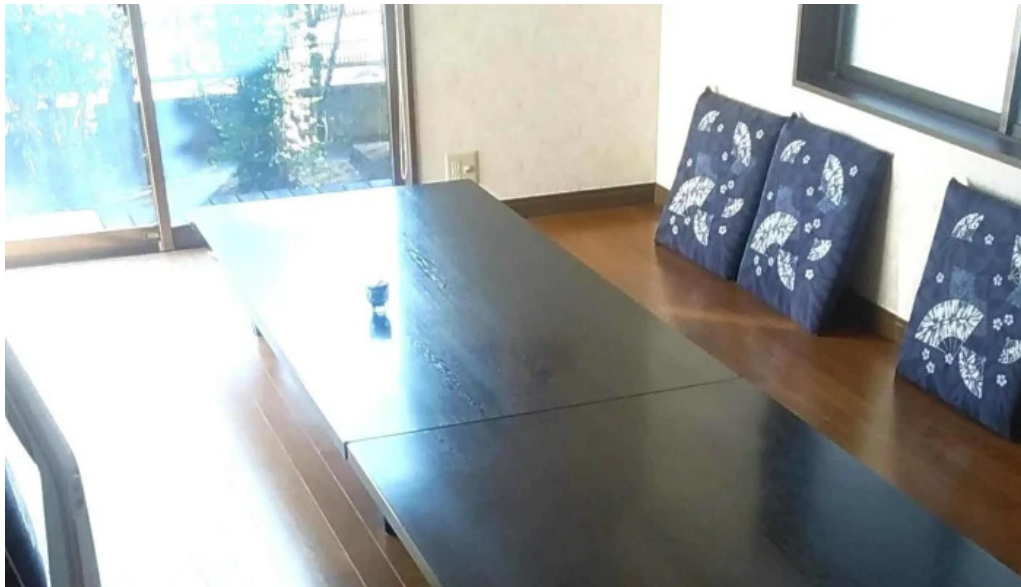
重兵衛 ウェブサイト