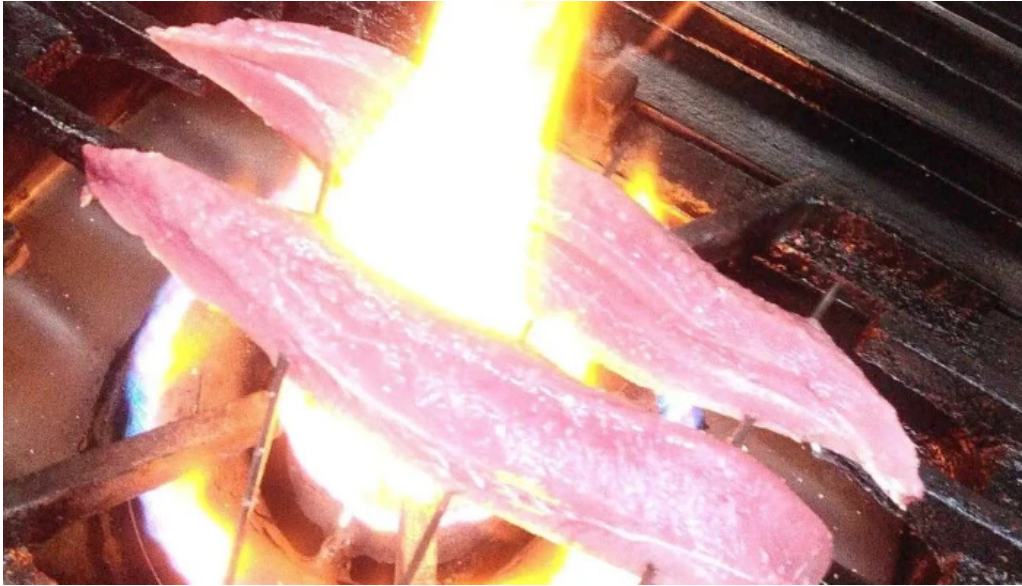
和彩二代目