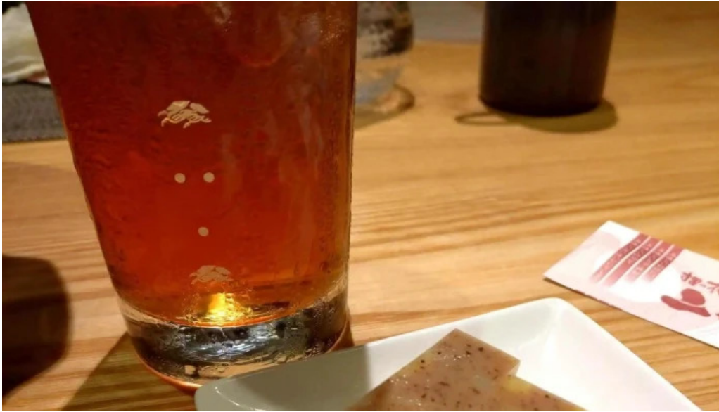
和彩二代目 所在地