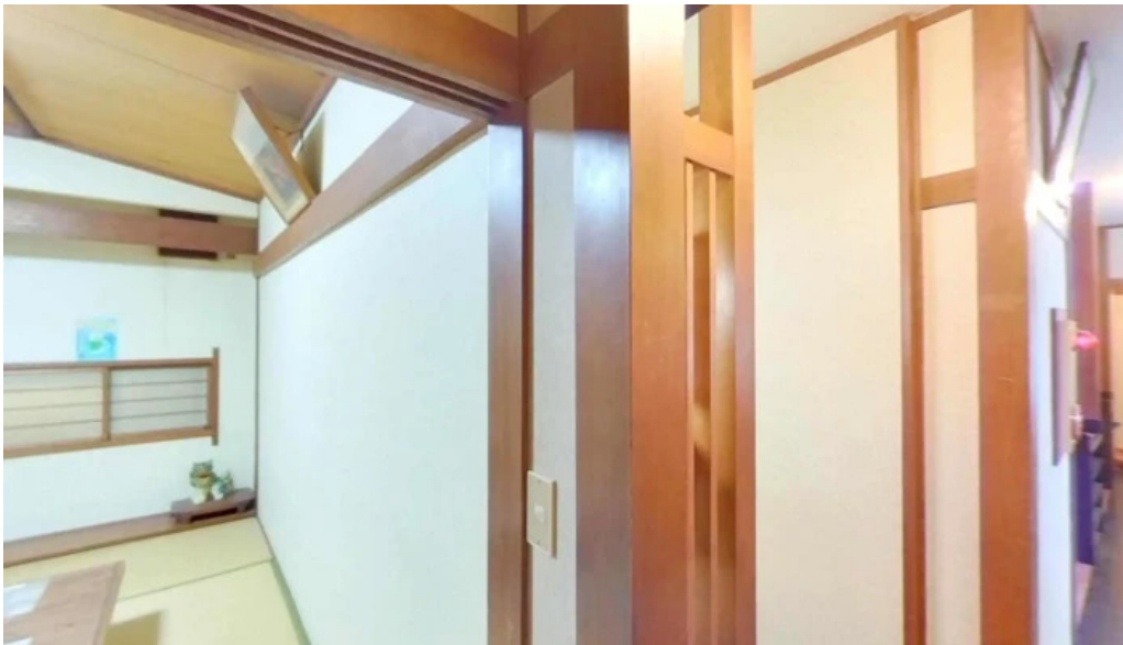
和彩二代目 人吉市