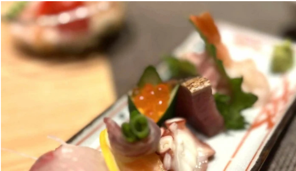
和彩二代目 ウェブサイト