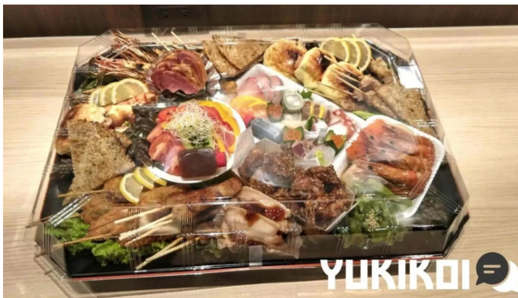
和彩二代目 料理飲み物