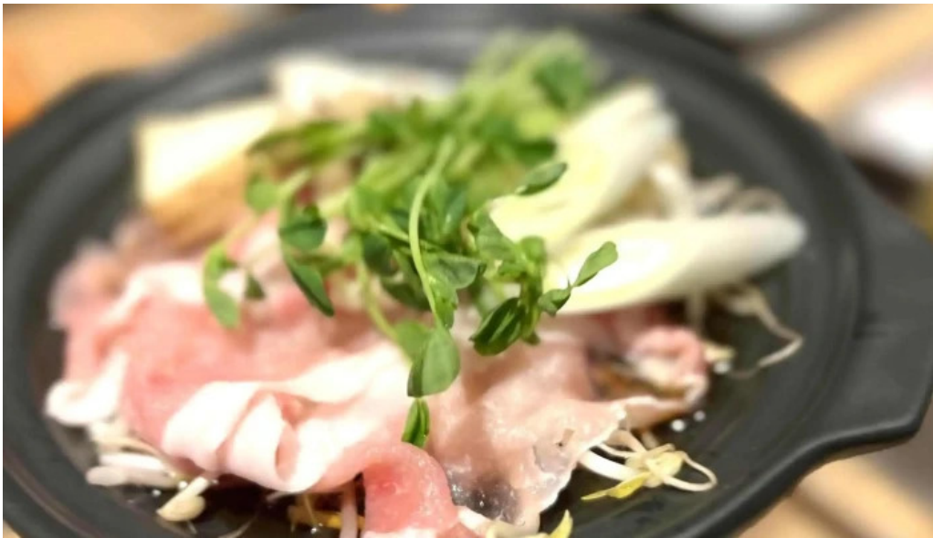
和彩二代目 口コミ