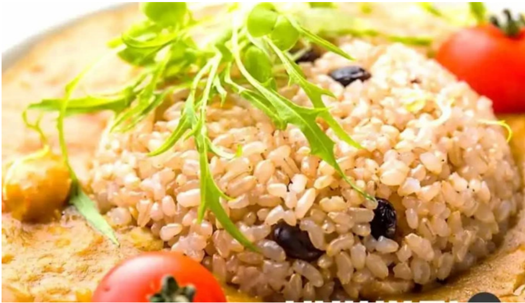
Niseko farms 味楽屢ゆきやgfdvfwfnggfvomuslimfriendly