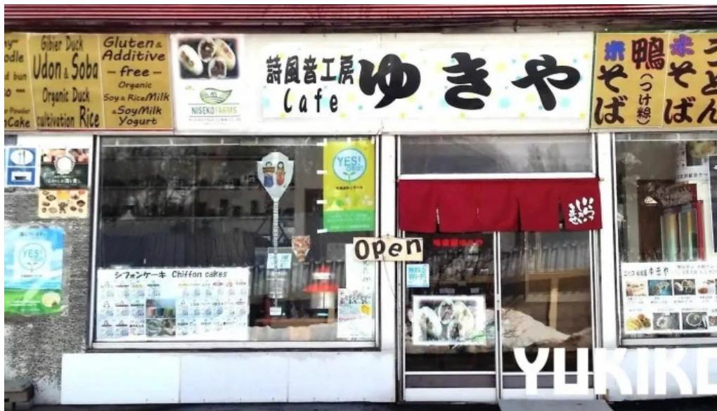
Niseko farms 味楽庵ゆきや gf・df・v・wf・ng・gf・v・o・muslimfriendly ニセコ町