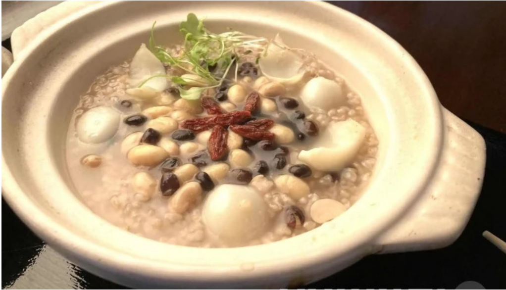
Niseko farms 味楽 屢ゆきやgfdvfwfnggf vomuslimfriendly スープ