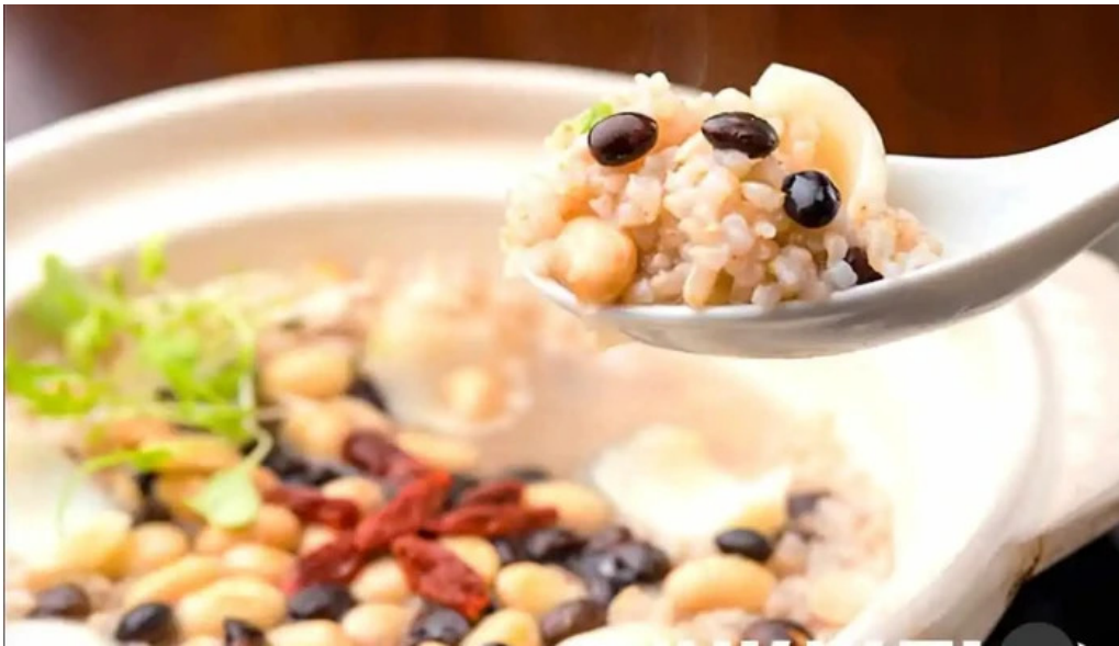
Niseko farms 味楽屢ゆきやgfdvfwfnggfvomuslimfriendly 料理飲み物