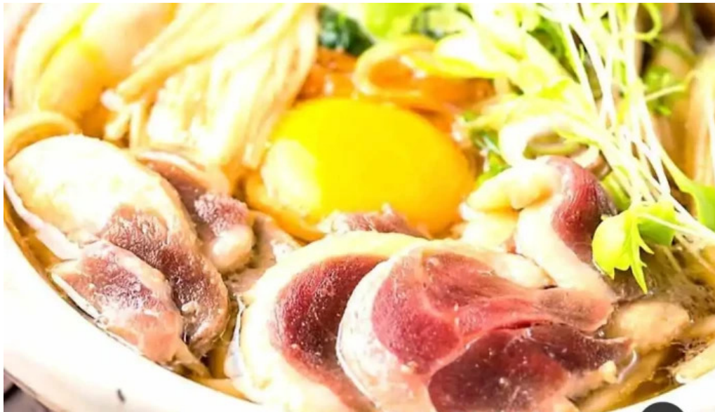
Niseko farms 味楽庵ゆきやgfdvfwfnggfvomuslimfriendly 鍋料理