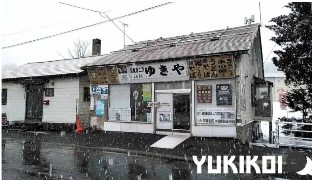
Niseko farms 味楽屢ゆきやgfdvfwnggfvomuslimfriendly 動画