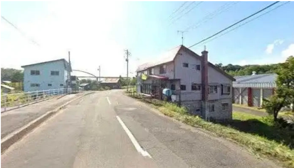
Niseko farms 味楽庵ゆきやgfdvfwfnggfvomuslimfriendly ニセコ町