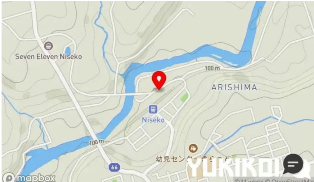
Niseko farms 味楽屢ゆきやgfdvfwnggfvomuslimfriendly 地図