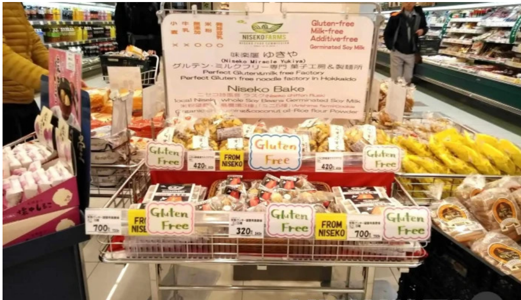
Niseko farms 味楽庵ゆきやgfdvfwfnggfvomuslimfriendly 雰囲気