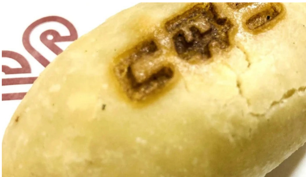
Niseko farms 味楽庵ゆきやgdfvfwfnggfvmuslimfriendly 電話