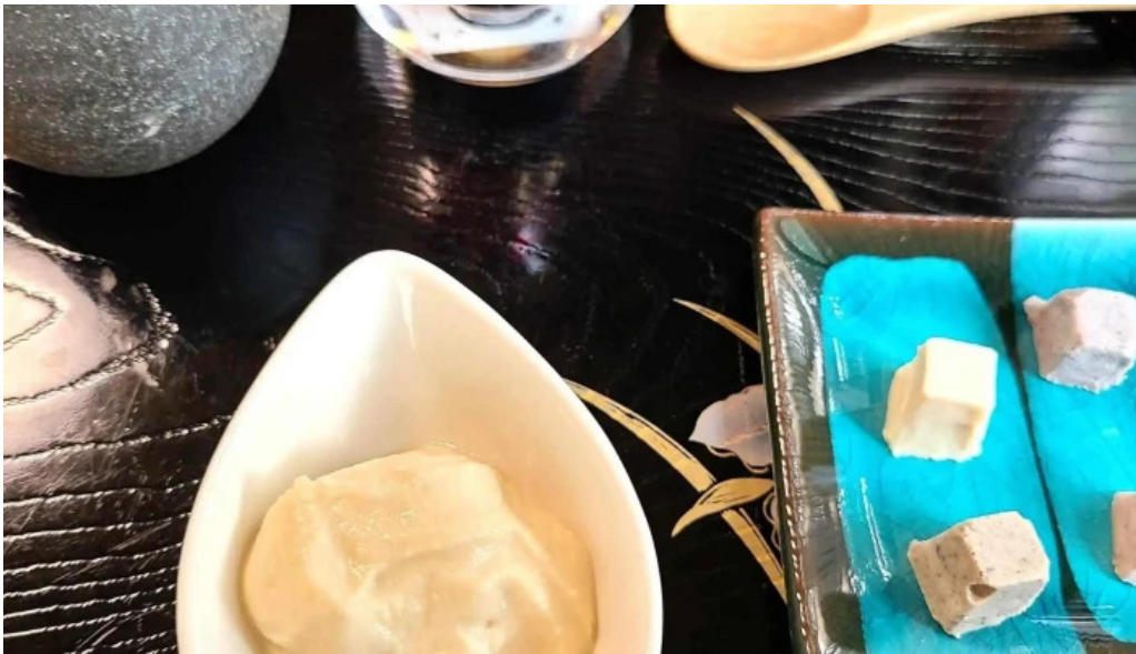
Niseko farms 味楽屢ゆきやgfdvfwfnggfvomuslimfriendly instagram