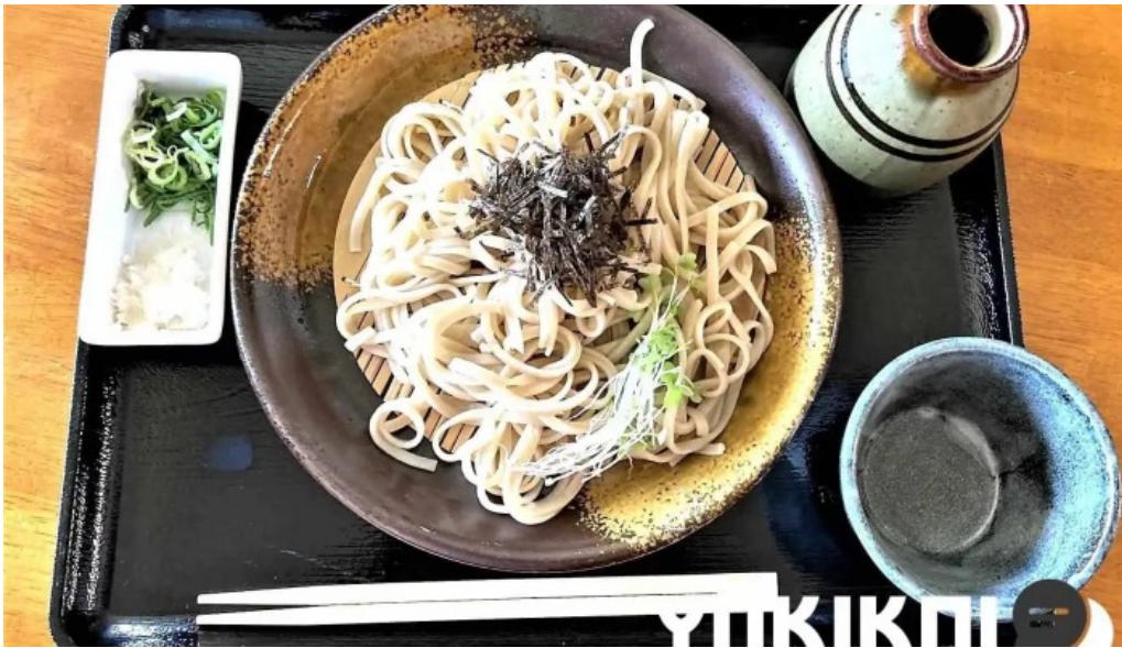
Niseko farms 味楽屢ゆきやgfdvfwfnggfvomuslimfriendly 蕎麦