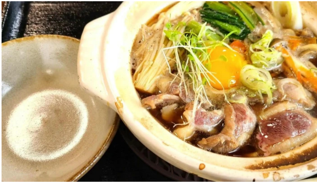
Niseko farms 味楽優ゆきやgfdvfwfnggf vomuslimfriendly コメント