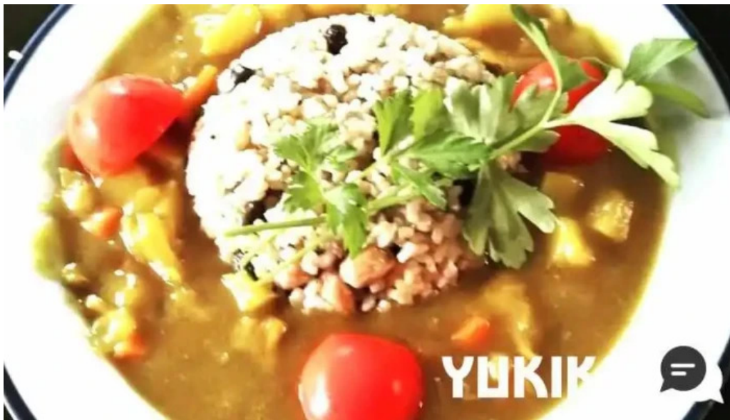
Niseko farms 味楽優ゆきやgfdvfwfnggf vomuslimfriendly カレー