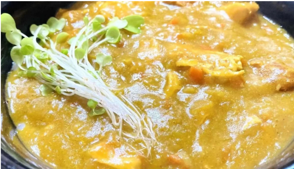
Niseko farms 味楽 屢ゆきやgfdvfwfnggf vomuslimfriendly スコア