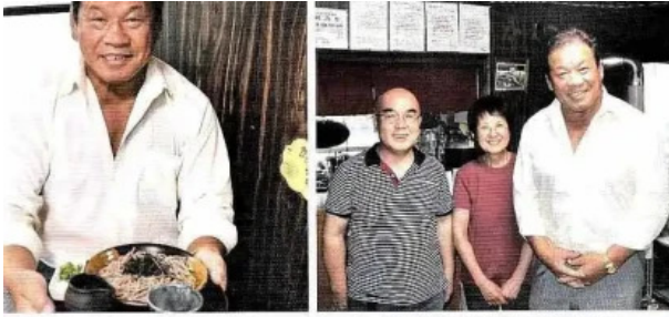
発芽玄米を使ったグルテンフリーそば、舌にざらつく口当たりや、シャキッとした食感に驚く。