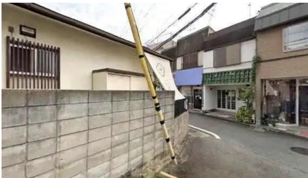
辻山久養堂 長岡京市