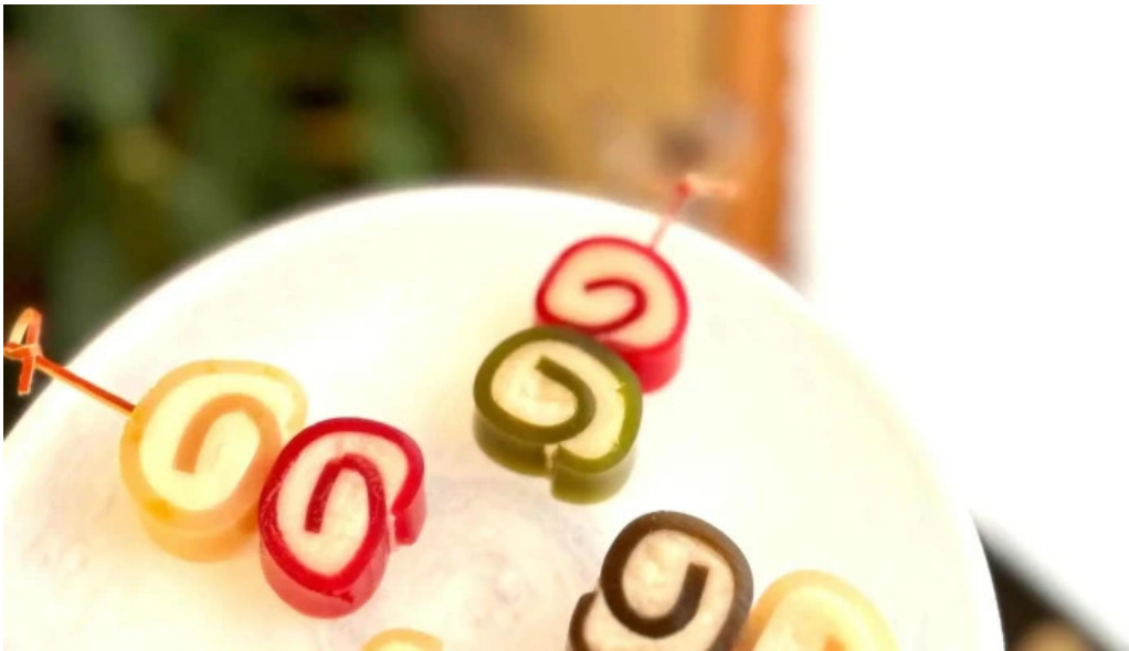
辻山久養堂 料理飲み物