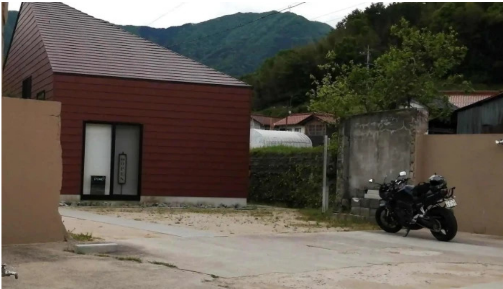
ダイニング pond comentario 5