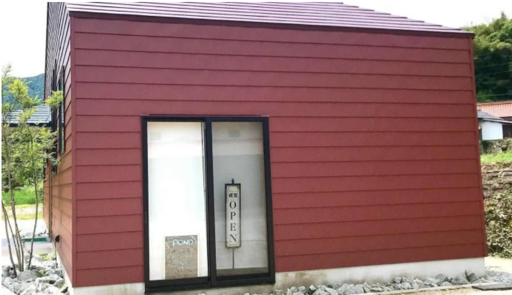
ダイニング pond comentario 9