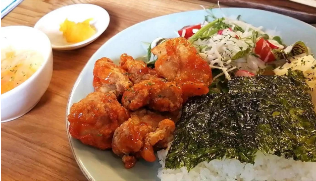
ダイニング pond comentario 6