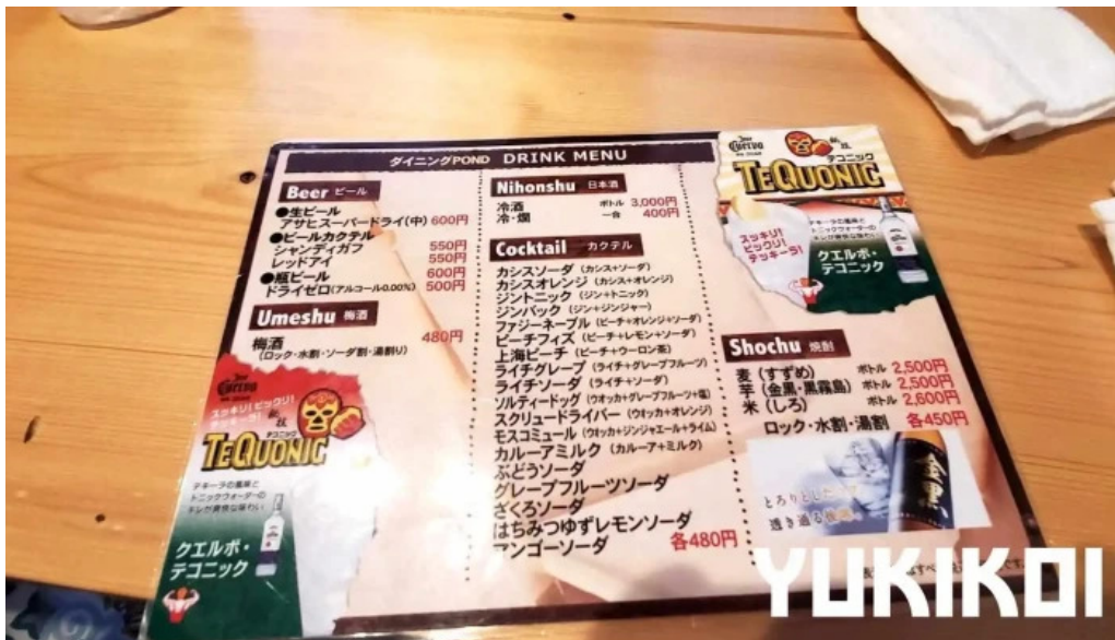
ダイニング pond メニュー