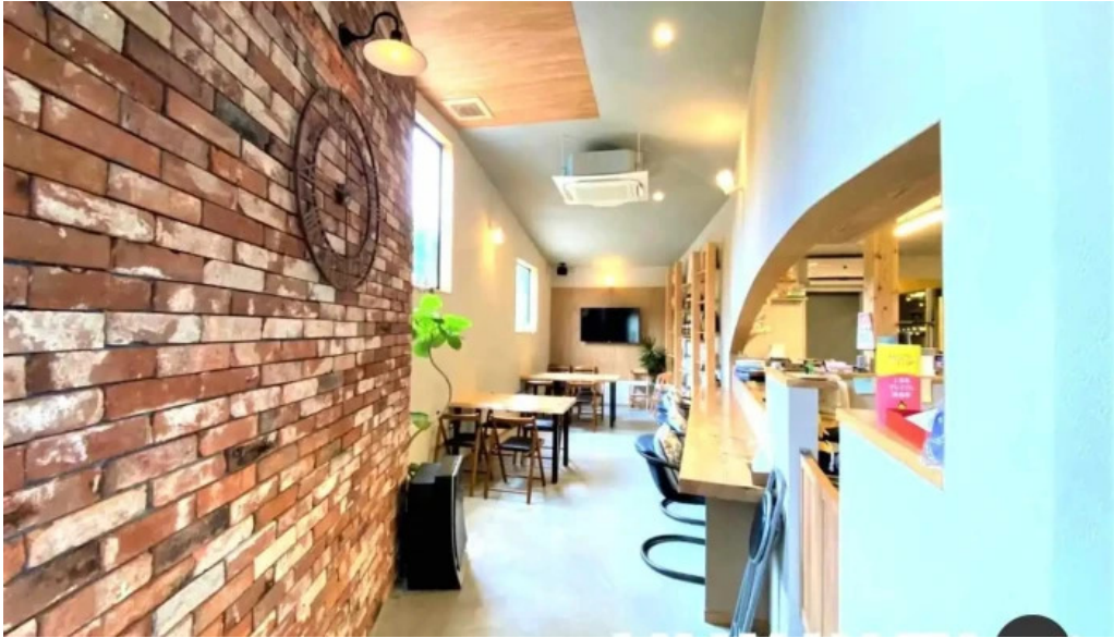
ダイニング pond すべて