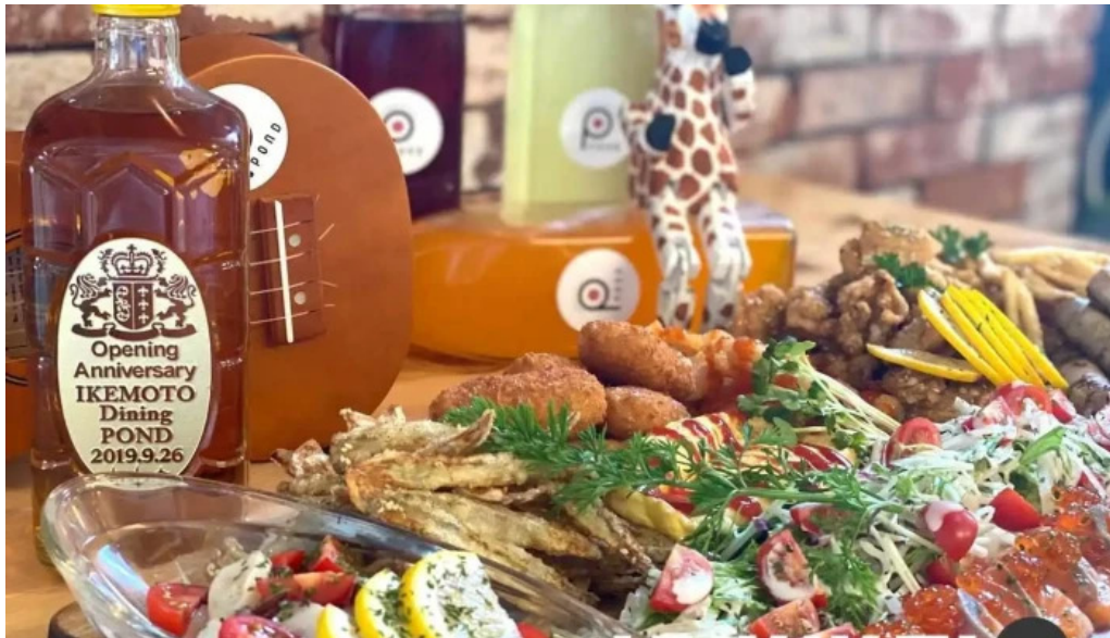
ダイニング pond 料理飲み物