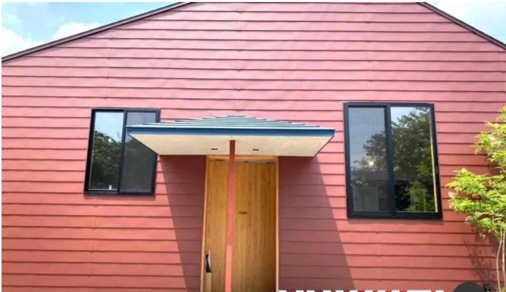
ダイニング pond