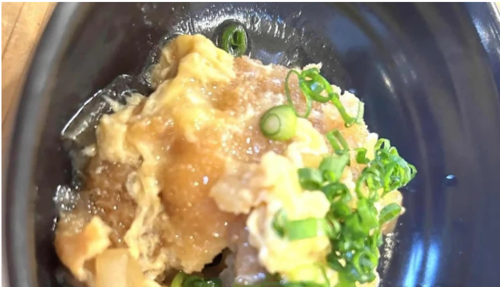
ダイニング pond comentario 3