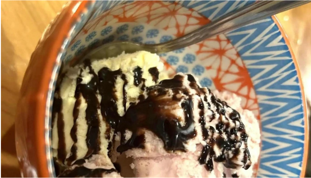
ダイニング pond comentario 4