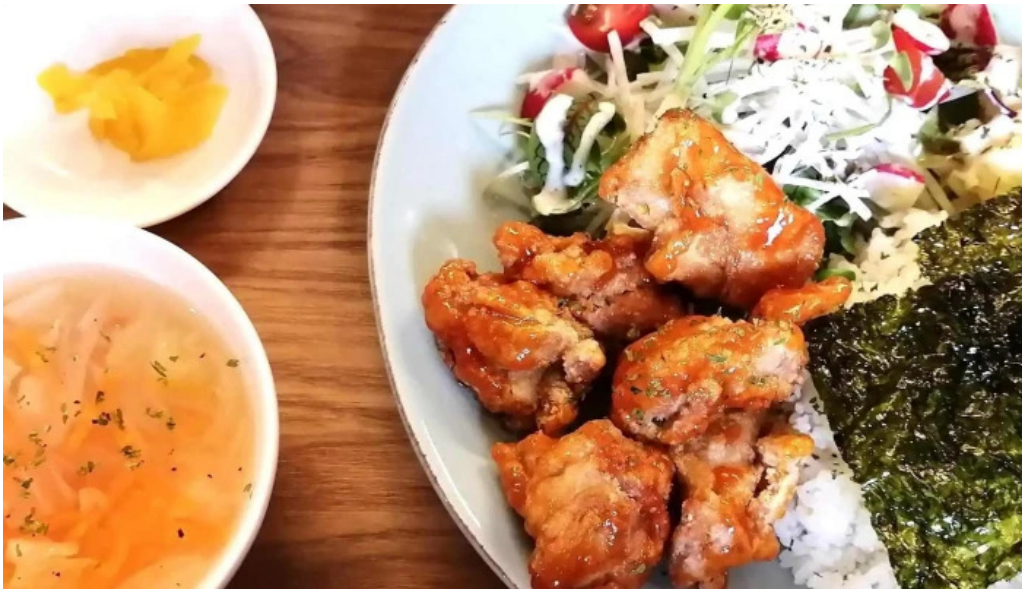
ダイニング pond comentario 7