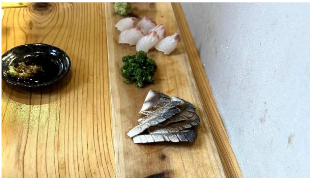
ダイニング pond comentario 2