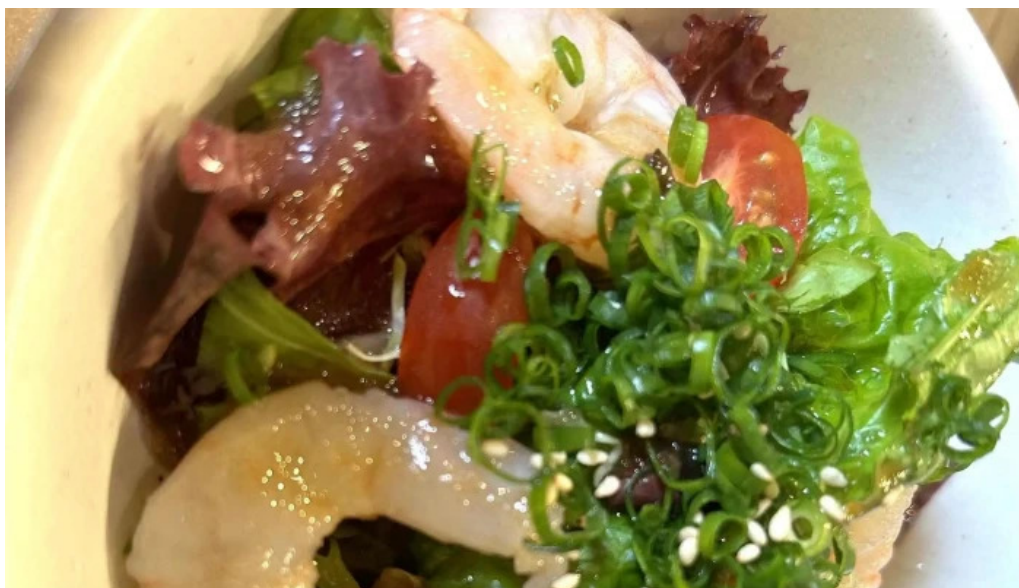
ダイニング pond comentario 1