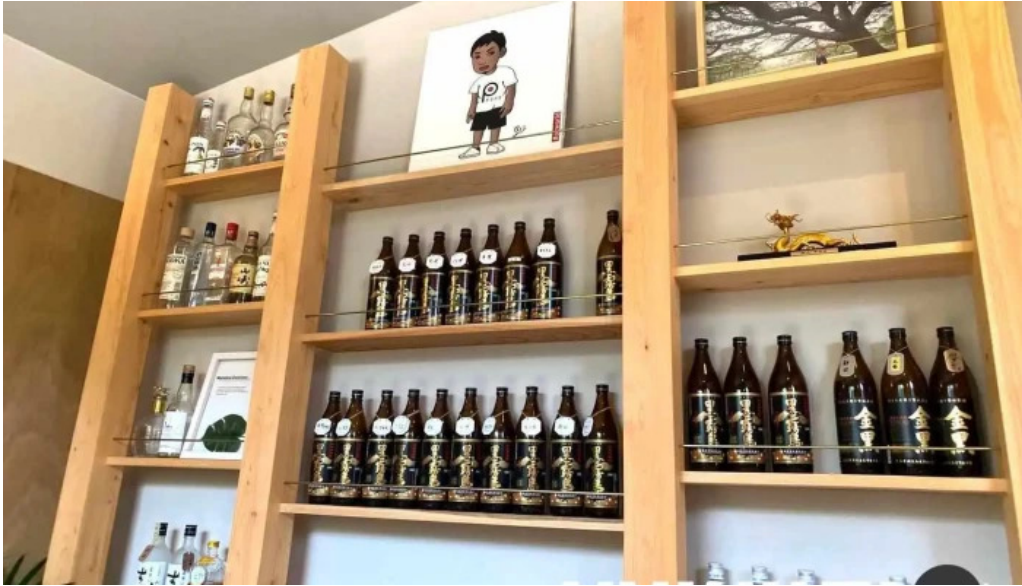
ダイニング pond 霧田気