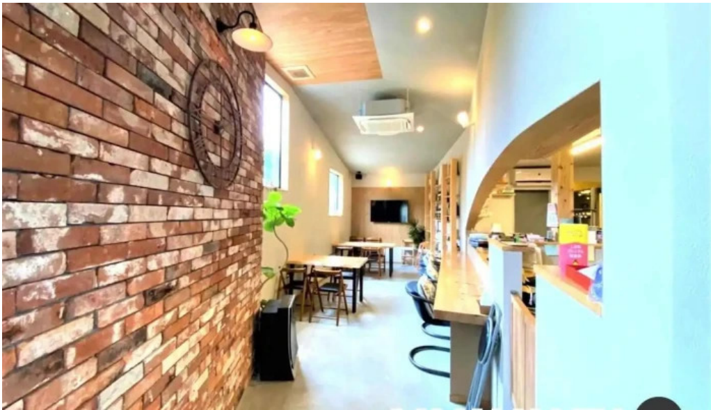
ダイニング pond 邑南町