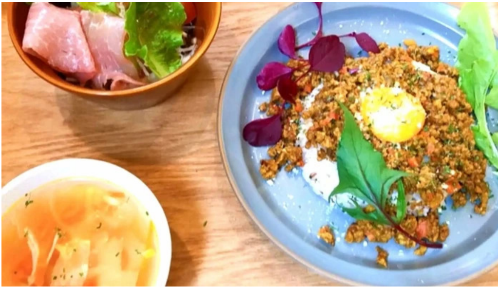
ダイニング pond comentario 8