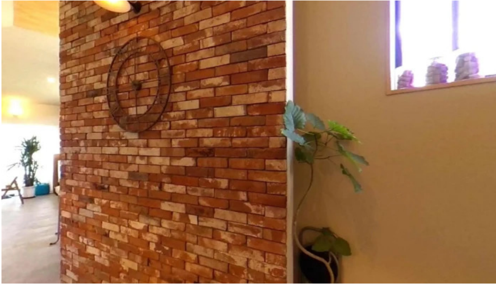
ダイニング pond ストリートビューと 360 ビュー