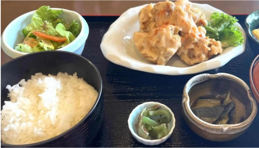
創作ダイニング ふじもと 番号