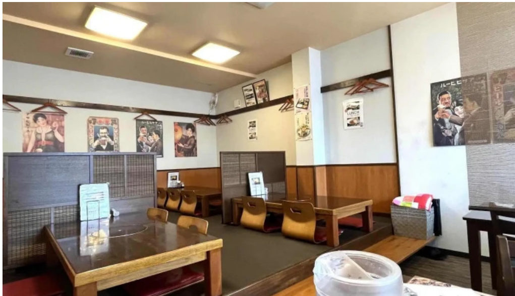
創作ダイニング ふじもと 所在地