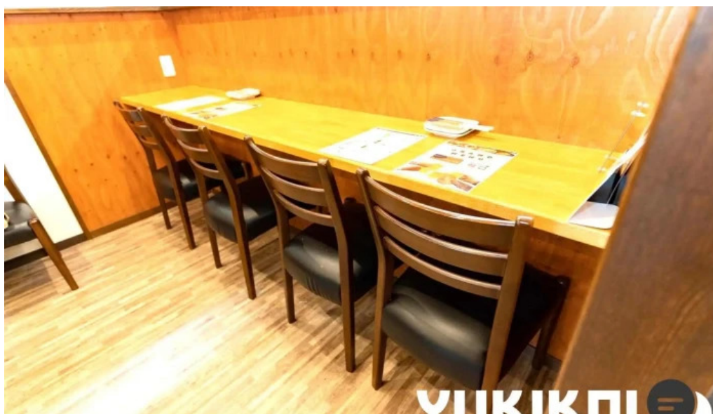
創作ダイニング ふじもと 雰囲気