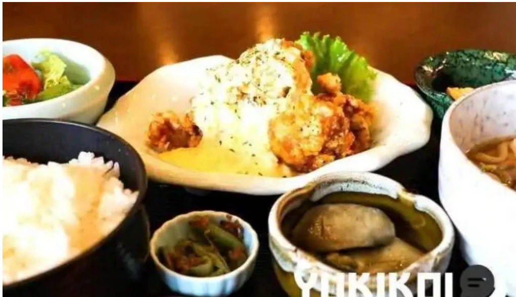
創作ダイニング ふじもと から揚げ