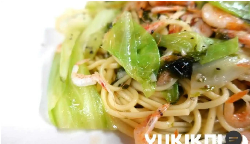
創作ダイニング ふじもと パスタ