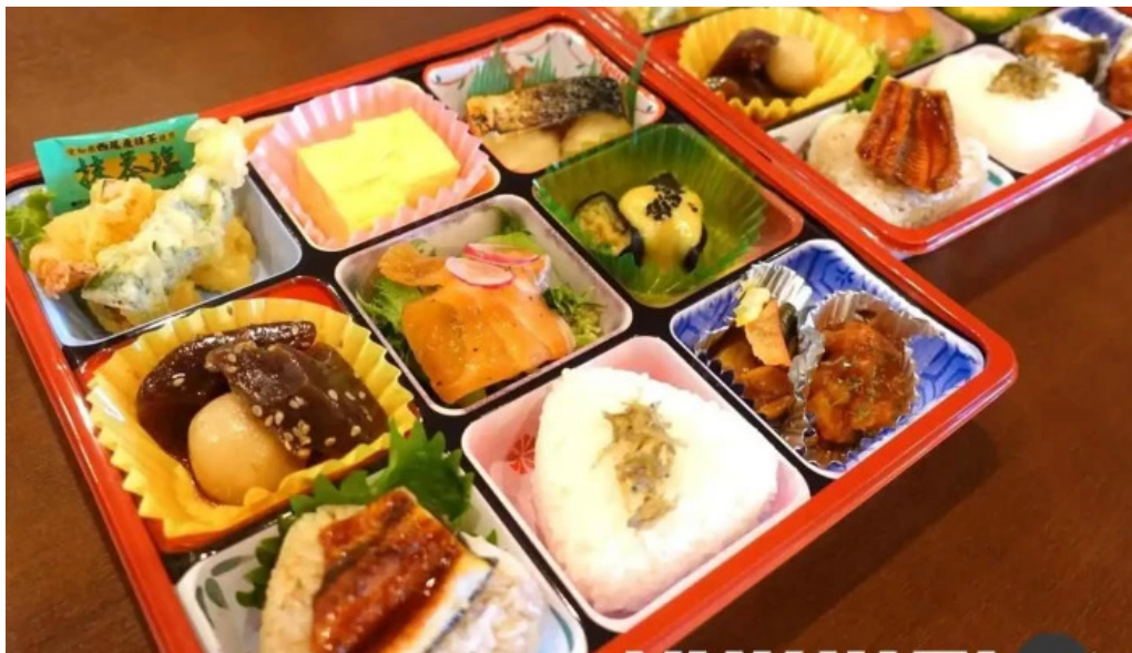
創作ダイニング ふじもと 弁当