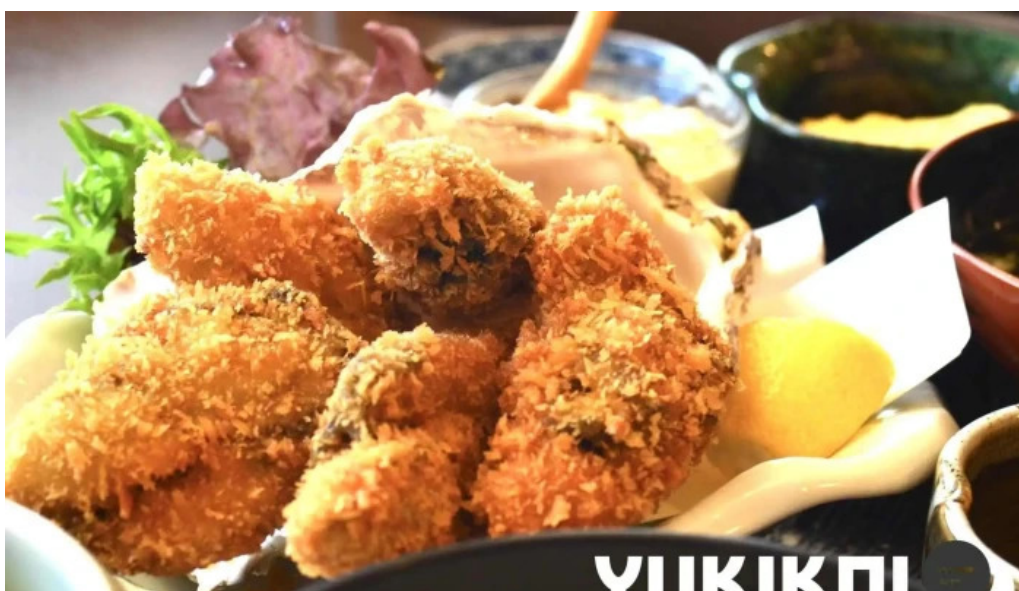
創作ダイニング ふじもと 料理飲み物