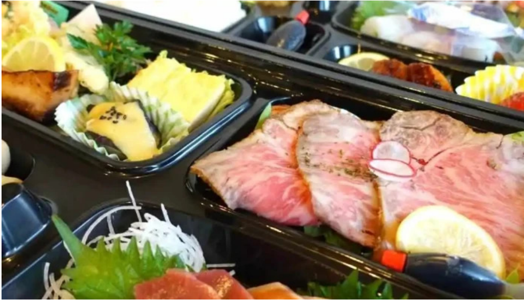
創作ダイニング ふじもと 刺身