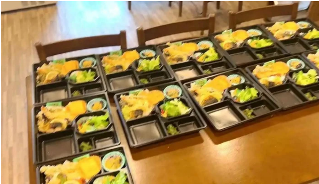
創作ダイニング ふじもと 動画