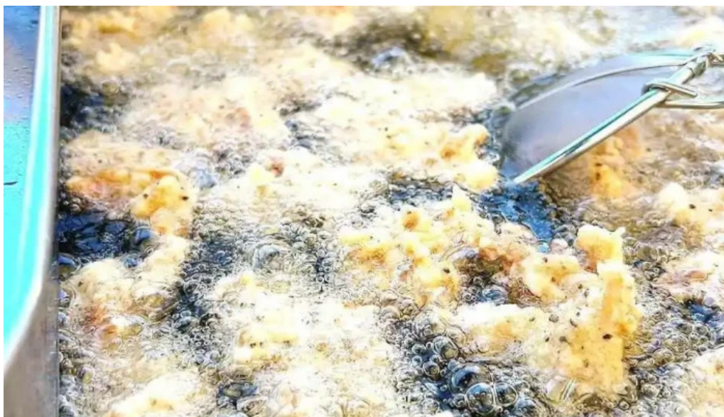
創作ダイニング ふじもと 最新