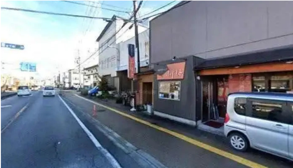
創作ダイニング ふじもと 桜井市