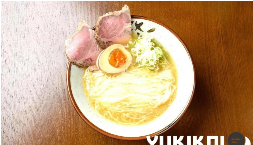
創作ダイニング ふじもと ラーメン