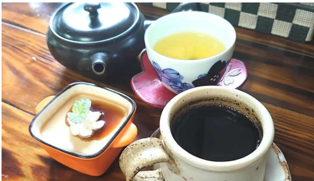
お茶の葉香園 コーヒー