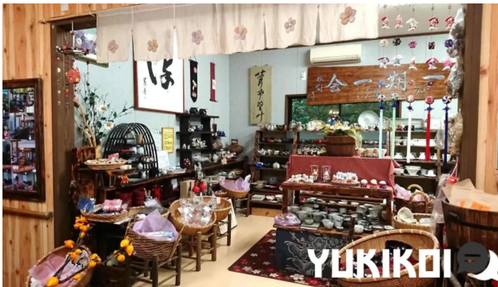
お茶の葉香園 雰囲気