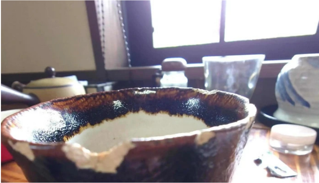
お茶の葉香園 営業時間