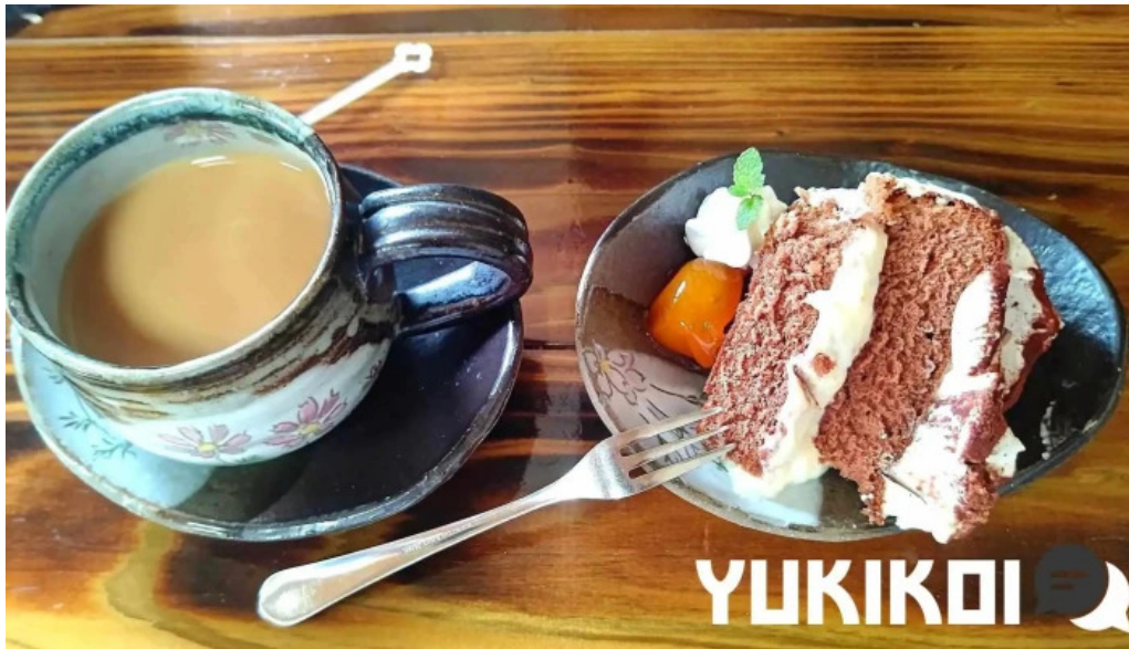
お茶の葉香園 料理飲み物