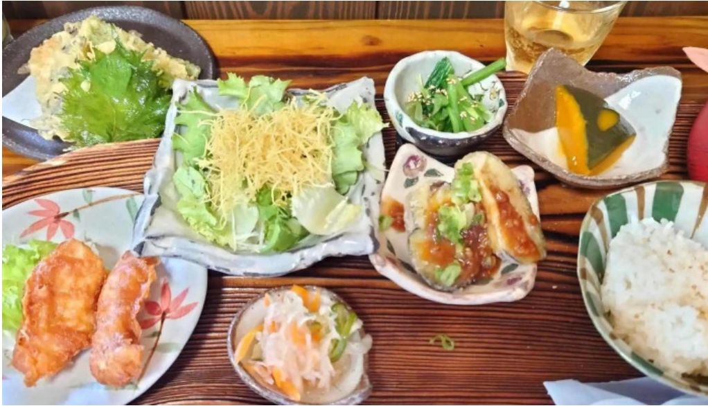
お茶の葉香園 行き方