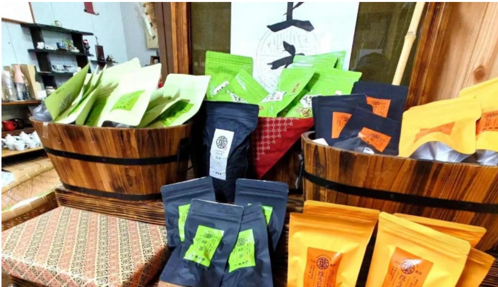
お茶の葉香園 営業中