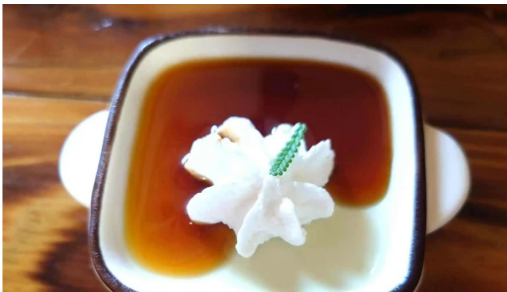
お茶の葉香園 どこ