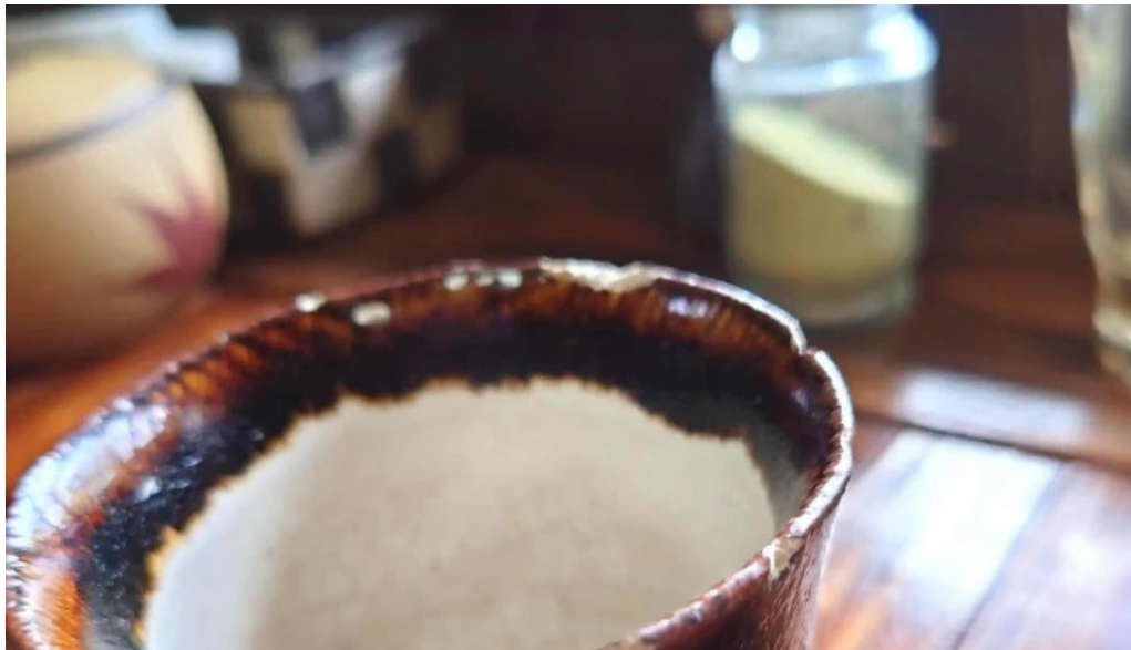
お茶の葉香園 所在地