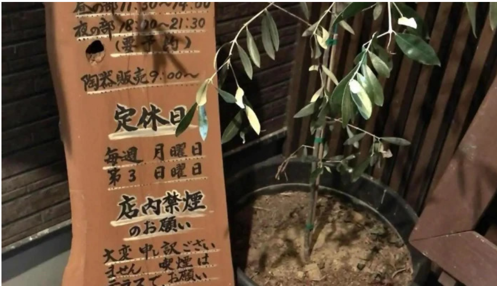
お茶の葉香園 メニュー