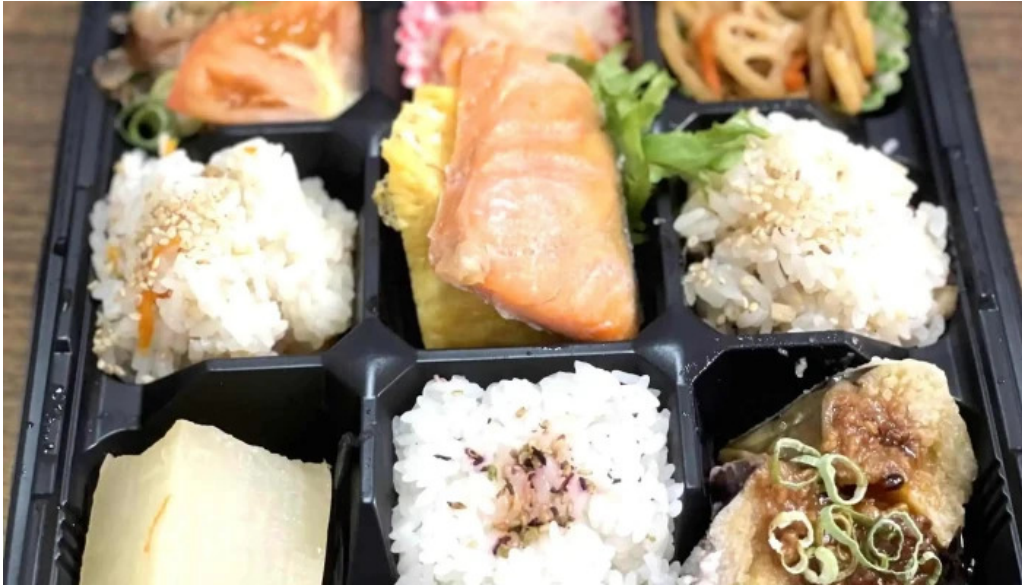
お茶の葉香園 弁当