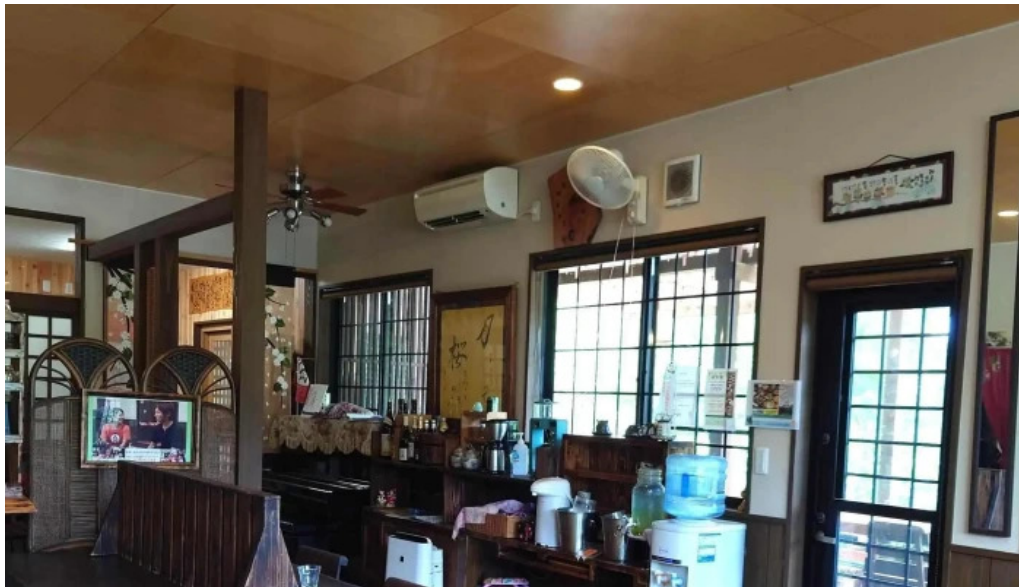
お茶の葉香園 写真