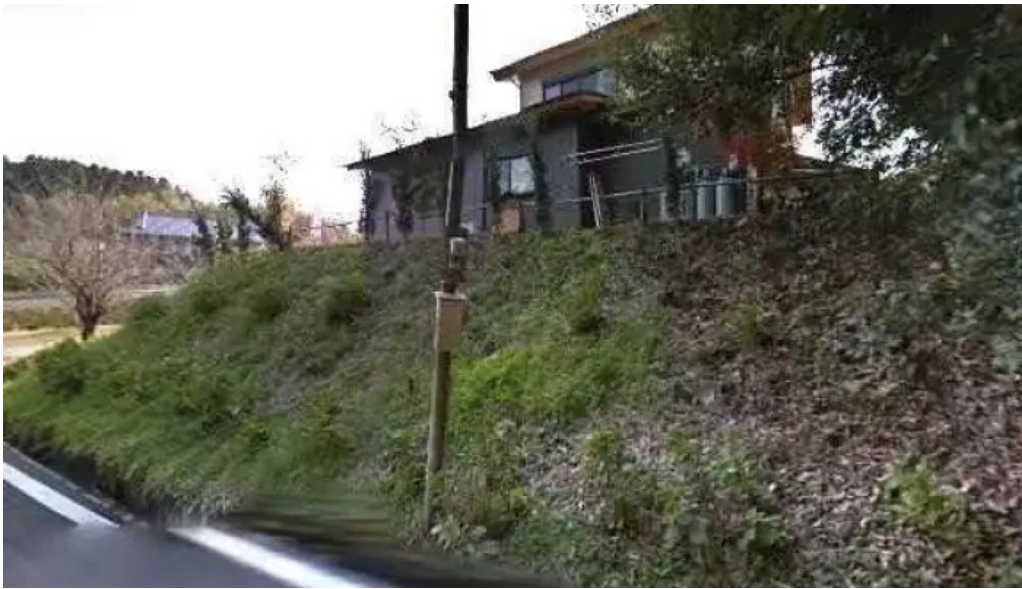
お茶の葉香園 串間市