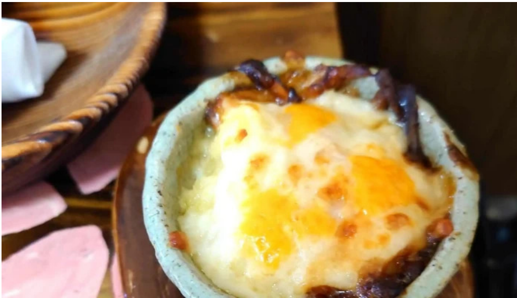
お茶の葉香園 番号