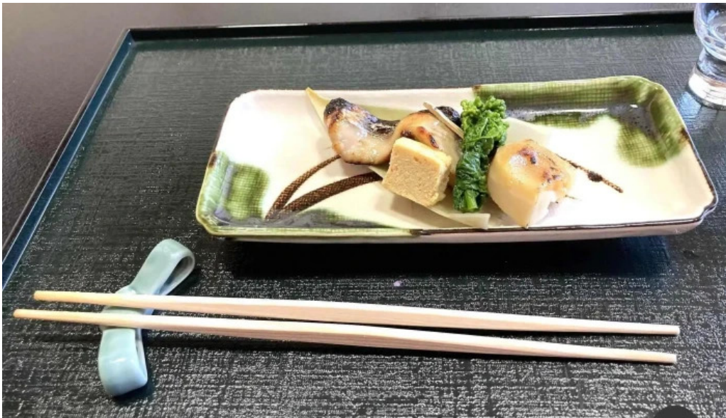
日本料理 竹茂 料理飲み物