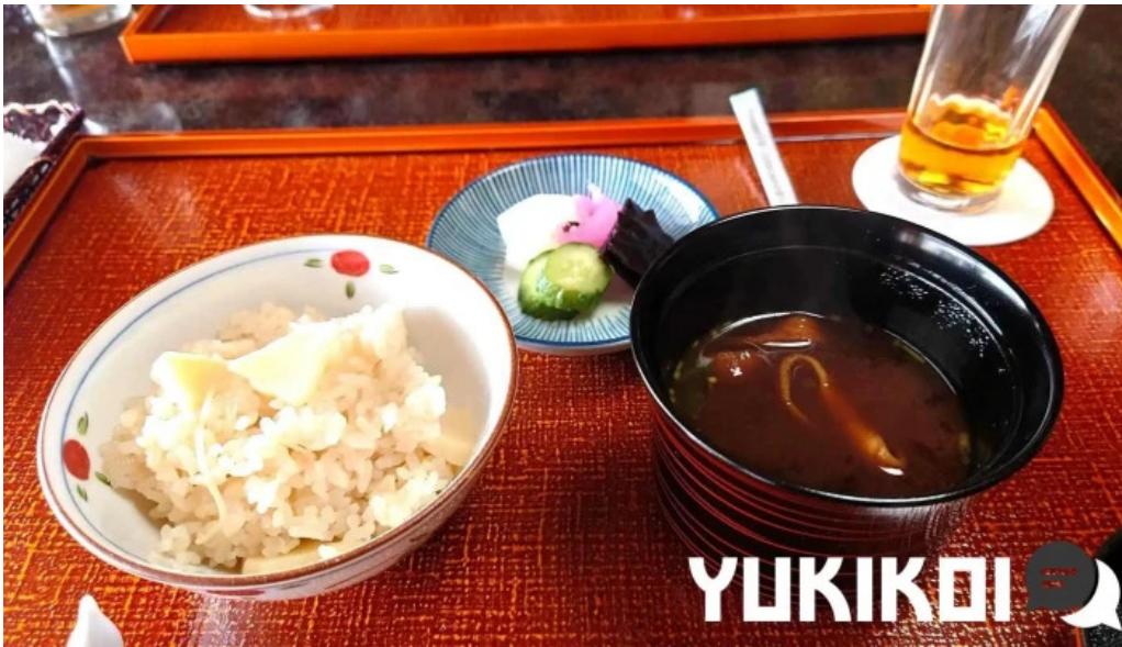
日本料理 竹茂 スープ