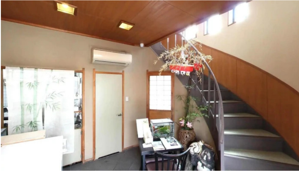
日本料理 竹茂 長岡京市