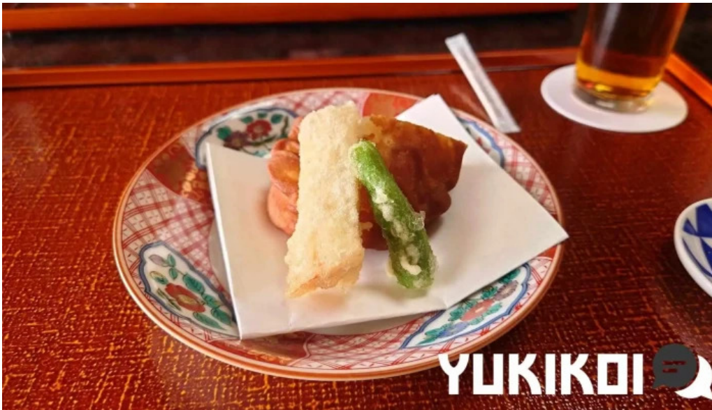
日本料理 竹茂 天ぷら