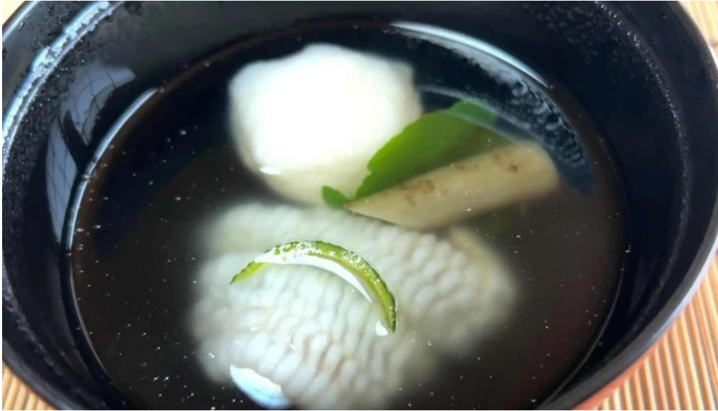
日本料理 竹茂 プロモーション