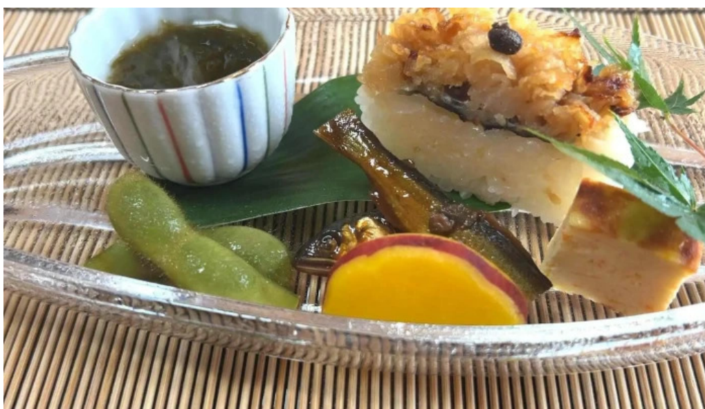
日本料理 竹茂 カタログ