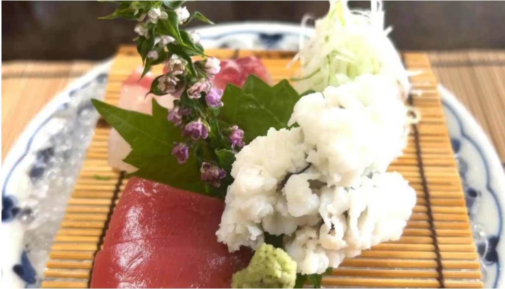
日本料理 竹茂 動画