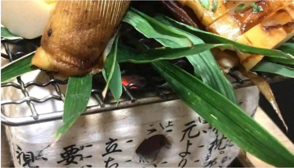
日本料理 竹茂 懐石