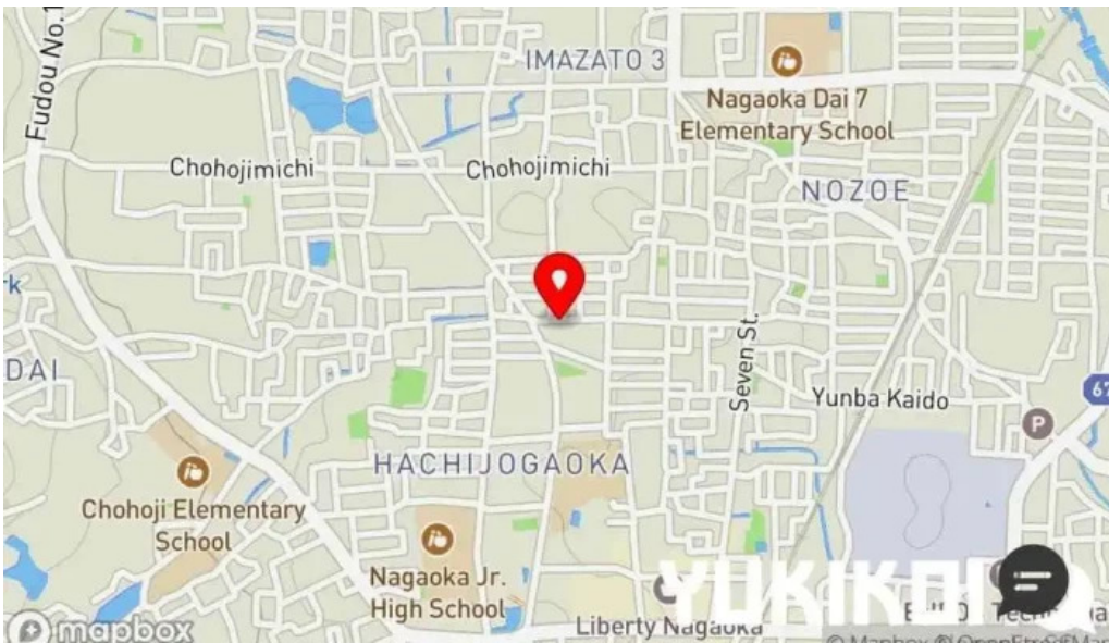
日本料理 竹茂 地図