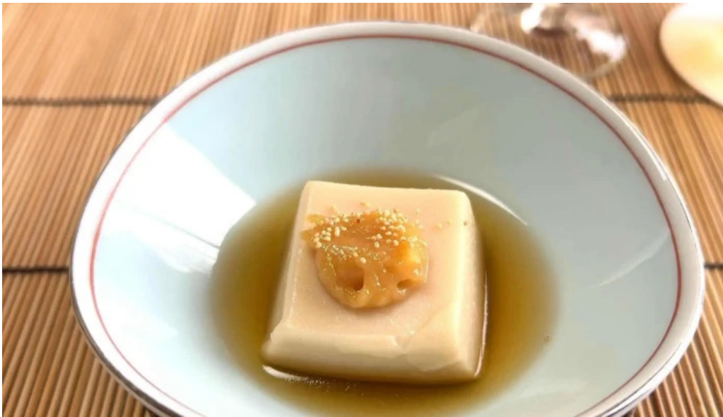
日本料理 竹茂 割引