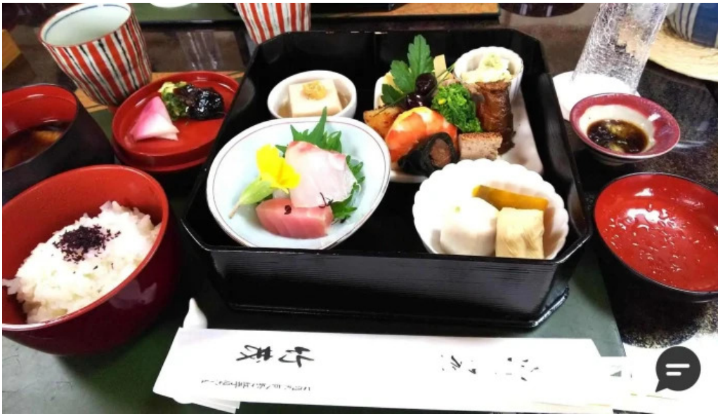
日本料理 竹茂 弁当