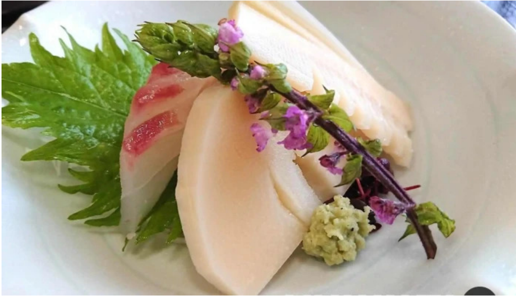
日本料理 竹茂 刺身