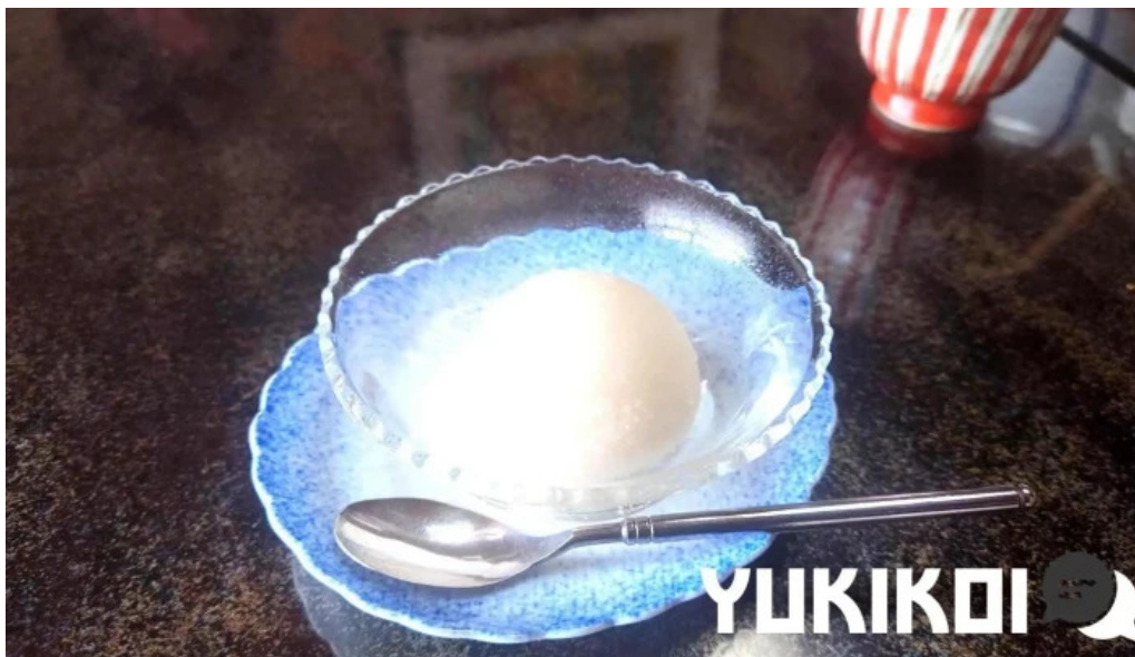
日本料理 竹茂 餅