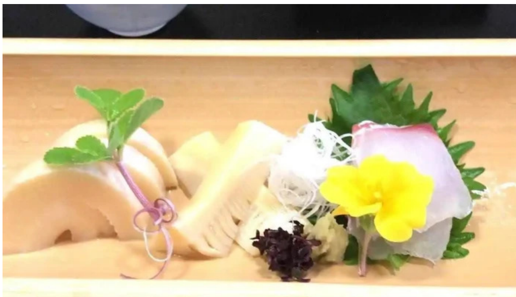
日本料理 竹茂 サバ