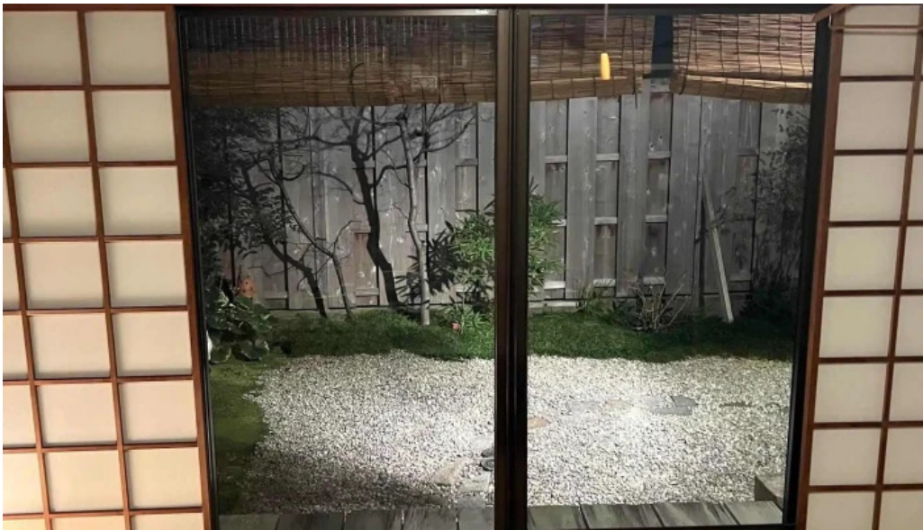
木波屋雑穀堂 住所