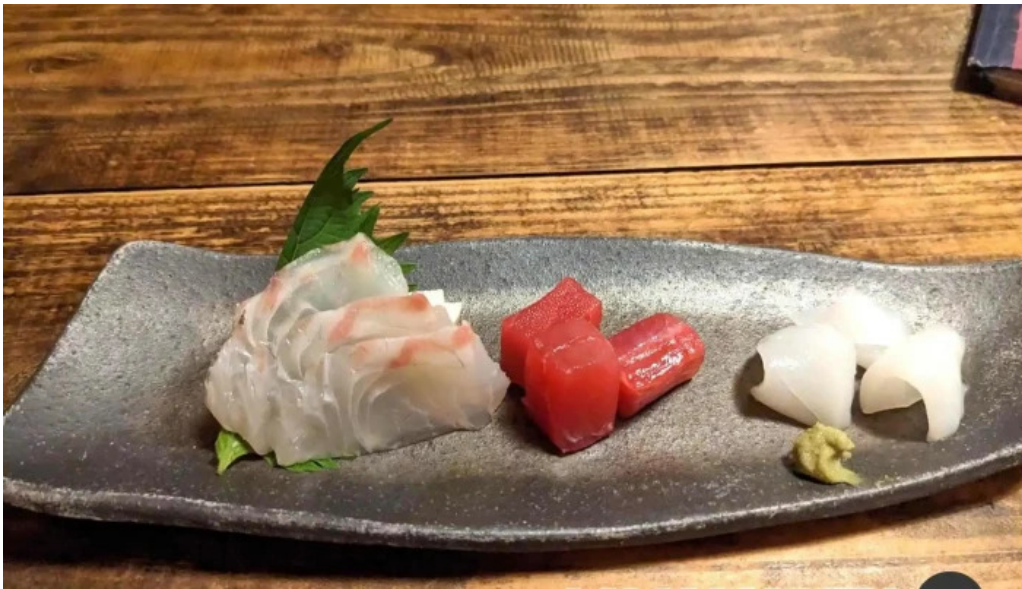
木波屋雑穀堂 刺身