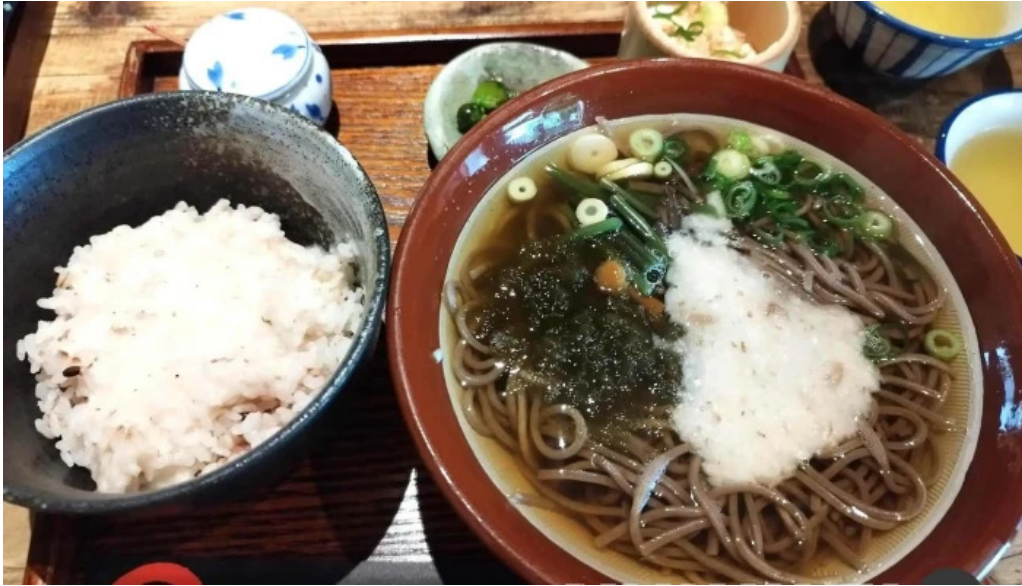
木波屋雑穀堂 蕎麦