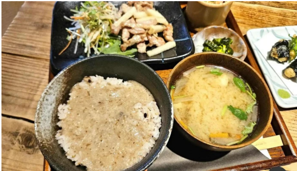
木波屋雑穀堂 スープ