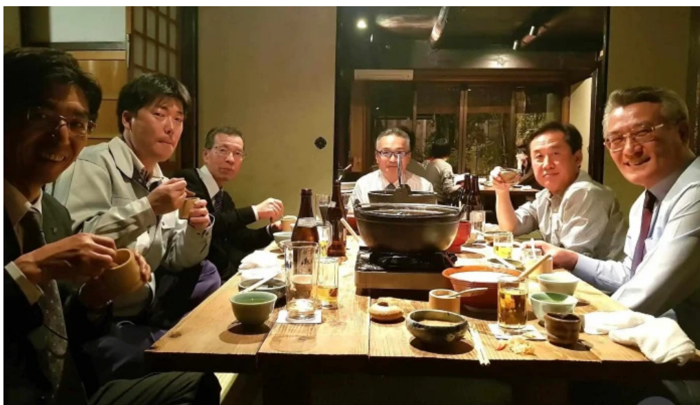
木波屋雑穀堂 雰囲気