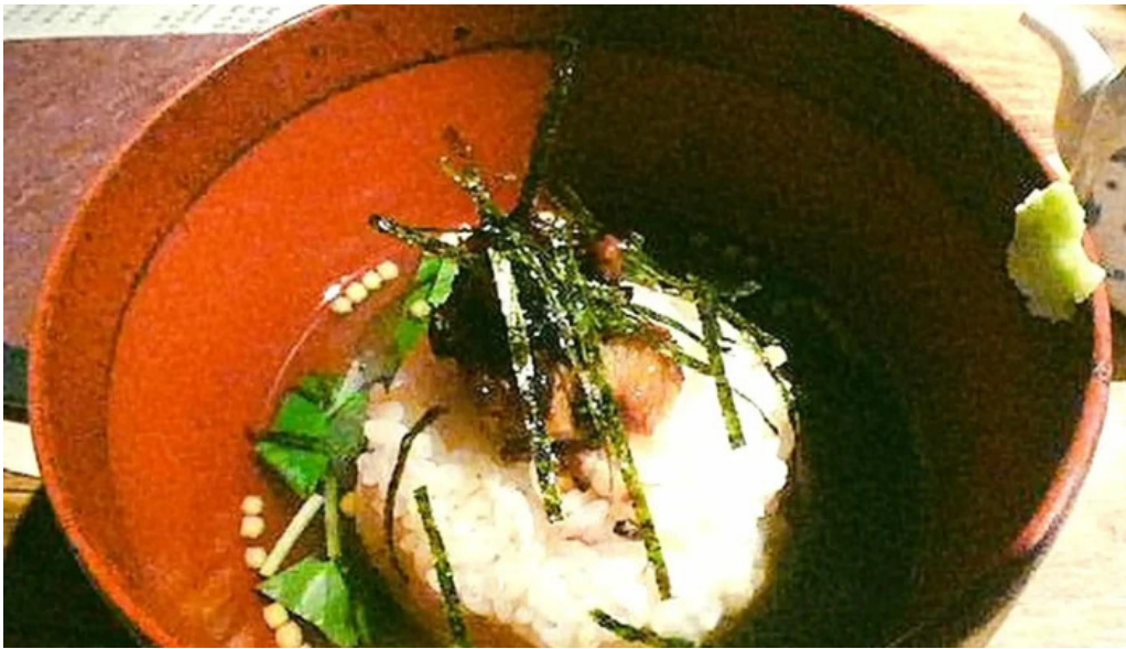
木波屋雑穀堂 割引