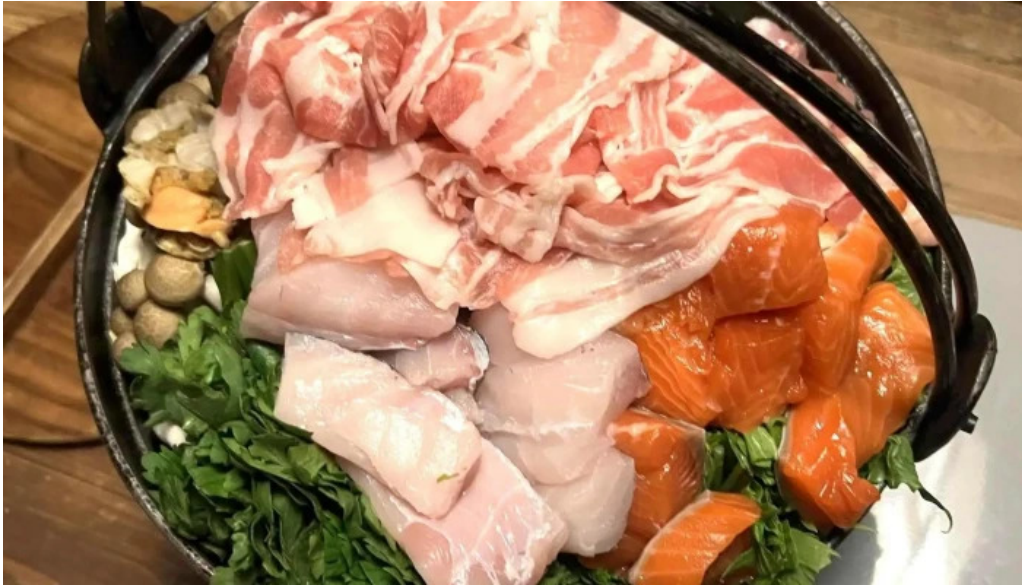
木波屋雑穀堂 営業時間