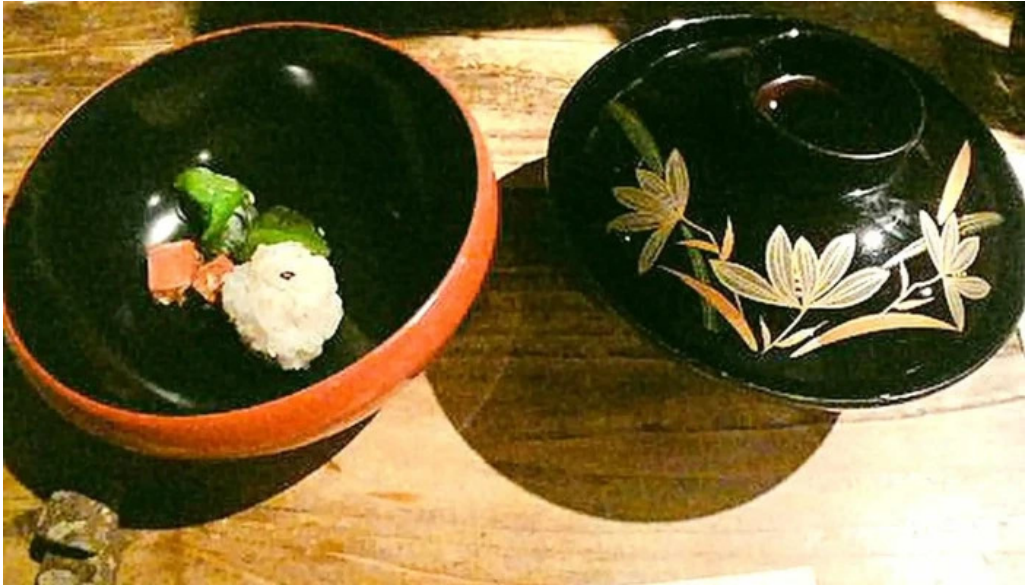
木波屋雑穀堂 写真