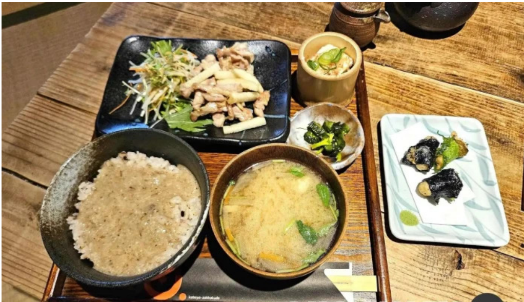
木波屋雑穀堂 味噌汁