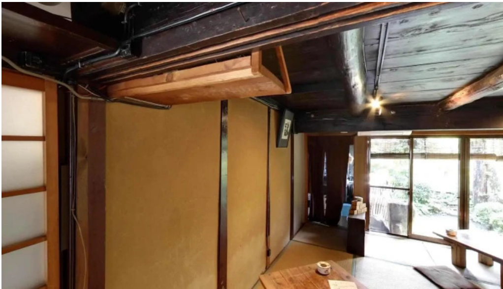
木波屋雑穀堂 草津市