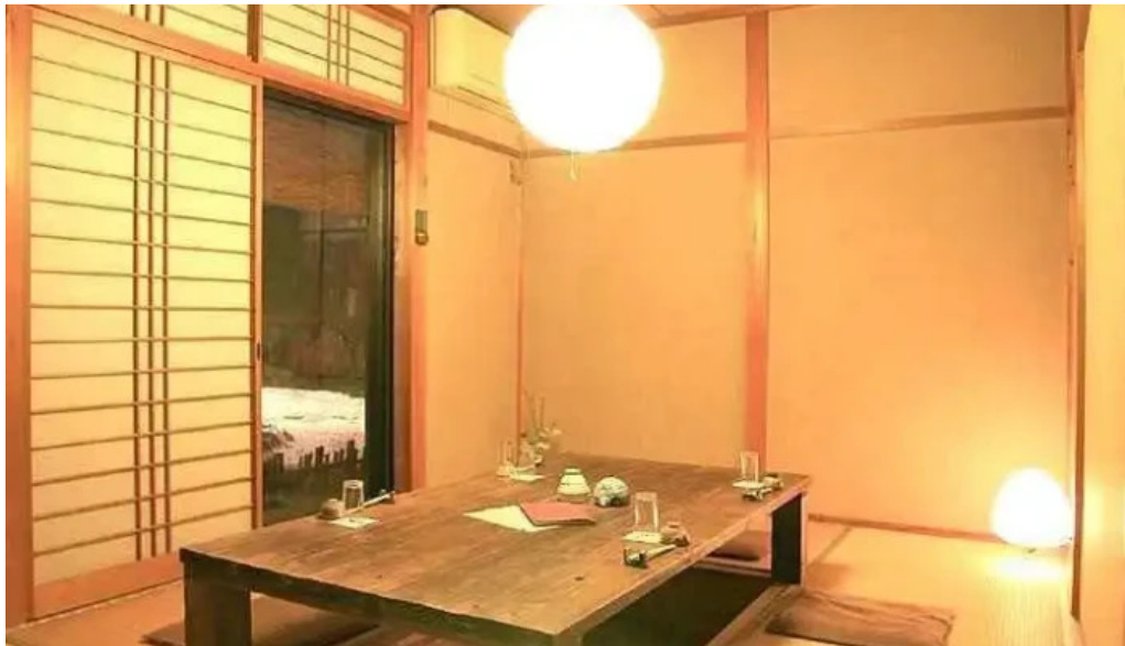
木波屋雑穀堂 オーナー提供