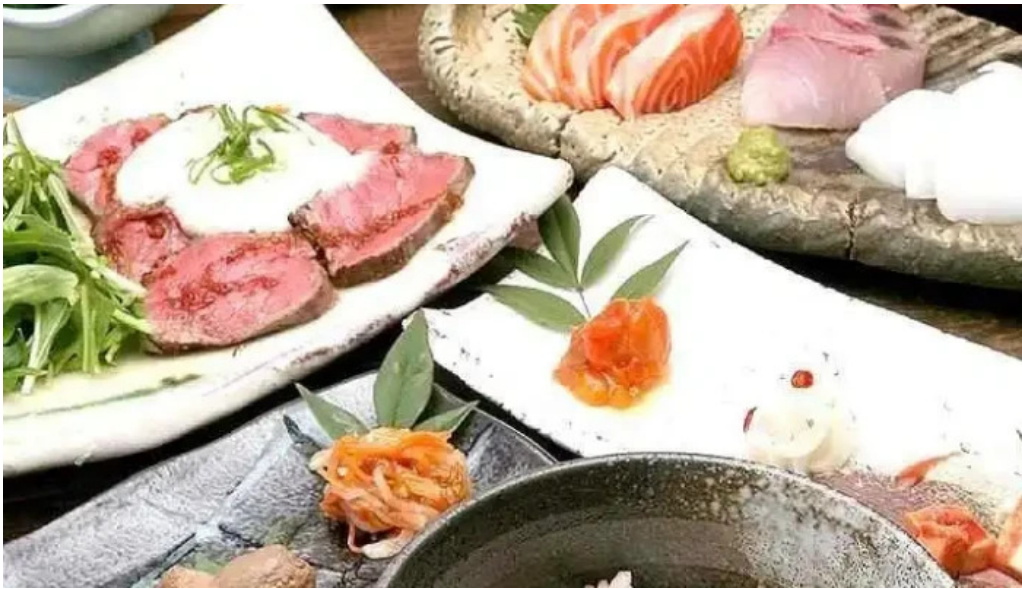
木波屋雑穀堂 料理飲み物