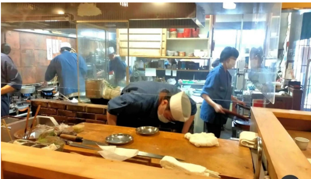
旬味 泰平 雰囲気