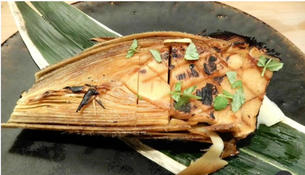
旬味 泰平 料理飲み物