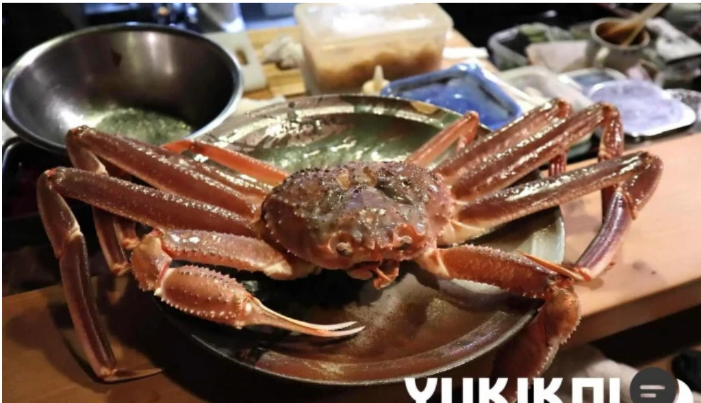
旬味 泰平 シーフード