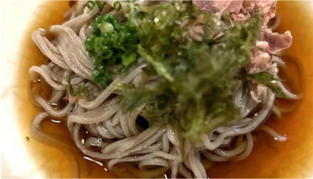
旬味 泰平 蕎麦