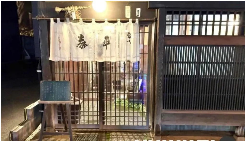
旬味 泰平 福井市