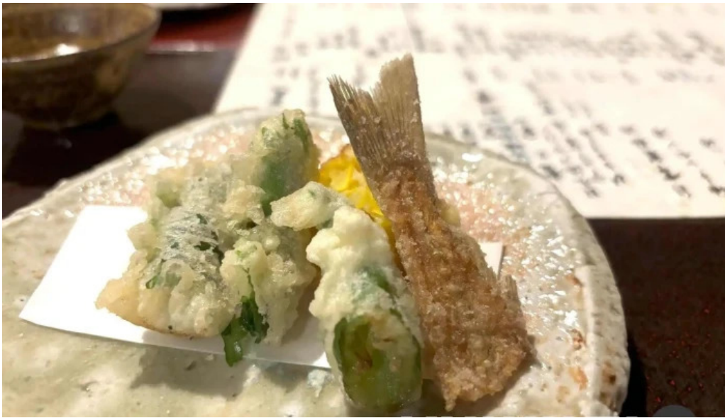
旬味 泰平 天ぷら