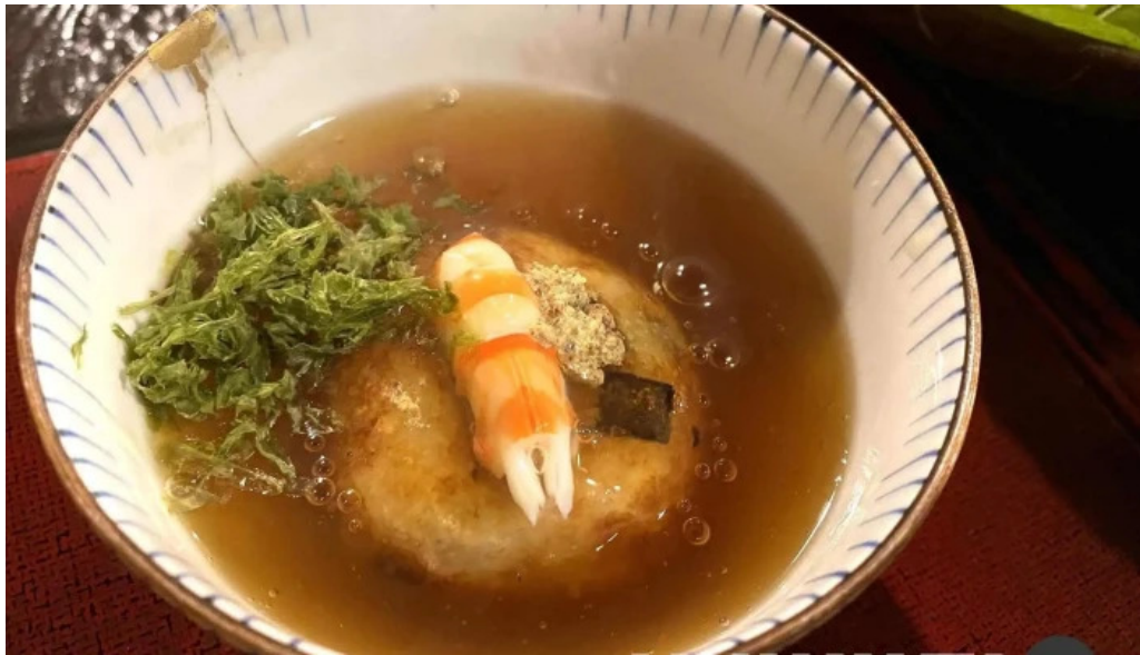
旬味 泰平 スープ

定食 一三〇〇 姓定食 一七〇〇 定食 一五〇〇 根万頭。胡麻。豆腐。菜。油。豚 鉢。二〇〇。御飯。味噌汁。香の物 定食 一三〇〇 各定食。良。下。日。付。身。付。き。ま。す 川。定。食。 一三〇〇 各定食。良。下。付。身。一。品。料。理。付。き 一。品。付。き。ま。す。お。ん。げ。ん。セ。ッ。ト。二。品 鉢。二。品。御。飯。味。噌。汁。香。の。物。付。き 定食 一三〇〇 惣。菜。を。お。り。合。せ。御。飯。味 八。八。〇 定食 一三〇〇 六。八。〇 孝。の。彩。二。段。重。で。お 六。八。〇 三。八。〇 旬味 泰平 × ニュー