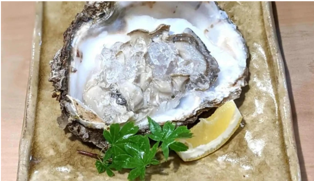
旬味 泰平 力十