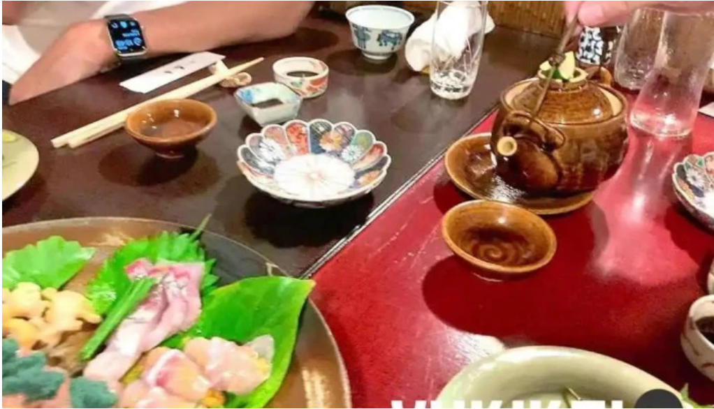
旬味 泰平 動画