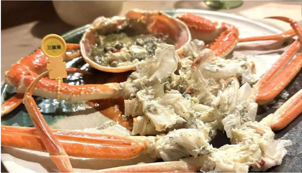
旬味 泰平 力二