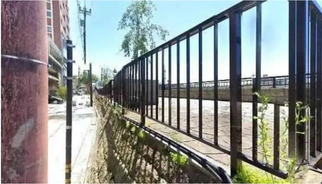
旬味 泰平 ストリートビューと 360 ビュー