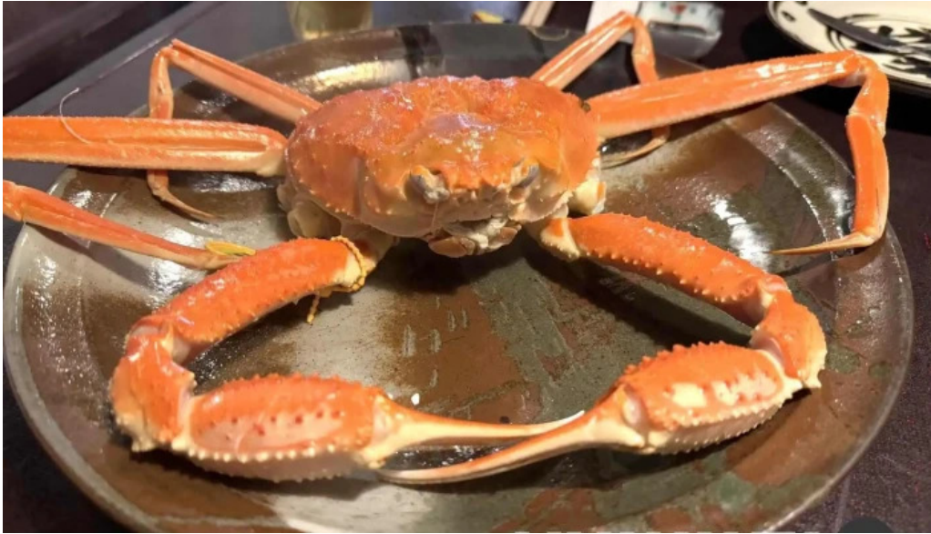
旬味 泰平 最新