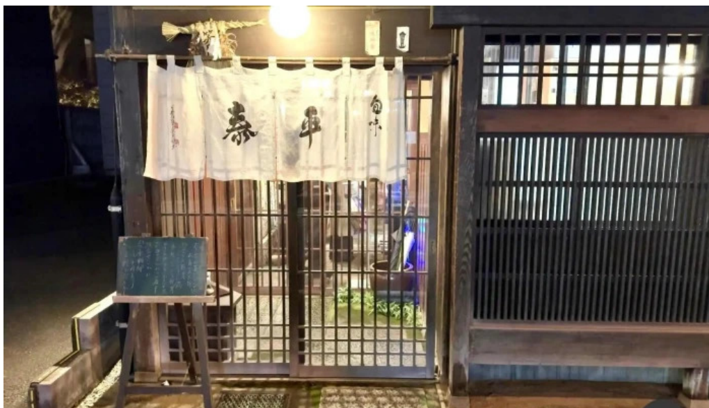
旬味 泰平 すべて