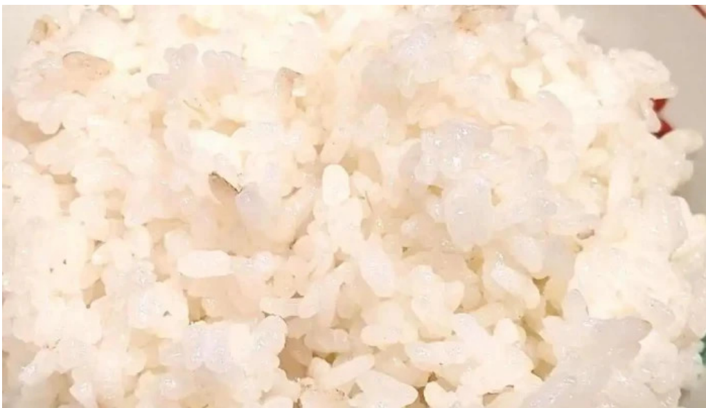
旬味 泰平 飯