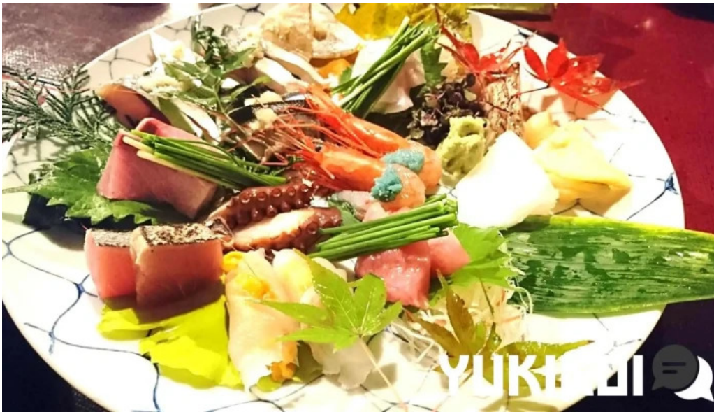
旬味 泰平 刺身