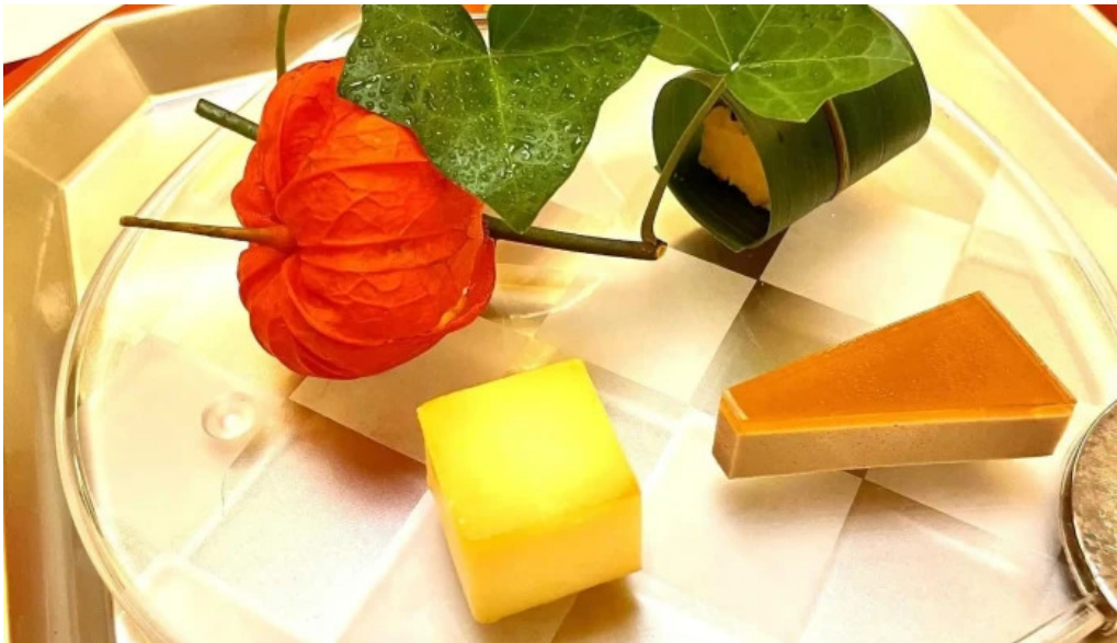
日本料理渡風亭 住所