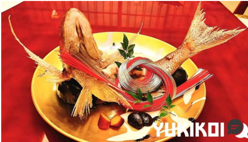
日本料理渡風亭 料理飲み物