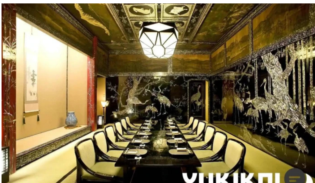
日本料理「渡風亭」 目黒区