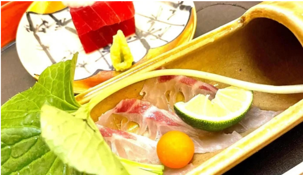
日本料理渡風亭 料金