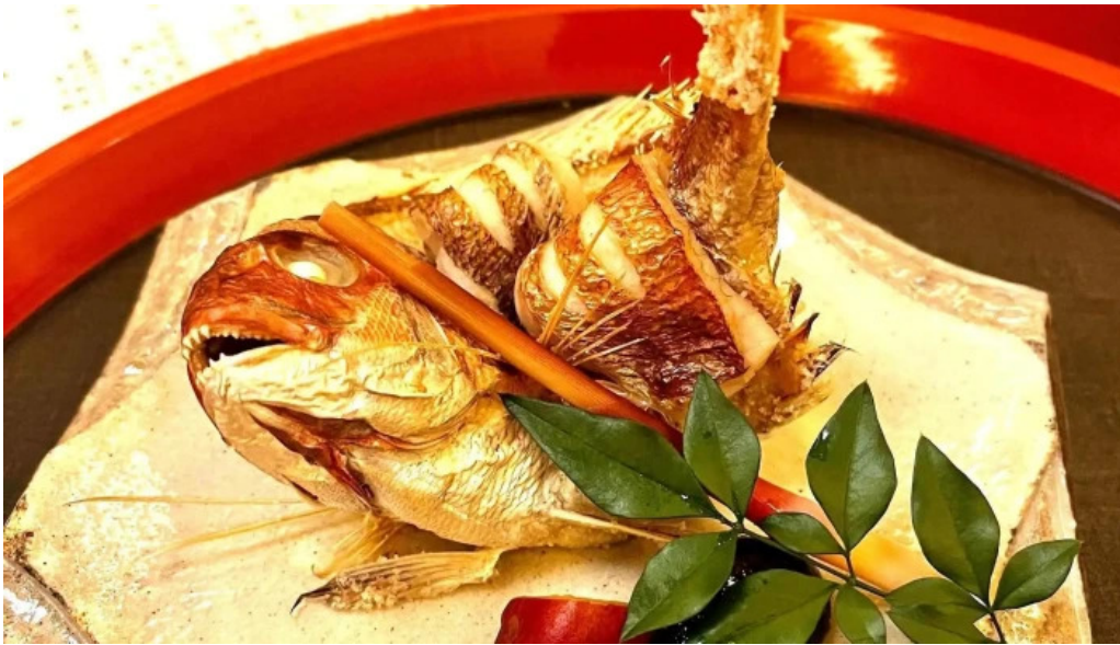
日本料理渡風亭 口コシ