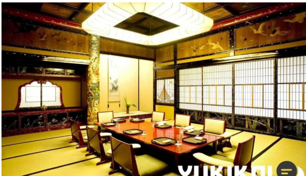
日本料理渡風亭 オーナー提供