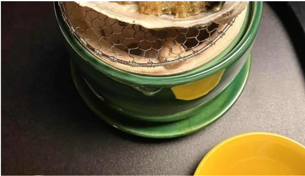
日本料理渡風亭 天ぷら