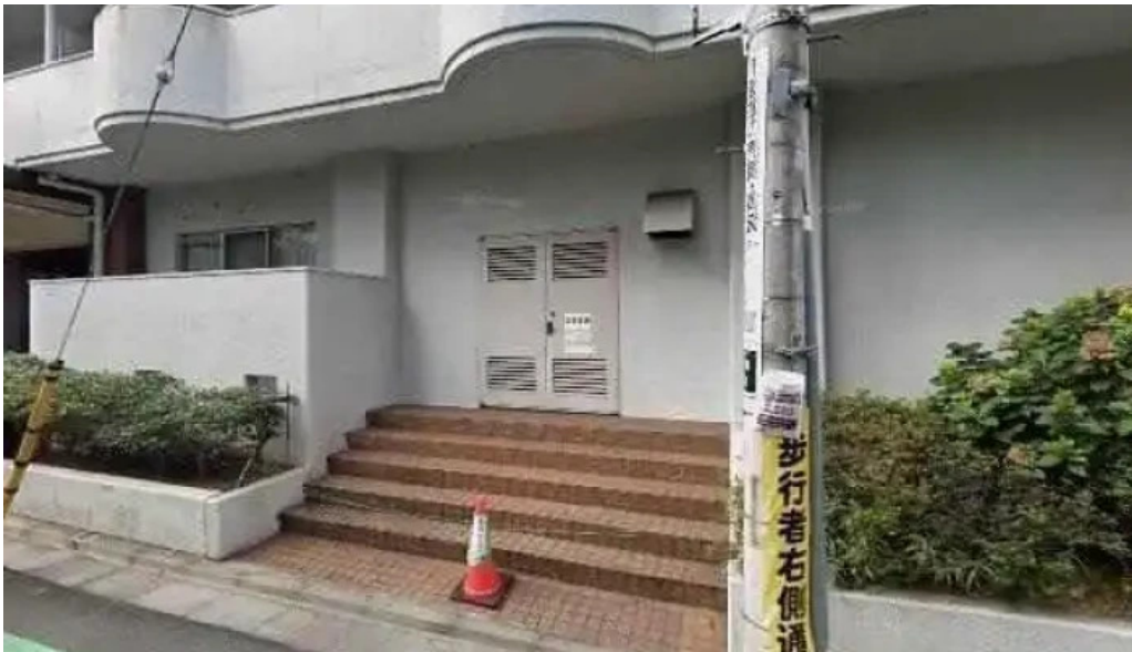
日本料理渡風亭 目黒区