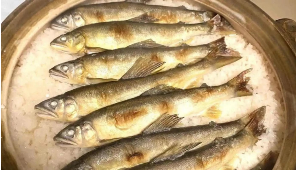
日本料理渡風亭 最新