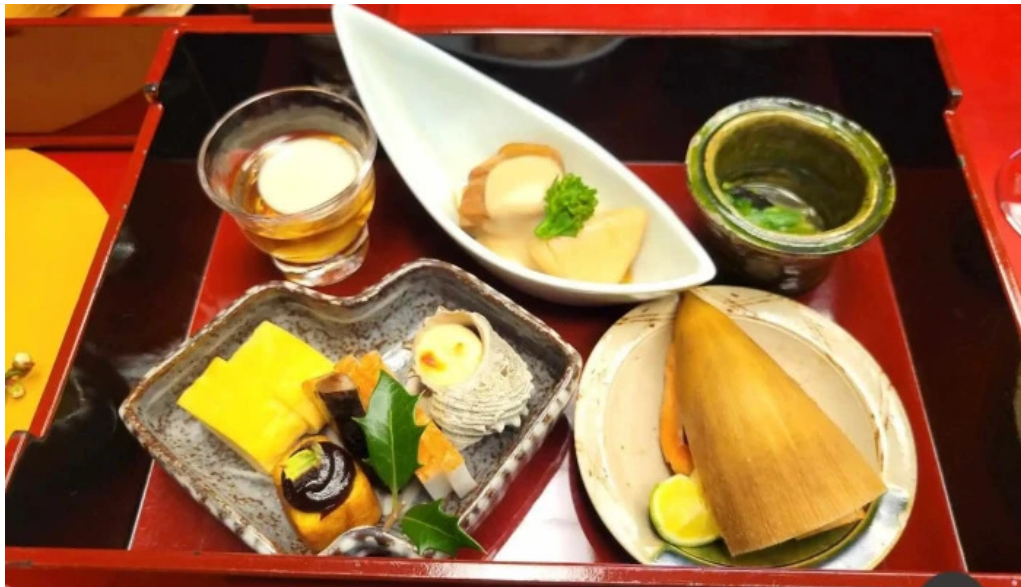
日本料理渡風亭 懐石