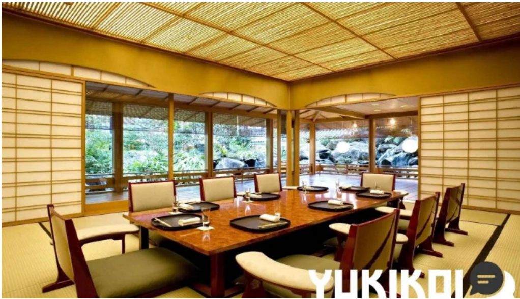
日本料理渡風亭 霧田気