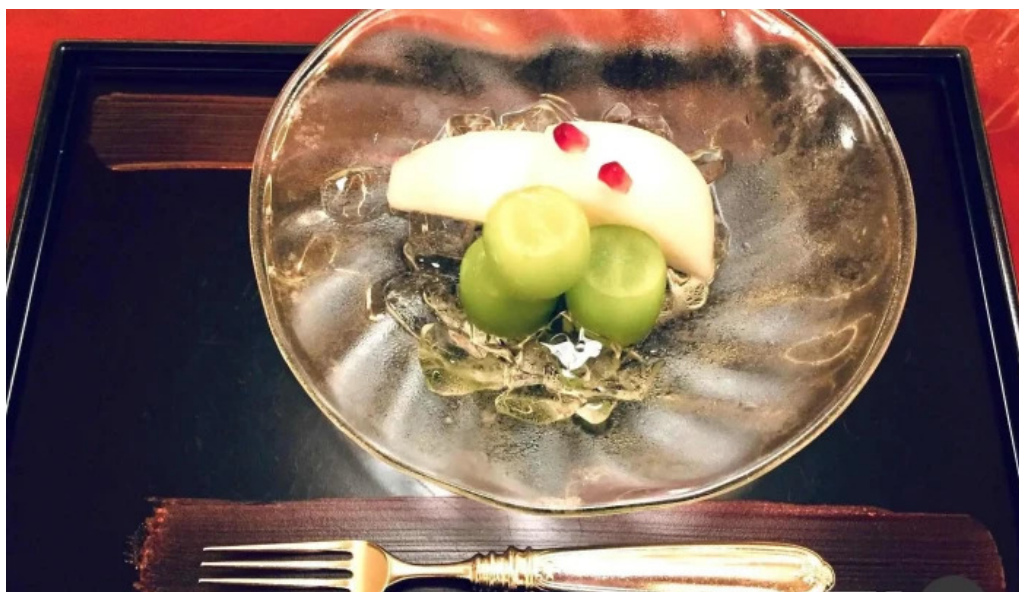
日本料理渡風亭 餅