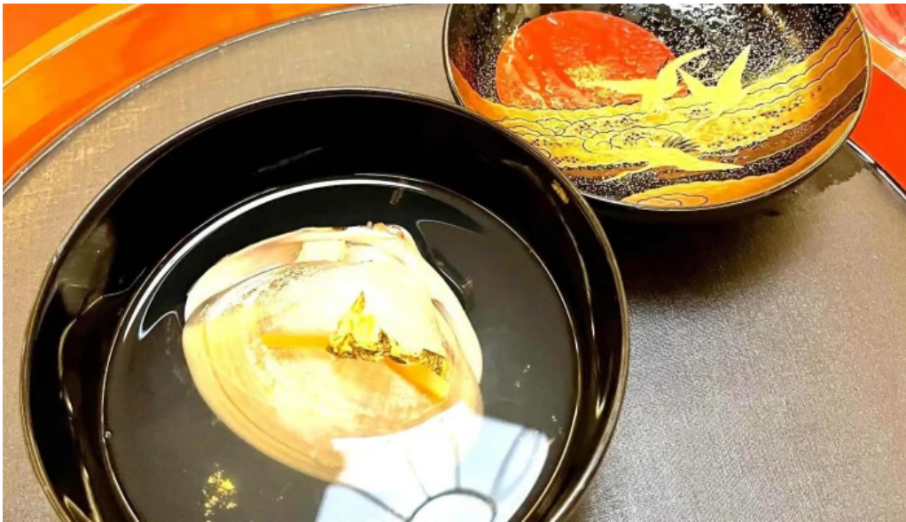
日本料理渡風亭 動画