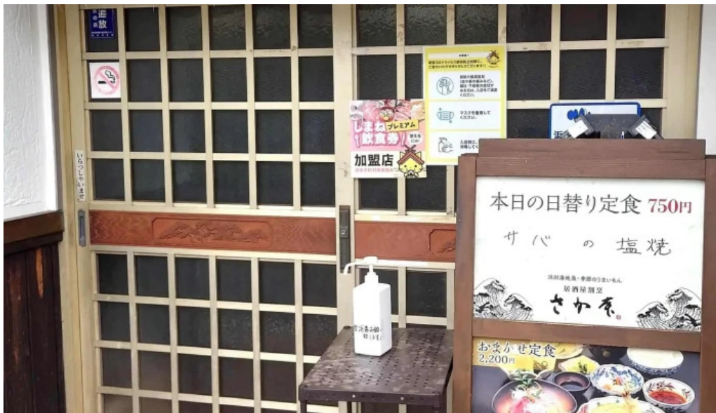
さか本 comentario 1