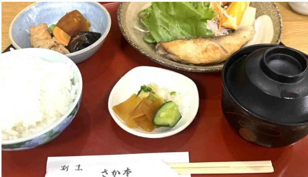
さか本 comentario 5