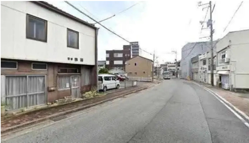
さか本 ストリートビューと 360 ビュー