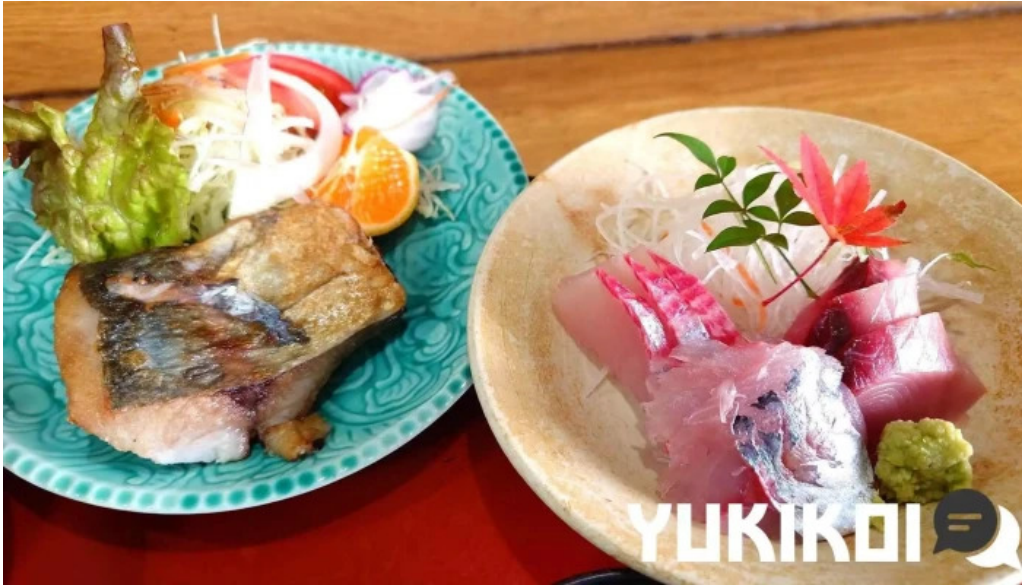
さか本 料理飲み物