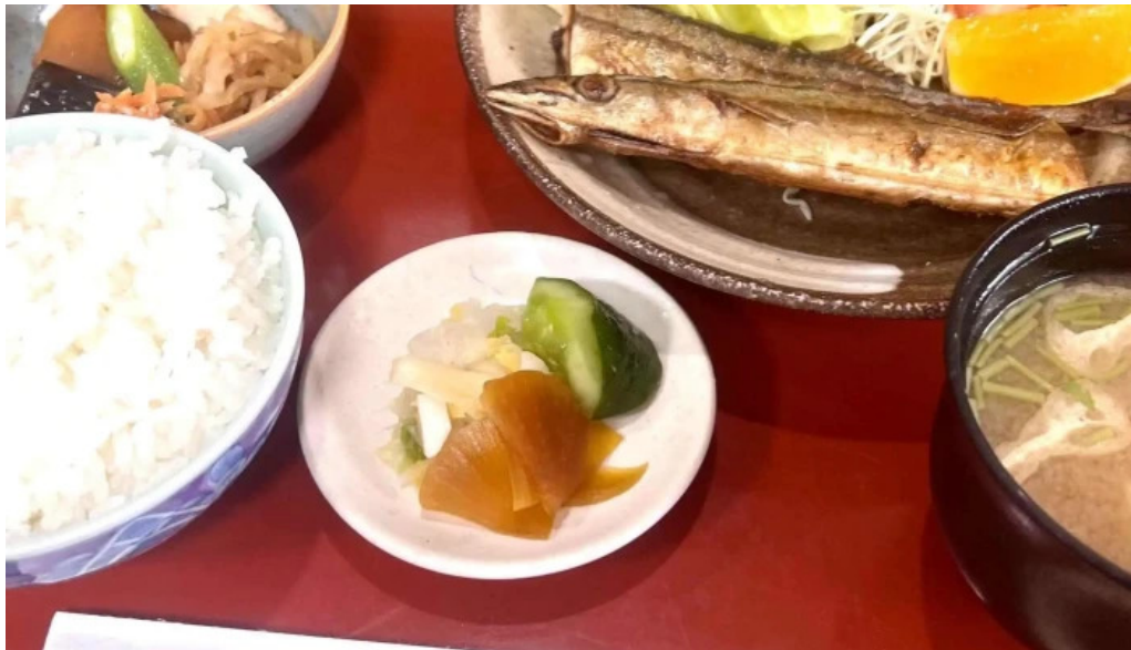
さか本 comentario 7