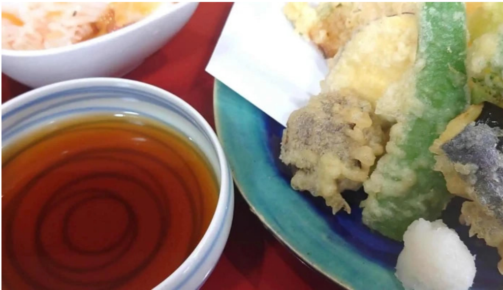
さか本 comentario 3