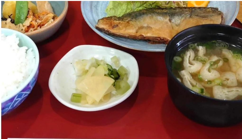
さか本 comentario 2