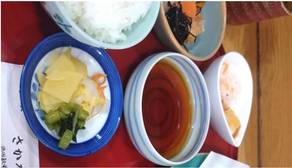
さか本 comentario 4