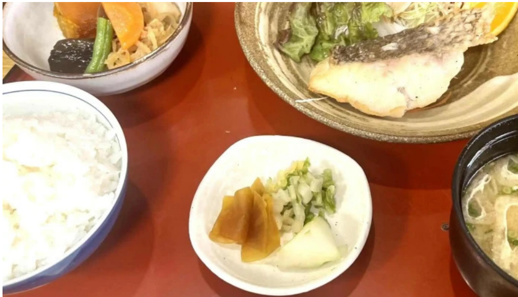
さか本 comentario 6