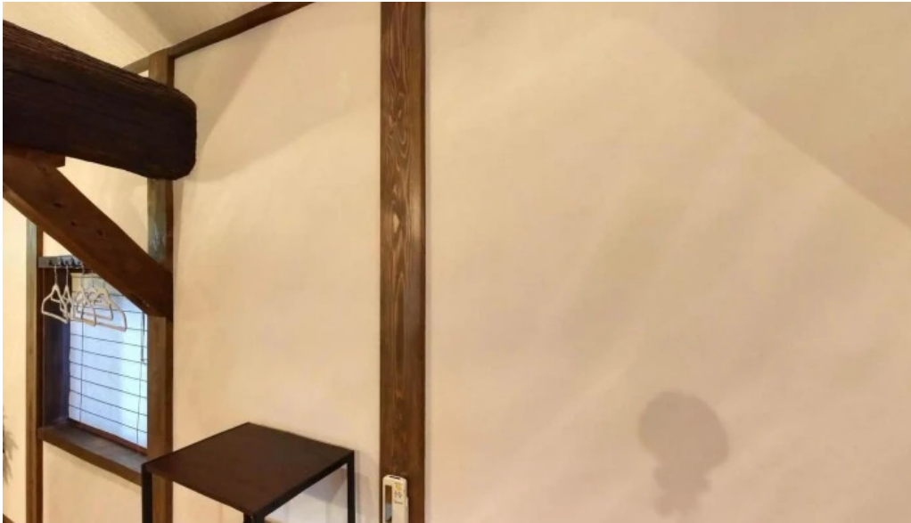
四季彩菜 きふう 檀原市