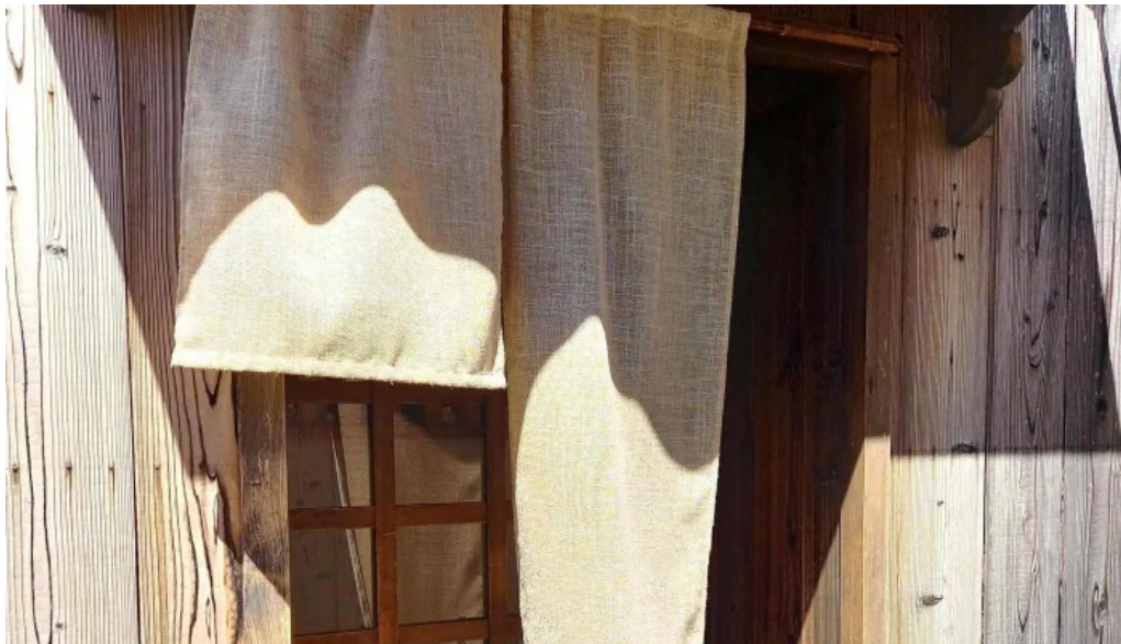
四季彩菜 きふう どこ