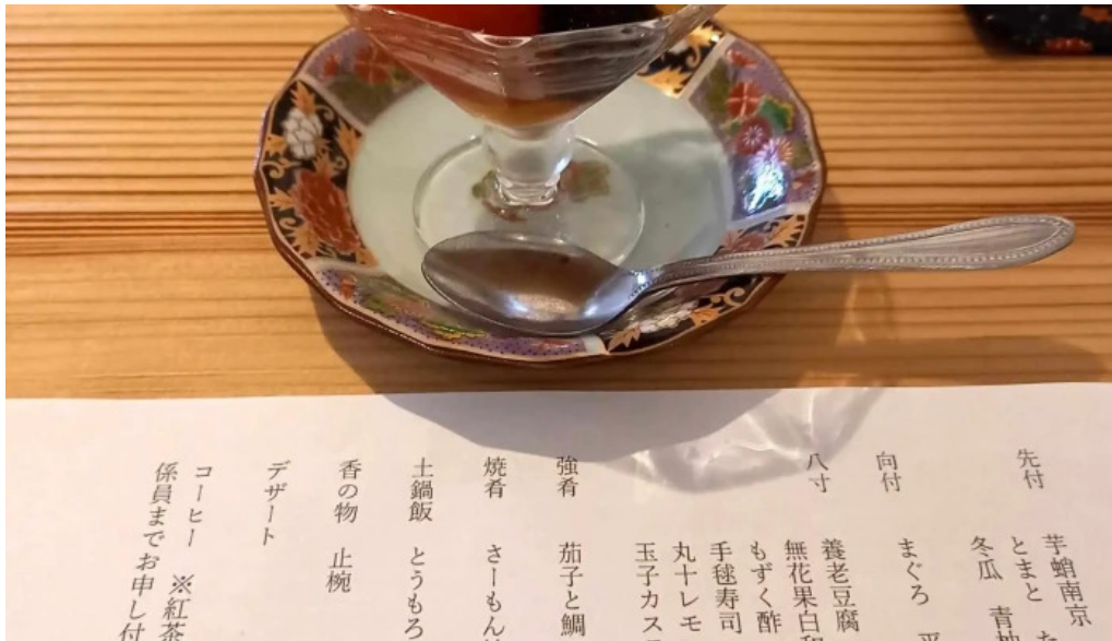
四季彩菜 きふう 写真