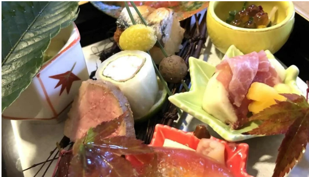
四季彩菜 きふう 懐石