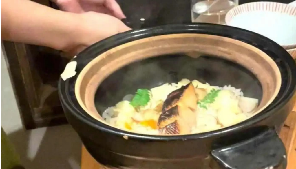
四季彩菜 きふう 動画