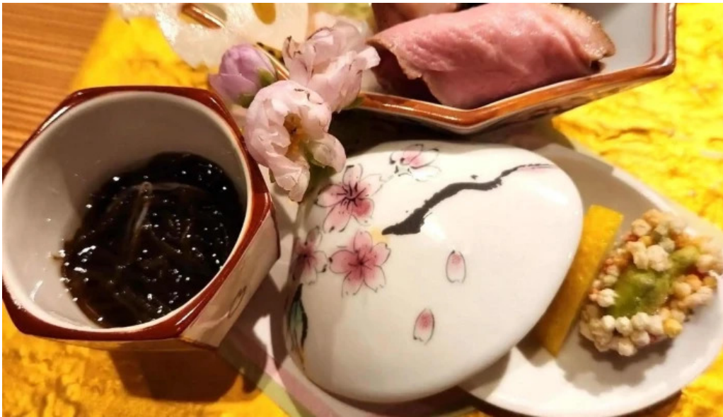
四季彩菜 きふう スコア