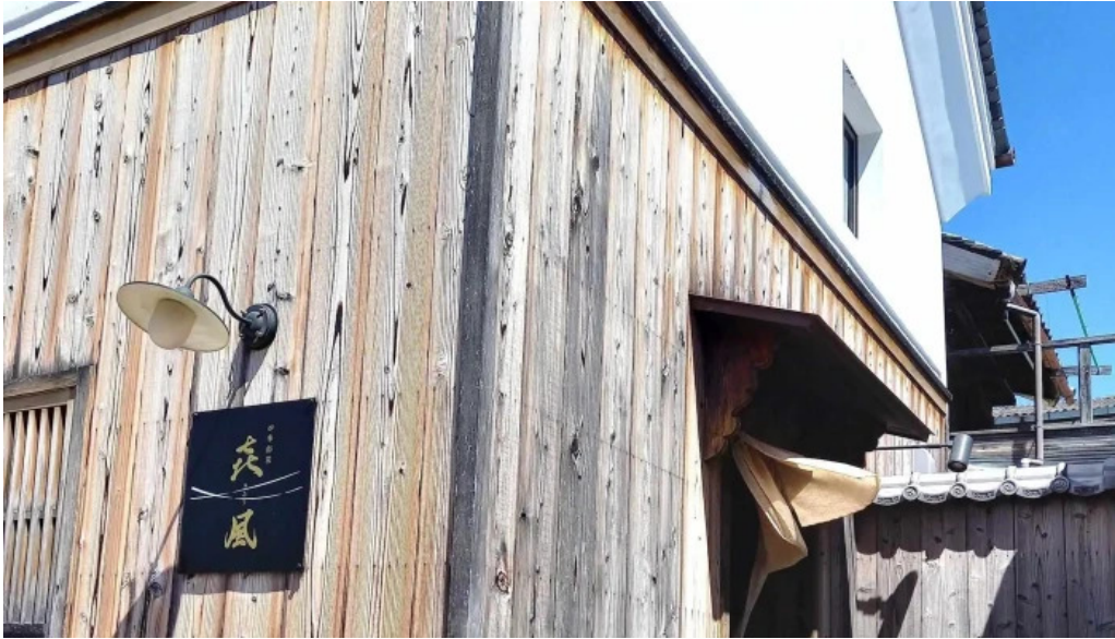
四季彩菜 きふう 近く