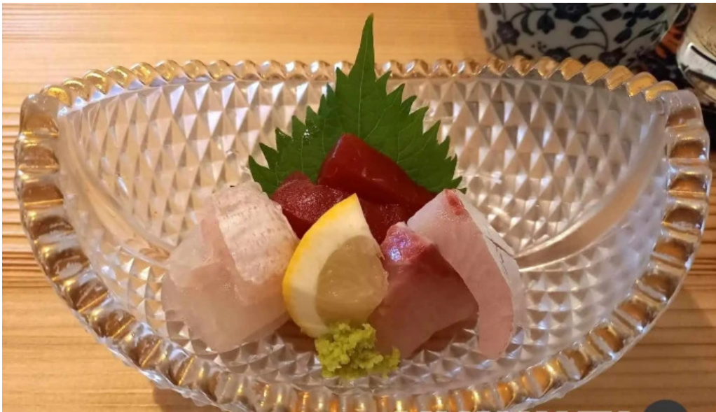
四季彩菜 きふう 刺身