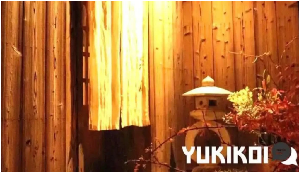
四季彩菜 きふう オーナー提供