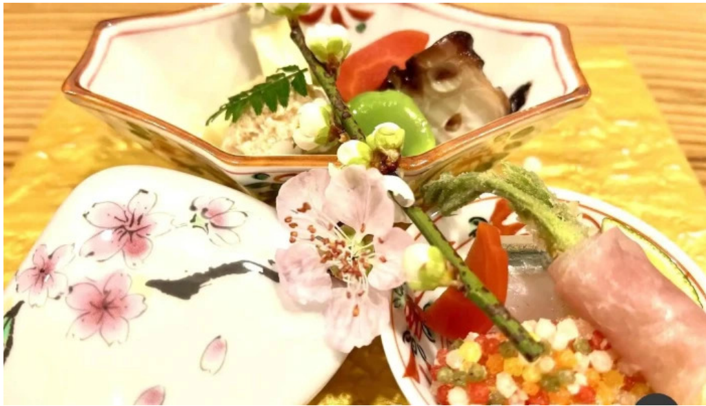
四季彩菜 きふう 料理飲み物