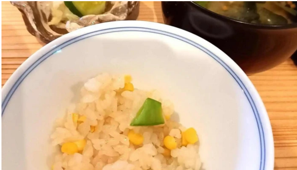
四季彩菜 きふう 味噌汁