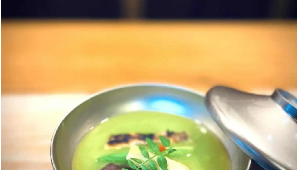
四季彩菜 きふう スープ