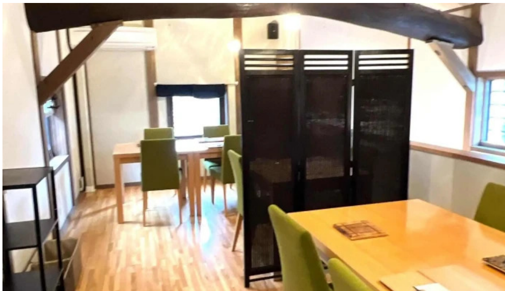
四季彩菜 きふう 雰囲気